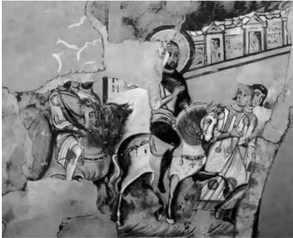
Триумфальный въезд Константина в Рим.

Фреска в церкви Святого Деметриуса, Фессалоники, 17 в.