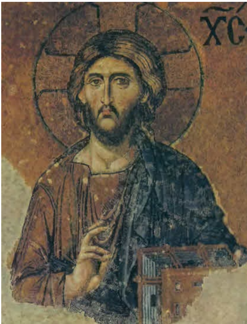
Христос. Мозаика в храме Святой Софии. XII в.