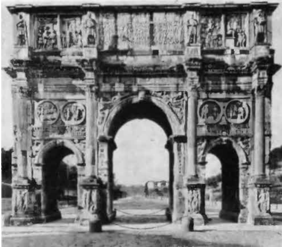
Триумфальная арка Константина Великого в Риме.