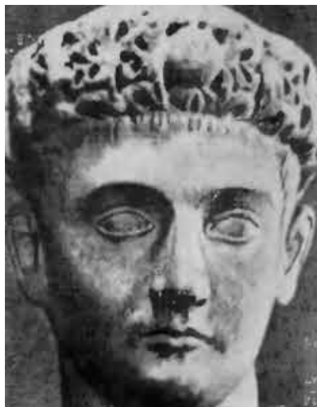
Константин II, второй сын императора Константина.