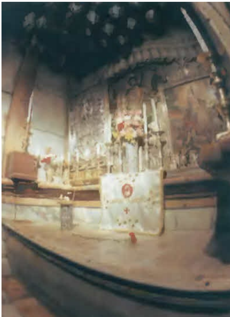
Гроб Господень.