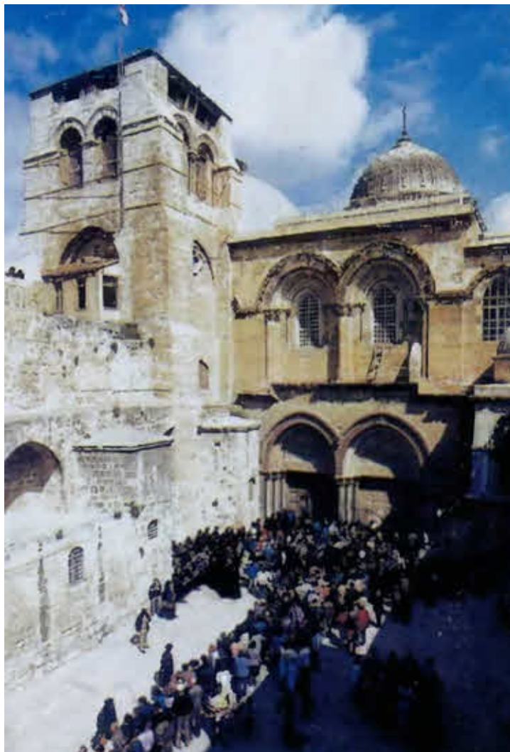
Иерусалим. Храм Гроба Господень.