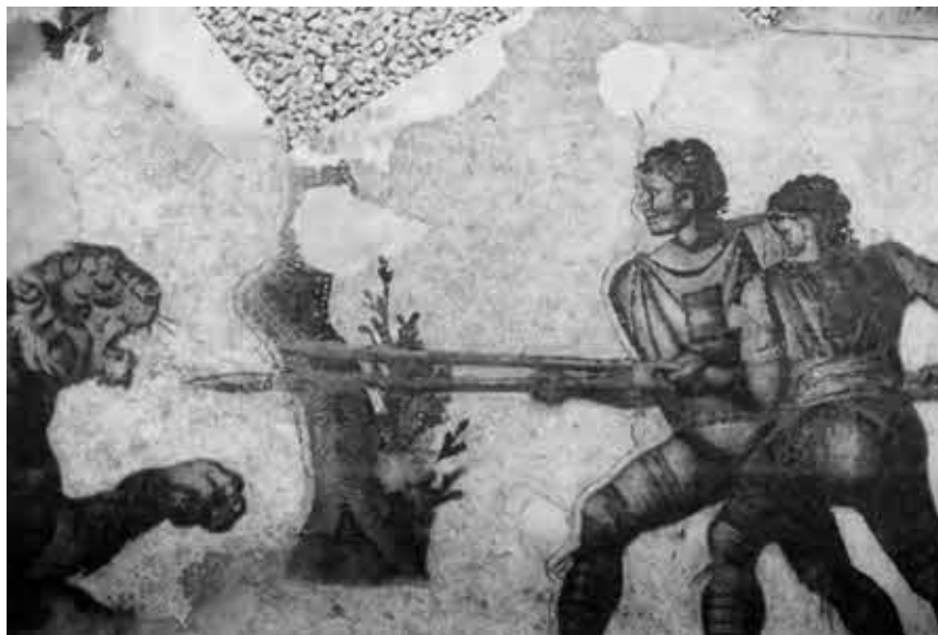
Охота на тигра. Мозаика Большого дворца в Константинополе.