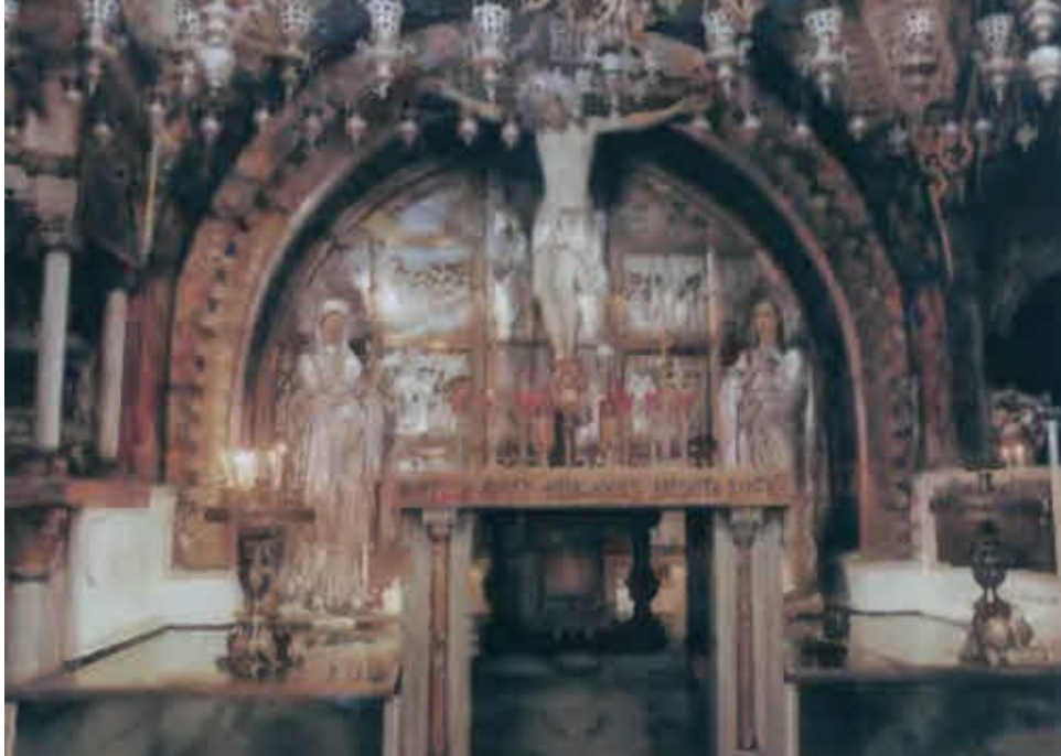
Голгофа в храме Гроба Господня.