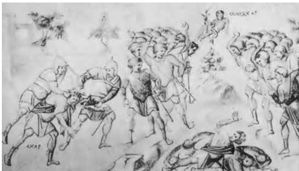
Побиеие камнями еретиков-христиан. Миниатюра X в. Библиотека Ватикана.