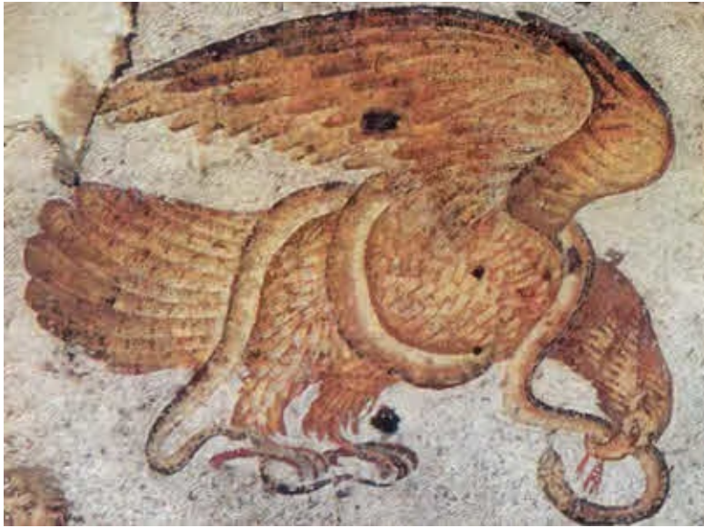
Орел и змея. Мозаика Большого дворца в Константинополе. Вторая половина VI в.