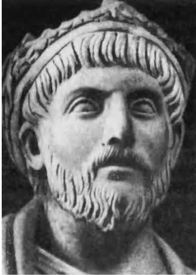
Юлиан Отступник, последний законный наследник императора Константина Великого.