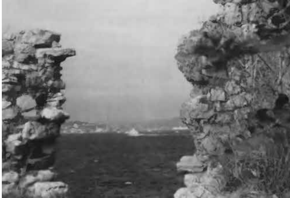
Константинополь. Руины городских стен построенных при Константине.