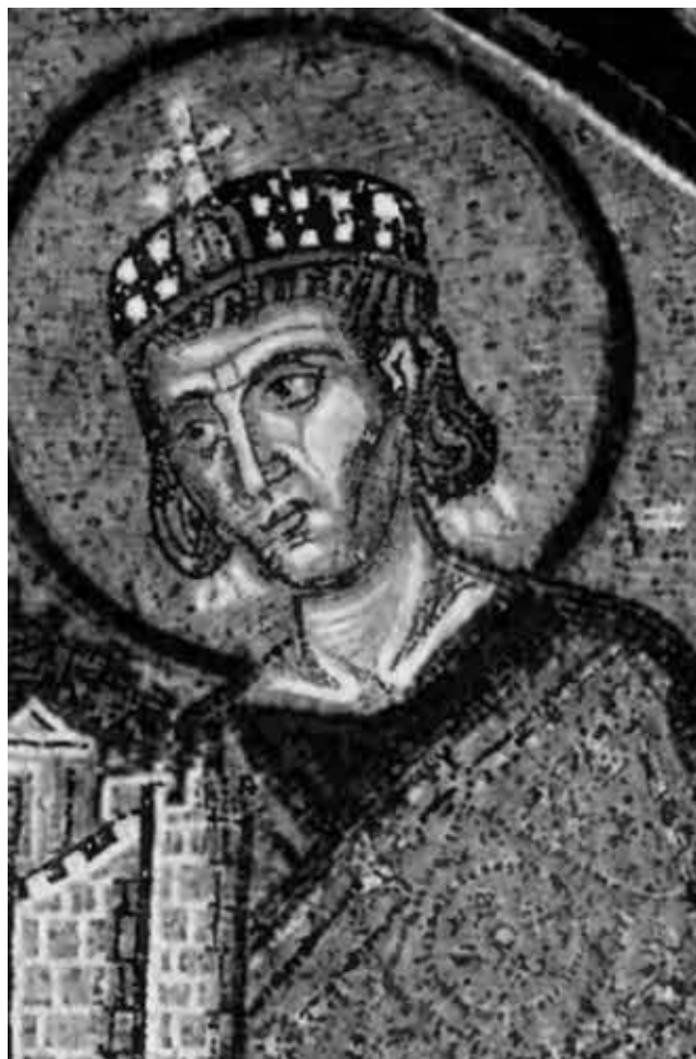
Святой Константин Великий.

Деталь мозаики в храме Святой Софии Константинополя.