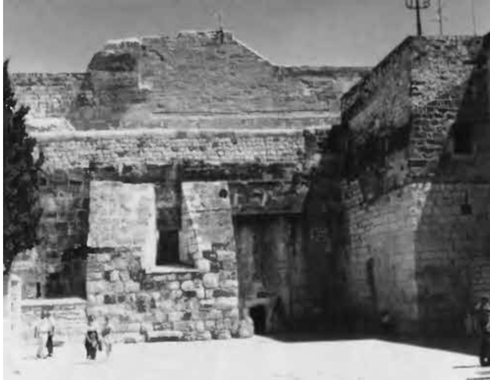
Храм Рождества в Вифлееме.