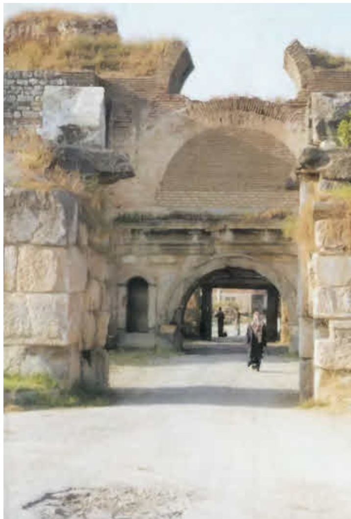
Никея. Северные ворота города в котором Константин в 325 году провел I Первый Вселенский собор (ныне турецкий город Изник)