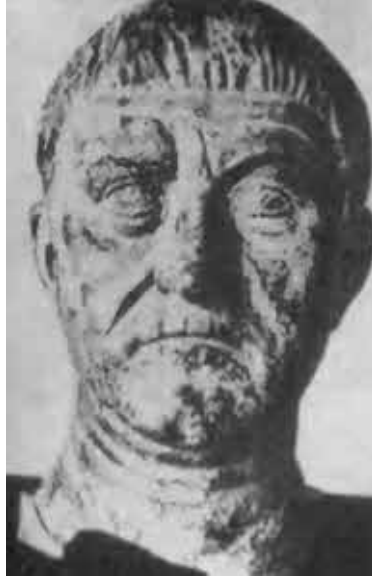
Максимиан. Бронза, Каир, частное собрание.