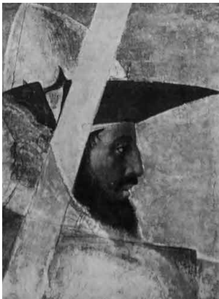
Константин. Деталь фрески Пьеро делла Франчески в соборе Святого Франциска (Ареццо, Италия). 1455 г.