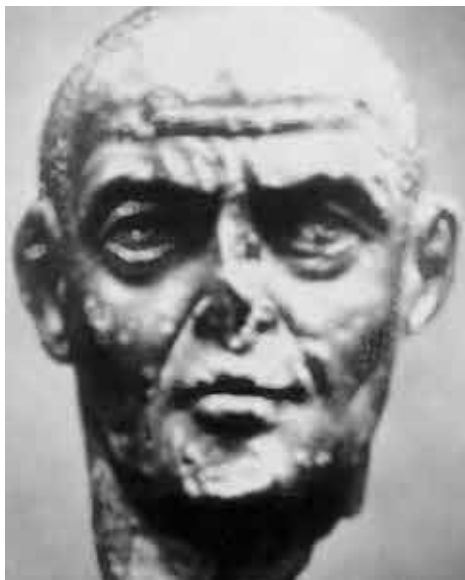
Диоклетиан. Мрамор. Рим, Латеранский музей.