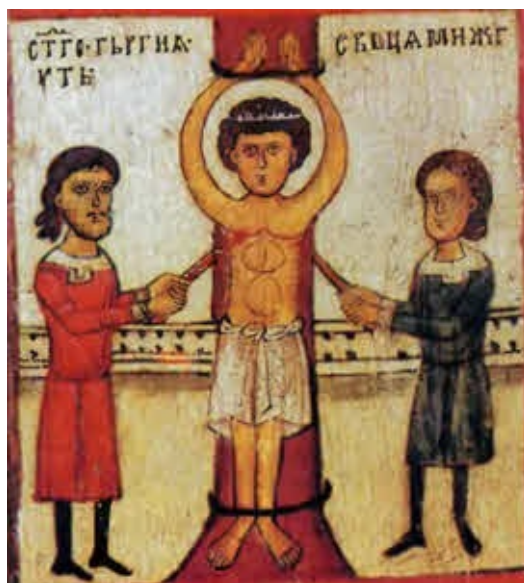
Мученичество святого Георгия. Деталь русской иконы. XIV в.