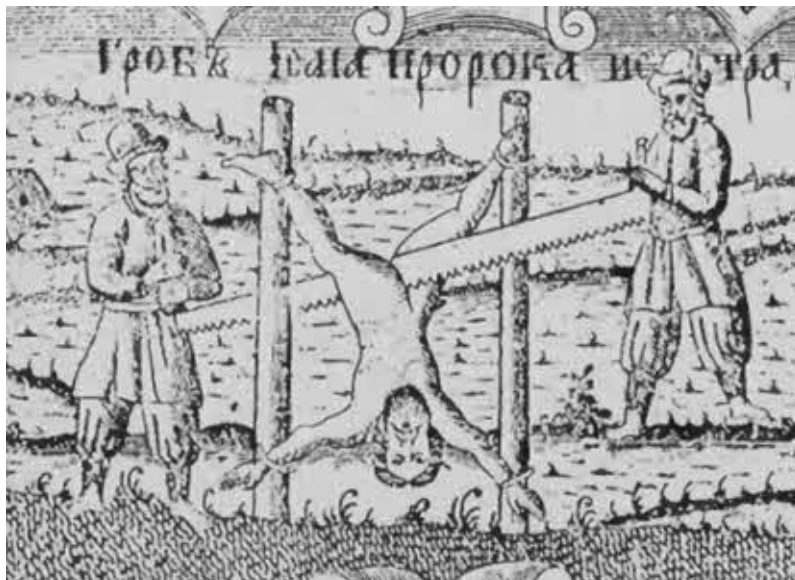
Страдания пророка Исайи. Рисунок из книги «Описание святого града Иерусалима» 1771 г.