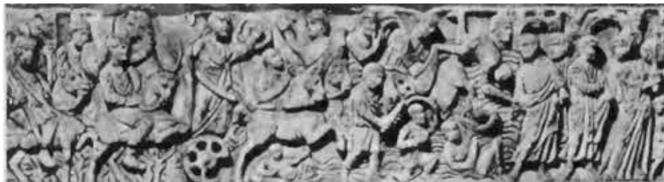
Переход императора Константина через Красное море.