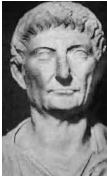
Галерий. Мрамор, конец III в. Копенгаген, глиптотека. Новый Карлсберг.