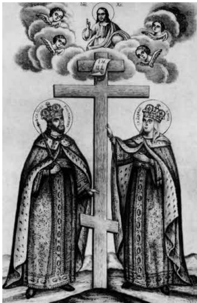
Равноапостольные святые царь Константин и мать его Елена.