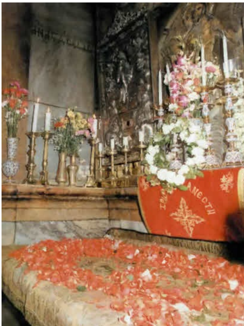
Гроб Господень с плащаницей, убранный цветами в день Пасхи.