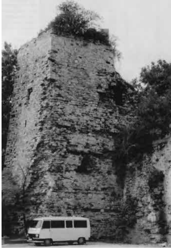
Башня городской стены Константинополя, построенная при Константине.