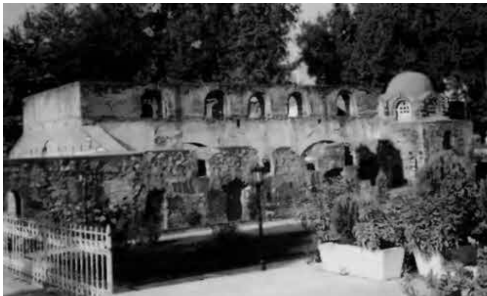
Никея. Руины храма, где прошел Второй Никейский собор.