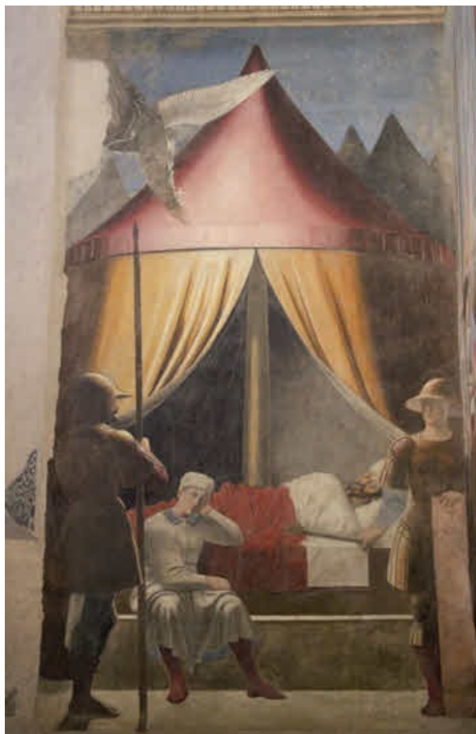
Сон Константина. Фреска Пьеро делла Франчески в соборе Святого Франциска (Арецо, Италия). 1455 г. В эту ночь перед битвой с Максенцием Константину был явлен знак - монограмма Христа — со словами: «Сим победишь»