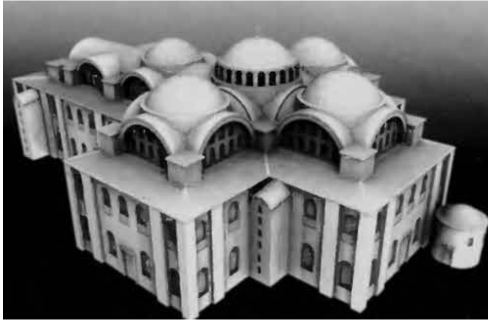
Храм Двенадцати Апостолов в Константинополе, в котором был похоронен Константин.