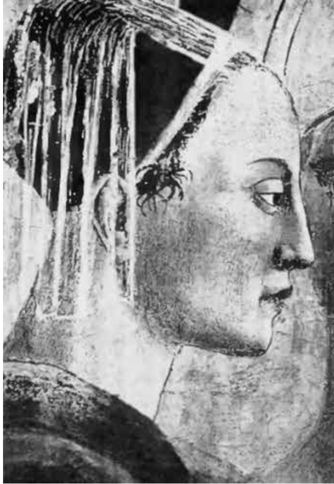
Мать Константина, святая Елена.