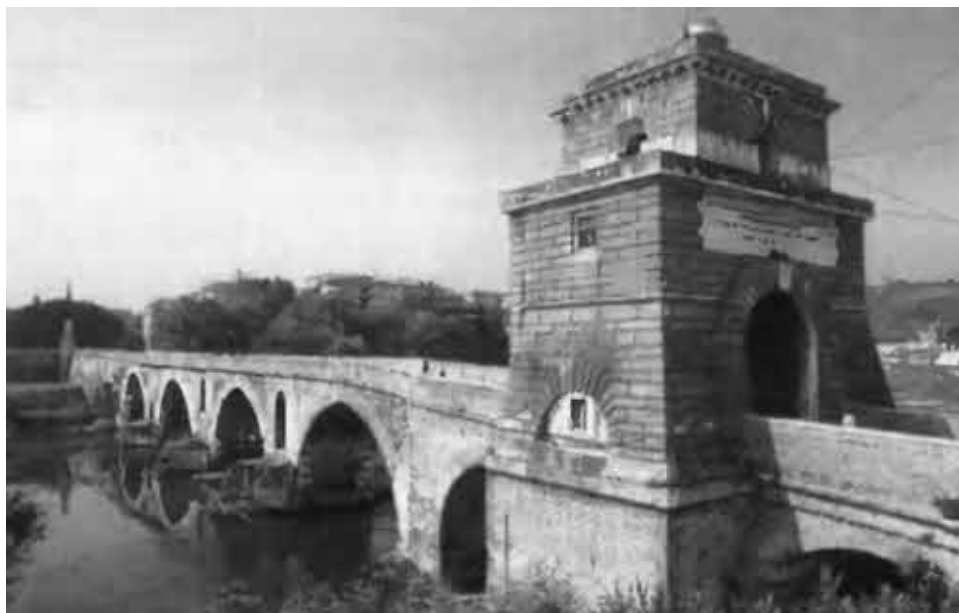
Мильвийскнй мост на Тибре. Здесь проходила историческая битва Константина и Максенция в 312 г.