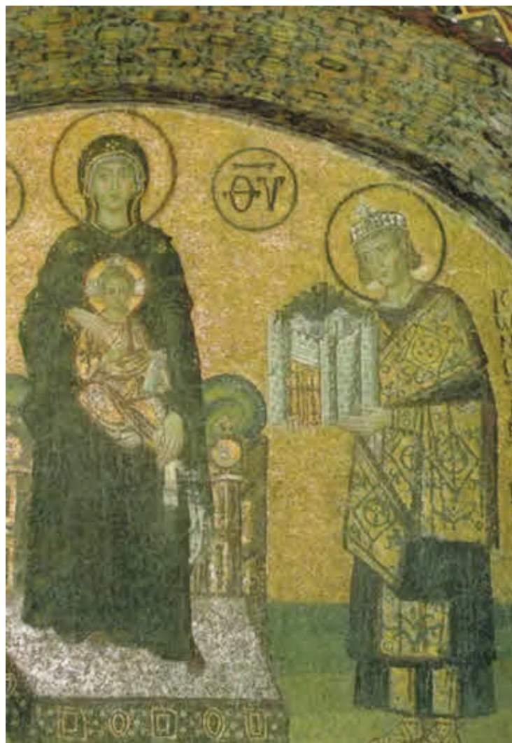
Богоматерь и Константин.

Фрагмент мозаики в храме Святой Софии. X в.