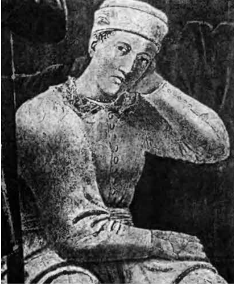
Евсевий Кесарийский, епископ, историк, первый биограф Константина. Фрагмент фрески Пьеро делла Франчески. 1455 г.