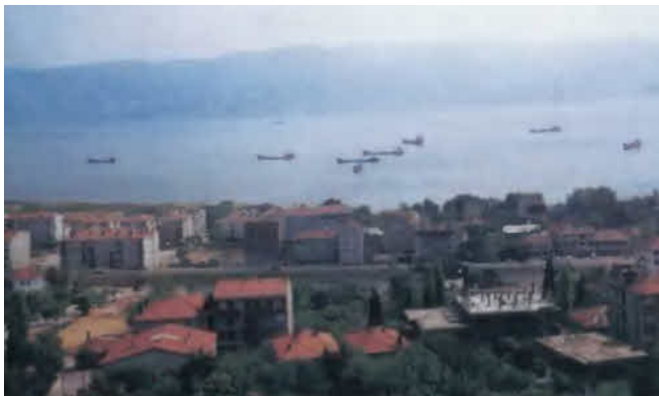
Никомидия - город, в котором умер Константин Великий