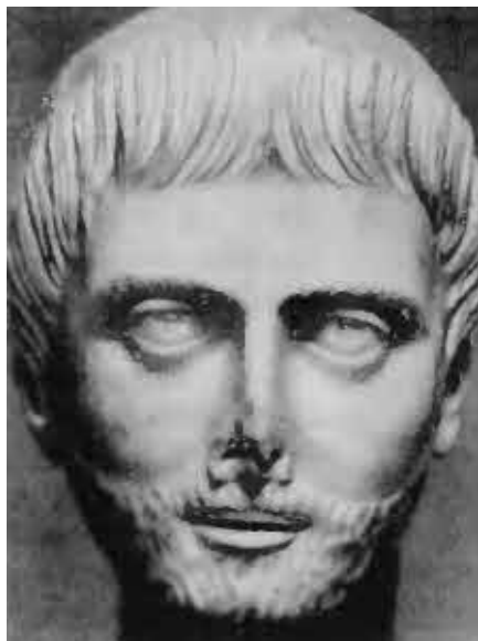
Крисп, старший сын императора Константина.