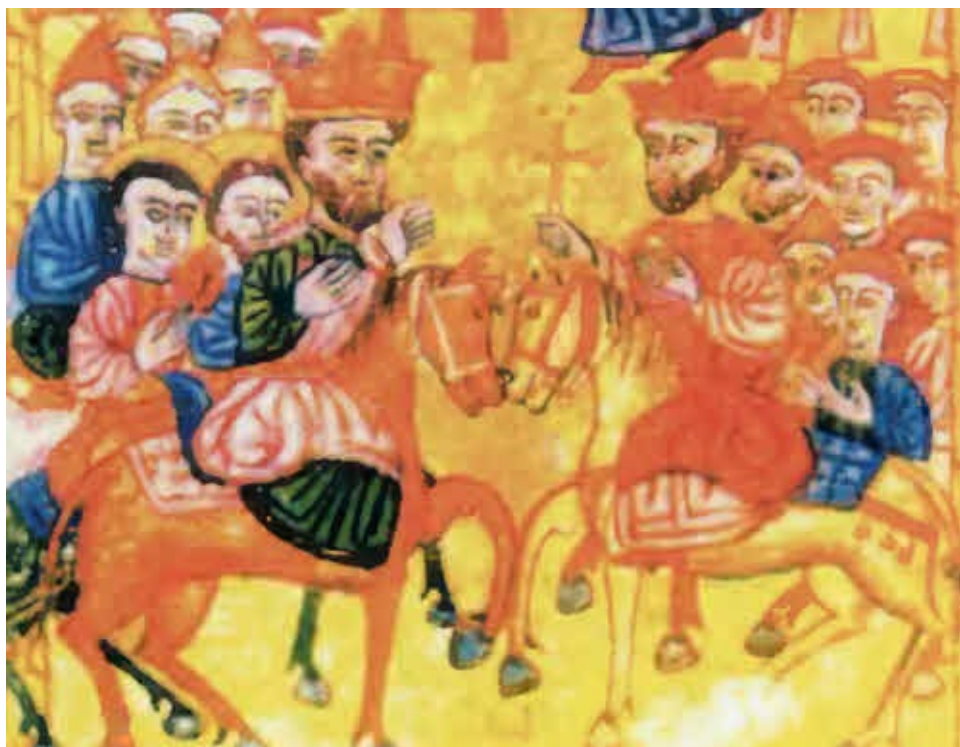
Константин (справа) и армянский царь Тардат. Матенадаран. Художник Вардан Багинеци