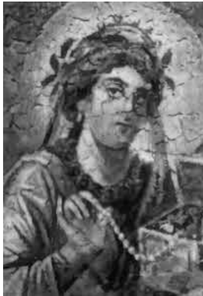
Фауста, вторая жена Константина. Мозаика, IV в.