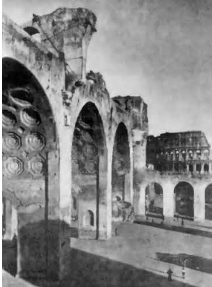
Рим. Руины базилики Максенция и Константина.