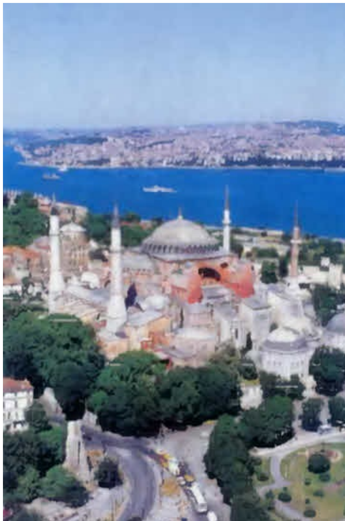
Святая София. Современный вид