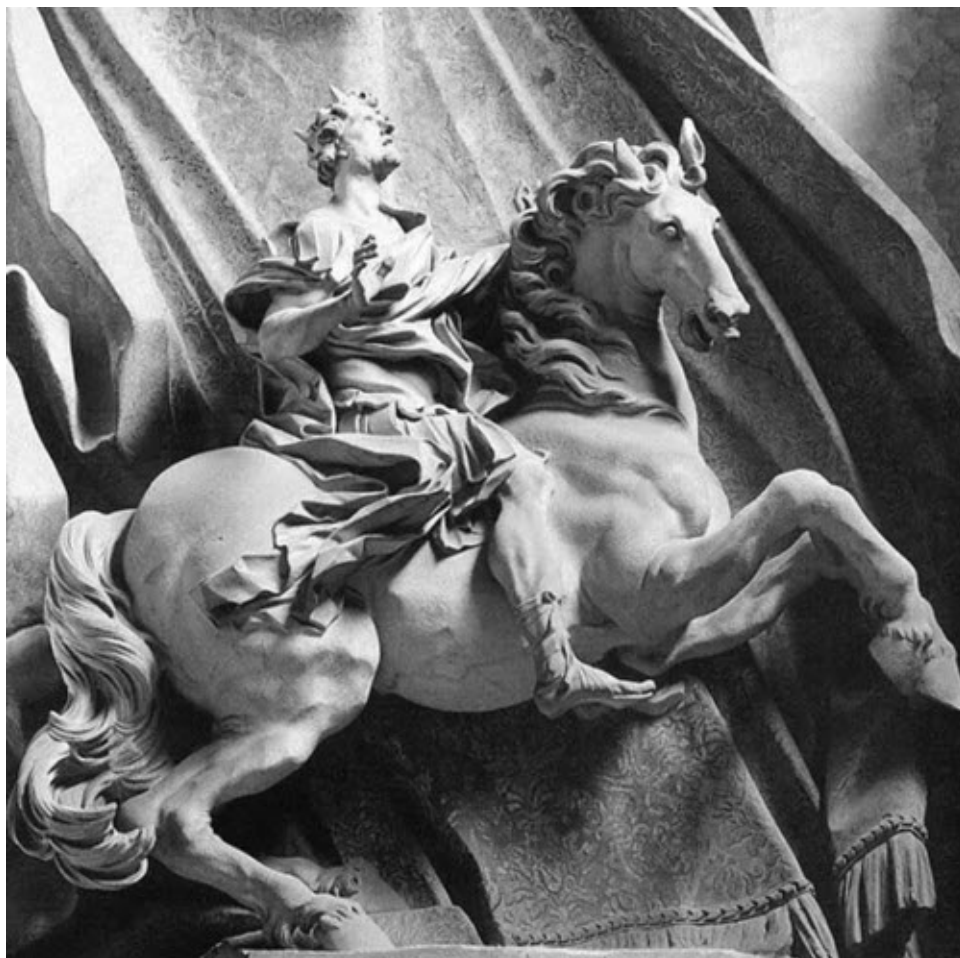
Конная статуя Константина в соборе Святого Петра в Риме.