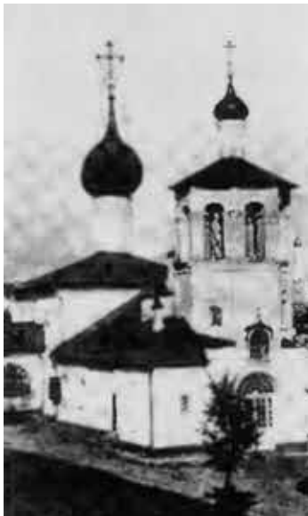
Церковь святых Константина и Елены в Московском Кремле. Архитектор Найденов. Фото