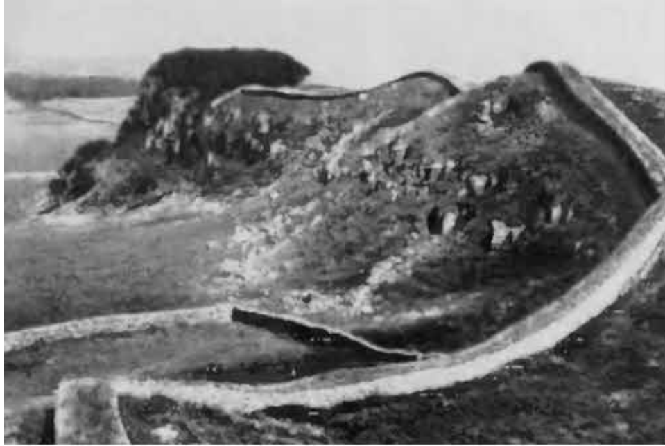
Британия. Вал Адриана. Место первой крупной битвы Константина в 306 г.