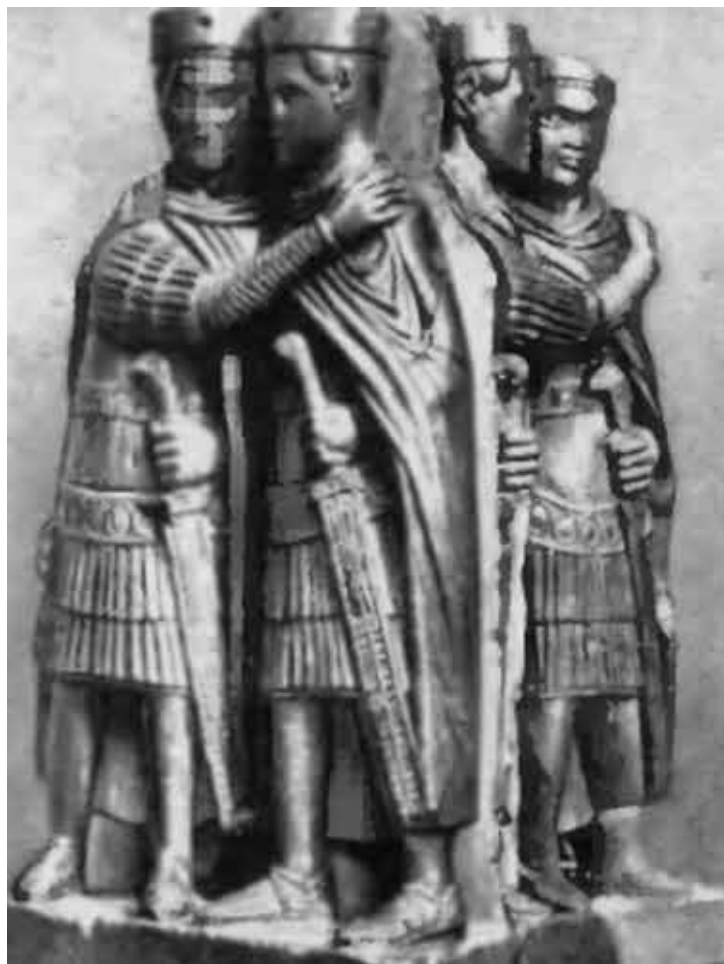
Тетрархия (власть четверых). Бронза, конец III в. Правители Римской империи: августи Диоклетиан и Максимиан, цезари Галерий и Констанций Хлор.