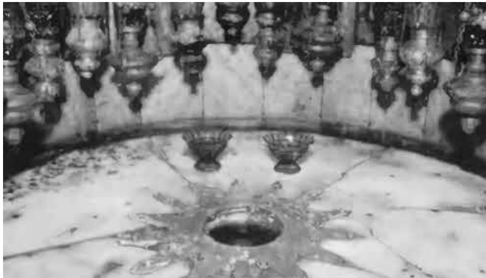
Серебряная звезда, обозначающая место рождения Христа под главным алтарем Храма Рождества.