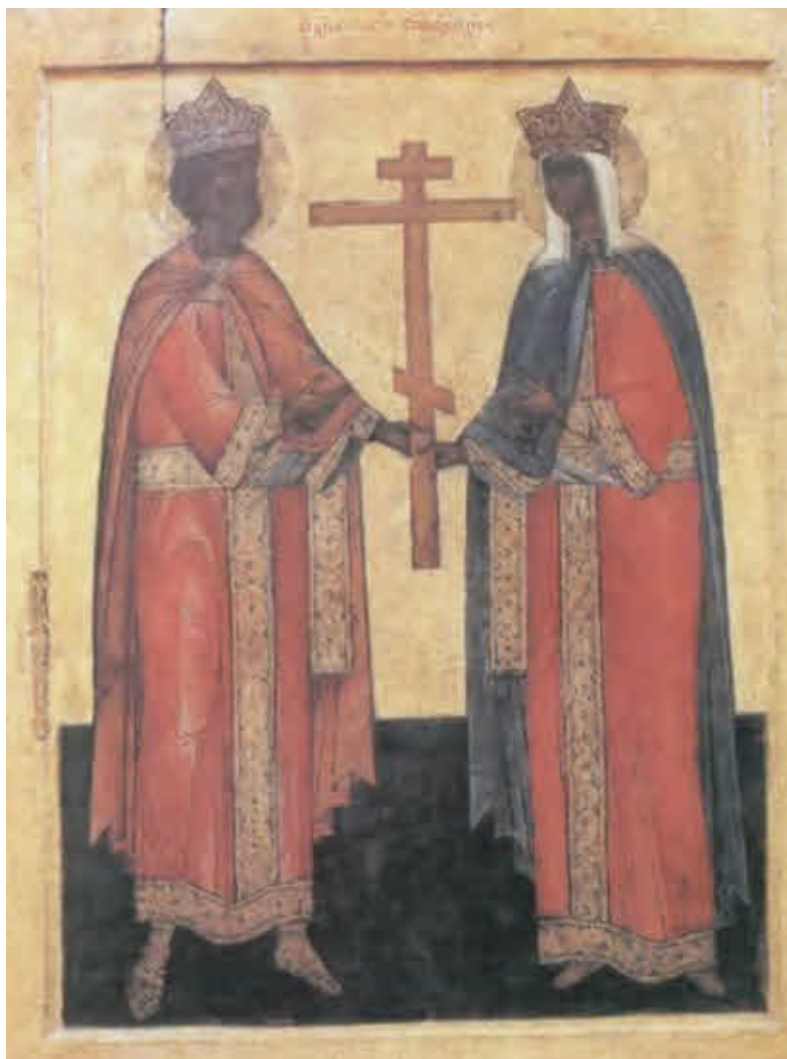
Равноапостольные святые царь Константин и мать его Елена.