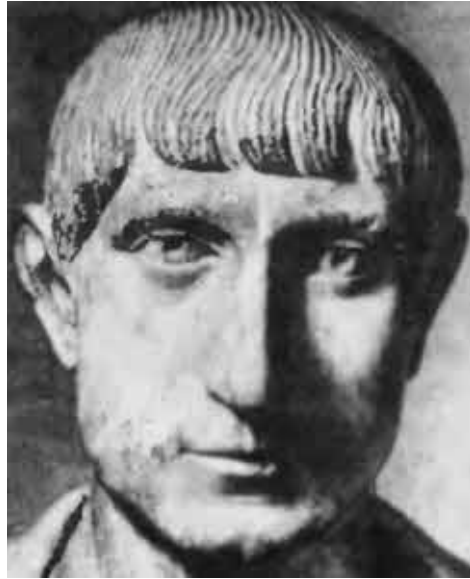
Констанций II, третий сын императора Константина.