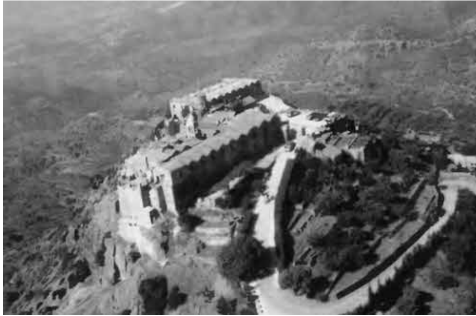
Монастырь Ставровуни.