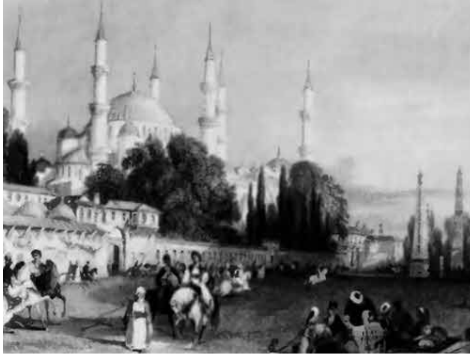
Константинополь, площадь Ипподрома. Гравюра XVIII в.