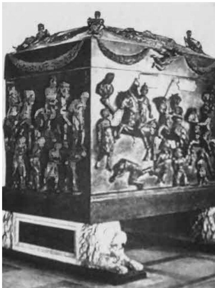
Саркофаг царицы Елены. Порфир. 336 г. Музей Ватикана.