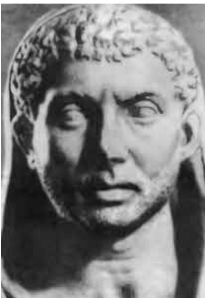
Максенций. Мрамор, IV в.