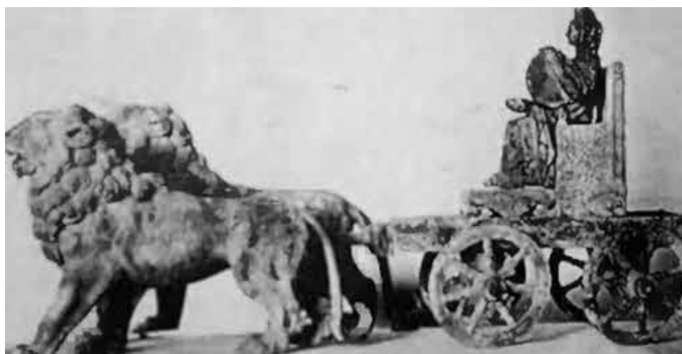
Колесница на ипподроме, запряженная парой львов. Мрамор, III в.