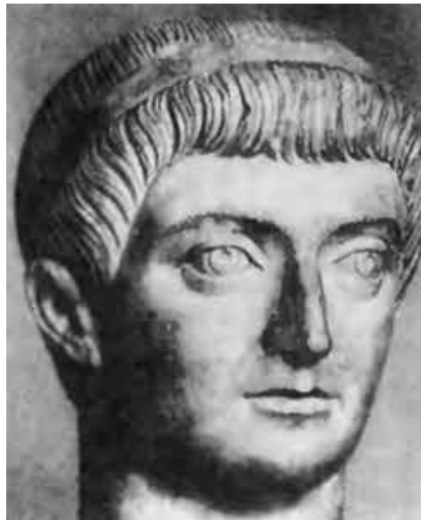
Констант, четвертый сын императора Константина.