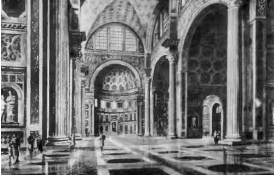
Базлика Максенция и Константина в Риме.