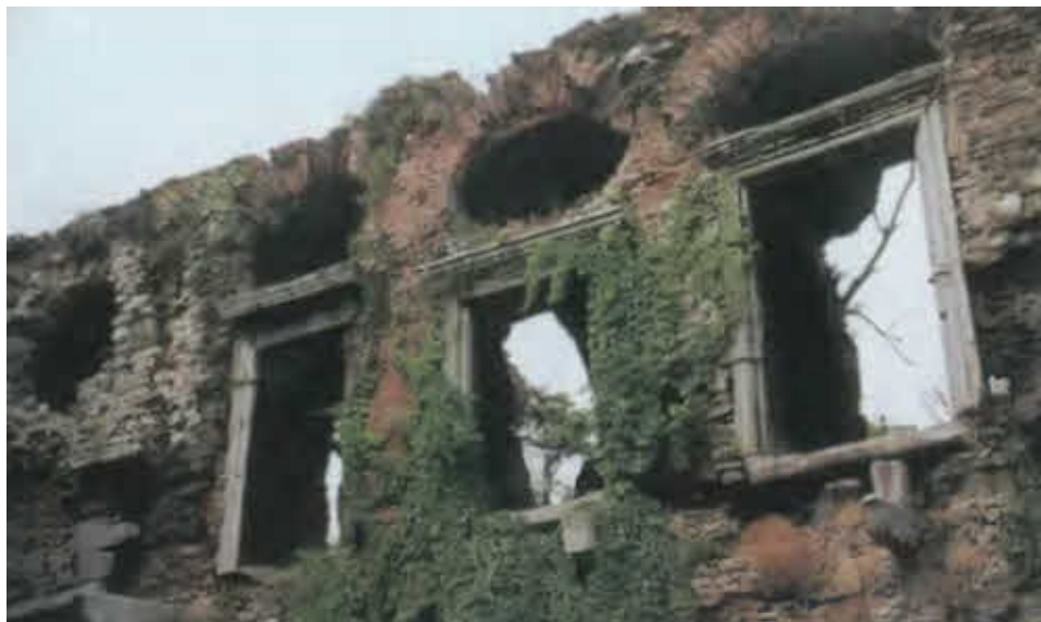
Константинополь. Руины Буколеона — дворца, построенного Константином как символ непревзойденного величия Византии.