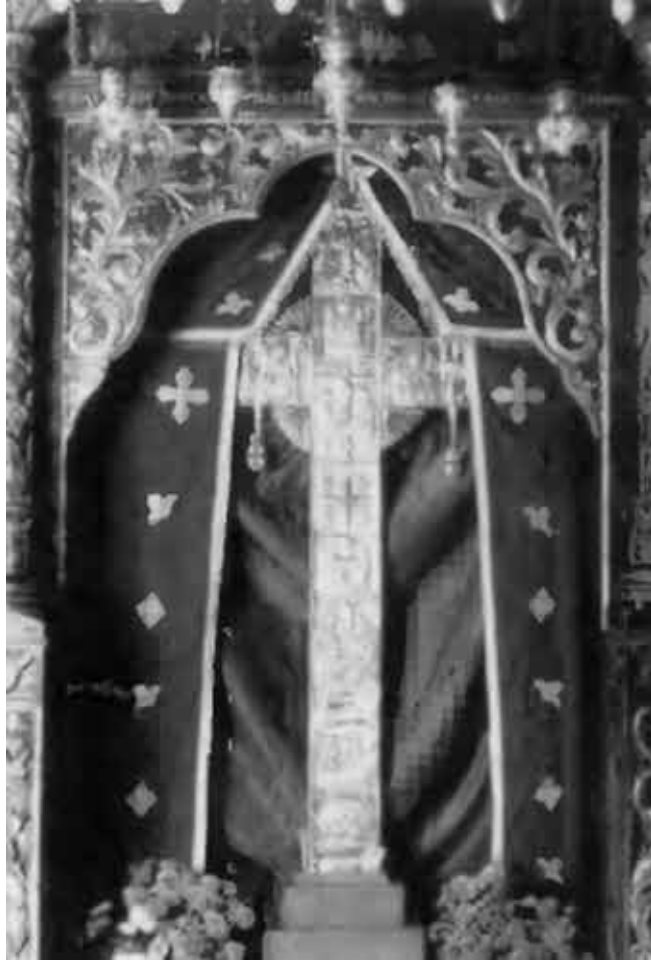
Главная реликвия Ставровуни серебряный крест, в котором хранится кусочек Креста, привезенного Еленой на Кипр из Святой земли в 326 г.