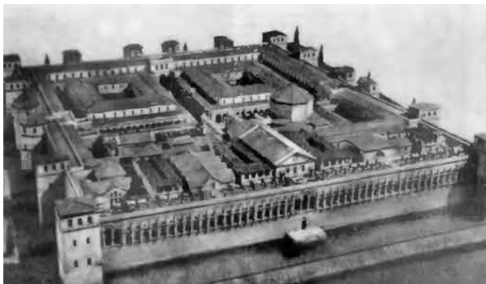
Дворец Диоклетиана в Салоне (современный Сплит). Реконструкция.