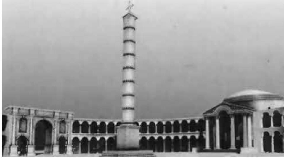
Форум Константина. Компьютерная реконструкция.