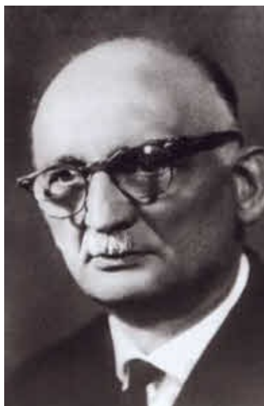
Вильям Генрихович Фишер (Рудольф Иванович Абель)