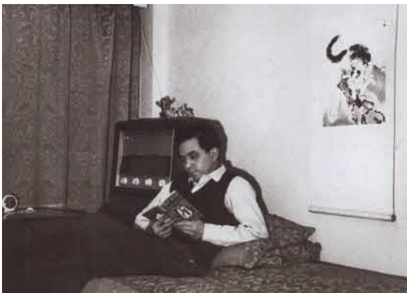
Фото публикуются впервые