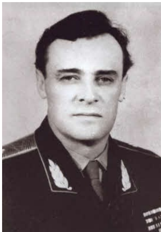
Советский разведчик-нелегал, один из руководителей нелегальной разведки, заместитель начальника внешней разведки А. М. Коротков