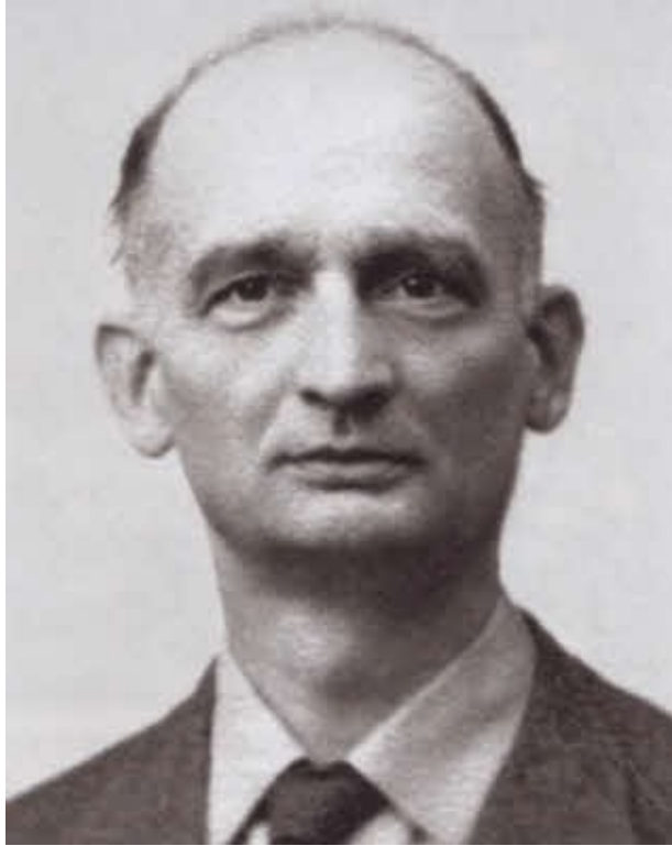
Советский разведчик-нелегал Вильям Фишер