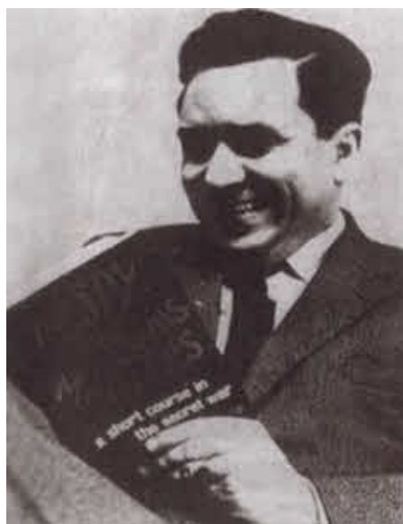
Конон Молодый после обмена. Апрель 1964 г.