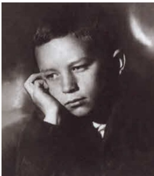
Конон Молодой. Сентябрь 1932 г.