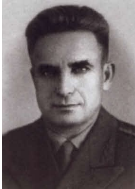
Один из руководящих сотрудников советской внешней разведки В. Г. Павлов