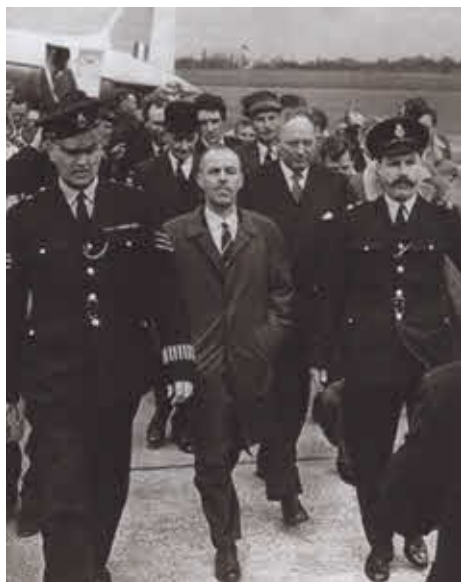
Гревил Винн после обмена. Апрель 1964 г.