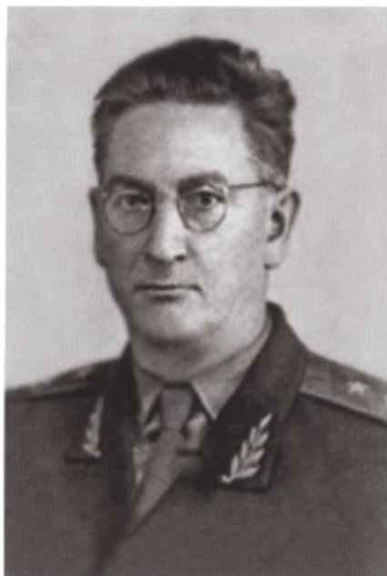
Начальник внешней разведки в 1953 году К. П. Питовранов