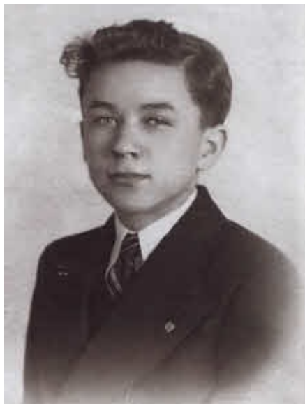
Конон Молодой. США, 1938 г.