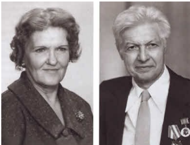
Герой России Леонтина Коэн