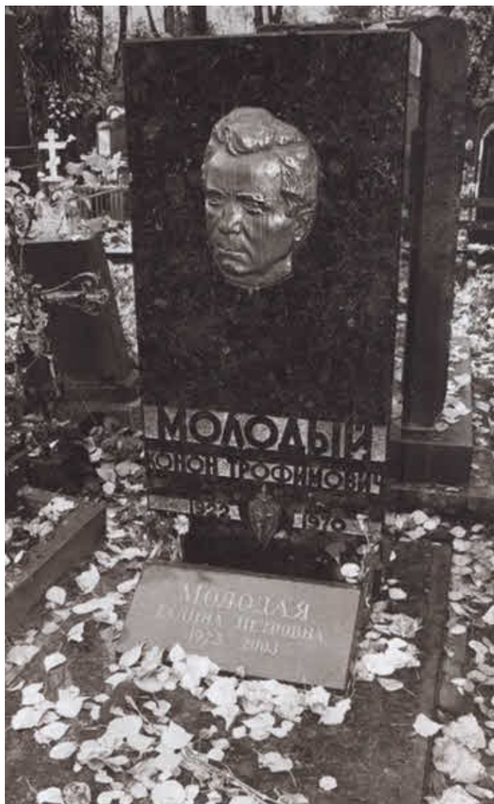
Могилы Конана Трофимовича Молодого на Донском кладбище в Москве