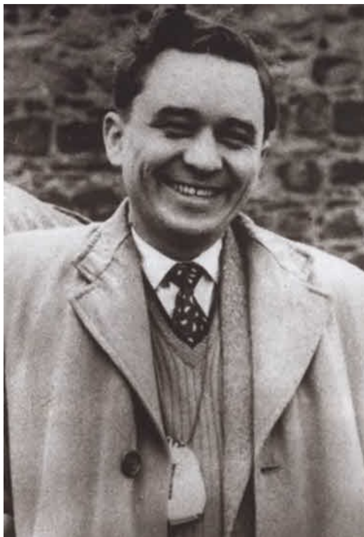
Бизнесмен Гордон Лонсдейл. Лондон, 1958 г.