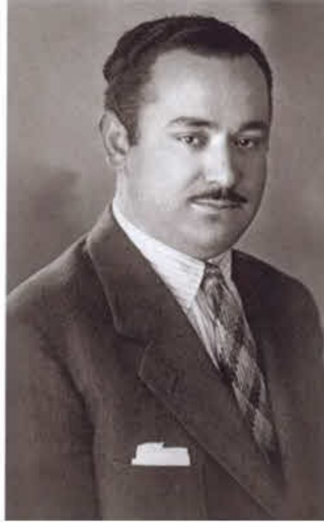
Слева. Сотрудник советской и российской внешней разведки Джордж Блейк. Середина 1900-х гг.