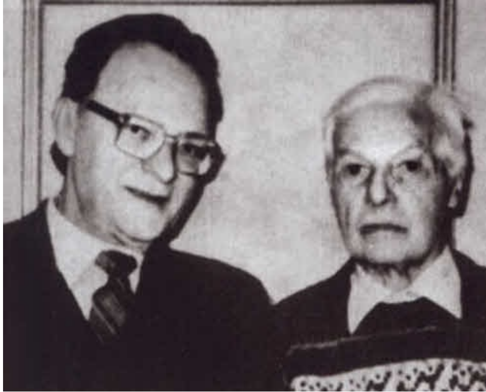
Видные советские разведчики Ю. С. Соколов и Моррис Коэн