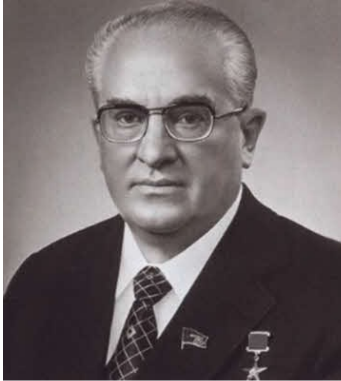
Председатель КГБ СССР в 1967–1971 годах Ю. В. Андропов