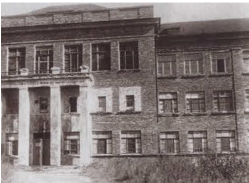
Здание московской школы № 36, которую окончил Молодой. Фото 1940 г.