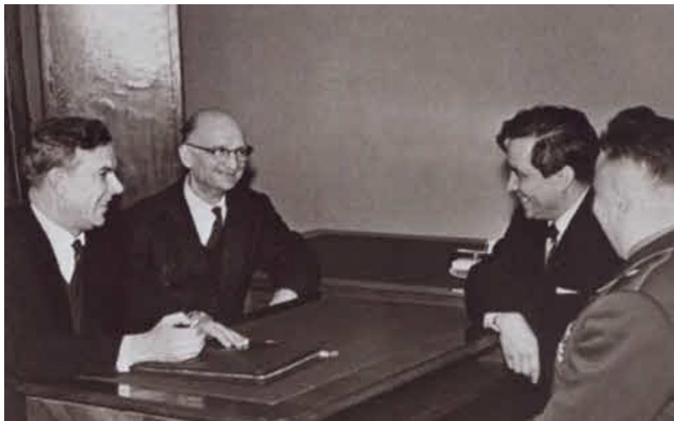
Встреча коллег: председатель КГБ при СМ СССР Владимир Семичастный, Вильям Фишер, Конон Молодой и начальник ПГУ КГБ при СМ СССР Александр Сахаровский