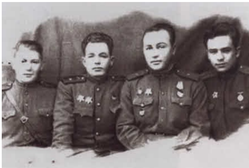
Молодой (первый справа) с фронтовыми друзьями. Конец 1943 г.