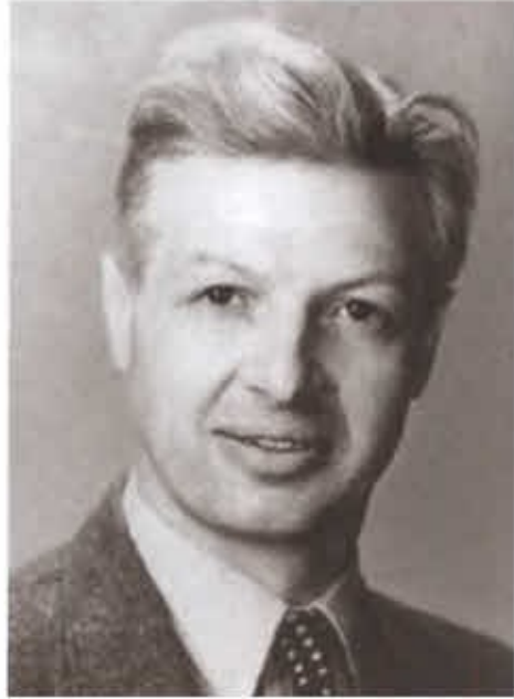
Разведчик-нелегал Хелен Крогер