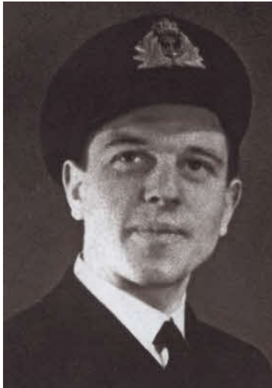
Сотрудник разведки ВМС Великобритании Джордж Блейк. 1944 г.

Тюрьма Ее Величества Уормвуд Скрабе, в которой в разное время содержались Питер Крогер, Джордж Блейк и Гордон Лонсдейл