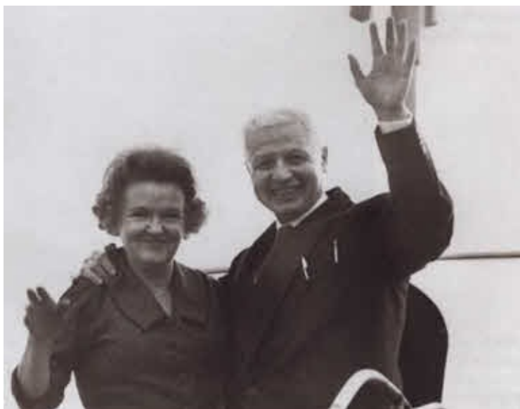
Леонтина и Моррис Коэн в аэропорту Шереметьево. 25 октября 1969 г.