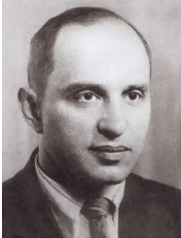
Видный советский разведчик С. М. Семенов