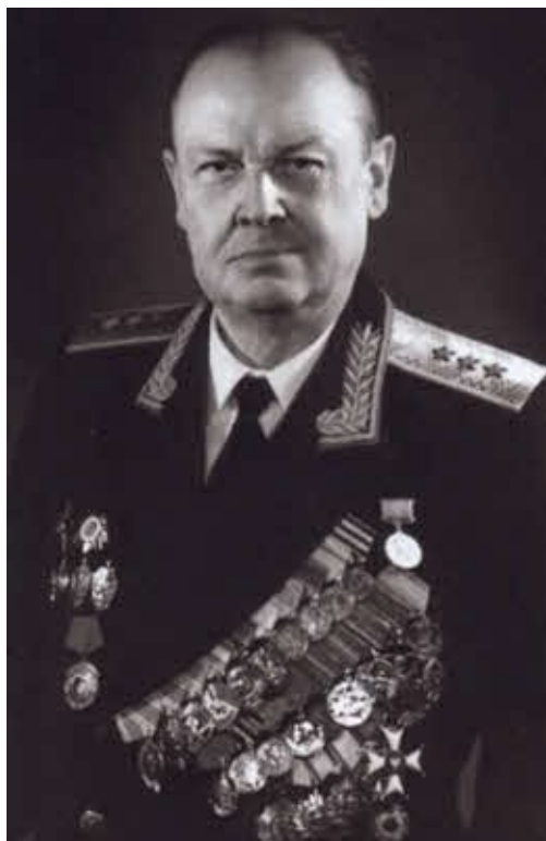
Начальник внешней разведки в 1955–1971 годах А. М. Сахаровский