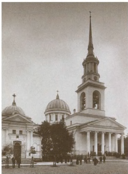
Андреевский собор в Кронштадте. Фотография начала XX в.