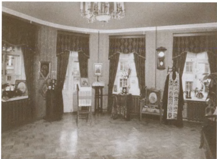
Гостиная зала в квартире отца Иоанна