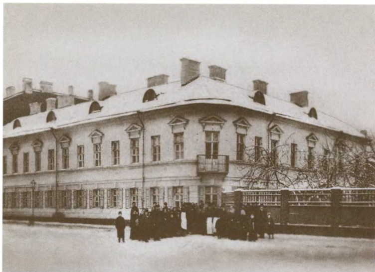
Дом Иоанна Кронштадтского (Кронштадт, ул. Посадская, 21)