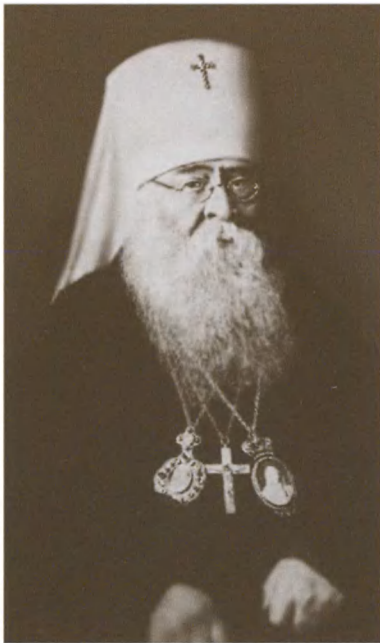
Патриарх Алексей (Симанский). 1945—1970 гг.