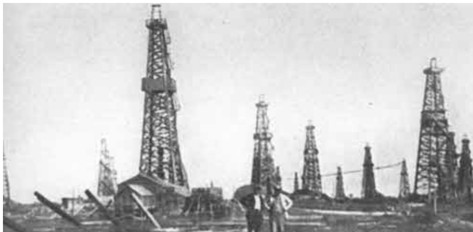
Бакинский промысел, 1927.