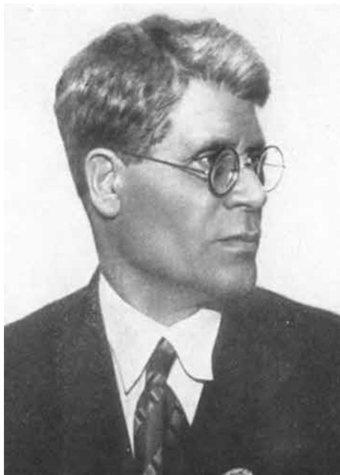
И. М. Губкин, 1931.