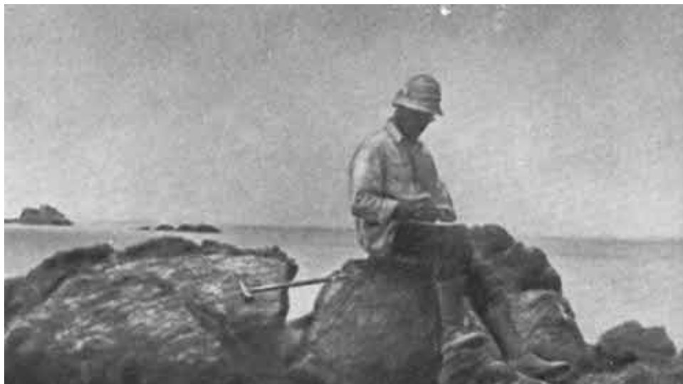
В экспедиции он всегда носил панамку, толстовку, краги... Нефтяные Камни, 1930.