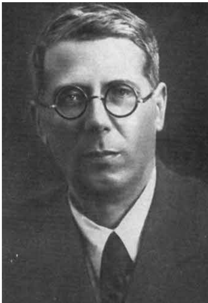
С. И. Губкин, 1943.