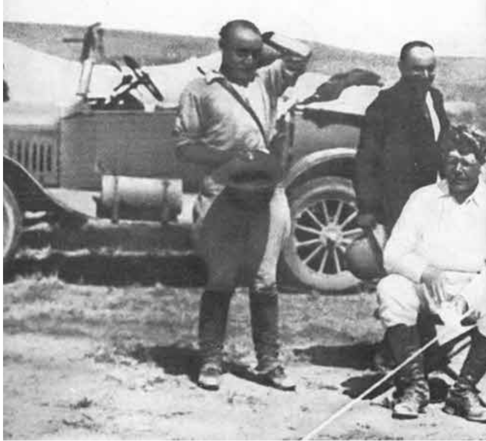
Короткий привал. Каракумы, 1934.