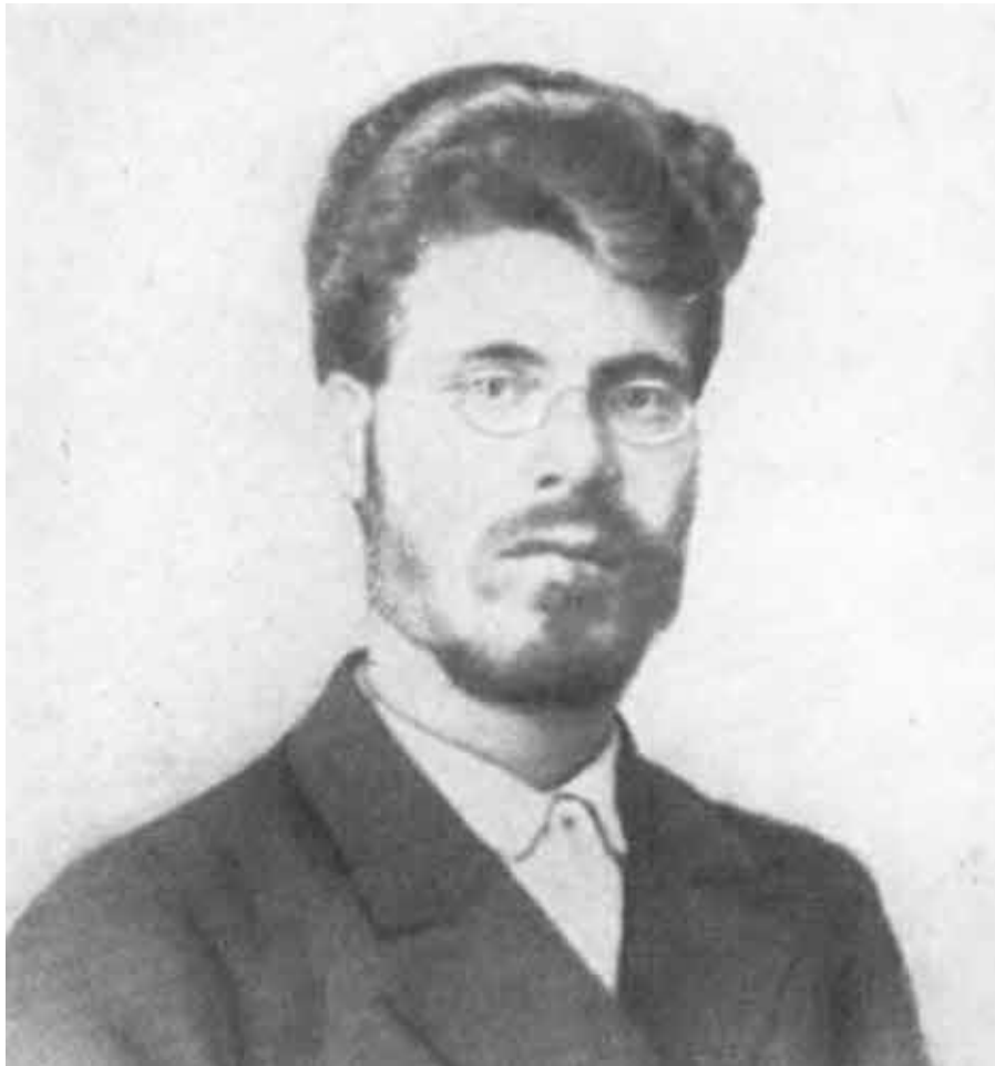
И. М. Губкин, 1894.