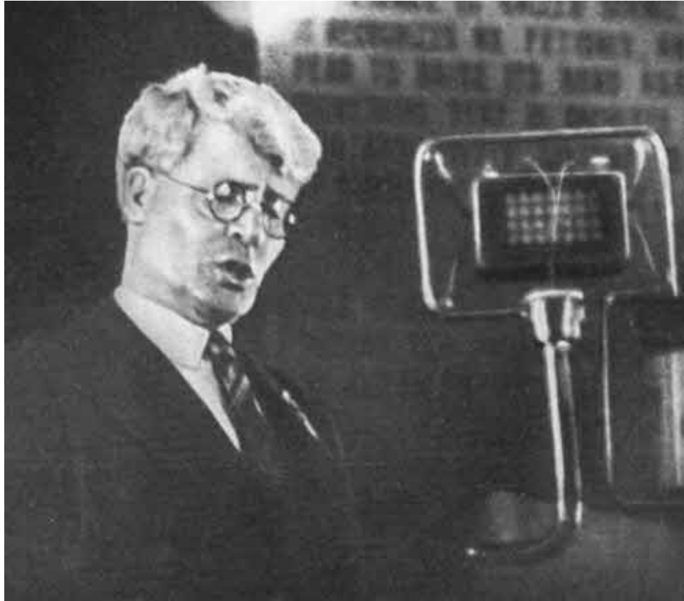
И. М. Губкин открывает XVII Международный геологический конгресс.