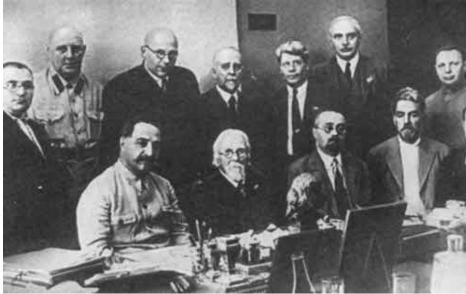
Руководители Советского государства и деятели науки в кабинете президента Академии наук СССР А. П. Карпинского.