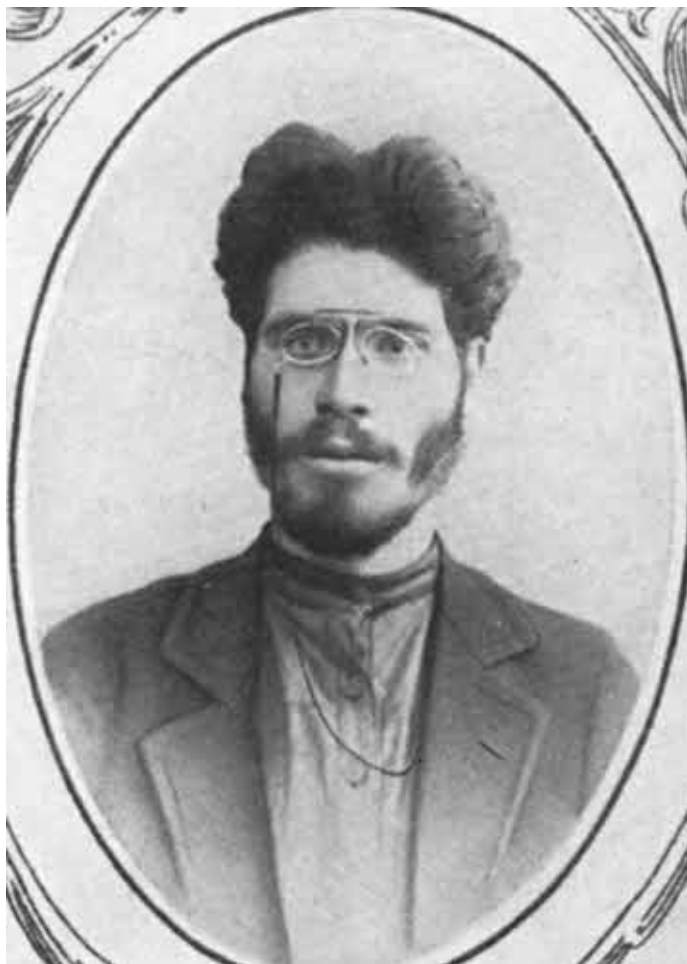
И. М. Губкин, 1898.