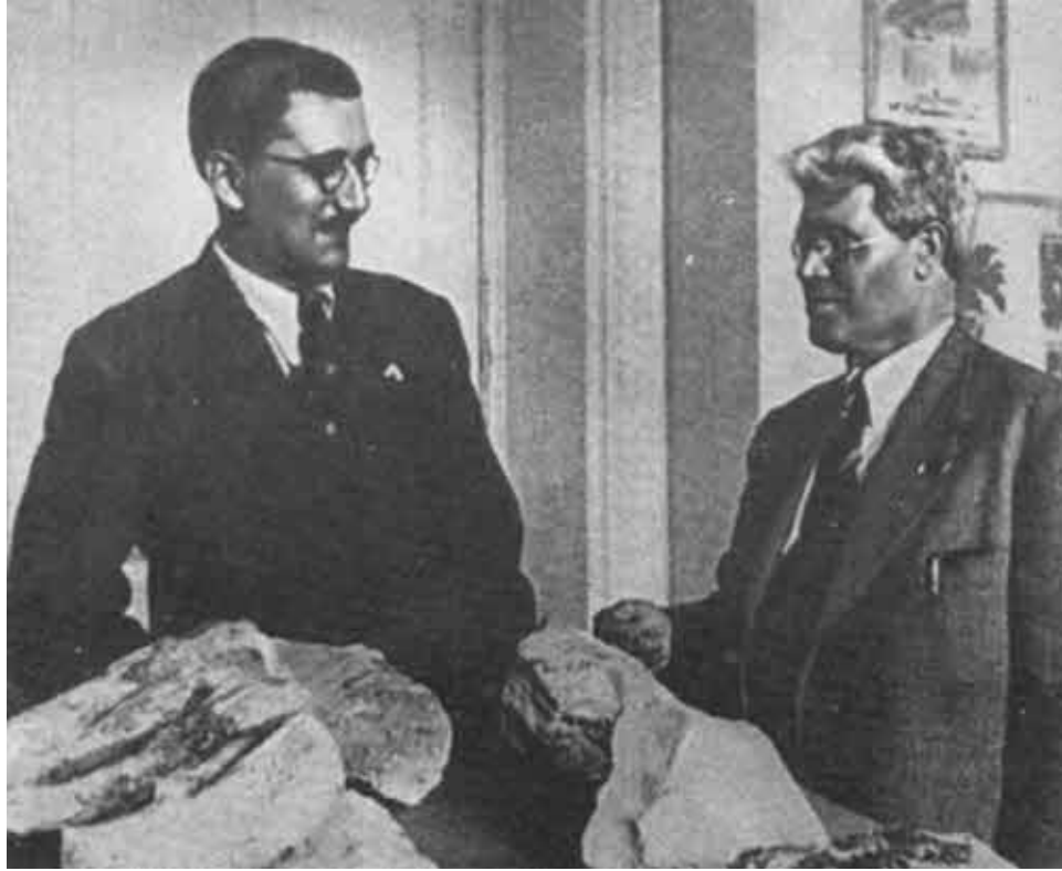
В перерыве между заседаниями XVII Международного геологического конгресса. Москва, 1937.