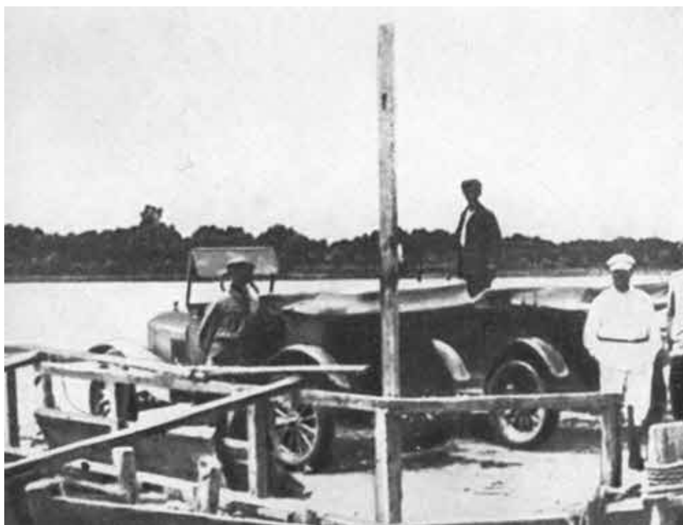
Переправа через речку Чуст. Узбекистан, 1934.