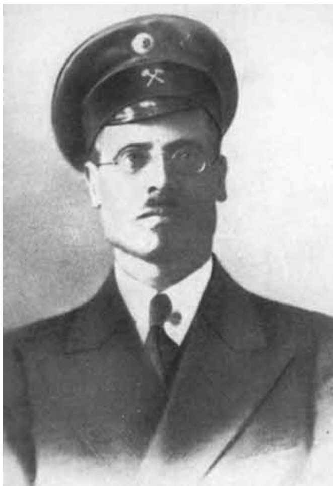
И. М. Губкин, 1912.