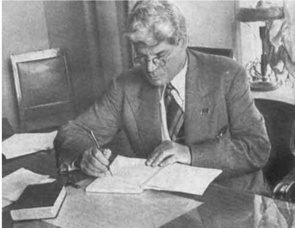
И. М. Губкин, 1936.