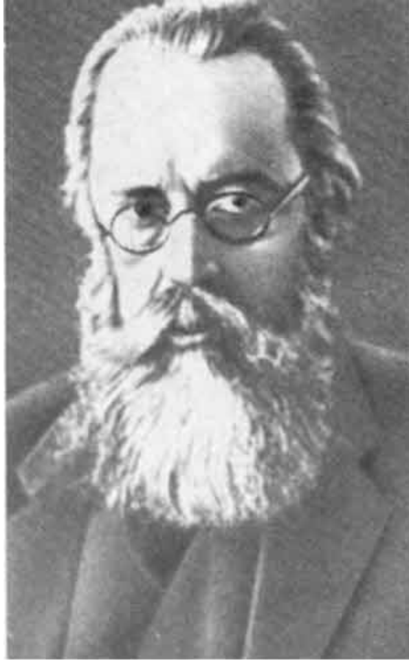
В. А. Стеклов.