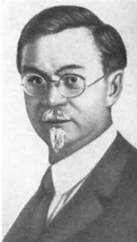
П. П. Лазарев.