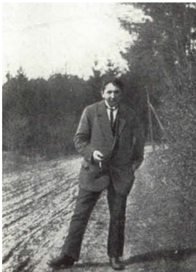
Ярослав Гашек. 1921 г.