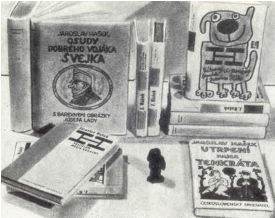
Книги Гашека, изданные на чешском языке.