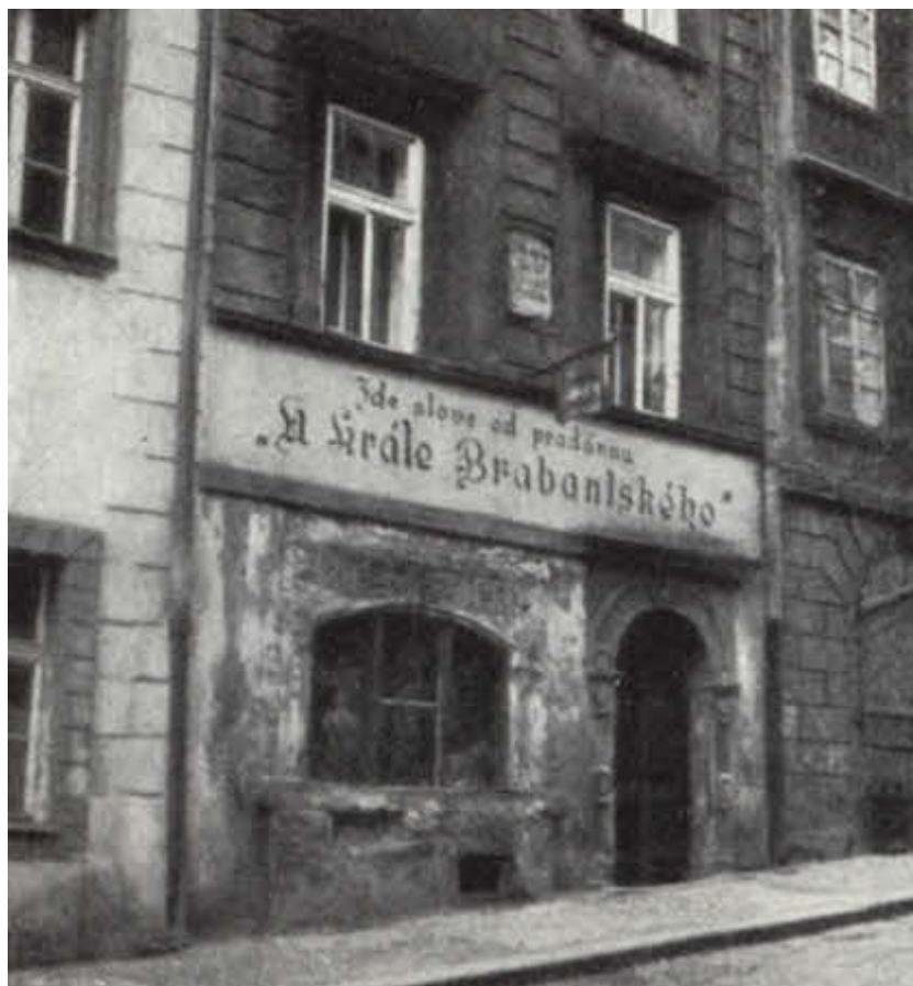
Один из трактирчиков, известных по «Швейку».