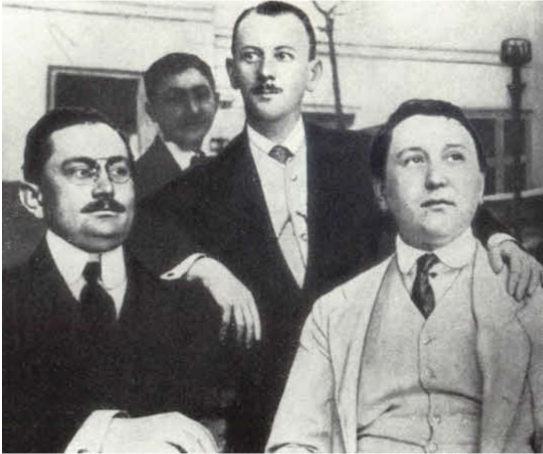
Гашек с единомышленниками в период создания партии умеренного прогресса в рамках закона. Прага, 1911 г.