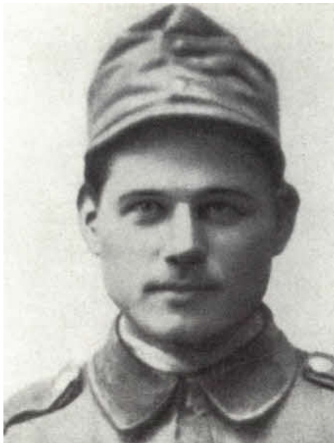
Страшлипка — прототип Швейка.