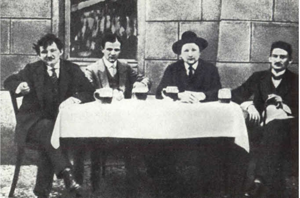
Гашек (второй справа) с друзьями. Прага, 1912 г.