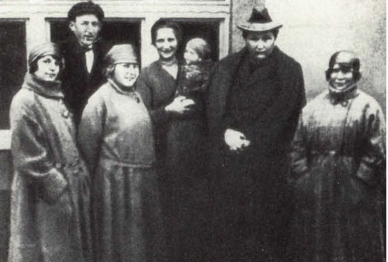
Гашек в Липнице над Сазавой. Последнее фото. 1922 г.