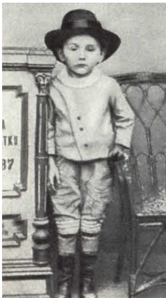
Ярославу 4 года.