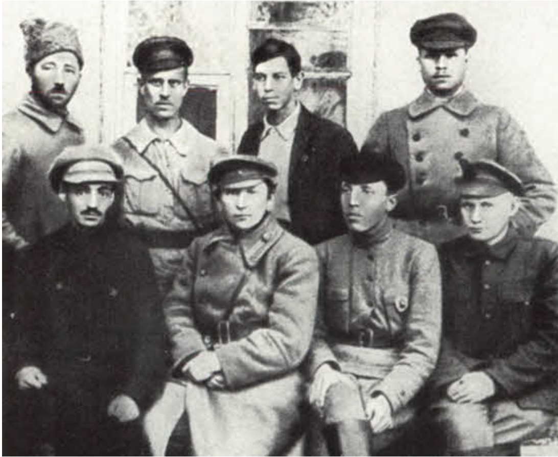
Гашек (в первом ряду третий справа) среди работников политотдела 5-й армии Восточного фронта. Иркутск, 1920 г.