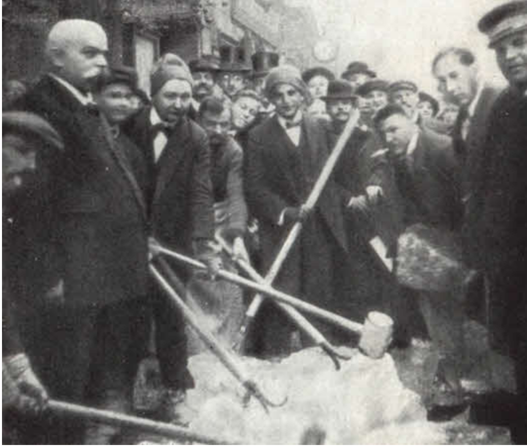
Гашек колет лед на пражской улице.