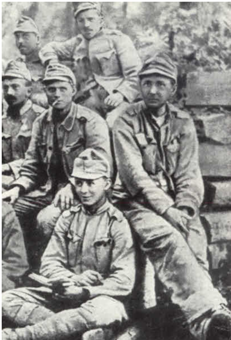
По дороге на фронт.