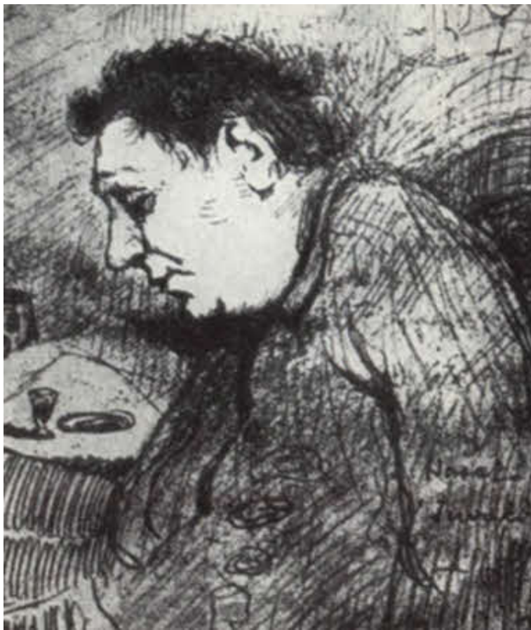
Последний портрет Гашека. Художник Я. Панушка.