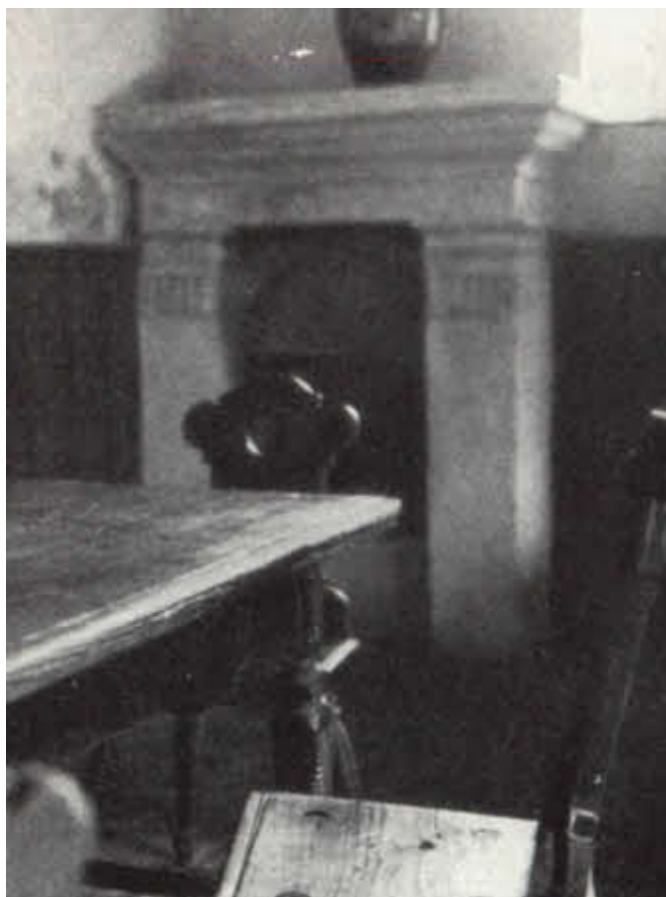
Стол в замке, за которым работал Гашек.