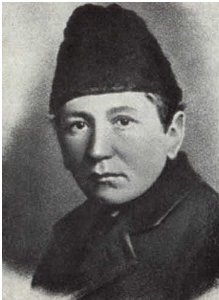
Гашек перед отъездом из Москвы в Чехословакию. 1920 г.