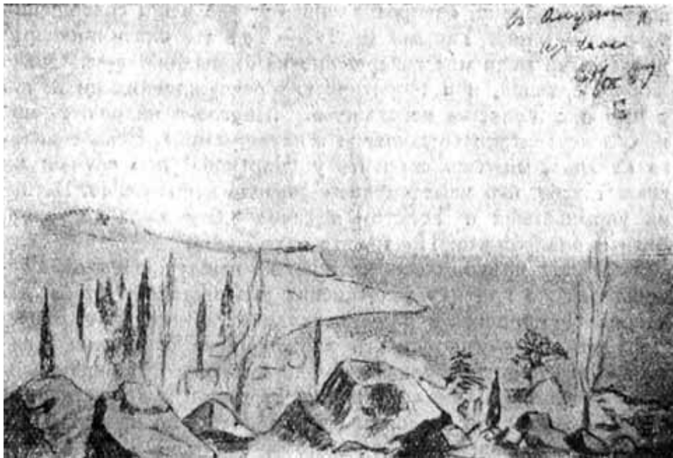
Рисунок Гаршина из крымского альбома.