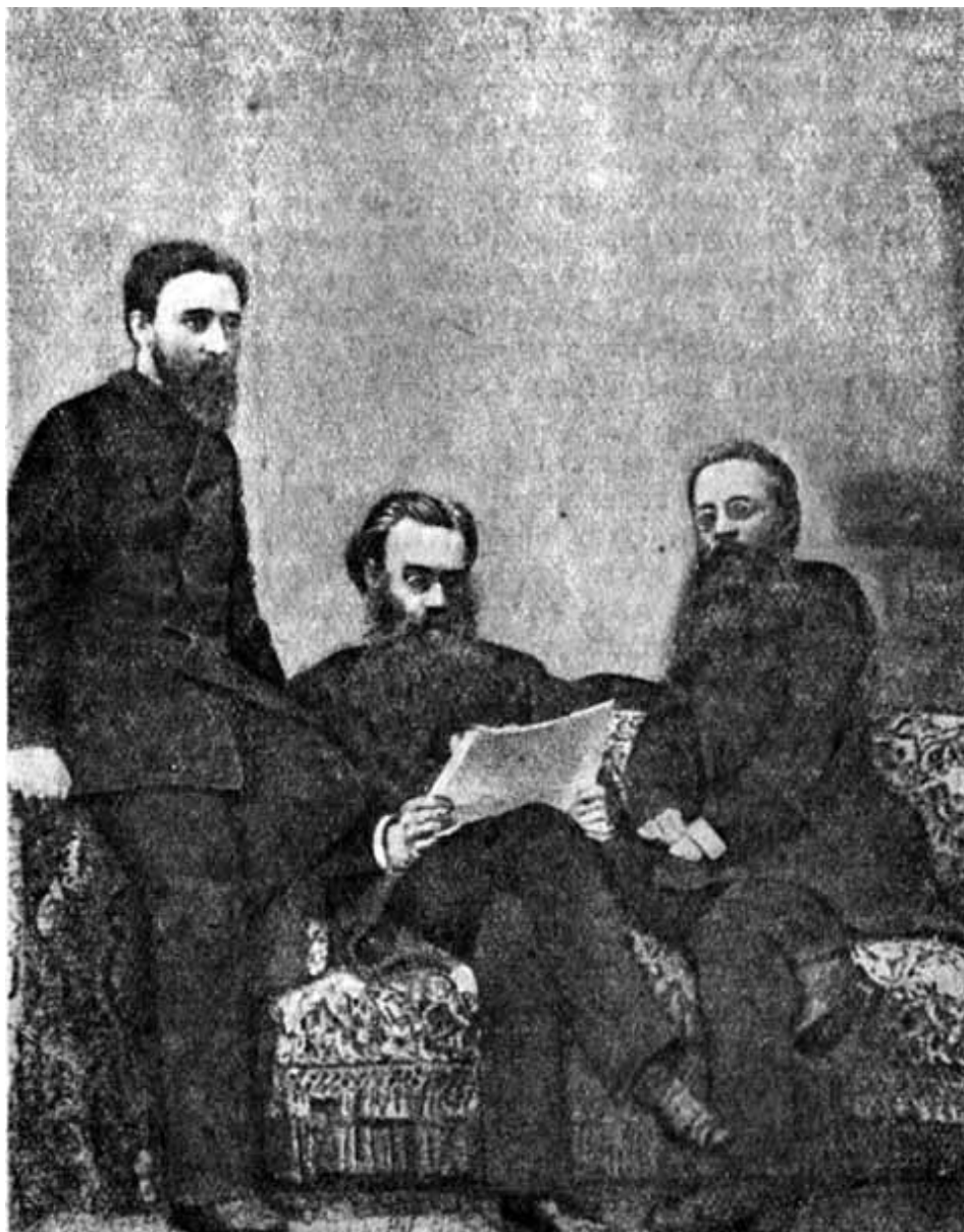
В. М. Гаршин, А. Я. Герд и В. М. Латкин. (С фотографии 1886 г.)