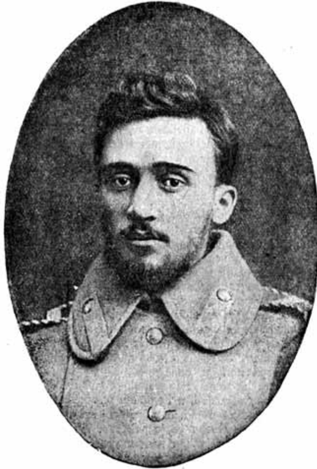
В. М. Гаршин. 1877 г.