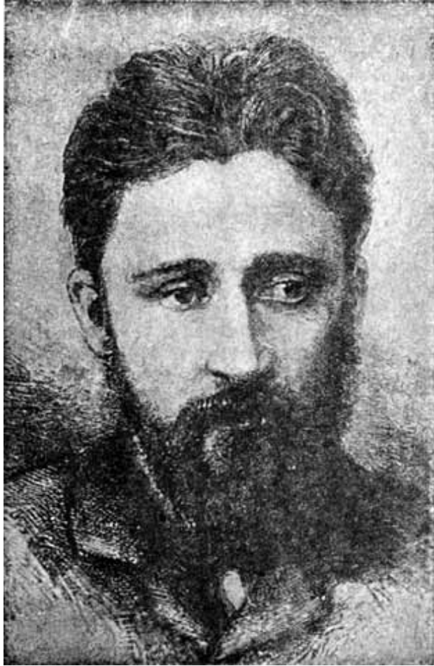
В. М. Гаршин. 1884-1885 гг.