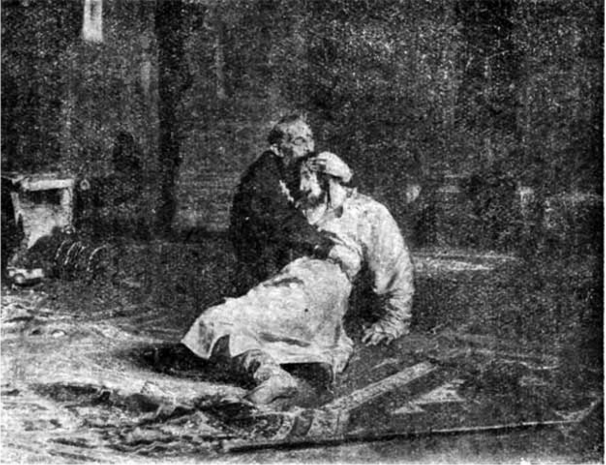
«Иван Грозный и сын его Иван 16 ноября 1581 г.» (С картины худ. И. Е. Репина.)