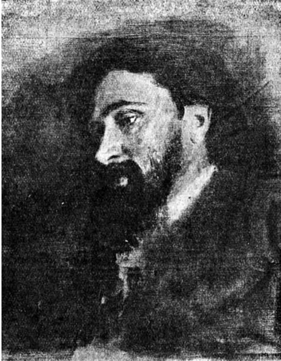
В. М. Гаршин. (1885-1888 гг.) (С портрета худ. И. Е. Репина.)