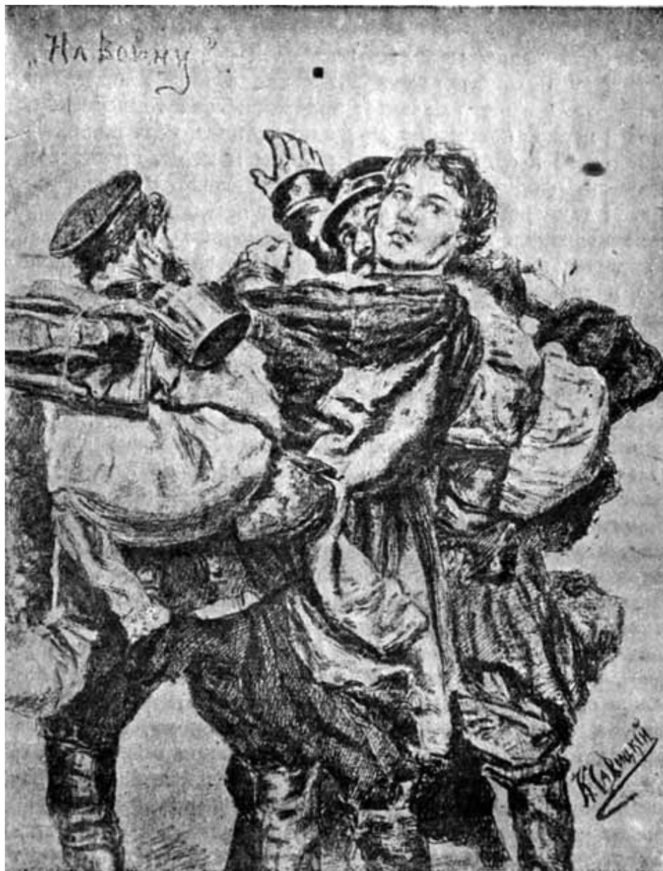
«На войну!» (Рисунок К. А. Савицкого.)