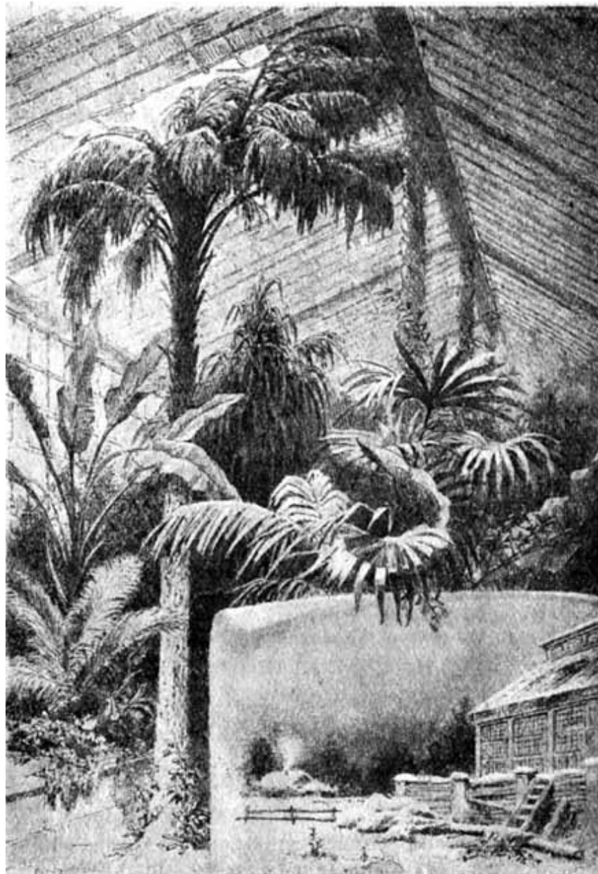
Иллюстрация к рассказу «Attalea princeps». (Рисунок худ. Г. П. Кондратенко).