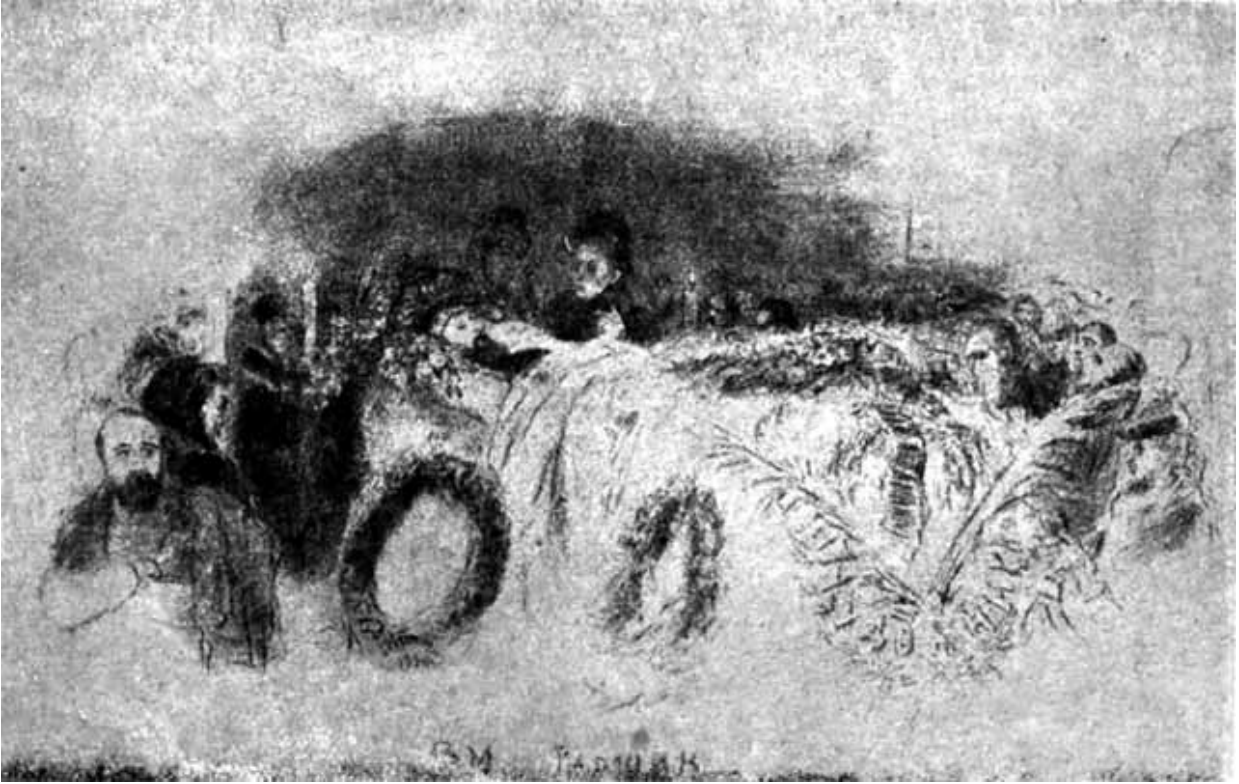
В. М. Гаршин в гробу. (Карандашная зарисовка худ. И. Е. Репина.)