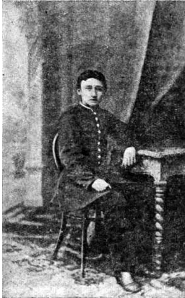
В. М. Гаршин-гимназист.