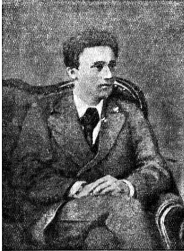
В. М. Гаршин. (С фотографии 1876 г.)