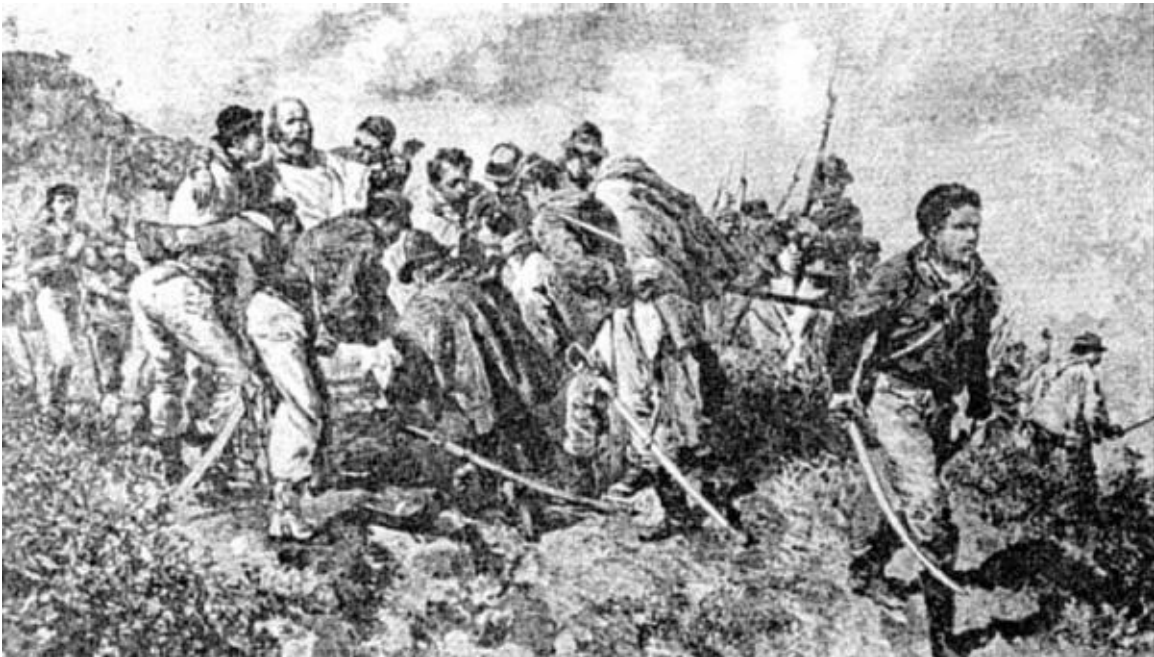
Гарибальди ранен под Аспромонте