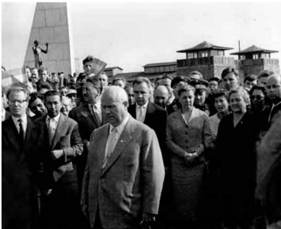
...и доверил ей управление Москвой.