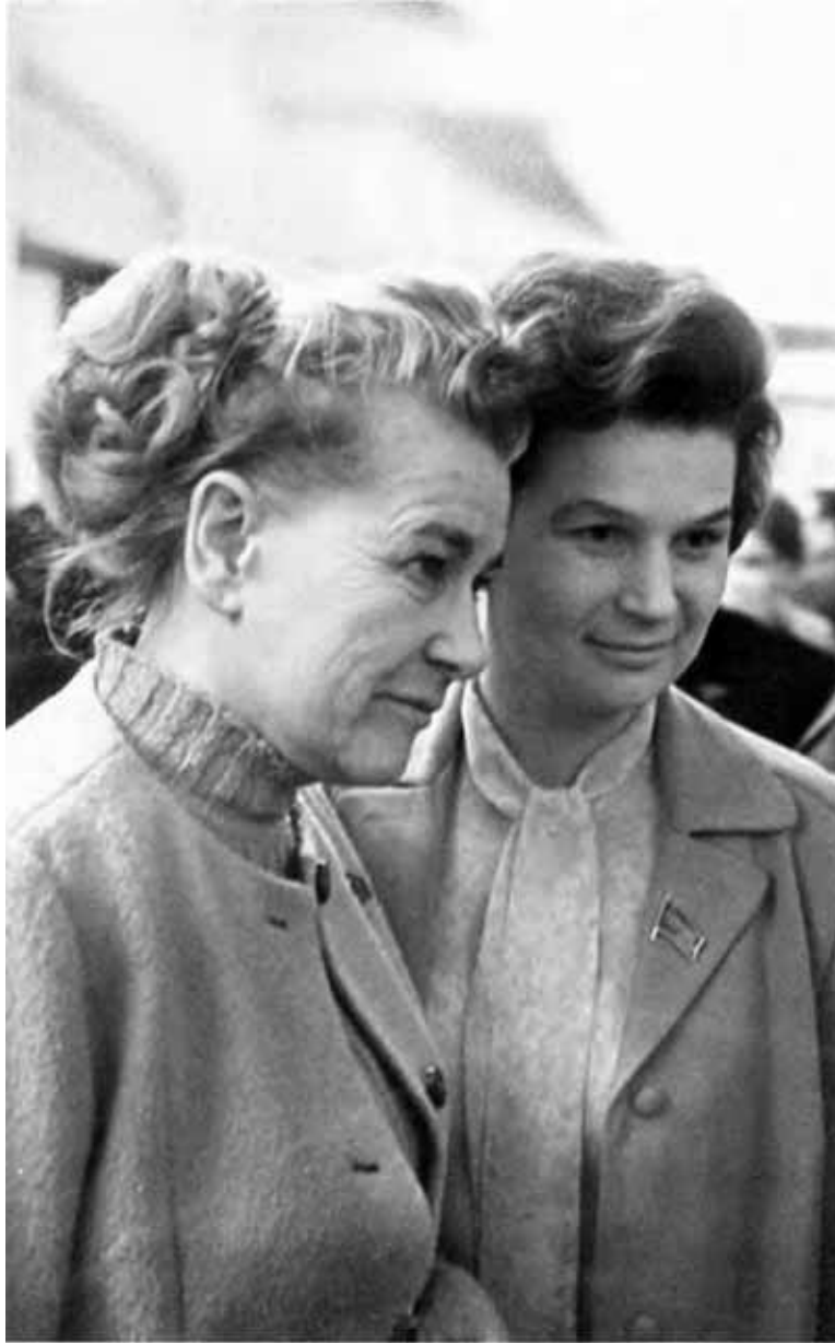
С Валентиной Терешковой.