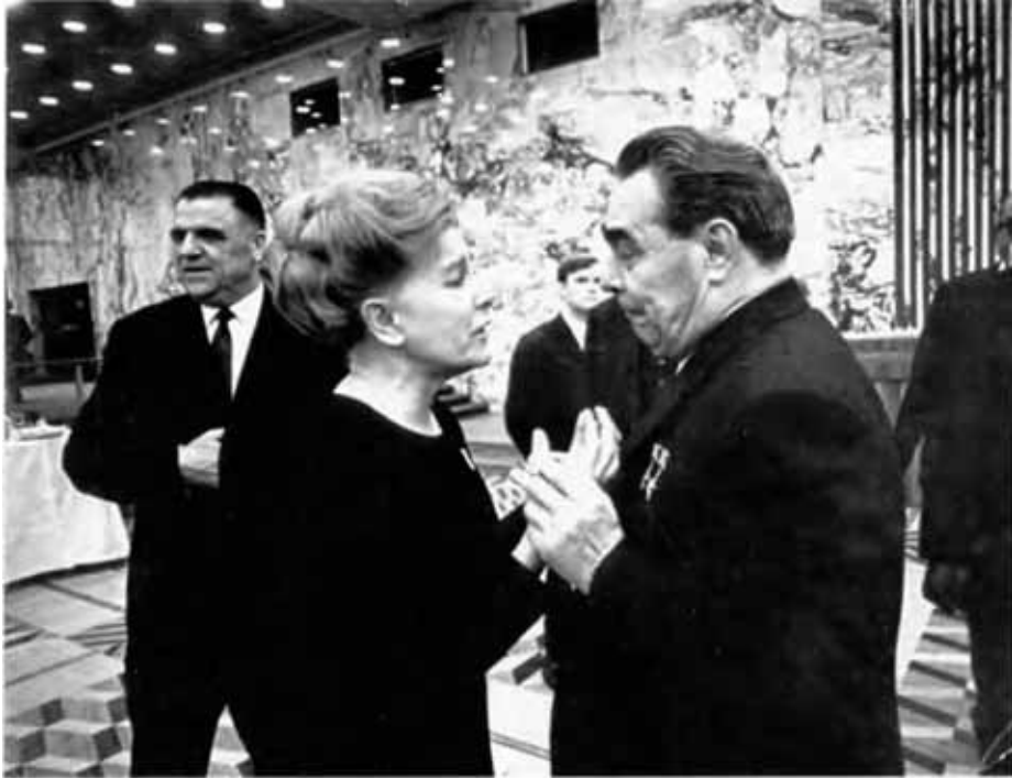
С Леонидом Брежневым.