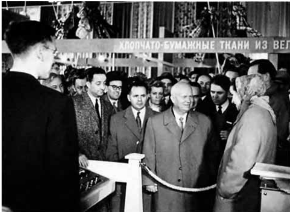
Н. С. Хрущев сделал Е. А. Фурцеву своим соратником