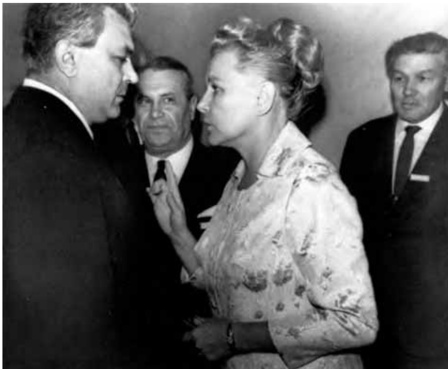
Сергей Бондарчук, Марк Бернес, Екатерина Фурцева и Всеволод Санаев.