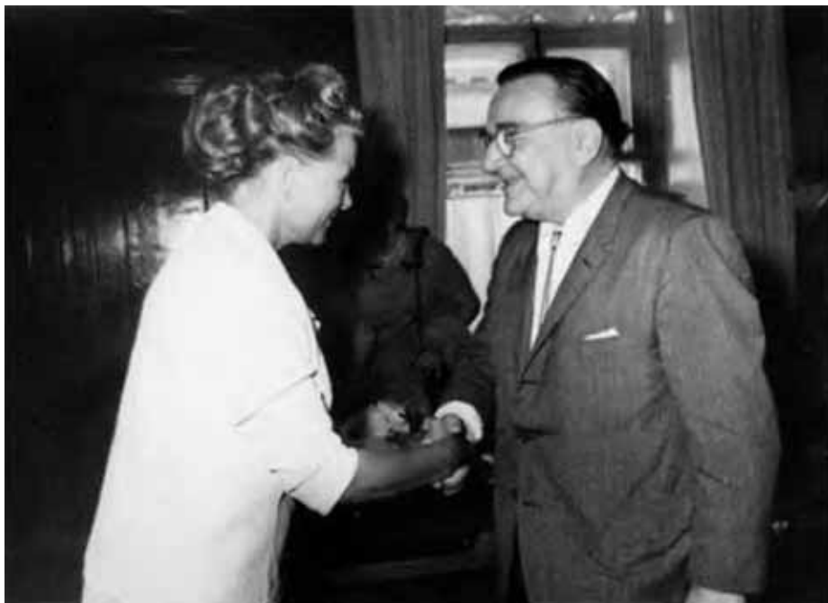
С Федором Шаляпиным.