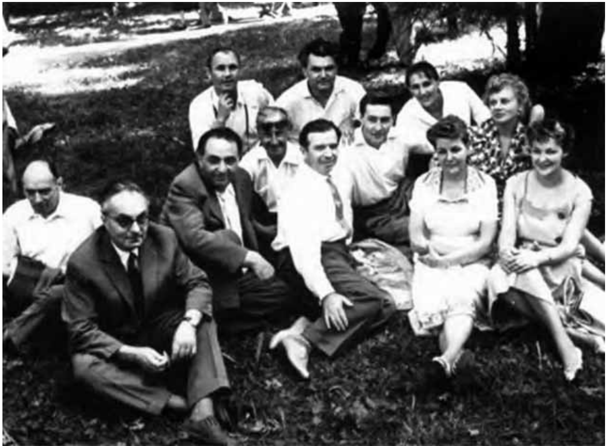
Фурцева в окружении «звезд» советского кинематографа.