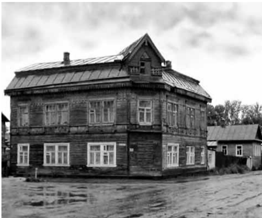
Вышний Волочек — родина Екатерины Фурцевой.