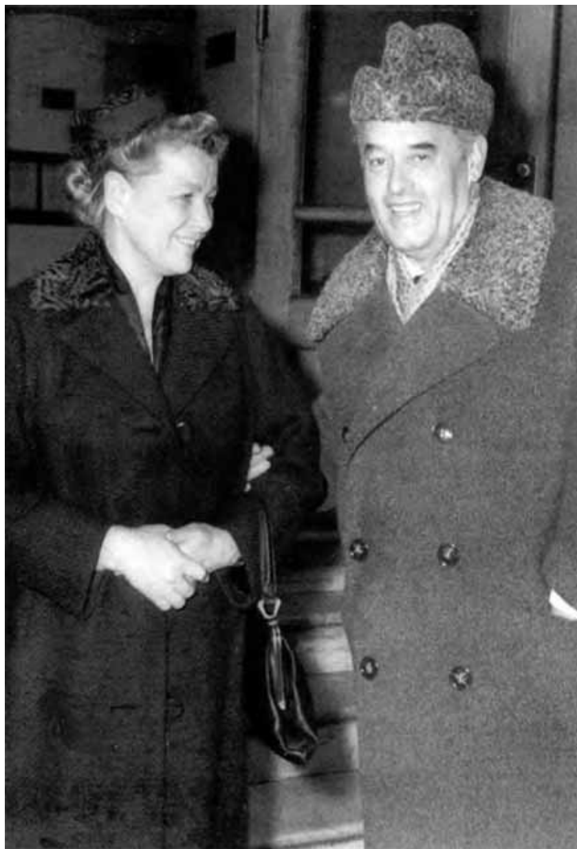
Екатерина Алексеевна Фурцева и Николай Павлович Фирюбин.