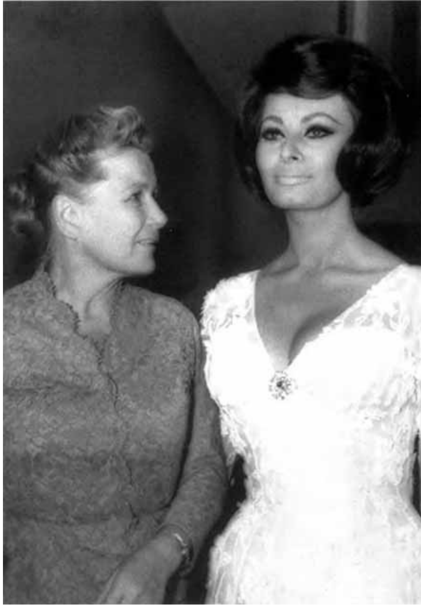
С Софи Лорен.