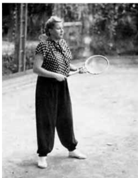
Екатерина Фурцева очень любила спорт,