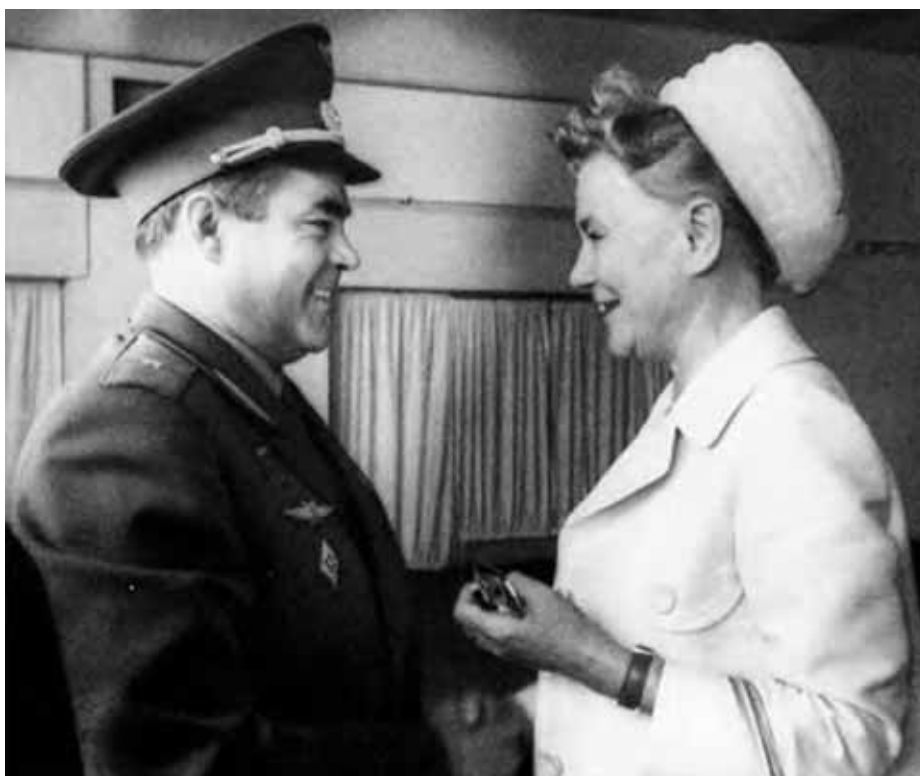
С Андряном Николаевым.