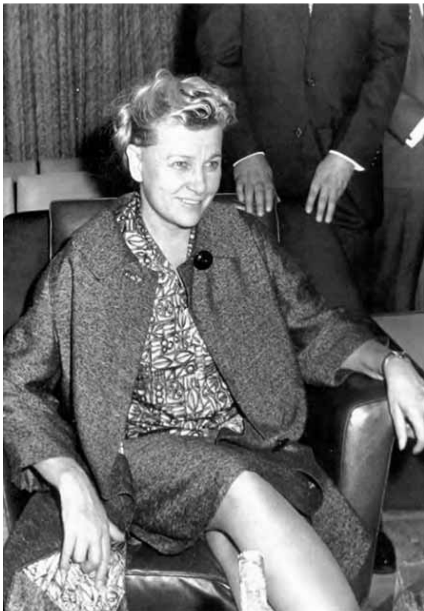
Самый красивый министр культуры.