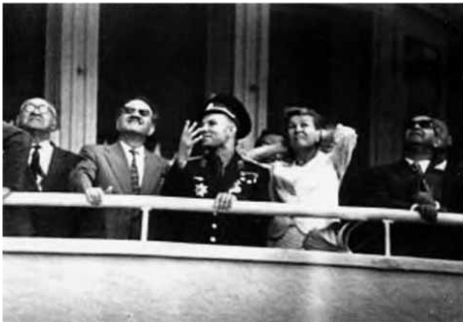
А. Туполев, А. Микоян. Ю. Гагарин. Е. Фурцева и другие.