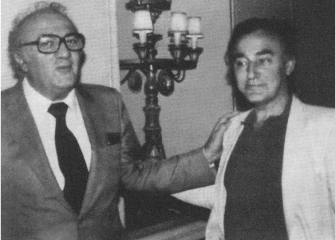
Федерико Феллини и его биограф Костанцо Костантини. Рим, 1983 г.