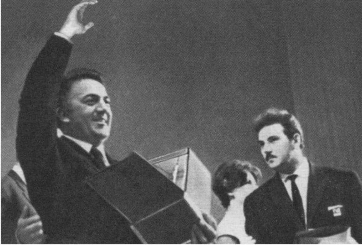
Председатель Московского кинофестиваля Григорий Чухрай (справа) вручает Федерико Феллини «Главный приз» за фильм «Восемь с половиной». Москва, 1963 г.