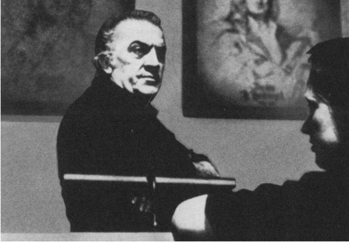
Феллини на съемках фильмов «Репетиция оркестра»