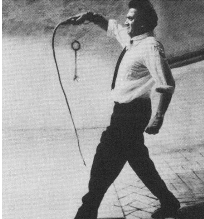
Феллини на съемках фильма «Восемь с половиной» демонстрирует одну из сцен