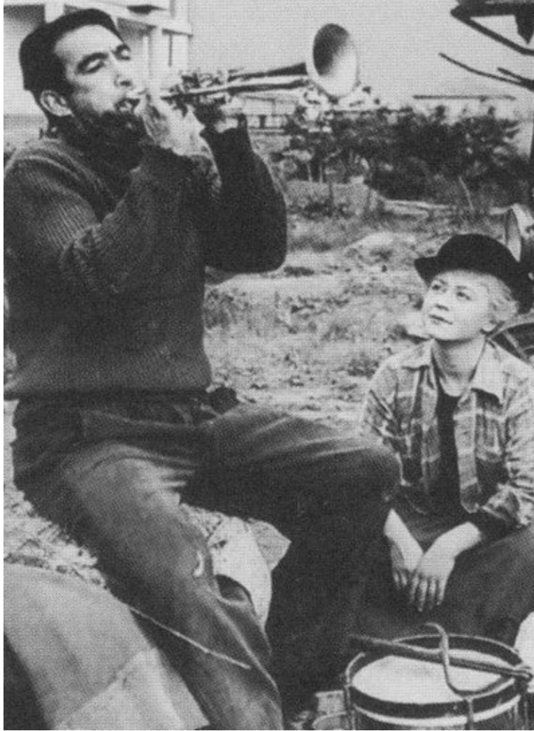
Энтони Куинн и Джульетта Мазина в фильме «Дорога»