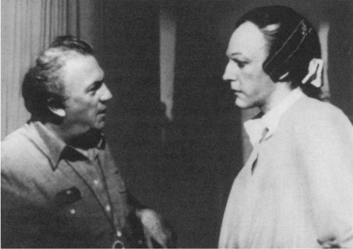
Феллини с Дональдом Сазерлендом, исполнителем роли Джакомо Казановы