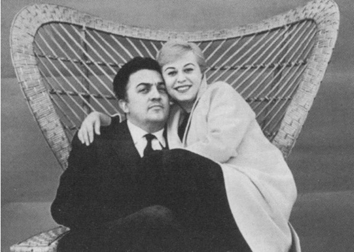
Маэстро и его муза