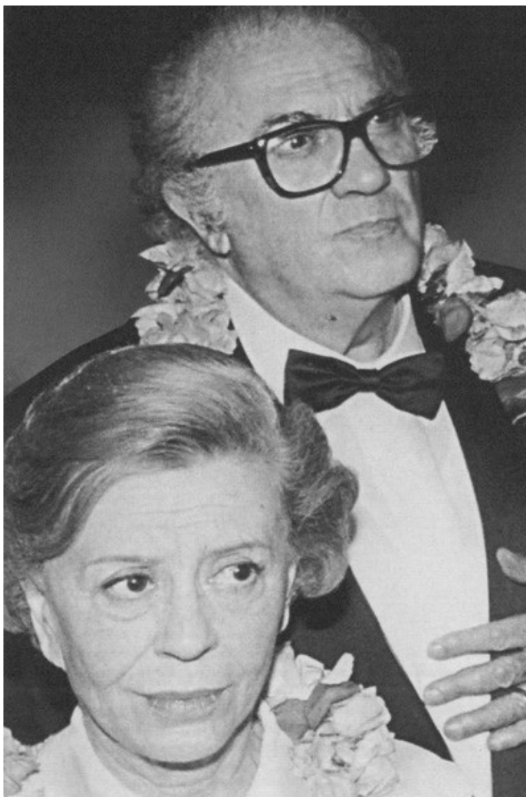
Великая актриса и великий режиссер. Одна из последних фотографий