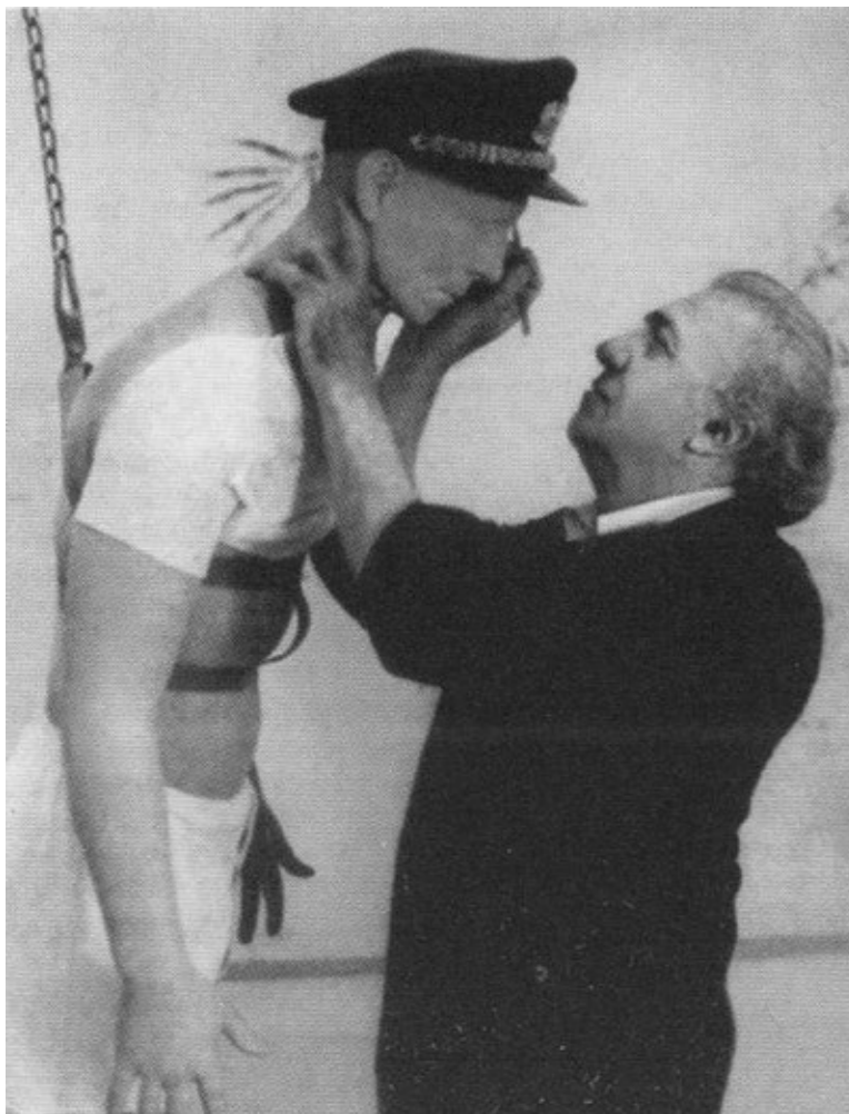
и «Город женщин». 1979 г.