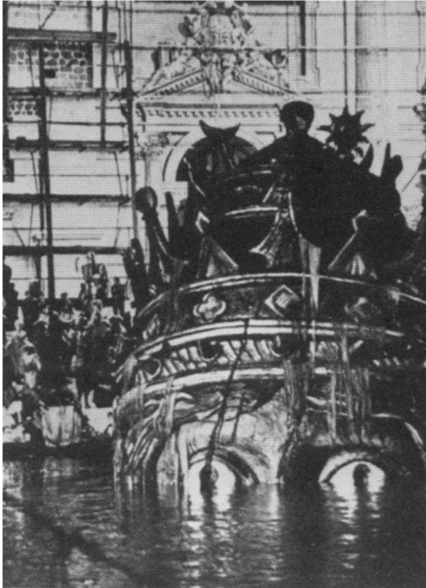
Сцена из фильма «Казанова Феллини». 1976 г.