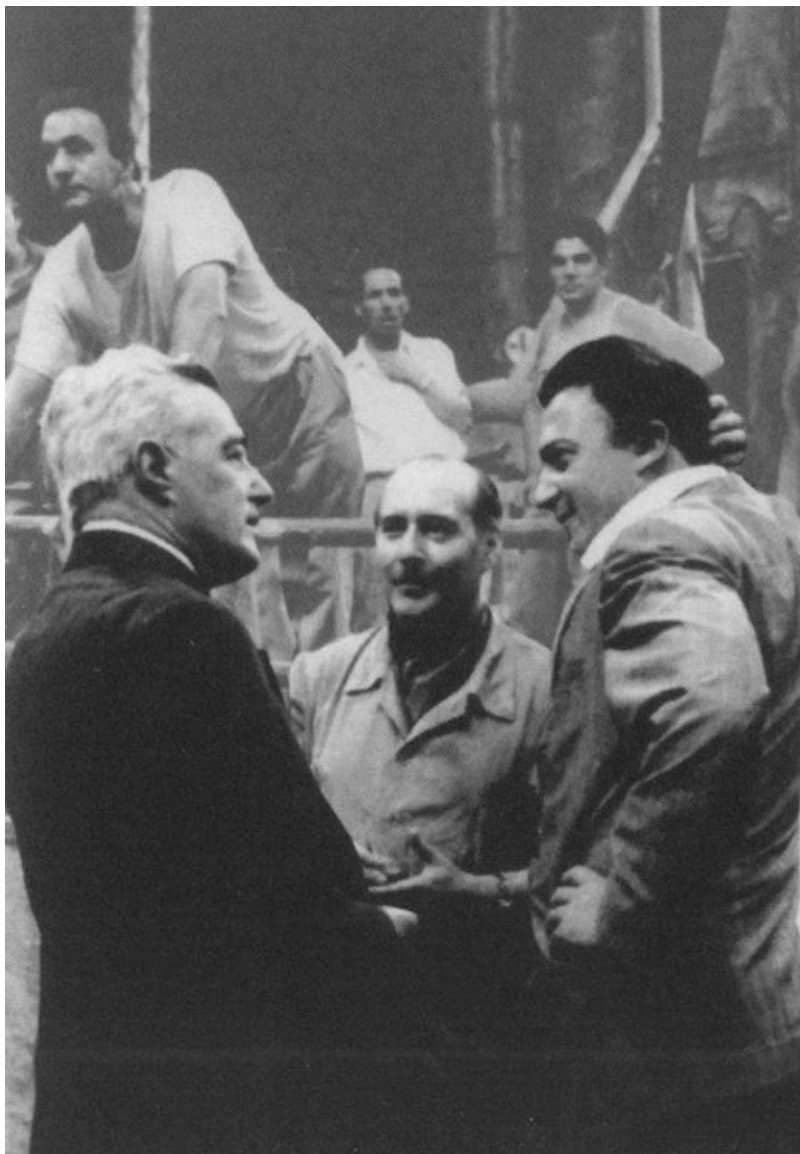
Выдающиеся режиссеры XX века: Витторио Де Сика, Роберто Росселлини, Федерико Феллини. Рим, 1966 г.