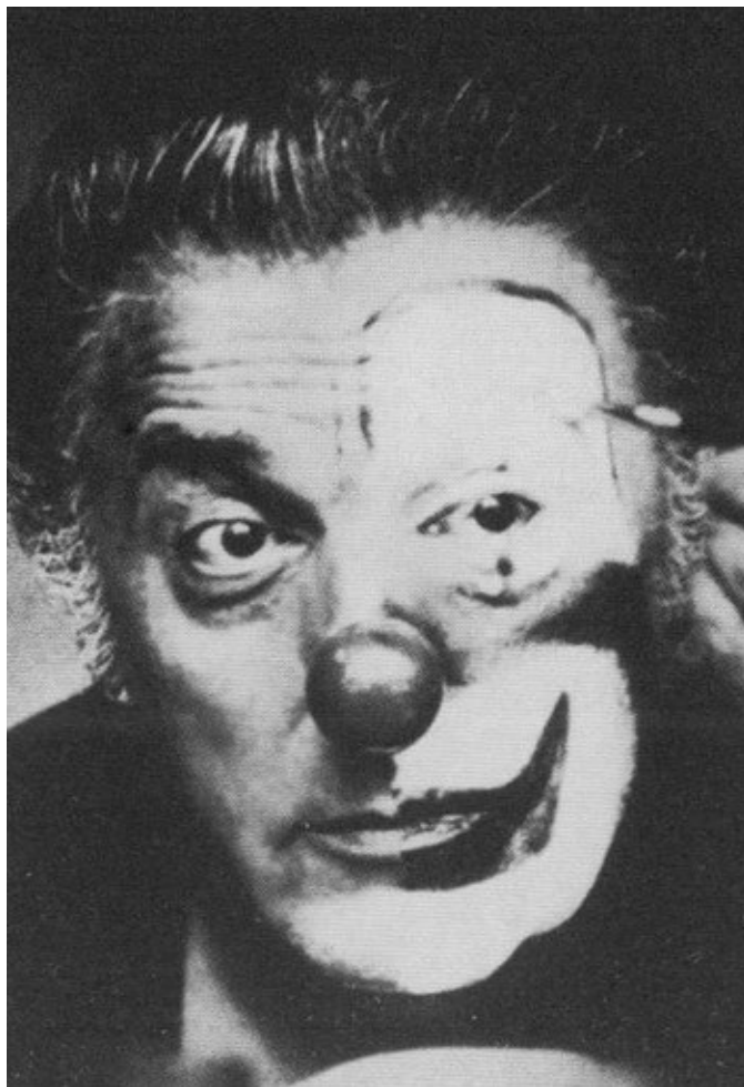
Клоун, любимый образ Феллини