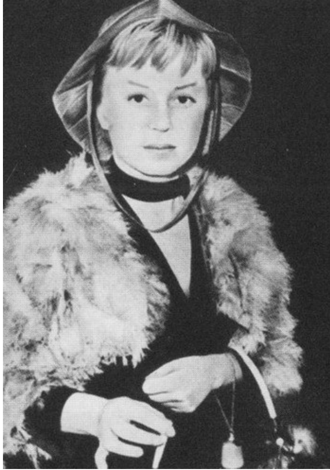
Джульетта Мазина в фильме «Ночи Кабирии». 1957 г.