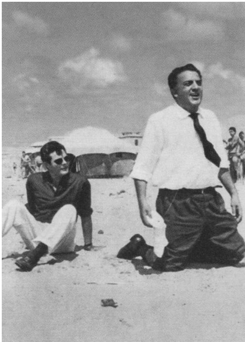
Марчелло Мастроянни и Федерико Феллини на съемках фильма «Сладкая жизнь». 1959 г.