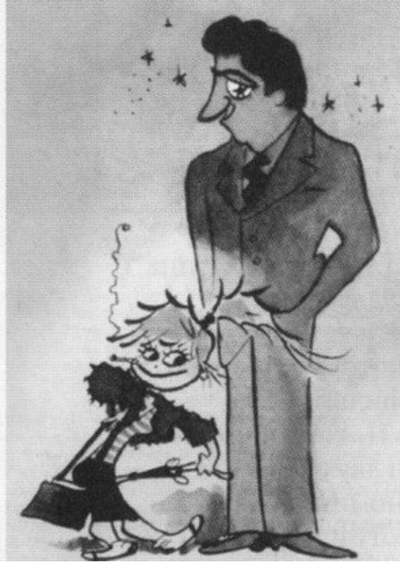
Рисунки Феллини, сделанные им во время съемок фильма «Ночи Кабирии»