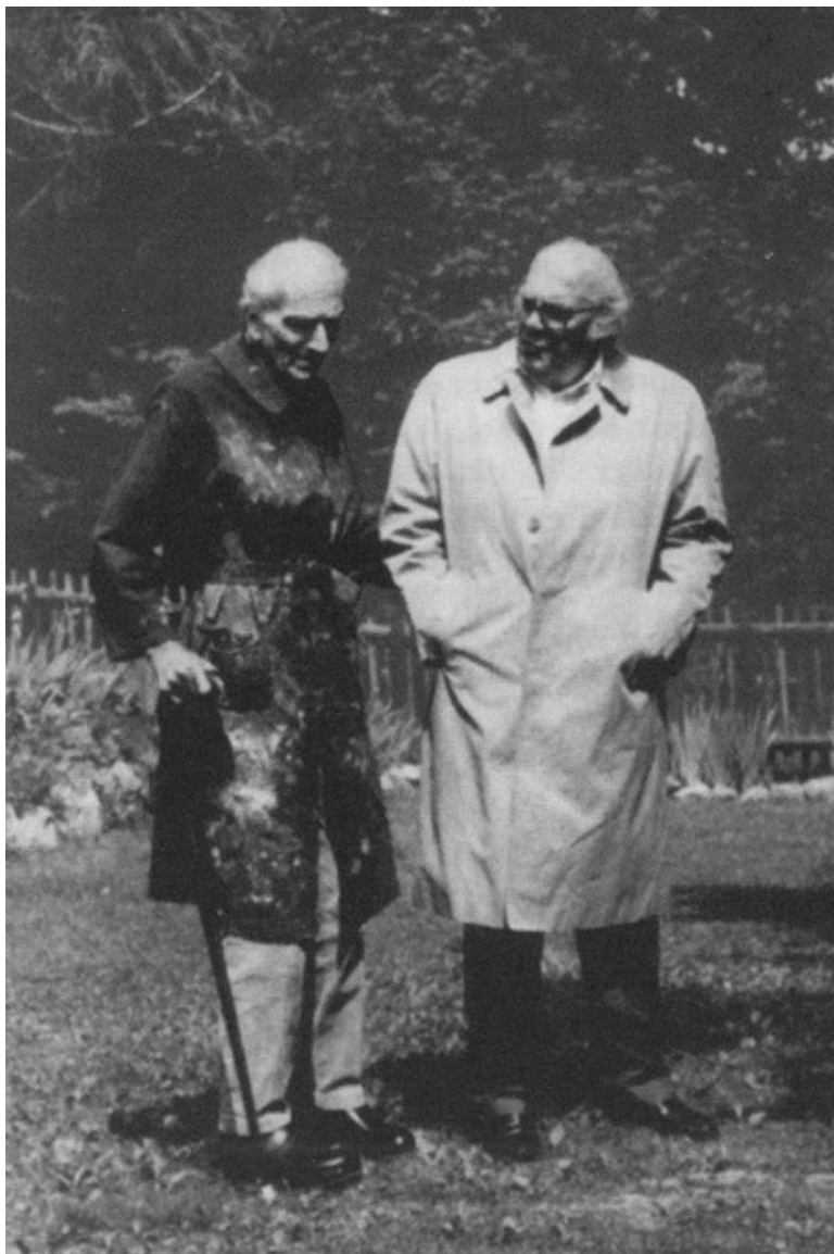
Феллини (справа) в гостях у французского художника Бальтазара Клоссовски (Бальтюса). Россиньер, Швейцарские Альпы, 1992 г.