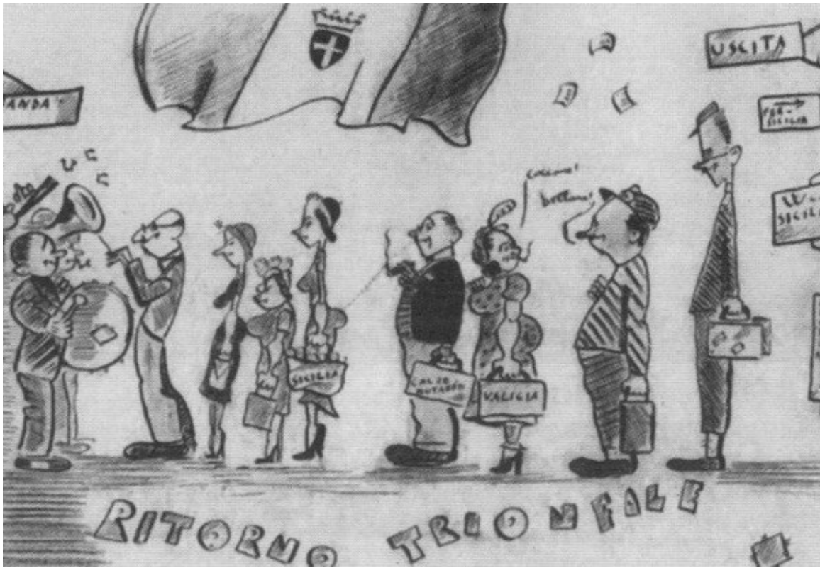
Обитатели Римини в изображении юного Федерико. Римини, 1936–1937