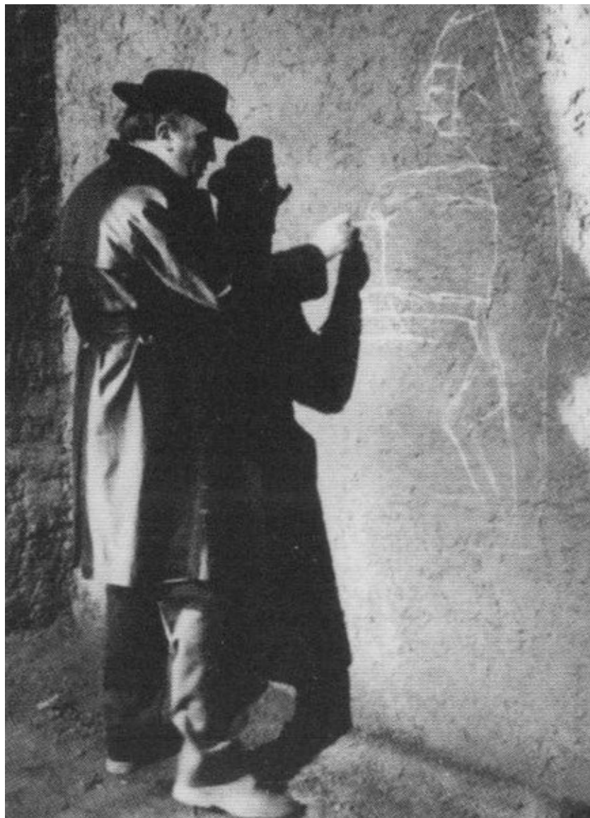
Феллини набрасывает контур персонажа к картине «И корабль плывет». 1983 г.