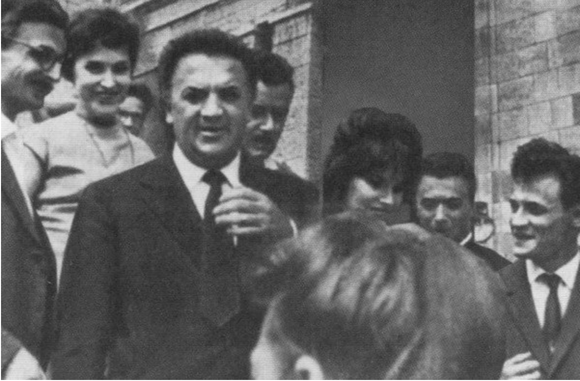
Феллини среди москвичей. 1963 г.