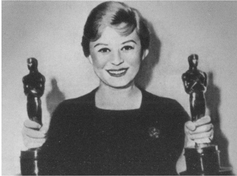
Джульетта Мазина с двумя «Оскарами», которые получил фильм «Ночи Кабирии» в двух номинациях: «Лучший фильм на иностранном языке» и «Лучшая женская роль». 1957 г.