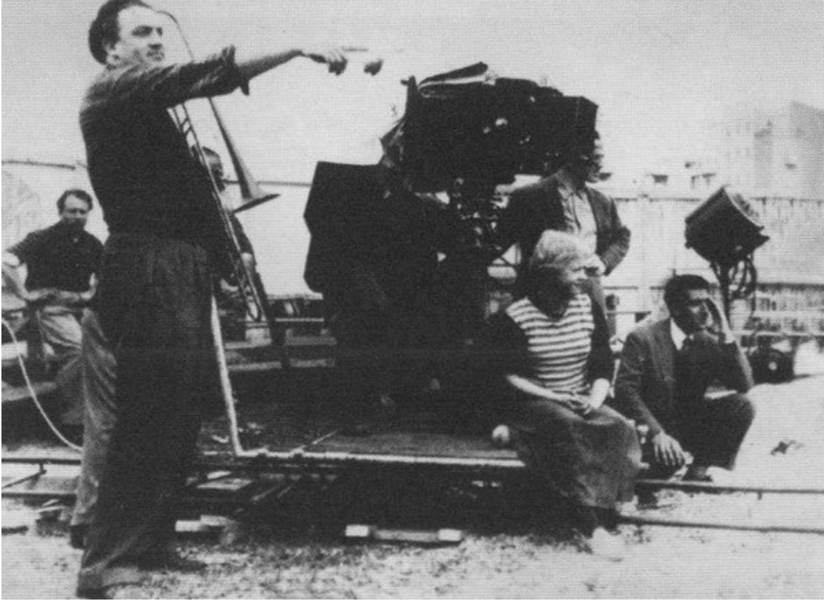
Федерико Феллини и Джульетта Мазина во время съёмок фильма «Дорога». 1954 г.