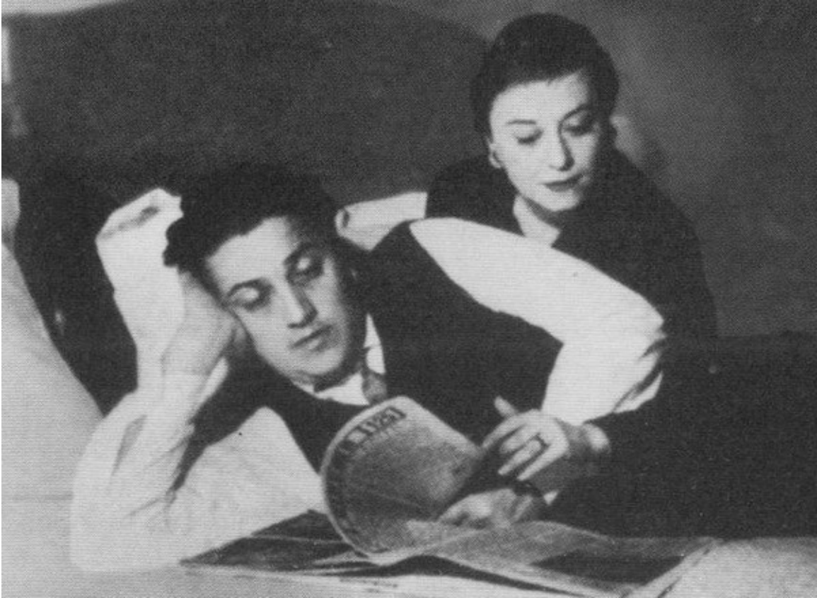
Федерико Феллини и Джульетта Мазина. 1954 г.