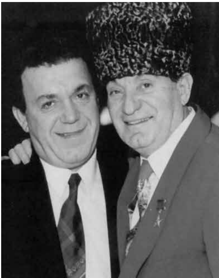
Эсамбаев и его друг Иосиф Кобзон