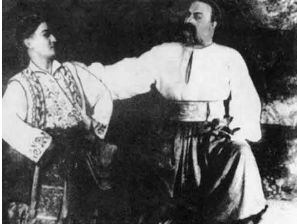
Махмуд в балете В. Соловьева-Седого «Тарас Бульба»...