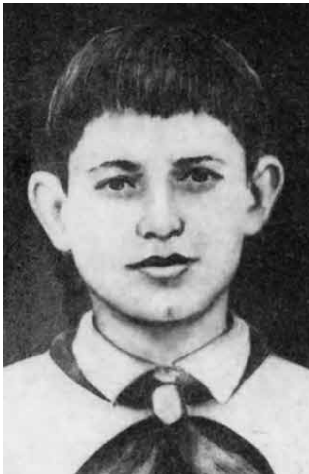
Махмуду десять лет