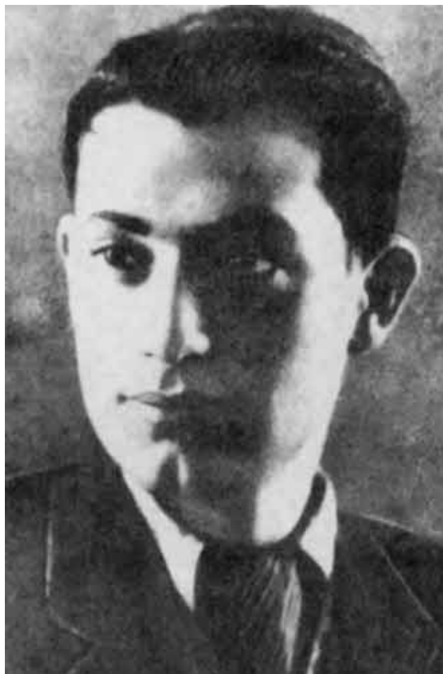
Эсамбаев — солист Киргизского государственного театра оперы и балета