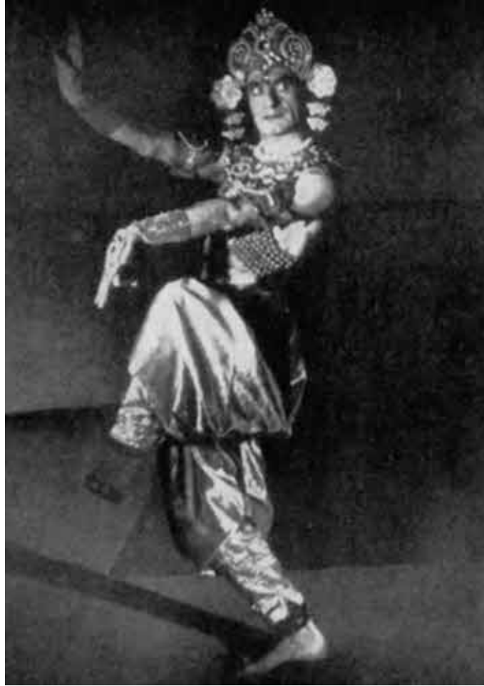
Индийский танец «Золотой бог»