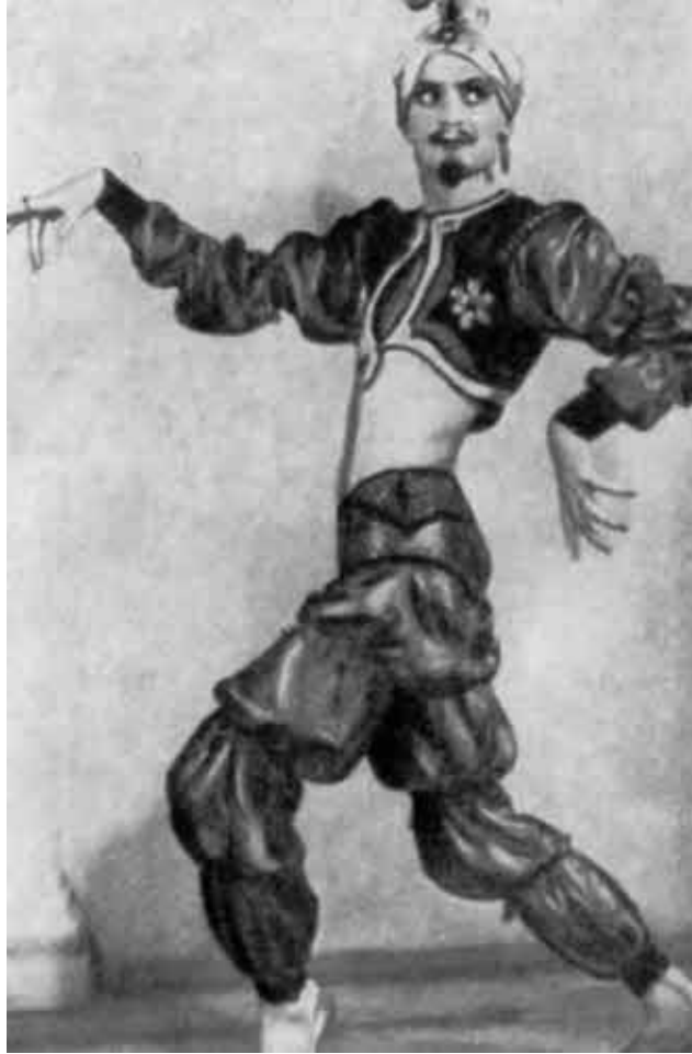
Индусский танец в опере «Лакме»