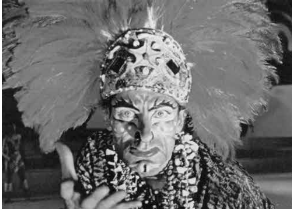
Бразильский танец «Макумба»