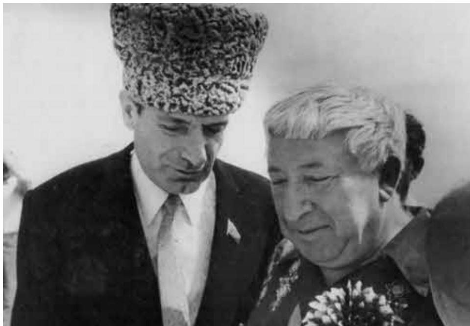
С Расулом Гамзатовым