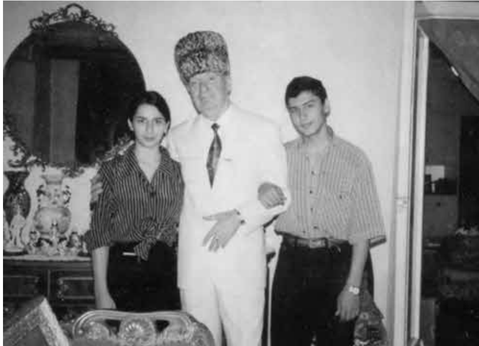
Махмуд Эсамбаев с племянниками