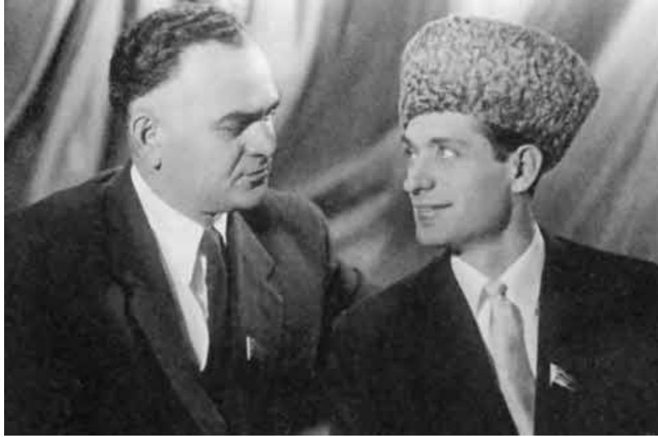
С народным артистом Чечено-Ингушетии Вахой Татиевым