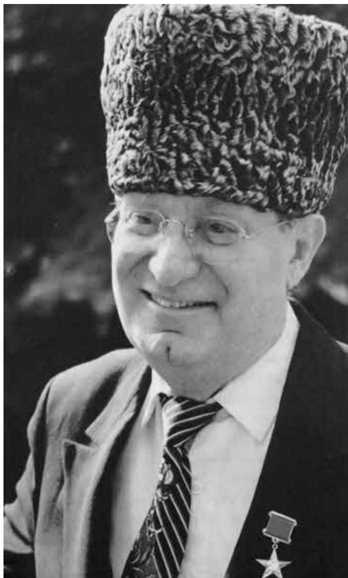
Махмуд Эсамбаев с золотой звездой Героя Социалистического Труда