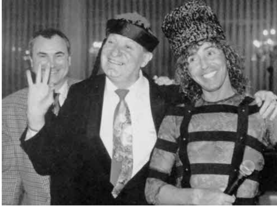
С Валерием Леонтьевым