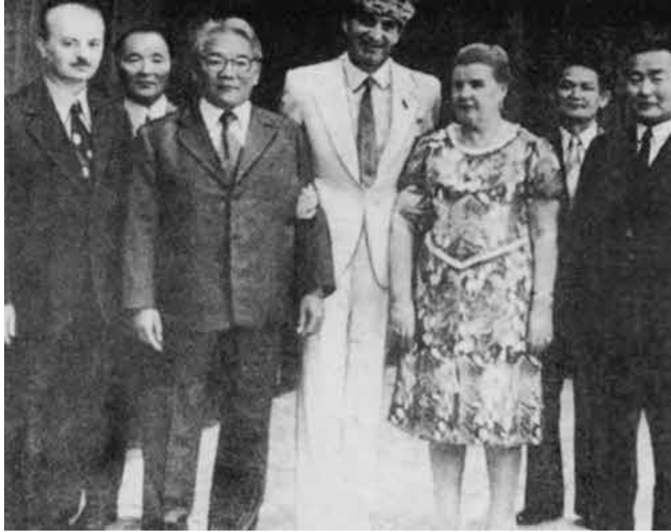
Эсамбаев в Монголии с главой государства Ю. Цеденбалом и его супругой А. Цеденбал-Филатовой