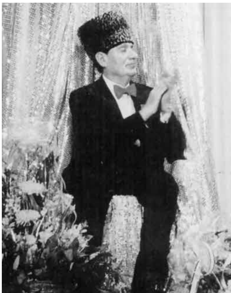
Юбиляр принимает поздравления