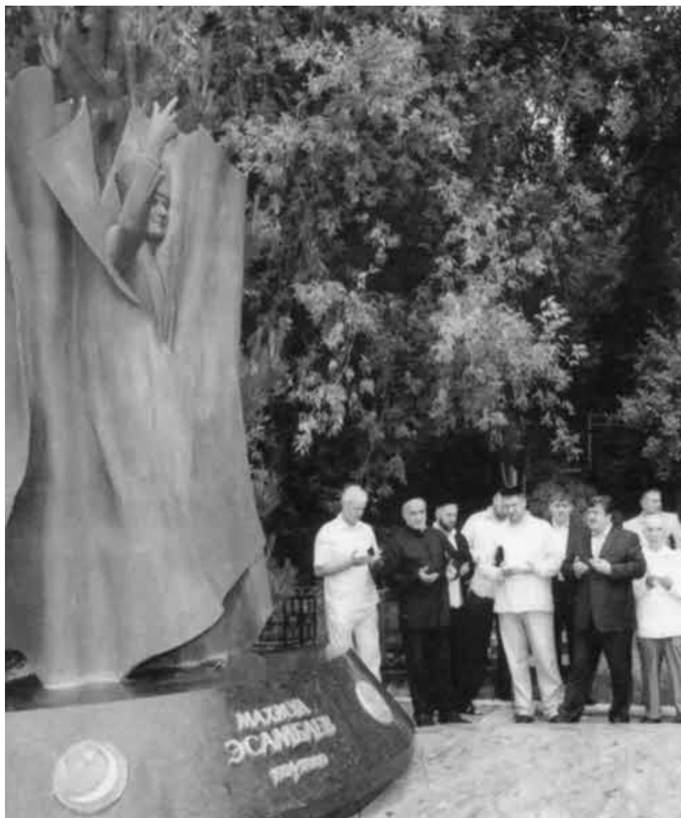
Члены координационного совета Ассоциации чеченских общественных и культурных объединений у памятника Махмуду Эсамбаеву на Даниловском кладбище в Москве