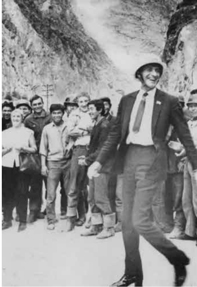
Выступление перед рабочими-нефтяниками