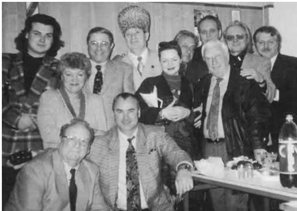
Президиум Международного союза деятелей эстрады. Эсамбаев — как обычно, в центре событий