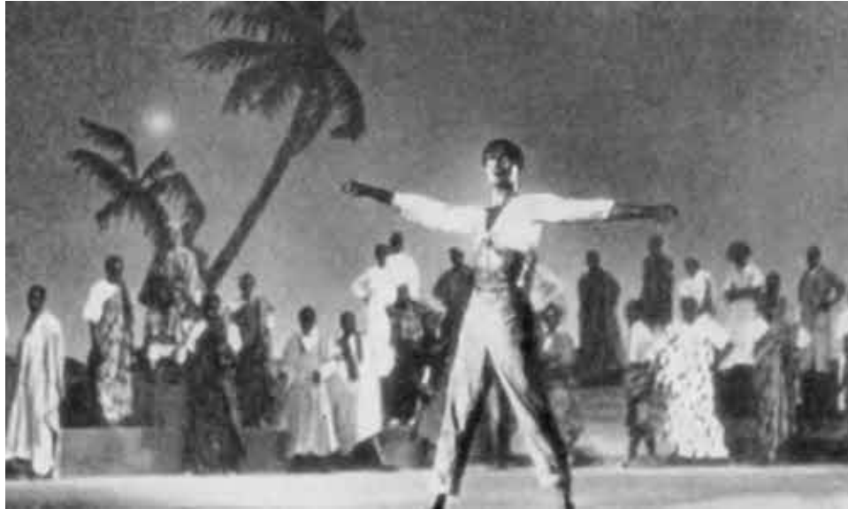
Негритянский танец. Кадр из фильма «В мире танца»