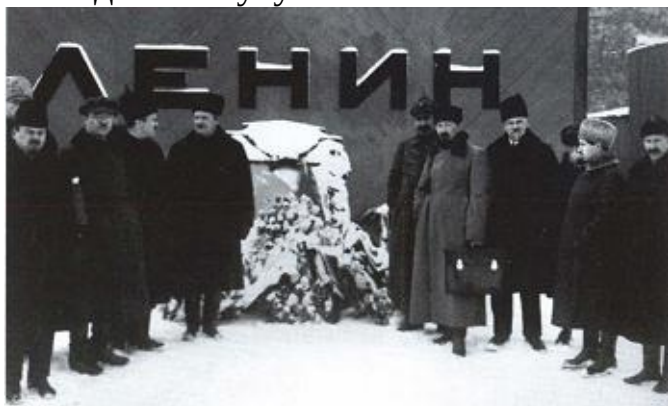
У Мавзолея Ленина. 1924 г.