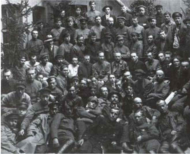
Среди делегатов III Всероссийской конференции ВЧК. Москва, февраль 1919 г.