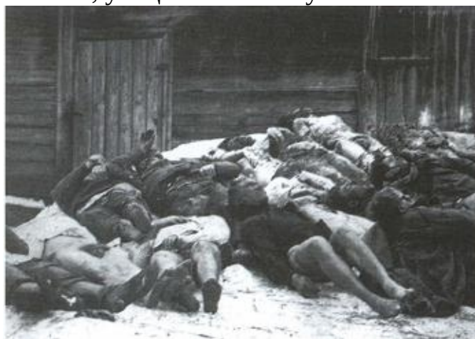
Убитые продотрядовцы — первые жертвы противостояния между городом и деревней