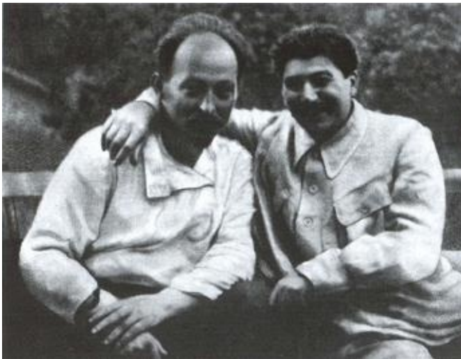
С Иосифом Сталиным. Июнь 1922 г.