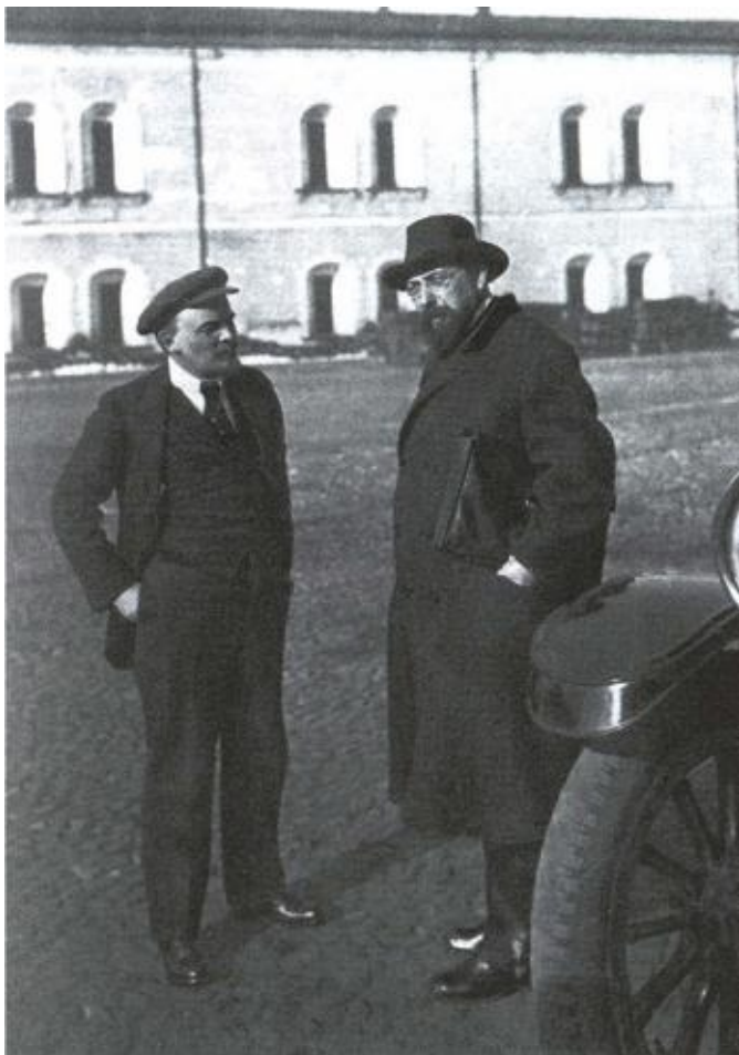
В. Ленин и В. Бонч-Бруевич во дворе Кремля. 16 октября 1918 г.