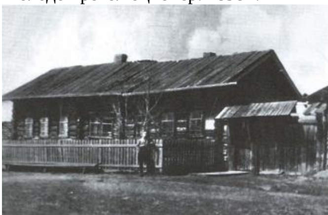
Дом в «ненавистном Кае», где жил ссыльный Дзержинский в 1898—1899 годах