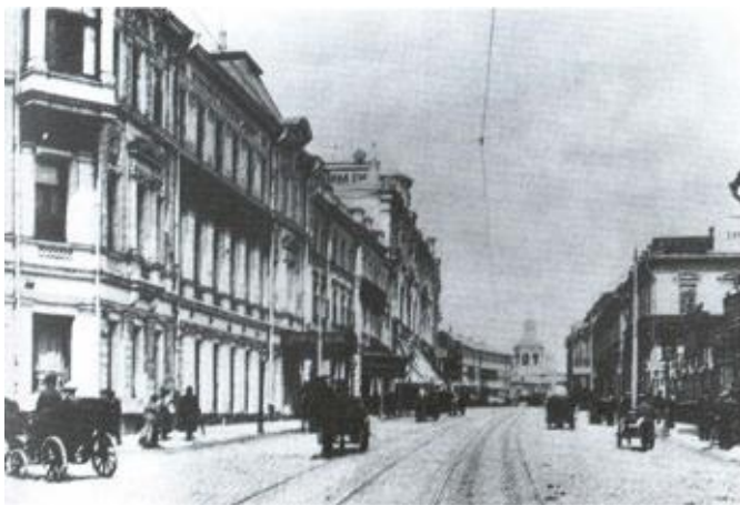
Москва, улица Большая Лубянка