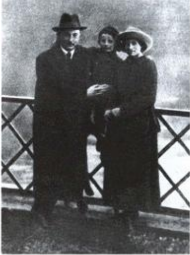
С семьей в Лугано. Октябрь, 1918 г.