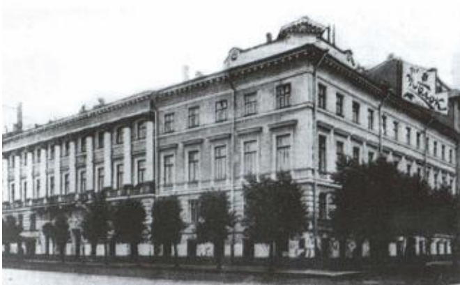
Петроград, Гороховая, 2. Здесь 9 декабря 1917 года разместилась ВЧК