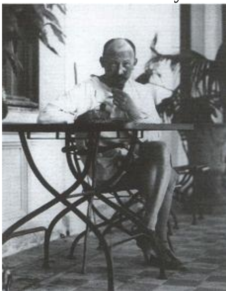
На отдыхе в Сухуми. 1922 г.