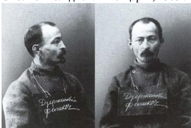
Тюремные фотографии. Орловский централ. 1914 г.