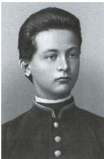
Гимназист. 1895 г.