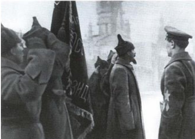
На параде войск ВЧК на Красной площади. Москва, декабрь 1921 г.