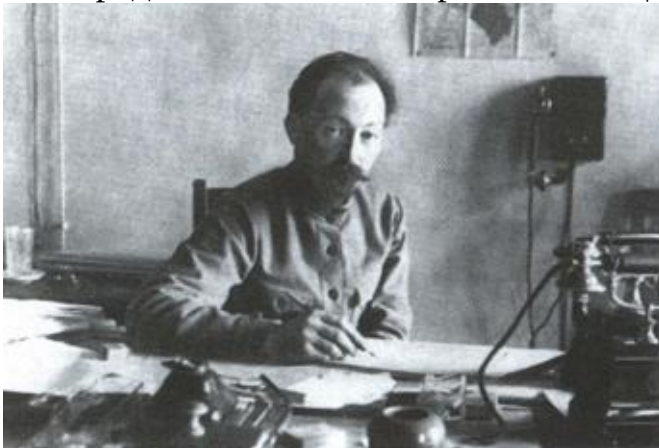
Председатель ВЧК в своем кабинете. 1921 г.