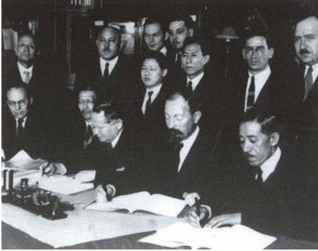
Председатель ВСНХ подписывает соглашение с японской торговой делегацией. 1925г.