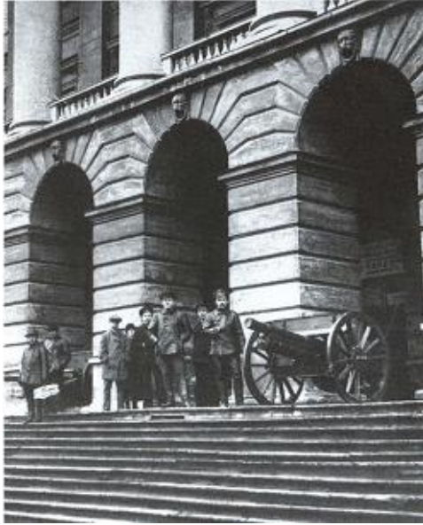
Штаб революции — Смольный, комендантом которого в дни Октября был Дзержинский