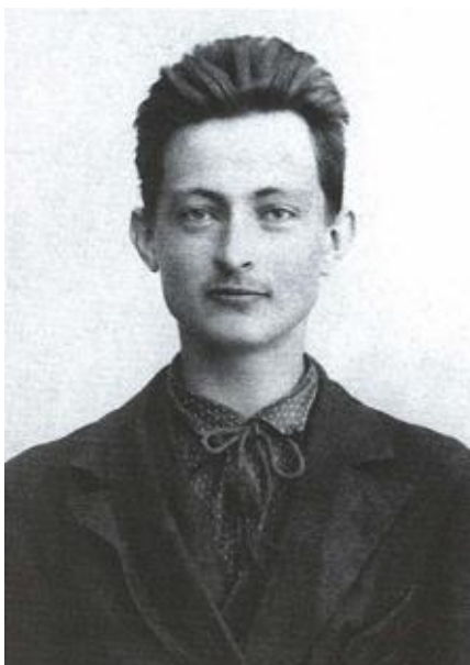
Молодой революционер. 1898 г.