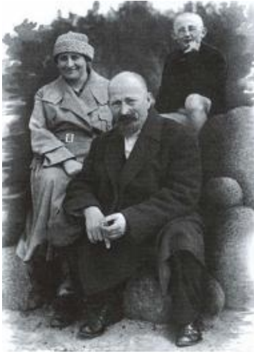
С женой и сыном. 1925 г.