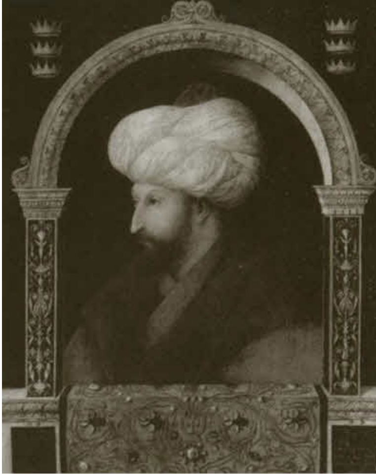
Султан Мехмед II Завоеватель.