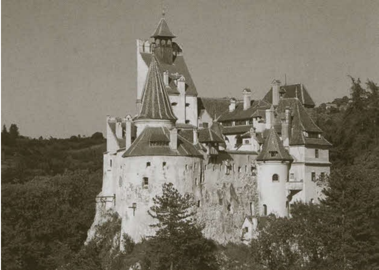
Замок Бран в Трансильвании, ошибочно называемый «замком Дракулы»