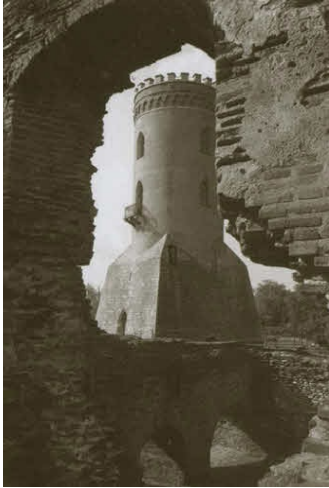
Башня Киндия, с которой господарь наблюдал за казнями