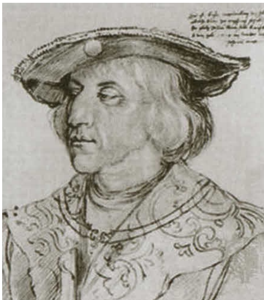
Король Венгрии Матьяш Корвин