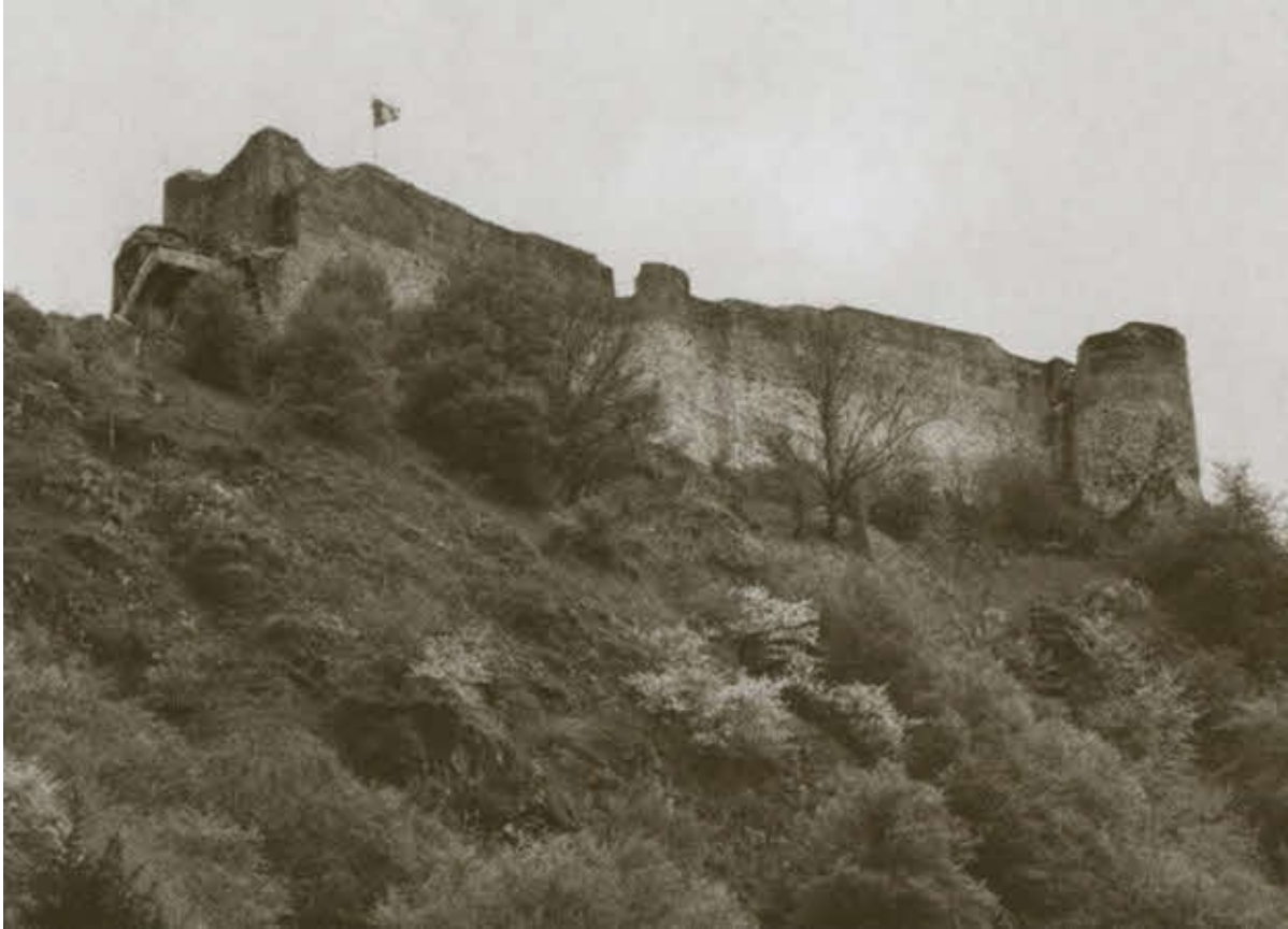
Руины крепости Поенари