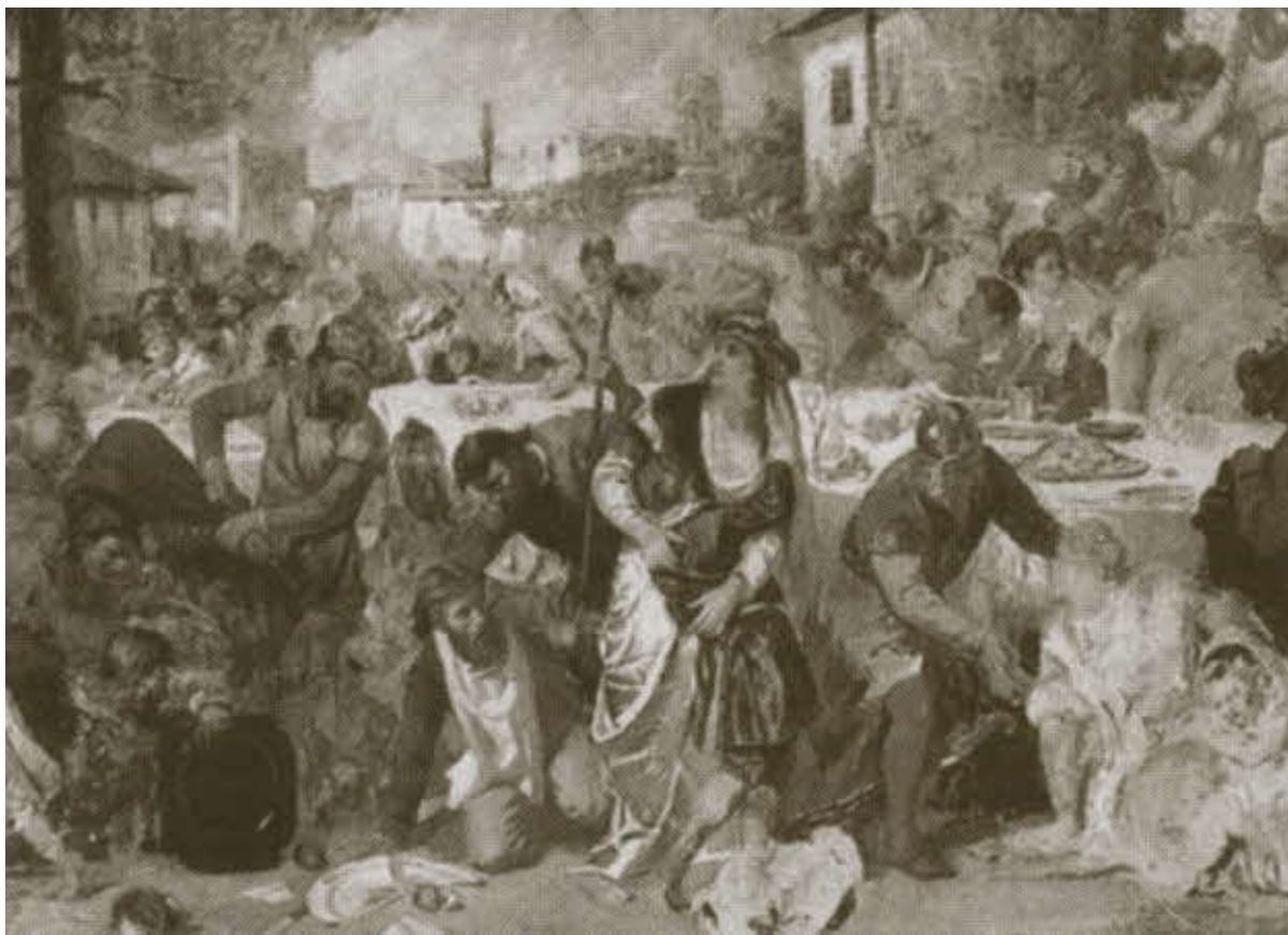
Арест бояр на княжеском пиру. Картина Теодора Амана. 1887 г.