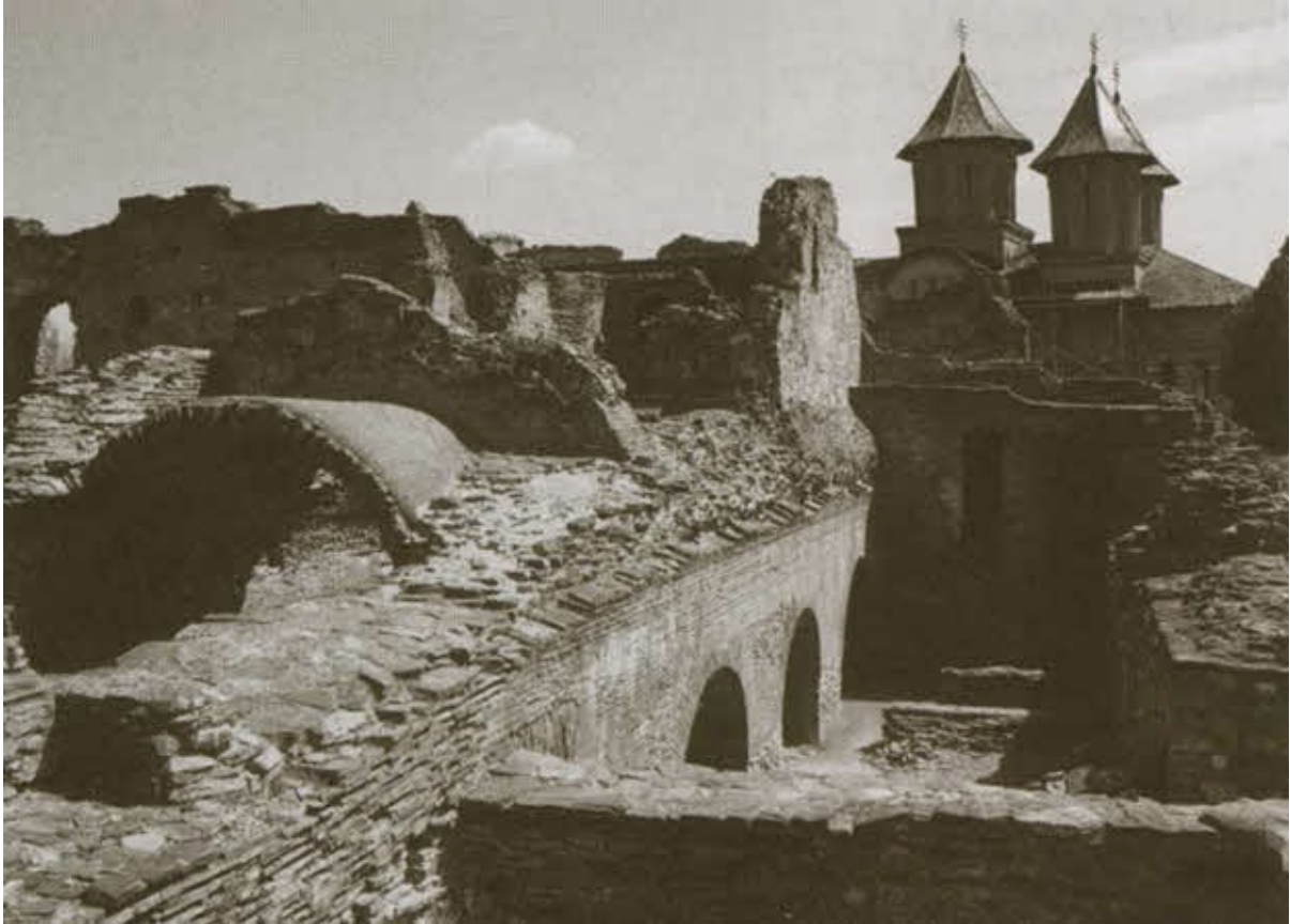
Развалины дворца Дракулы в Тырговиште