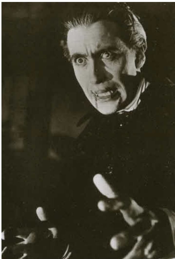
Кристофер Ли в фильме Х. Франко «Граф Дракула» (1970)