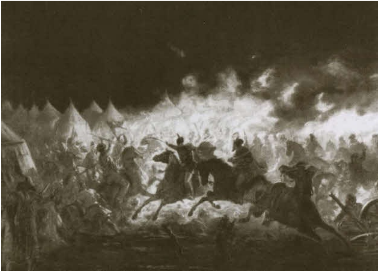
Ночная атака на турецкий лагерь.