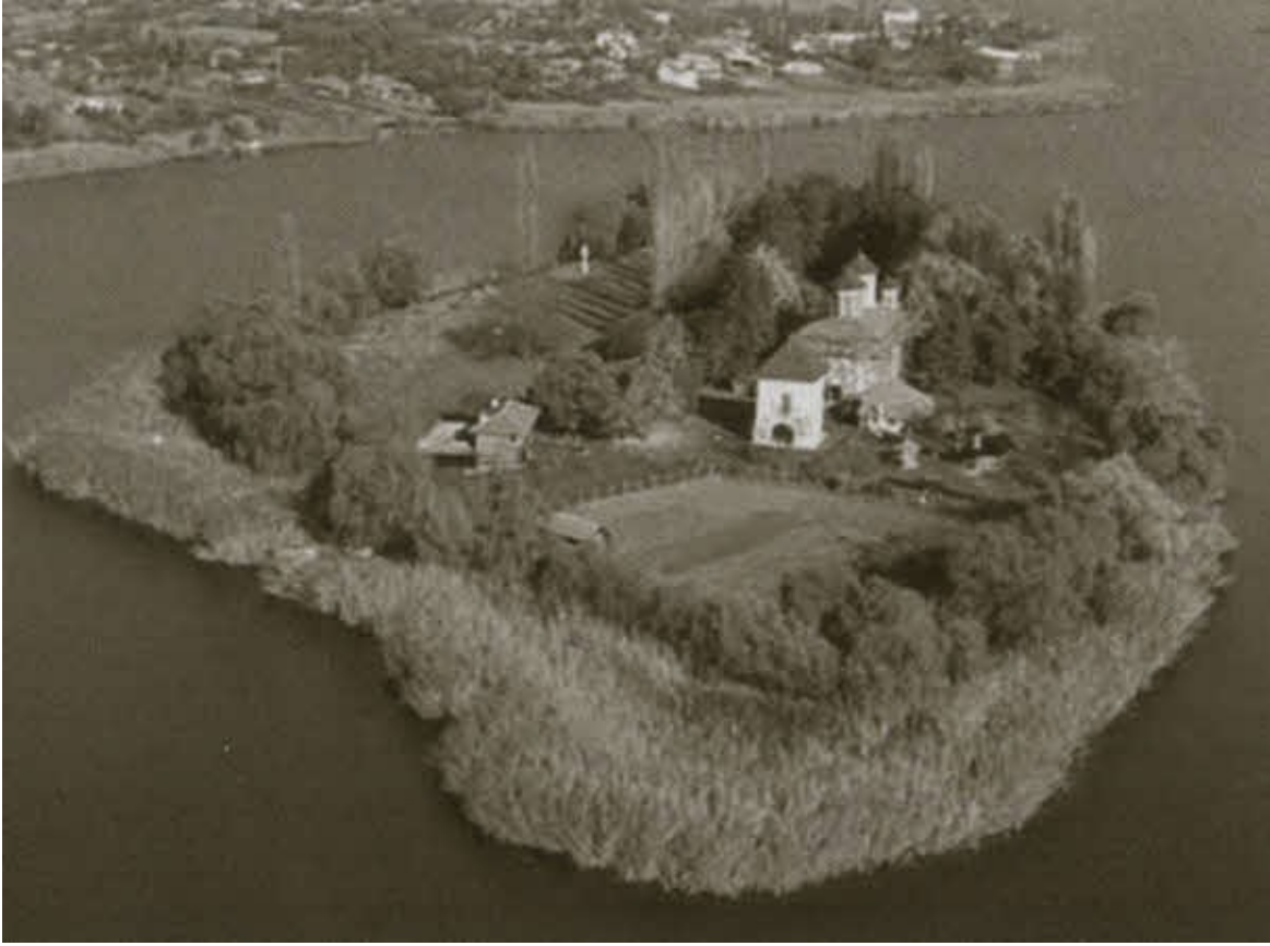
Монастырь Снагов на одноименном озере