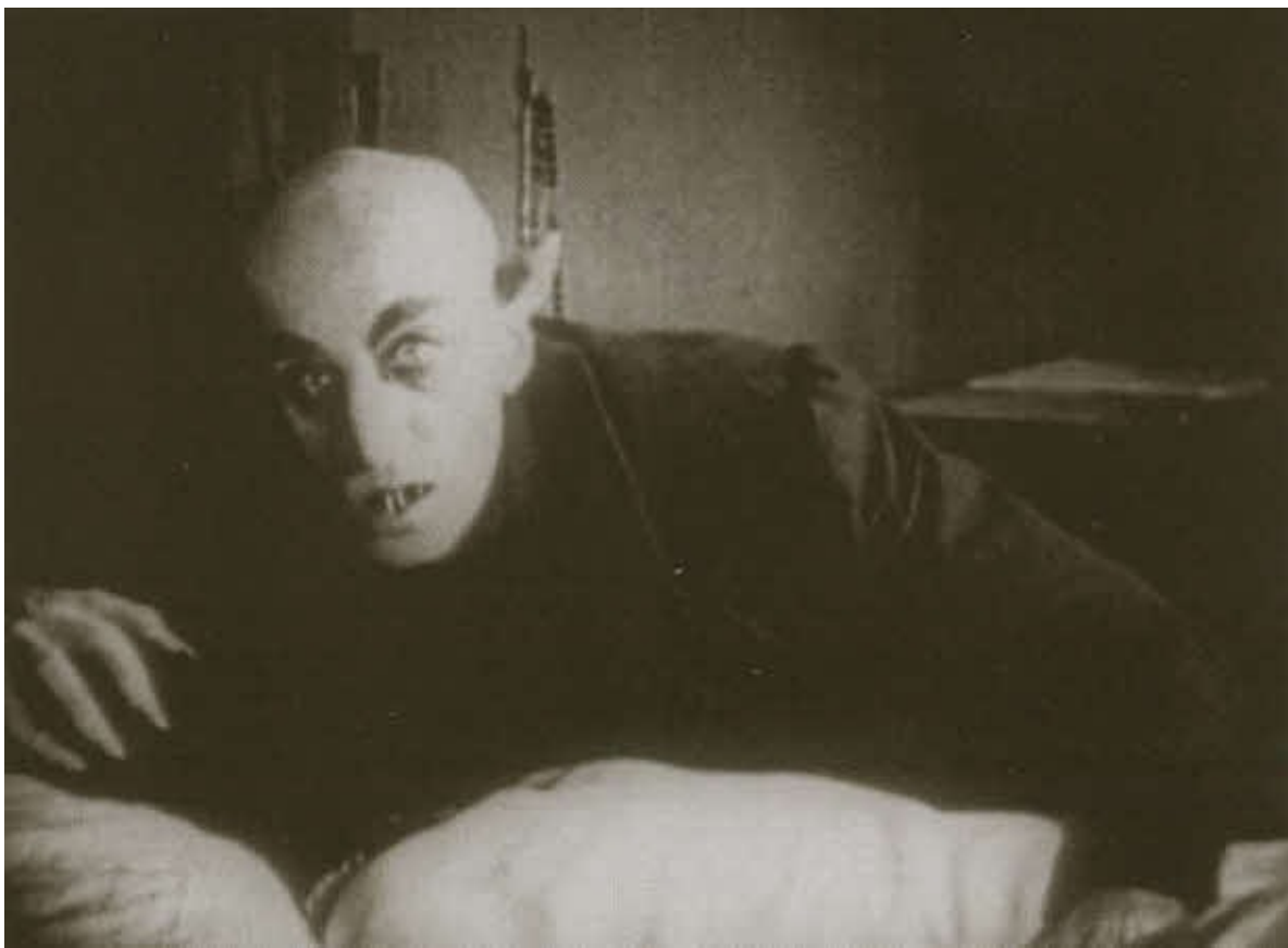
Макс Шрек в первой экранизации «Дракулы» — фильме Ф. Мурнау «Носферату, симфония ужаса» (1922)