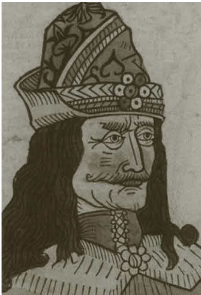
Портрет воеводы из немецкого первопечатного издания. 1488 г.