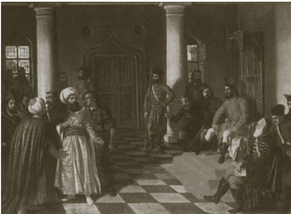
Влад Цепеш и турецкие послы.