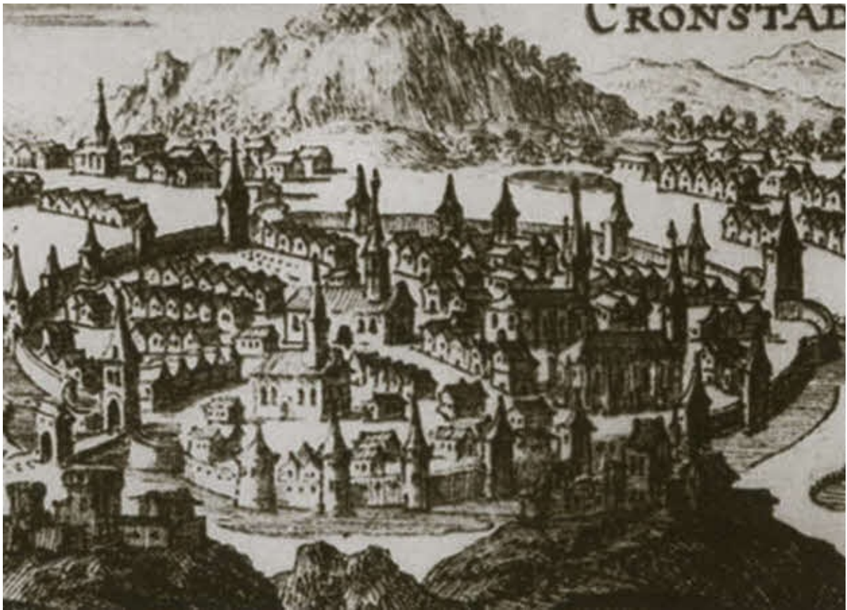
Вид Брашова (Кронштадта) в XVI веке