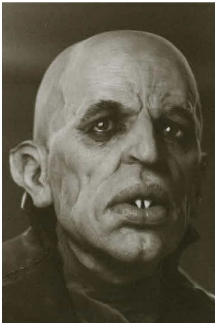
Клаус Кински в фильме В. Херцога «Носферату, призрак ночи» (1978)