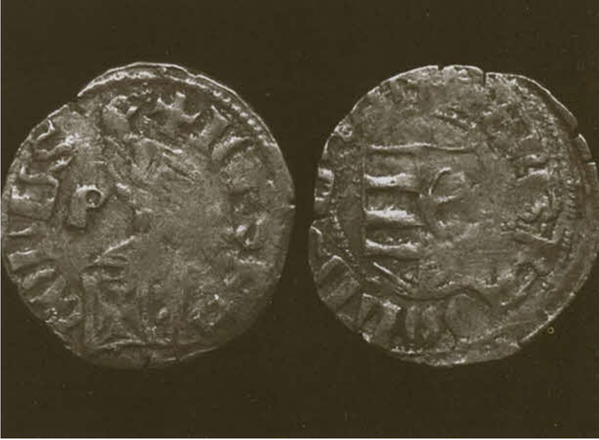
Серебряная аспра Влада Дракулы