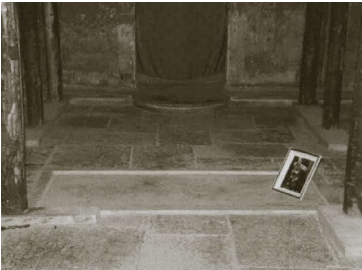
Предполагаемая могила Дракулы в Снагове