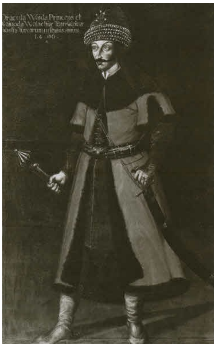
Единственный портрет Дракулы в полный рост, возможно, выполненный с натуры, находится в галерее австрийского замка Форхтенштайн