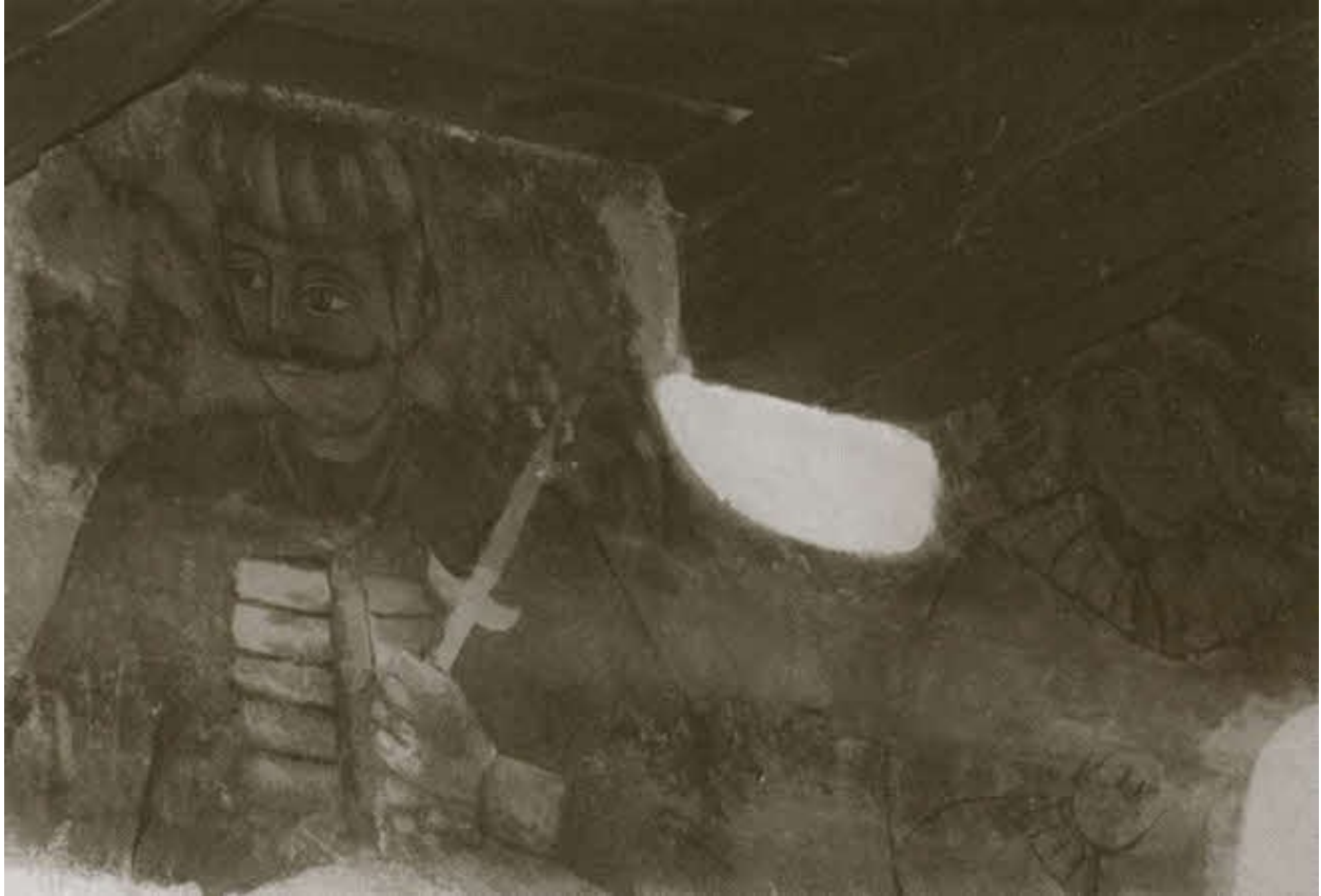
Портреты Влада Дракулы и его жены в их трансильванском доме