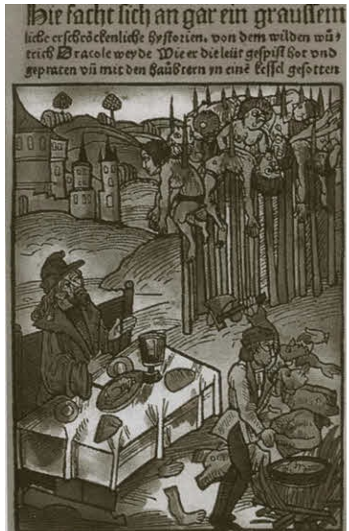
Дракула пирует среди своих жертв. Гравюра 1499 г.