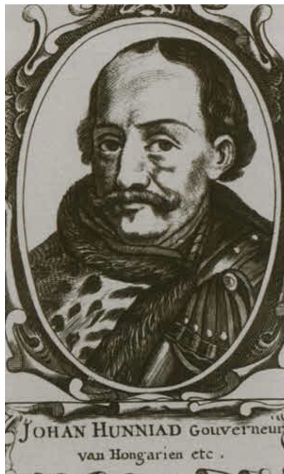
Воевода Янош Хуньяди