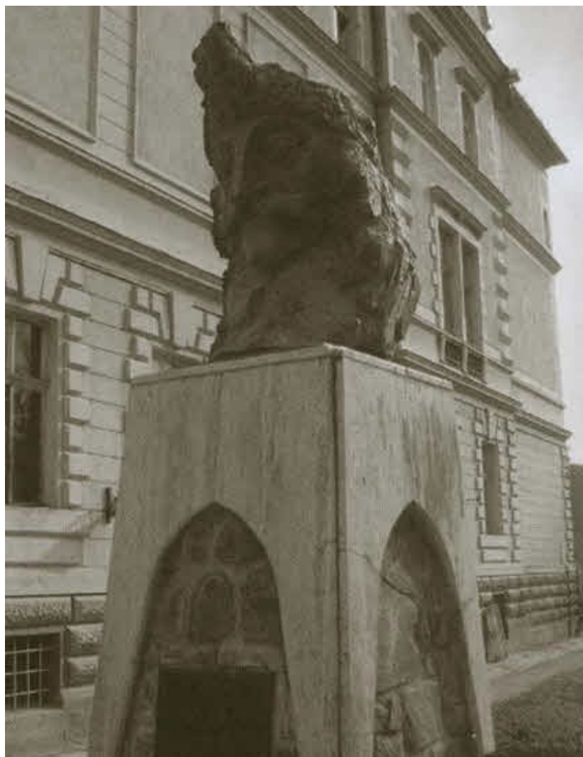
Памятник Дракуле в Сигишоаре