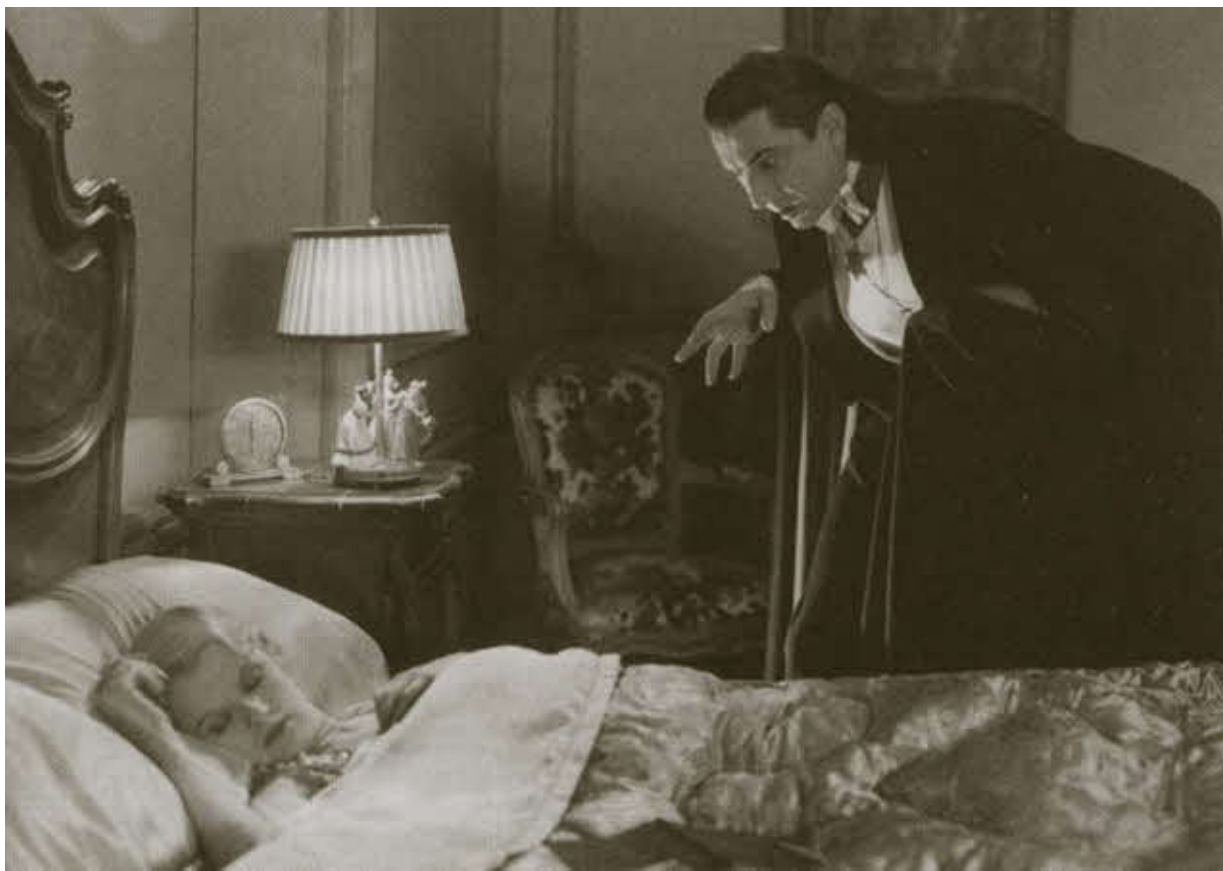
Бела Лугоши в фильме Т. Браунинга «Граф Дракула» (1931)