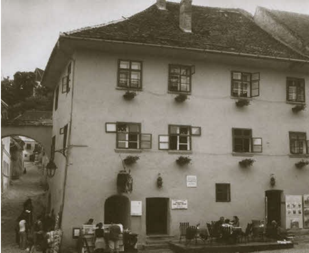
Дом в городе Сигишоара — место рождения Влада Дракулы. Мемориальная доска на доме посвящена не Дракуле, а его отцу