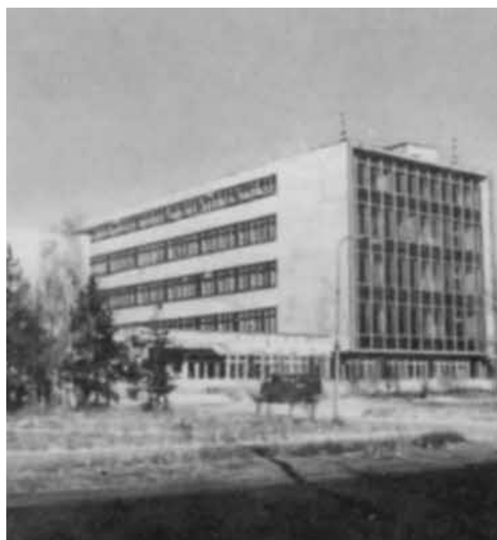
Здание ХМИ, построенное в 1972 году