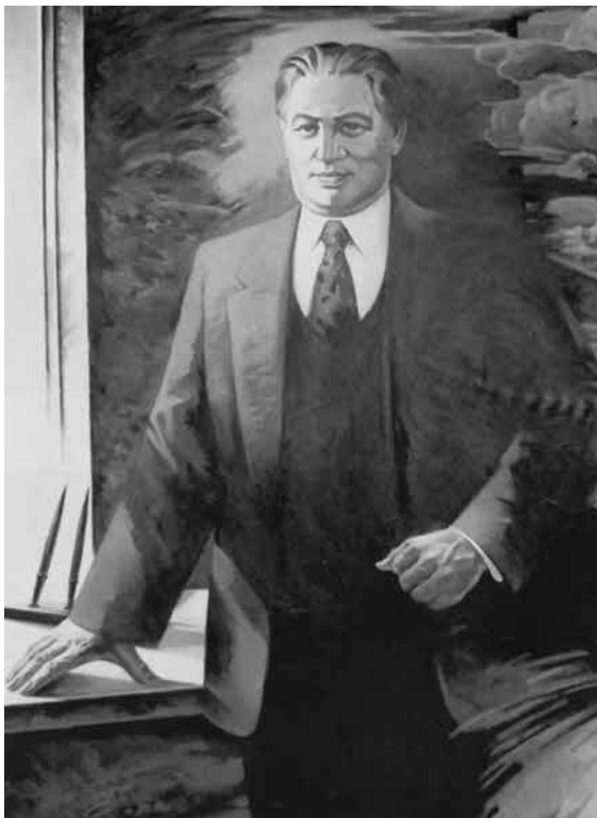
Портрет академика Е. А. Букетова.