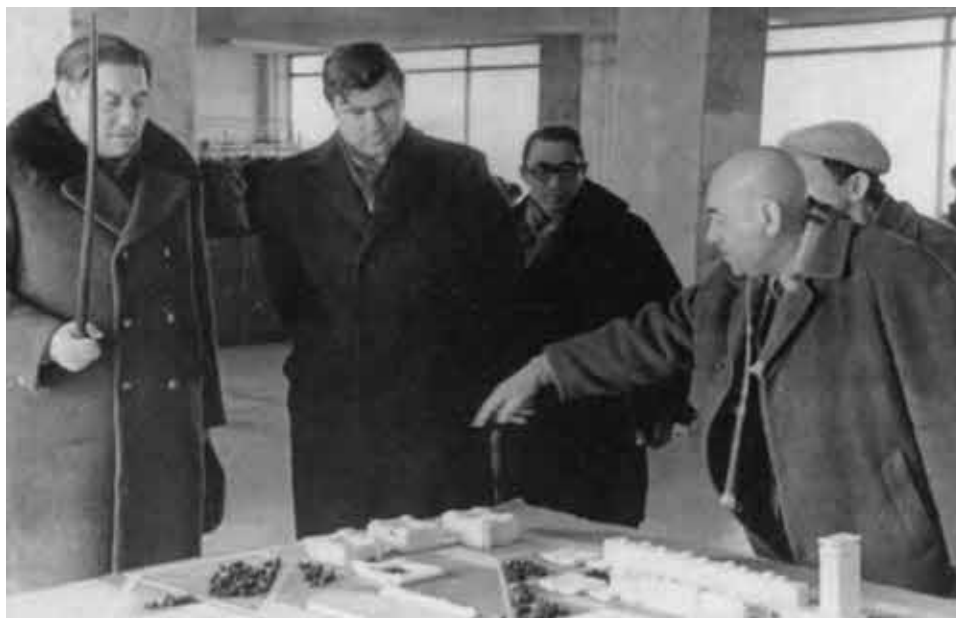
Обсуждение проекта Университетского городка. 1974 год