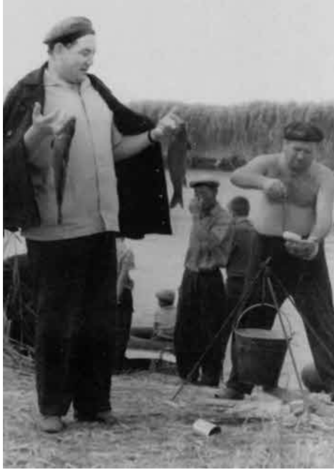
В редкие часы отдыха