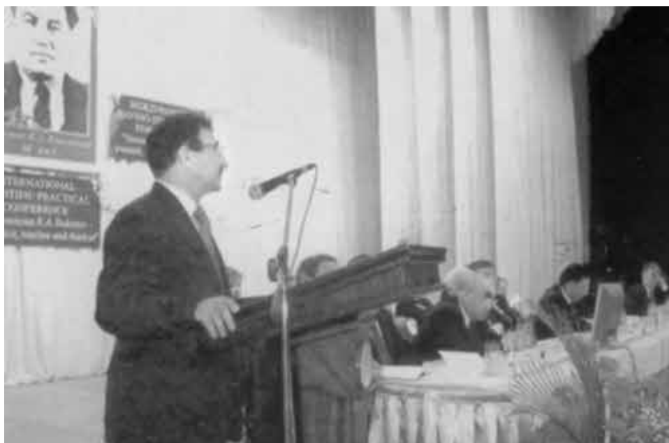
На трибуне — талантливый продолжатель научных поисков Евнея Арыстанулы — директор