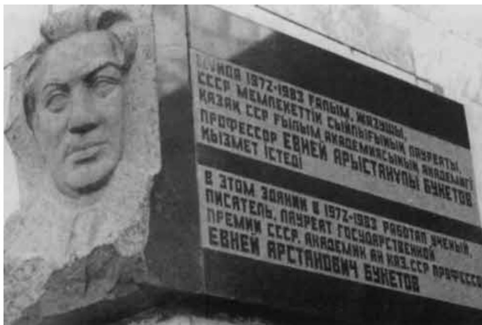
В 1987 году на его фасаде появилась мемориальная доска