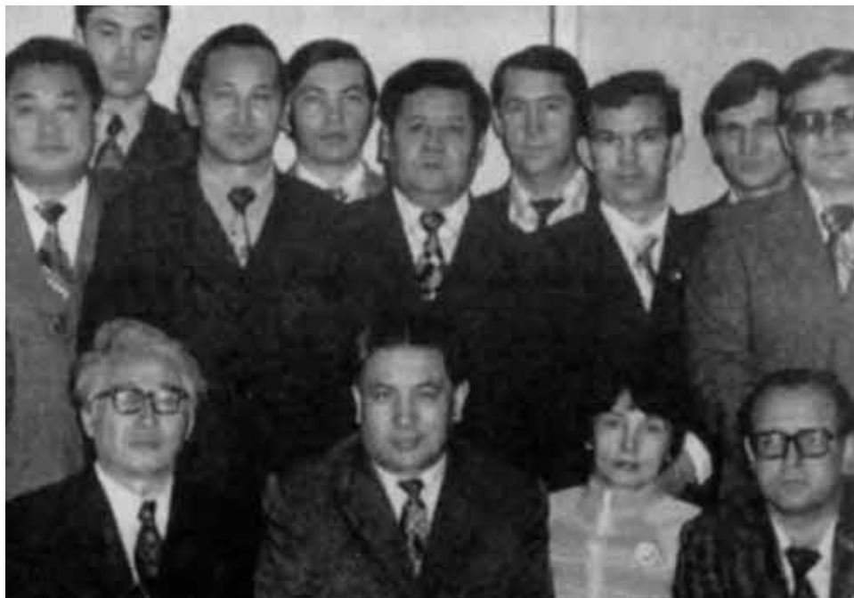
С группой научных сотрудников ХМ И и коллегами из других НИИ