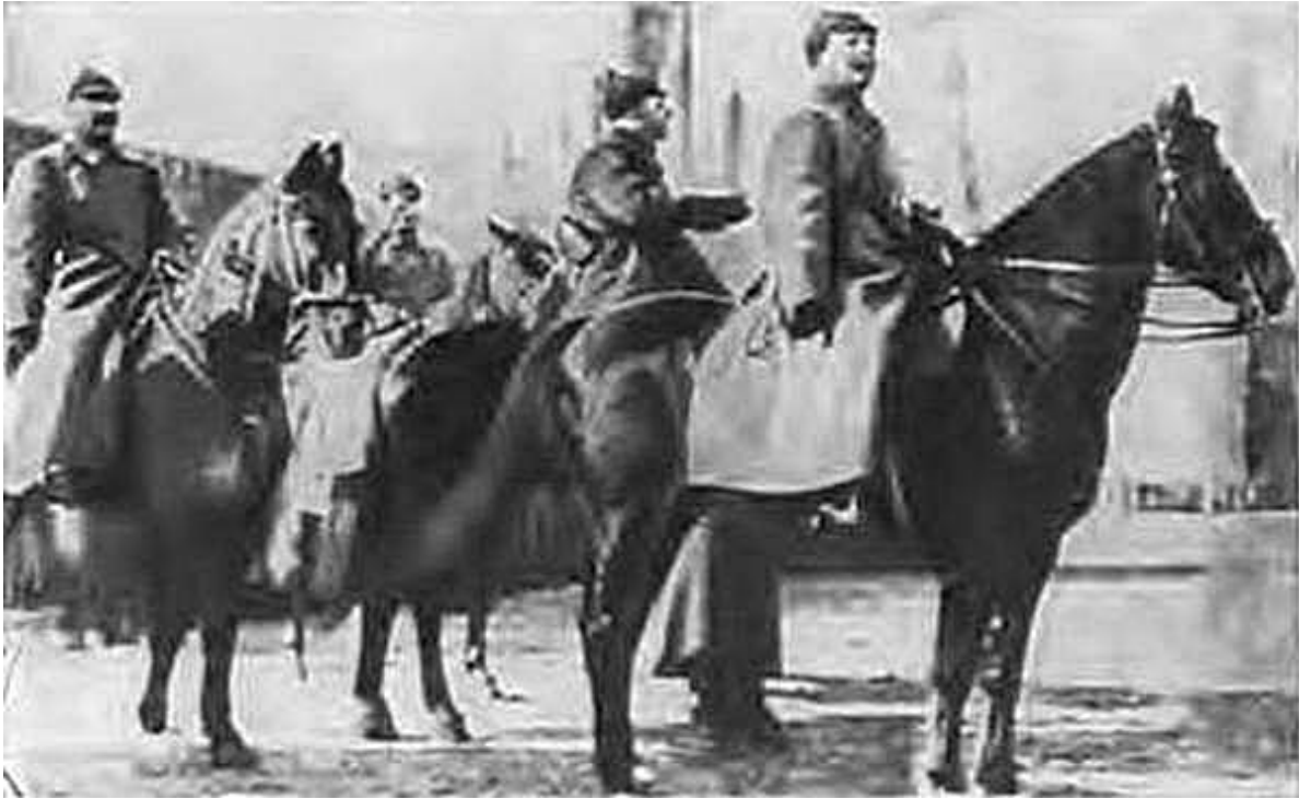
М. В. Фрунзе и С. М. Буденный на военном параде в честь Великого Октября. Москва, 1923 г.