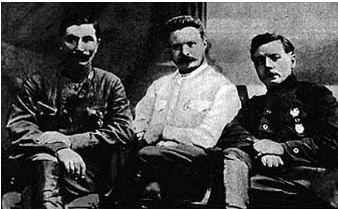
С. М. Буденный, М. В. Фрунзе, К. Е. Ворошилов на Южном фронте.