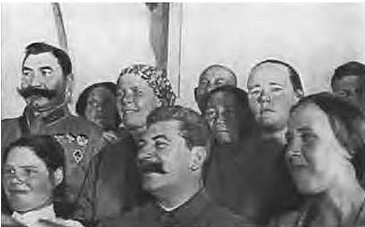
И. В. Сталин, С. М. Буденный и Мария Демченко в группе участниц II Всесоюзного съезда колхозников-ударников. Москва, 1935 г.