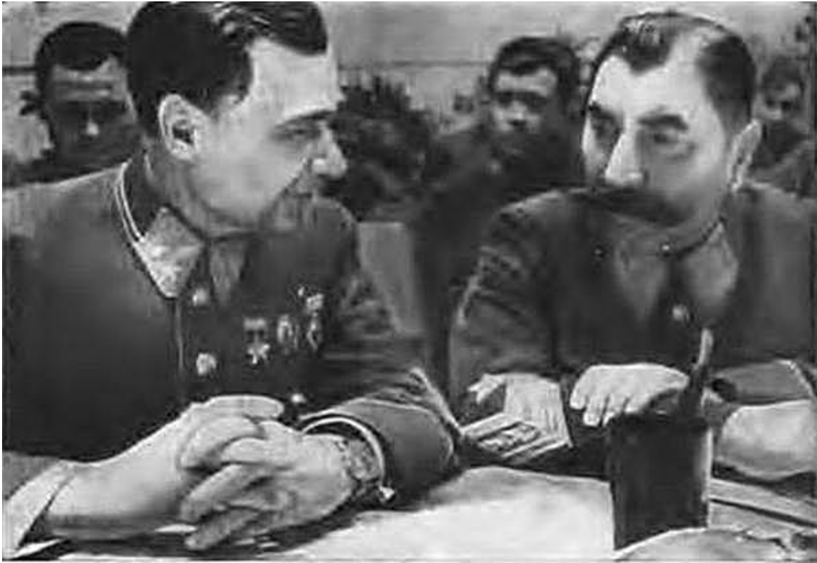
На партийной конференции Ленинградского военного округа. С. М. Буденный и командующий округом М. П. Кирпонос. 1940 г.