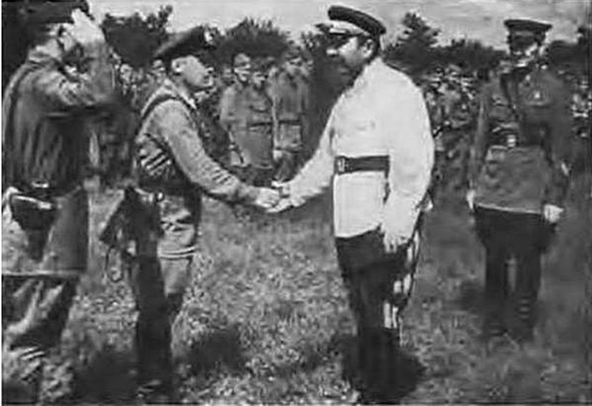
Встреча с бойцами и командирами перед отправкой на фронт. Крым, 1942 г.