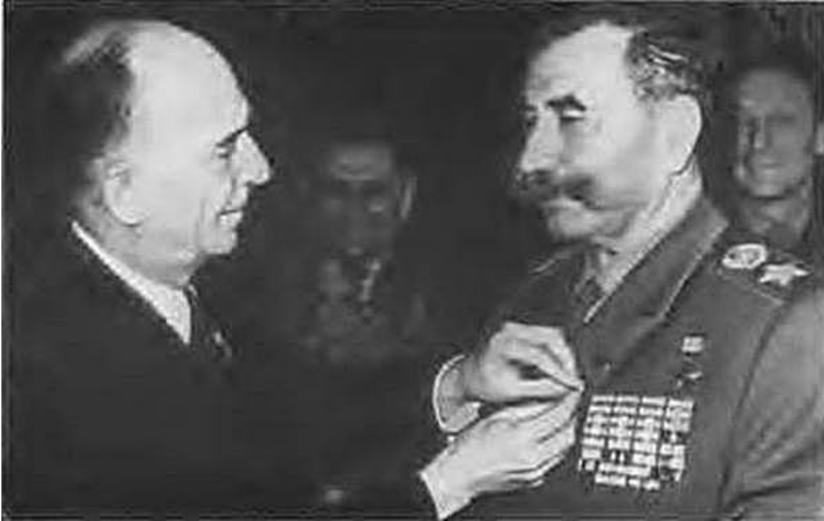
Заместитель председателя главного правления Общества польско-советской дружбы Мечислав Вонгровский поздравляет С. М. Буденного в день 80- летия. 25 апреля 1963 г.