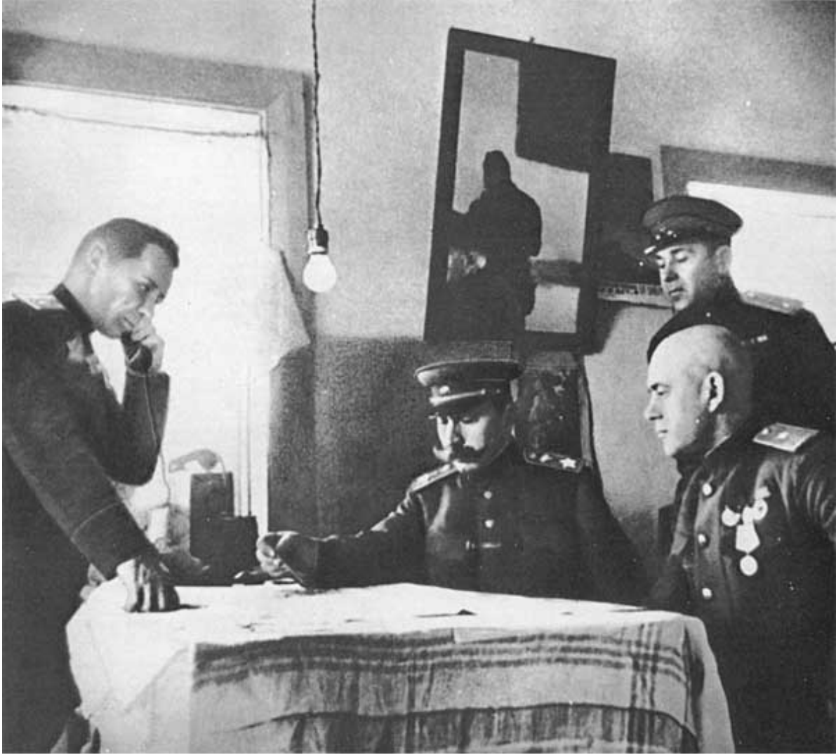
С. М. Буденный на командном пункте генерала П. И. Батова. 1943 г.