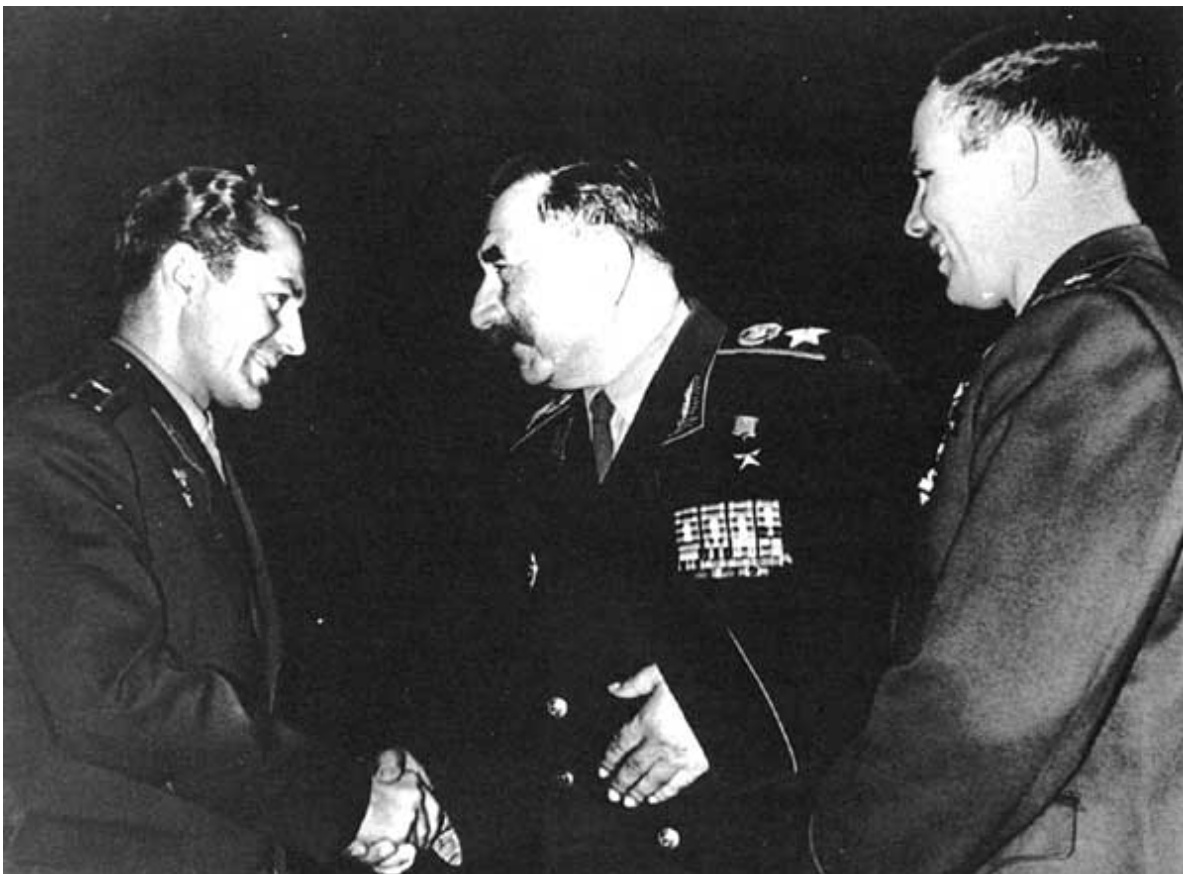
С. М. Буденный беседует с космонавтами Ю. А. Гагариным и Г. С. Титовым.