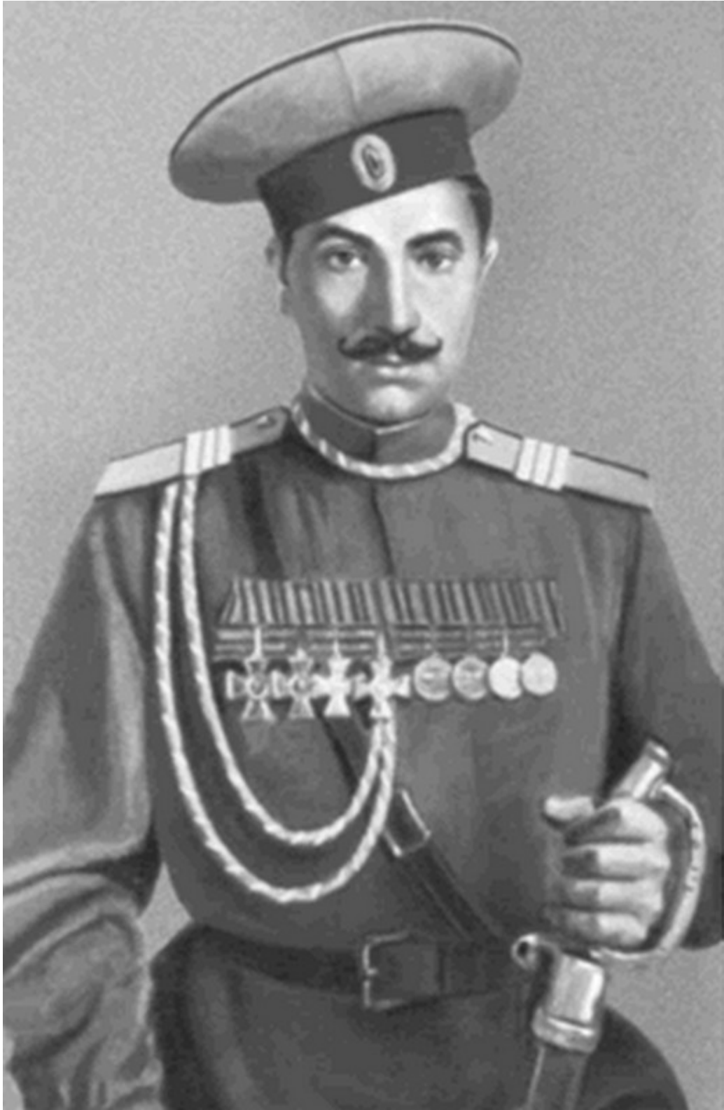
Старший унтер-офицер С. М. Буденный. 1915 г.