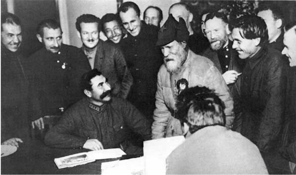
С. М. Буденный и «алтайский Сусанин» — Ф. С. Гуляев. 1929 г.