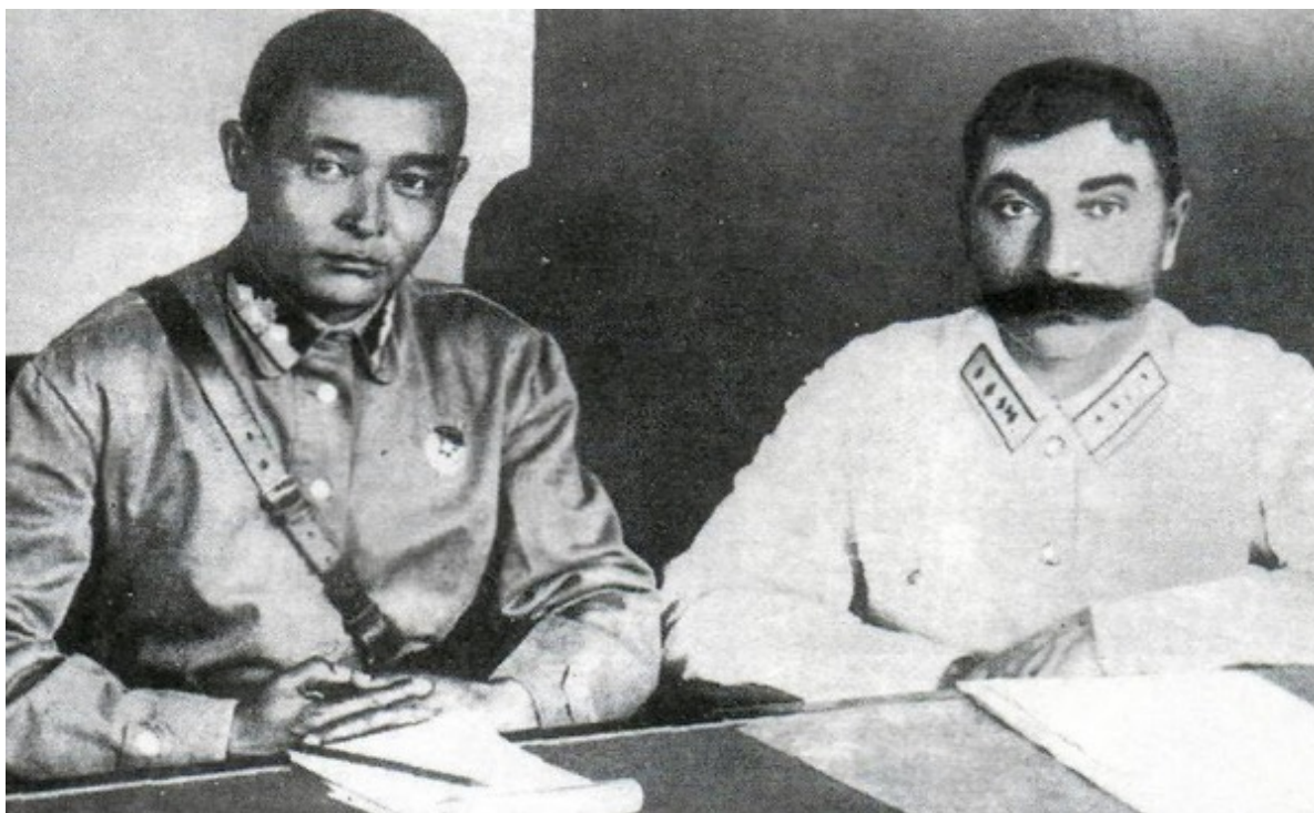
С. М. Буденный и Х. Чойбалсан.

Встреча С. М. Буденного с группой бывших партизан, 1929 г.