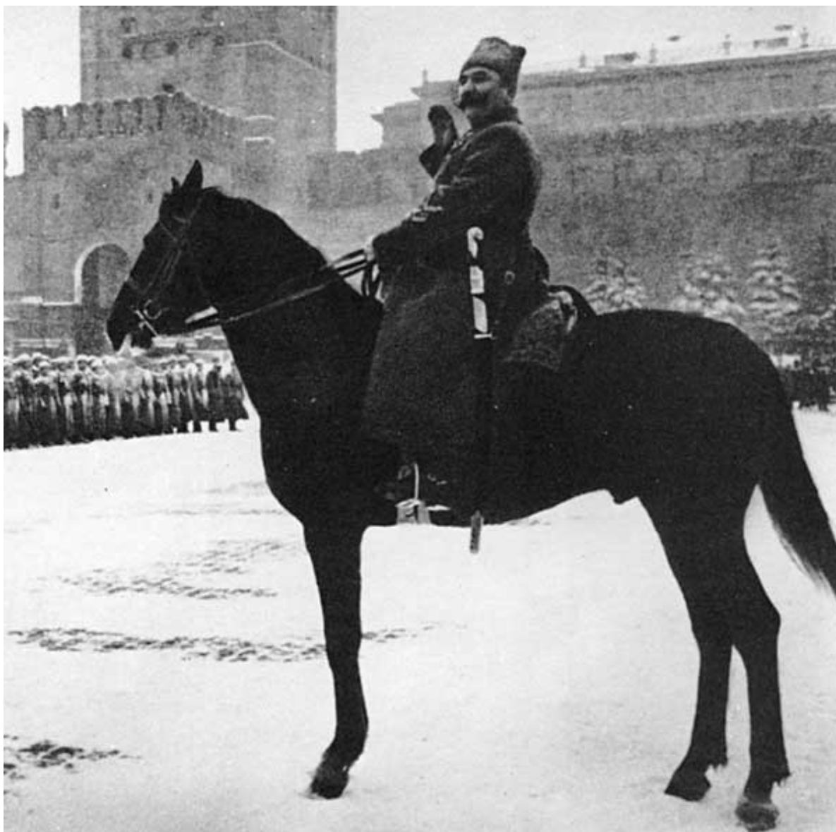
Маршал С. М. Буденный принимает военный парад 7 ноября 1941 года.