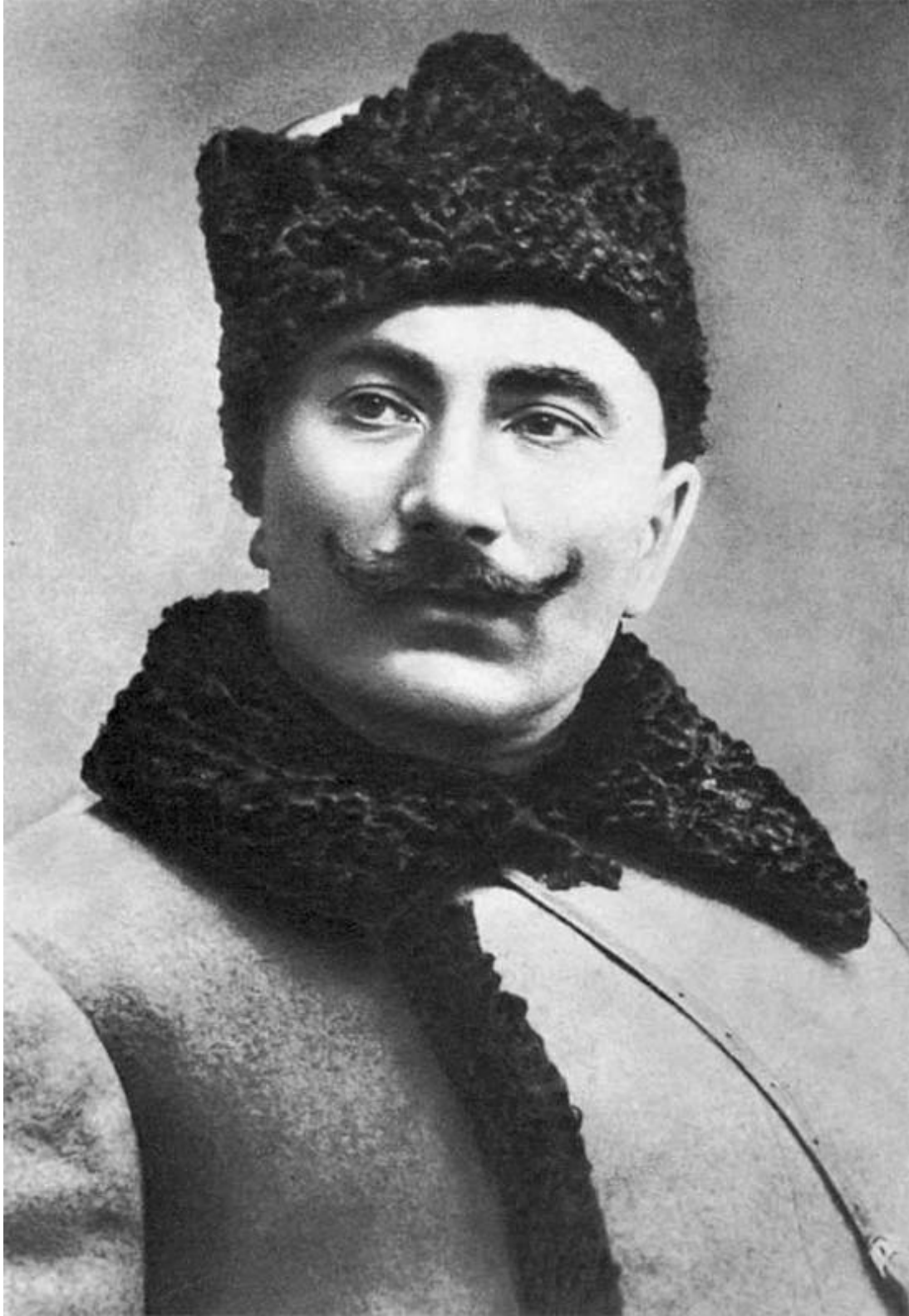
Командарм Первой Конной армии С. М. Буденный.