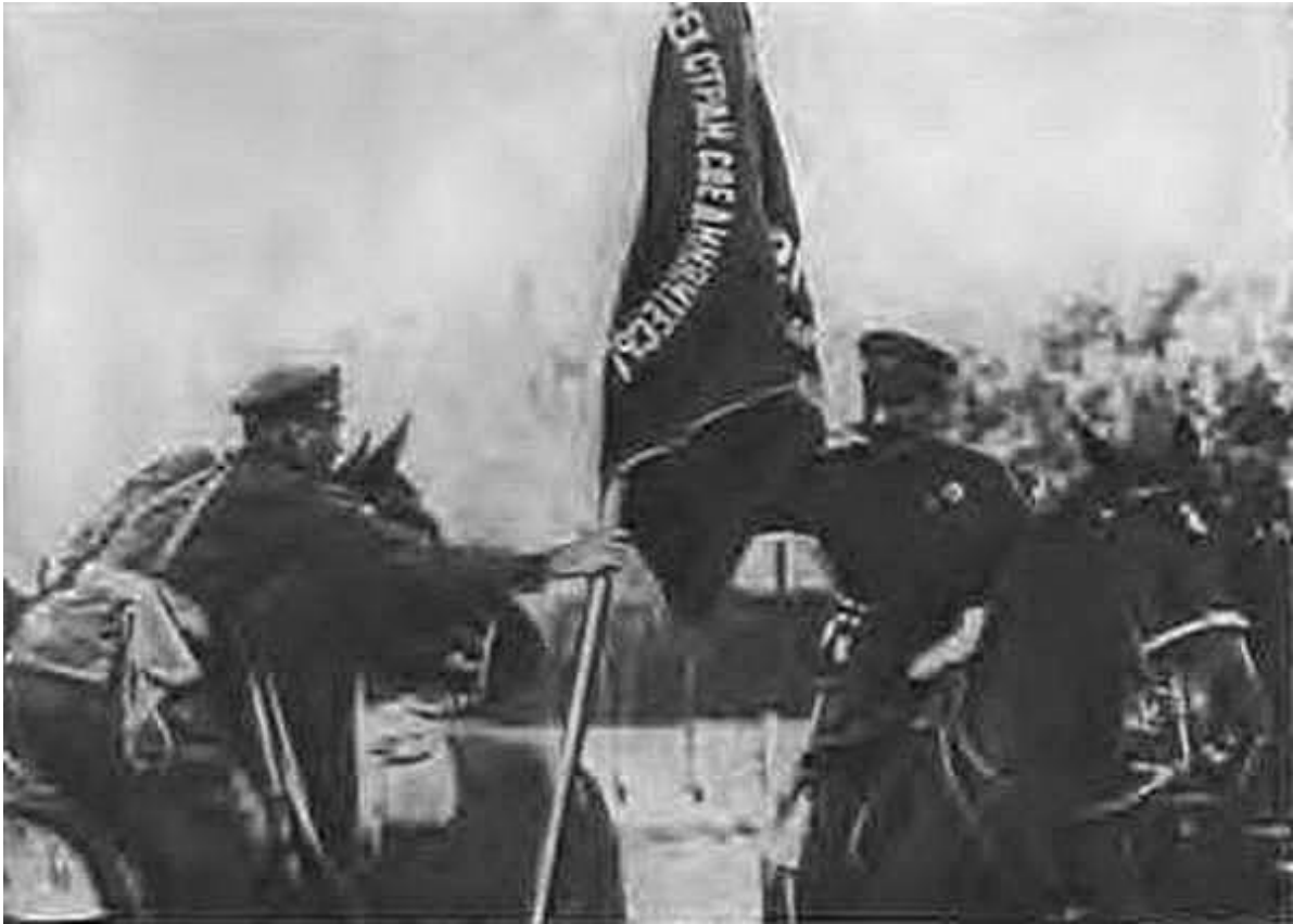
Командарм С. М. Буденный вручает знамя одному из кавалерийских полков. 1923 г.