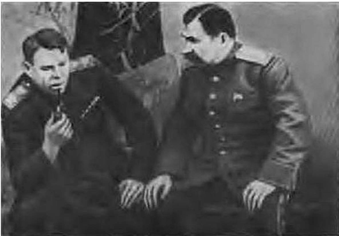
Члены Ставки Верховного Главнокомандования маршалы А. М. Василевский и С. М. Буденный в Донбассе. 1943 г.