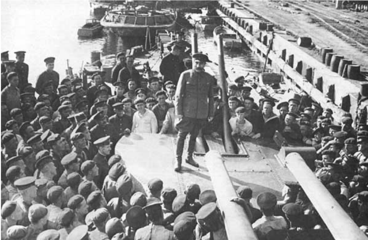
Командующий войсками Северо-Кавказского фронта маршал С. М. Буденный выступает на митинге перед моряками лидера «Ташкент». Июнь 1942 г.