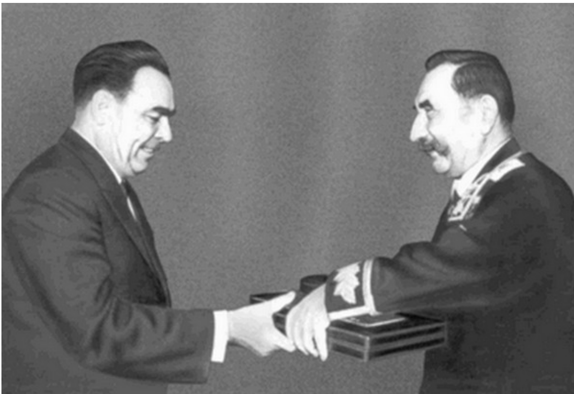
Председатель Президиума Верховного Совета СССР Л. И. Брежнев поздравляет С. М. Буденного с награждением второй медалью «Золотая Звезда». 1963 г.