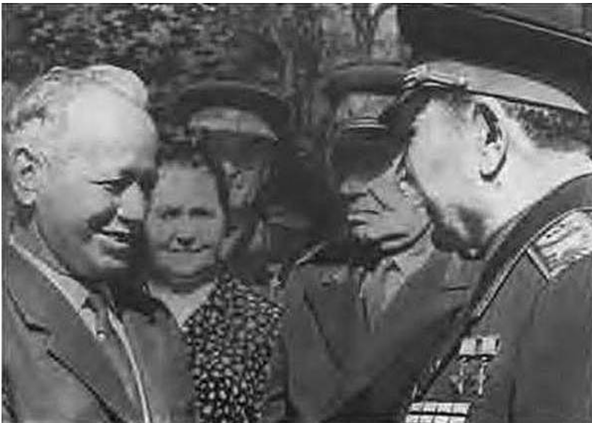
М. А. Шолохов приветствует полковника на донской земле. 1966 г.