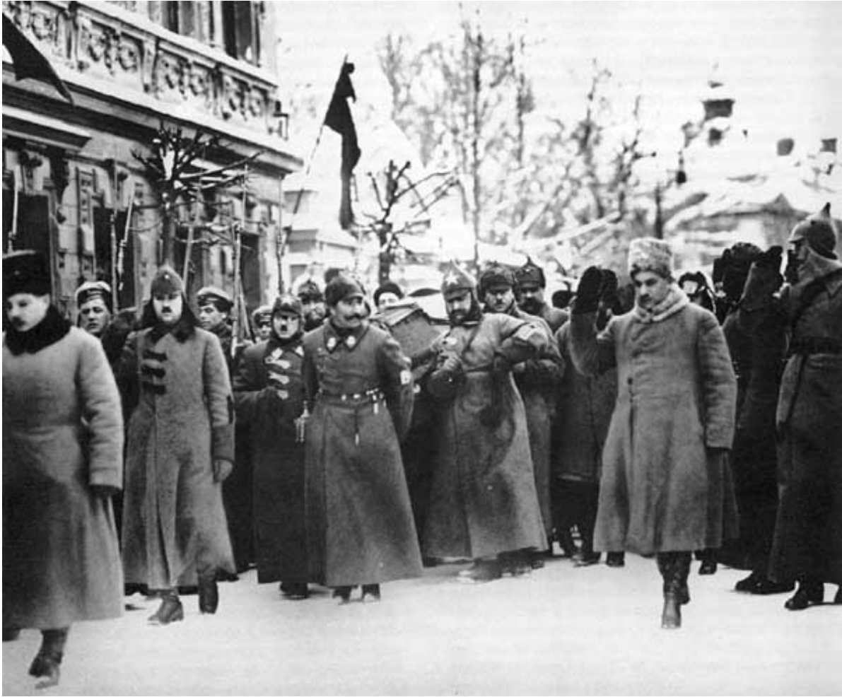
Г. К. Орджоникидзе, С. М. Буденный, К. Е. Ворошилов и другие несут гроб с телом В. И. Ленина от Павелецкого вокзала к Дому союзов. 1924 г.