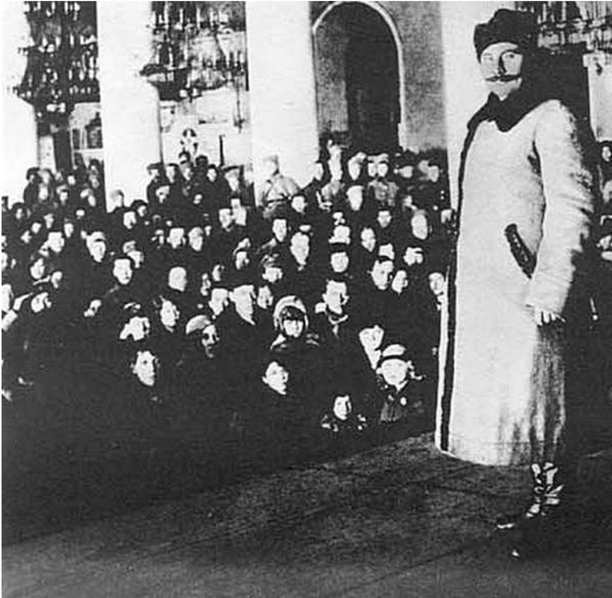
С. М. Буденный на встрече с делегатами VIII Всероссийского съезда Советов. Москва, 1920 г.