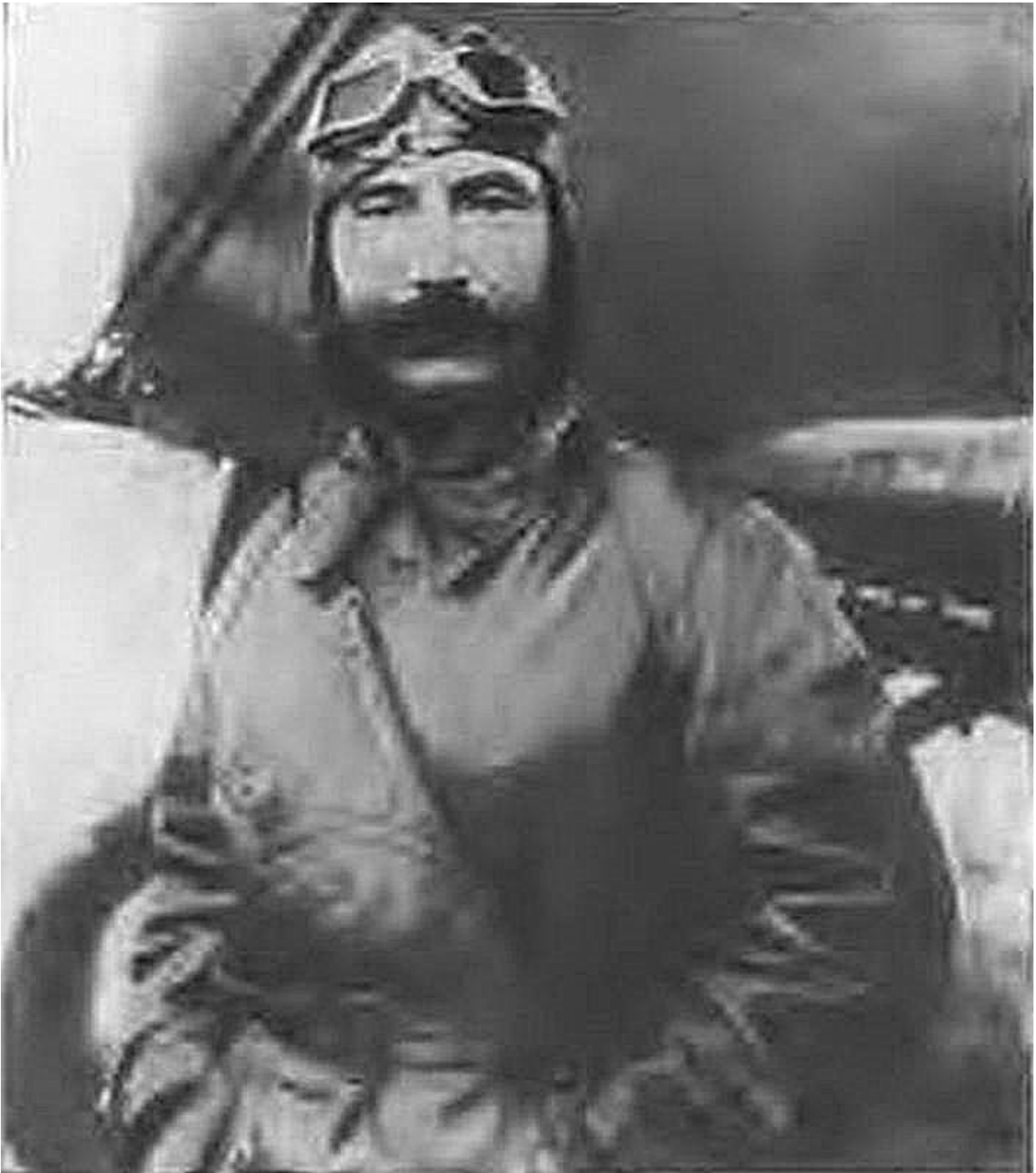
Слушатель Военной академии имени М. В. Фрунзе С. М. Буденный перед полетом. 1931 г.