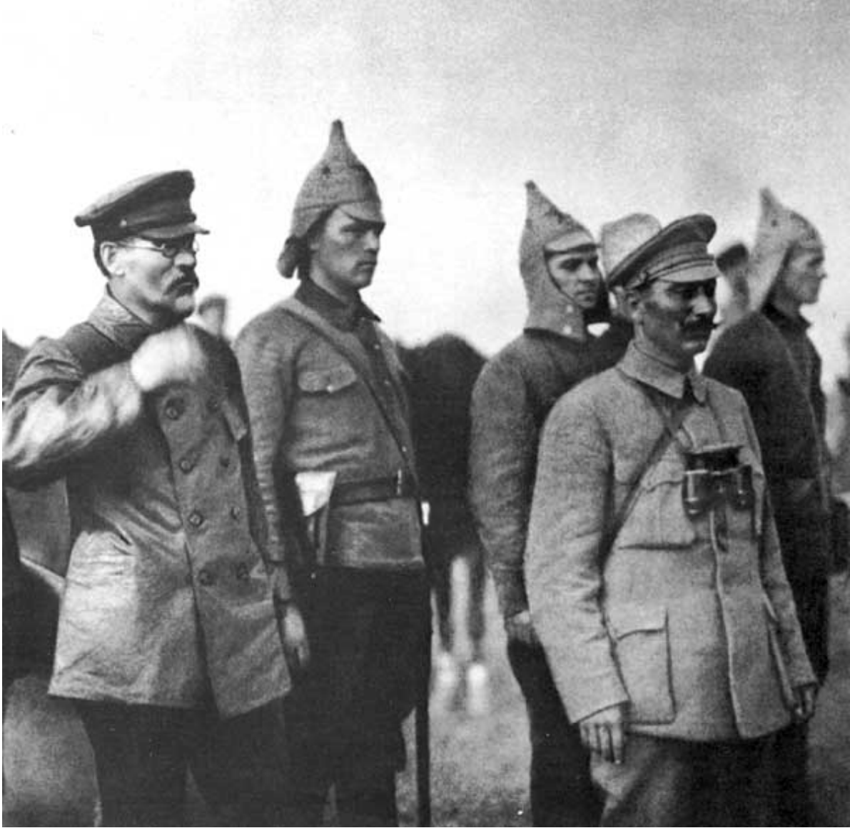
М. И. Калинин принимает парад частей Первой Конной армии. 1920 г.