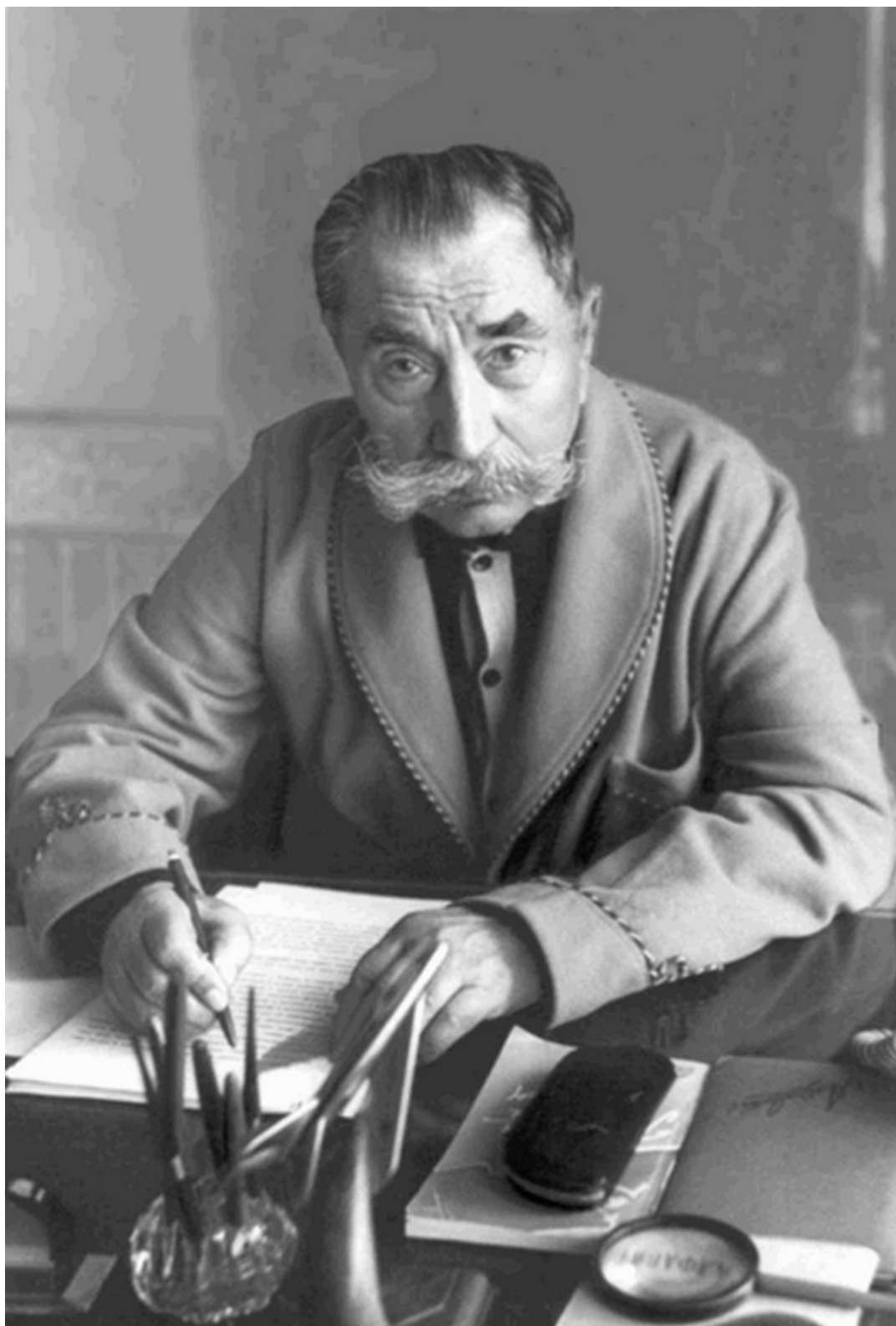
За рабочим столом. 1973 г.