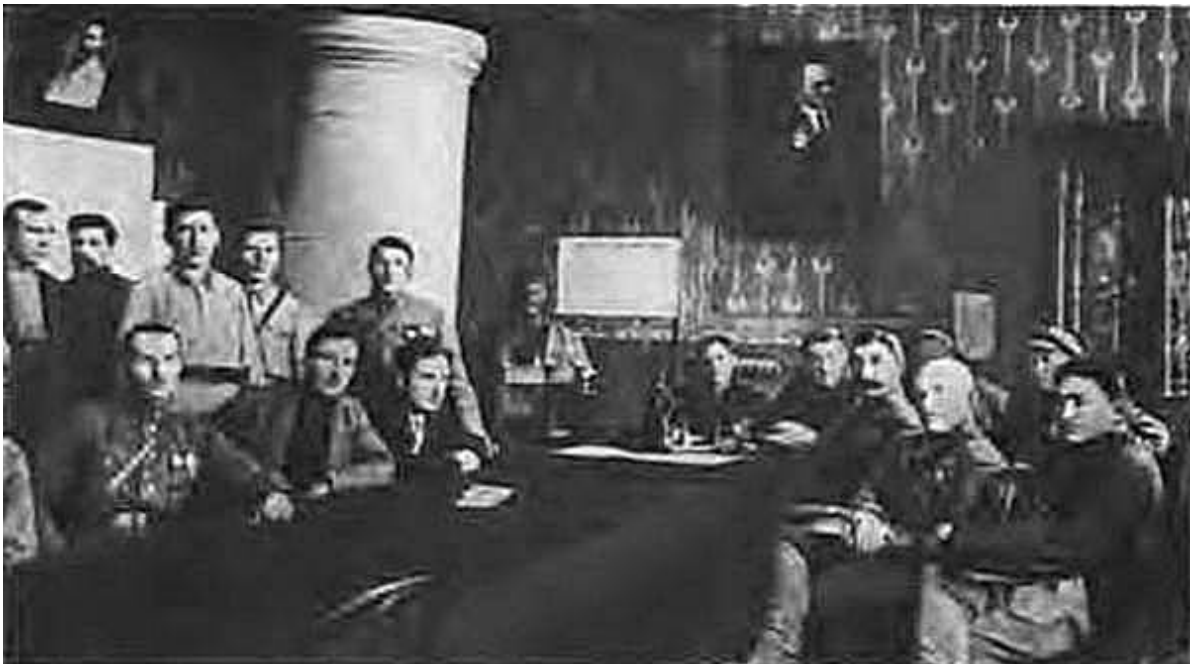
Член Реввоенсовета СССР С. М. Буденный на заседании Совнаркома Туркменистана. 1926 г.