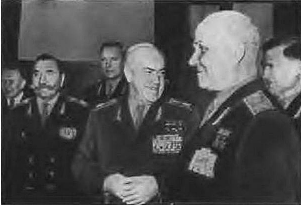
В день 60-летия министра обороны СССР маршала Г. К. Жукова. Москва, 1956 г.