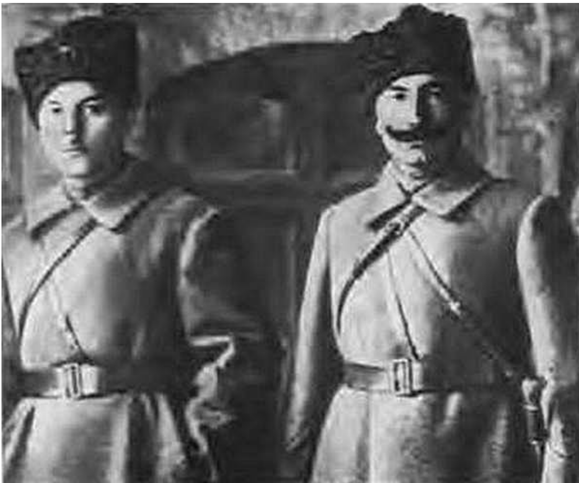
Командарм Первой Конной армии С. М. Буденный и член Реввоенсовета Конармии К. Е. Ворошилов. 1920 г.