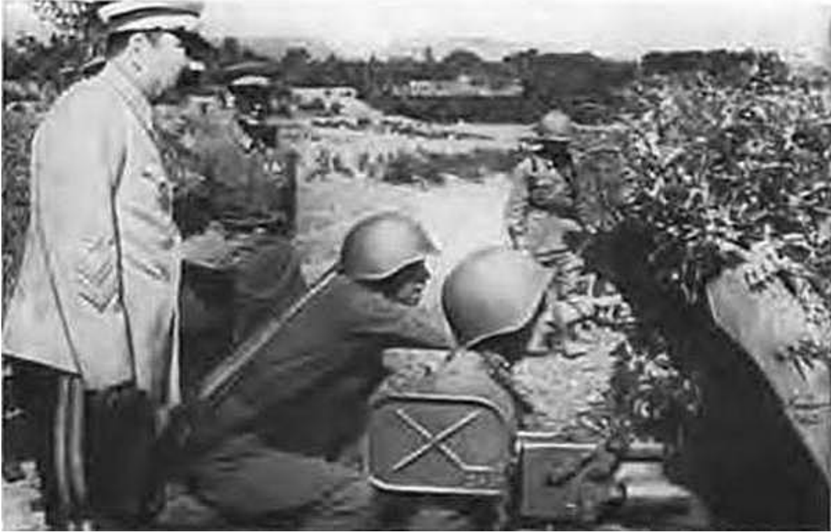
С. М. Буденный на тактических учениях. 1940 г.