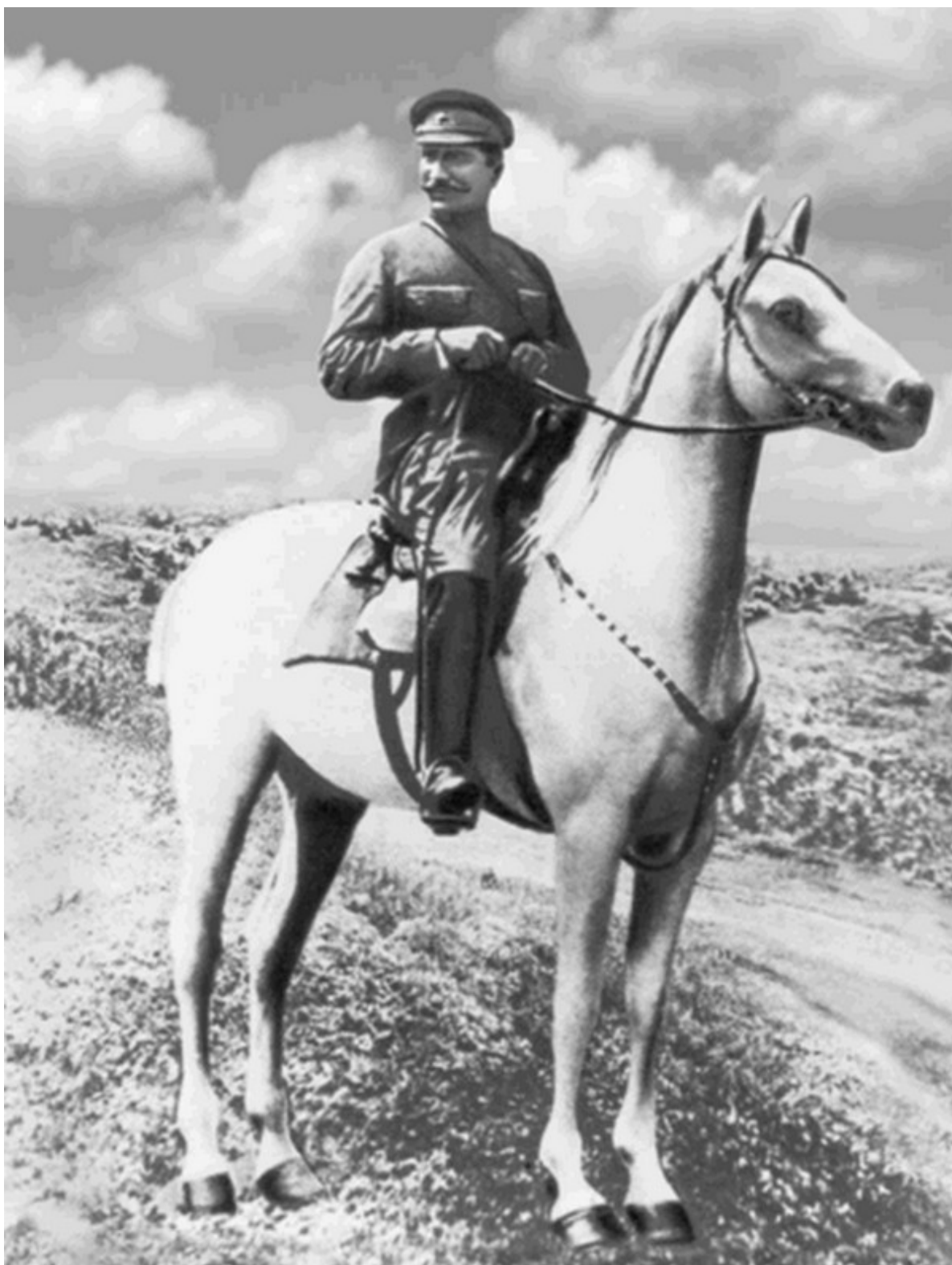
С. М. Буденный. Севастополь, 1920 г.