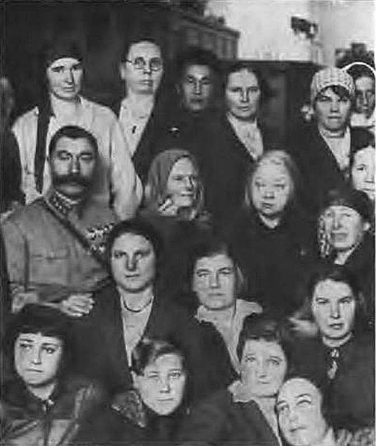
С. М. Буденный и Н. К. Крупская среди делегатов VII Всесоюзного съезда Советов. 1935 г.