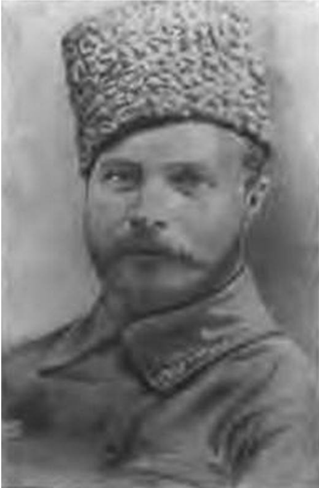
Командующий Южным фронтом М. Ф. Фрунзе. 1920 г.