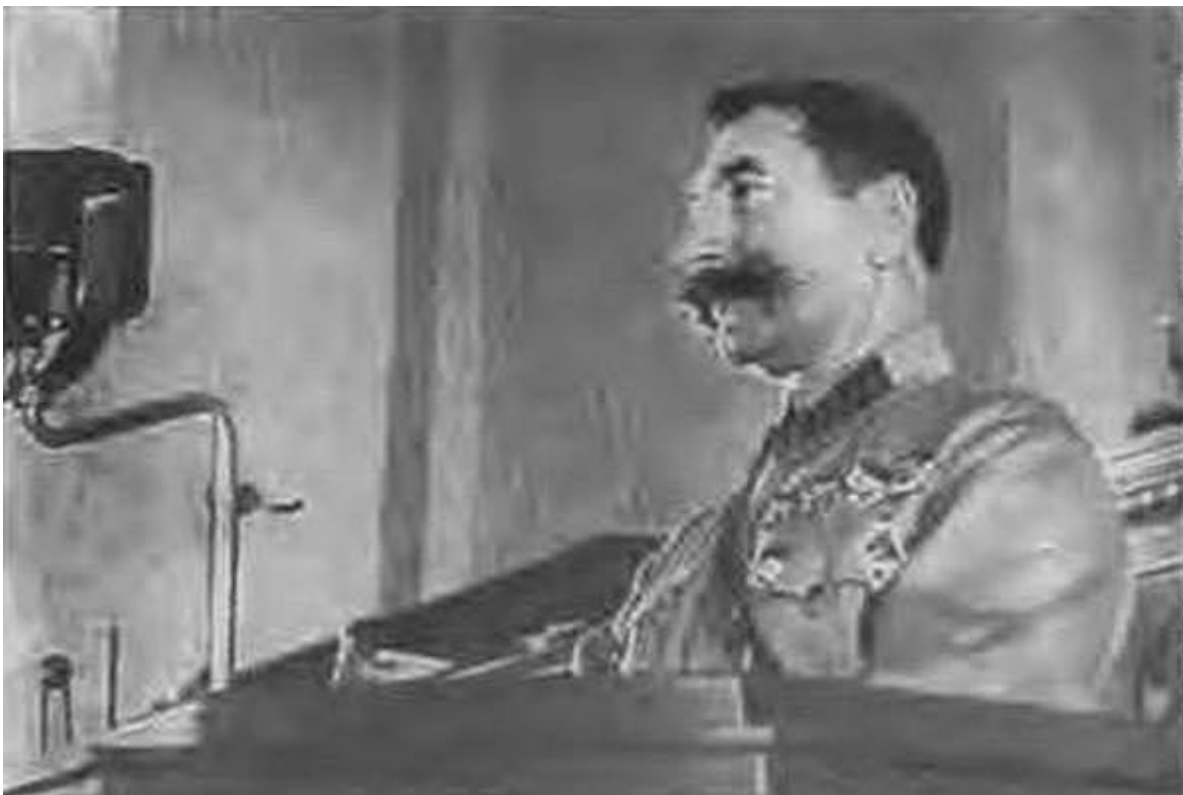
Выступление С. М. Буденного на VII Всесоюзном съезде Советов. 1935 г.