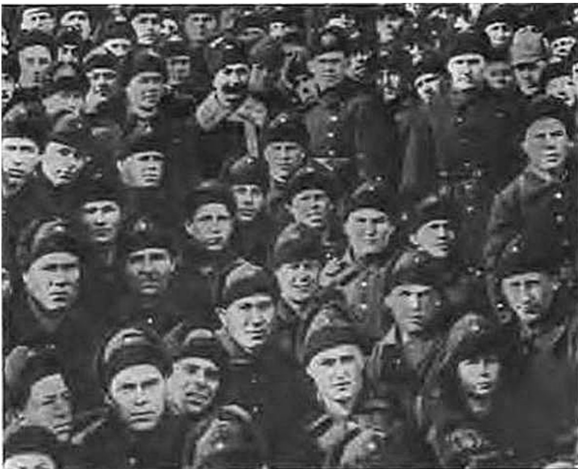
Инспектор кавалерии РККА и член РВС СССР С. М. Буденный среди моряков Амурской военной флотилии. 1929 г.