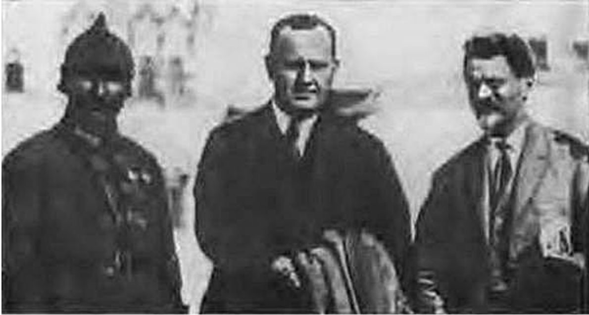
М. И. Калинин и С. М. Буденный с американским сенатором Джонсоном на Красной площади. 1923 г.