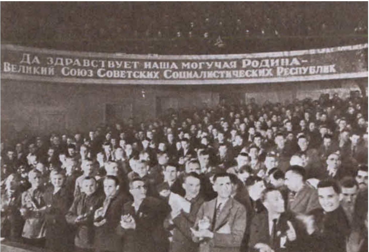
Заседание Народного собрания Западной Белоруссии. Октябрь 1939 г.