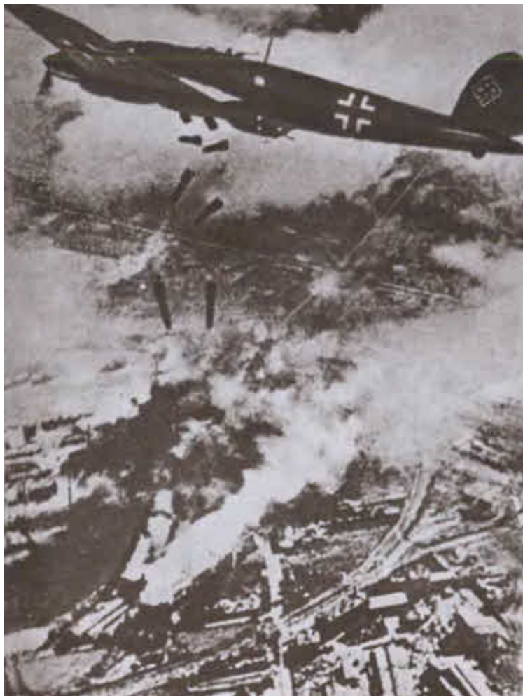
Самолёты люфтваффе бомбят Варшаву. Сентябрь 1939 г.