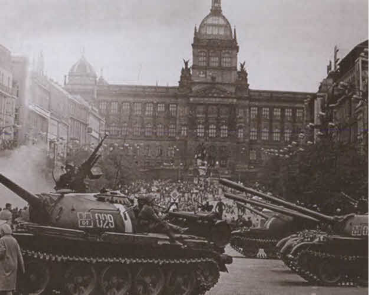
Советские танки на улицах Праги. 1968 г.