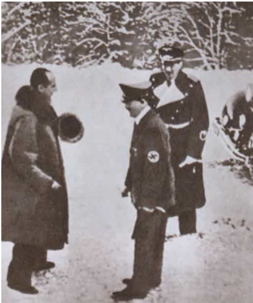
Встреча А. Гитлера с министром иностранных дел Польши Ю. Бекком. Оберхоф, 1938 г.