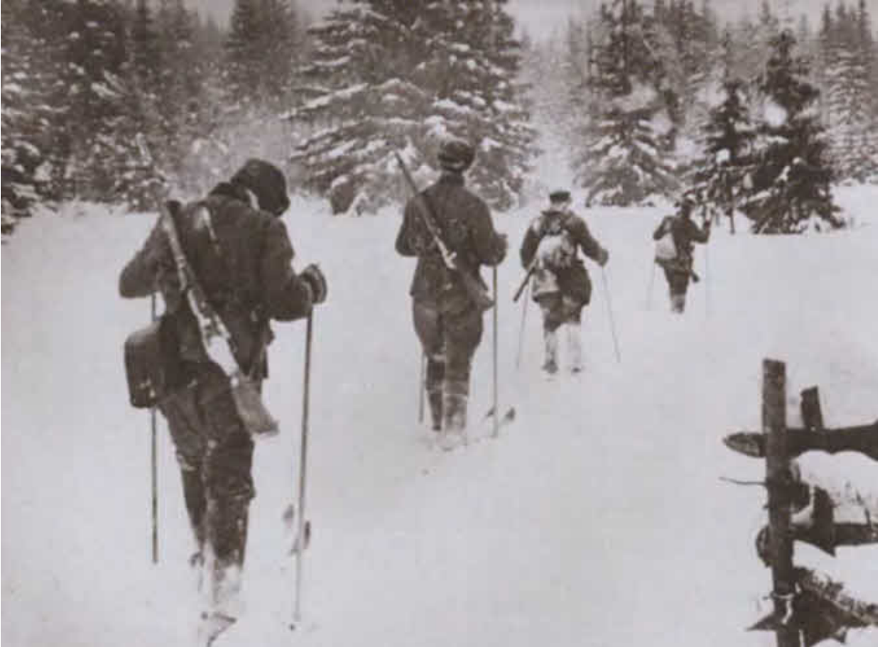
Бойцы истребительно-диверсионной группы уходят на задание. Ноябрь 1941 г.