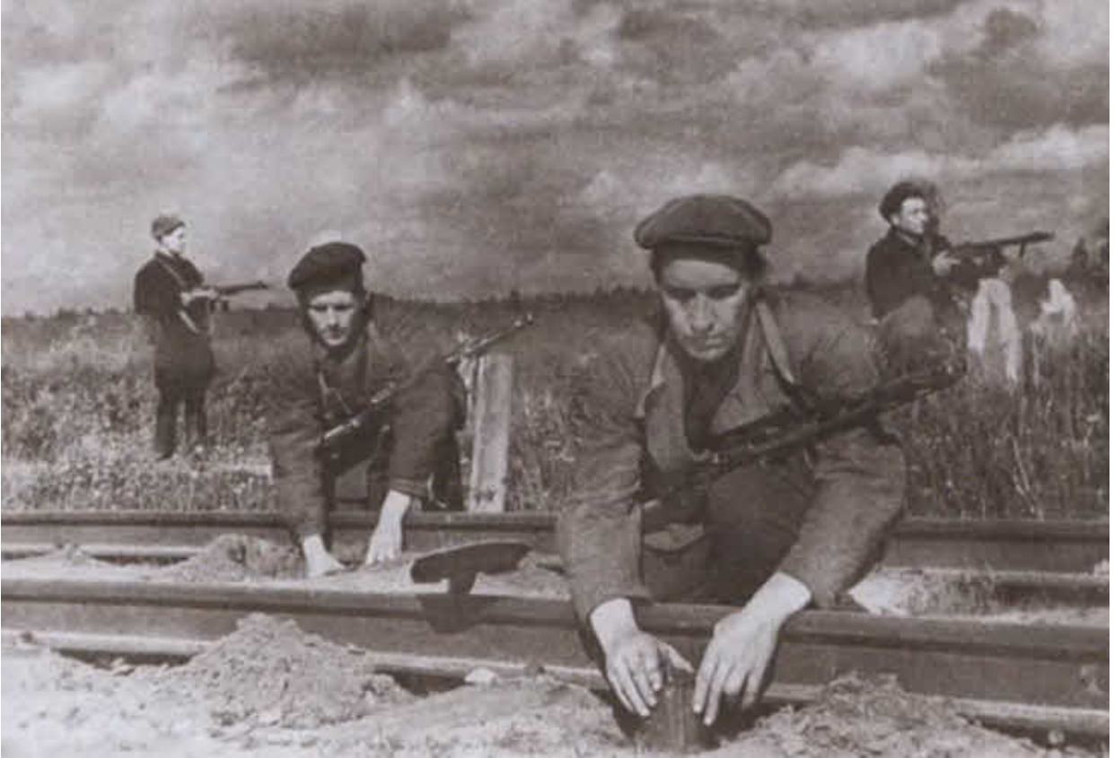
Партизаны готовят подрыв железнодорожного полотна