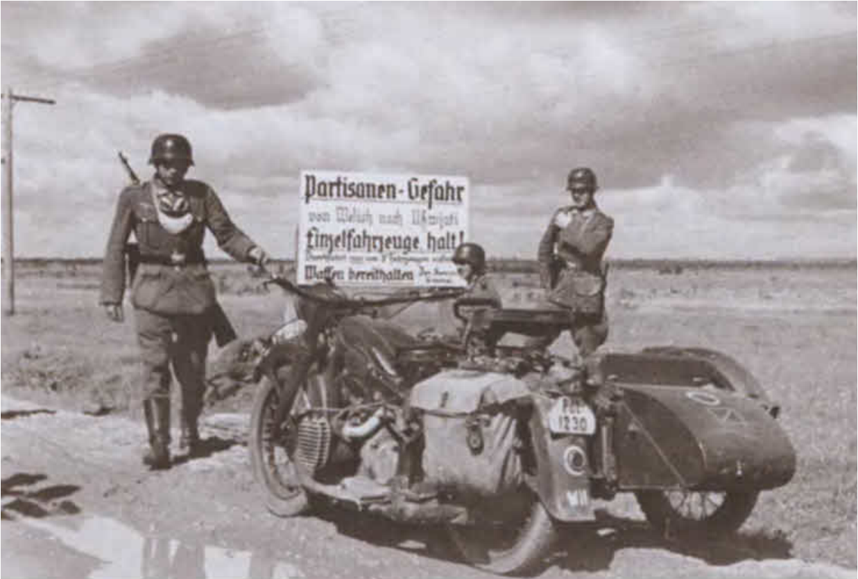
Немецкий патруль в зоне действия партизанских отрядов