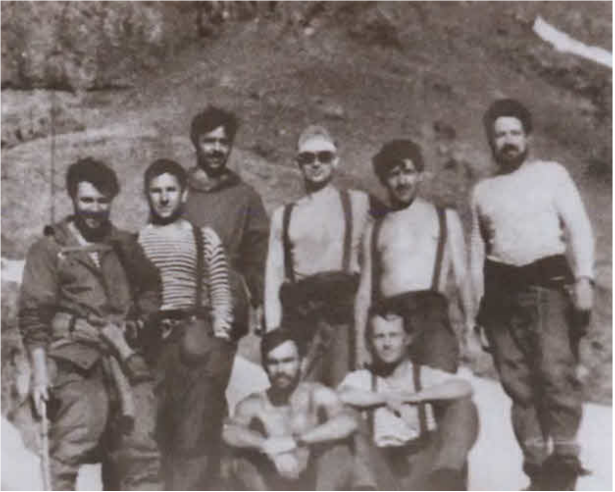
Спецназ «Вымпел» — ученики и наследники Ботяна