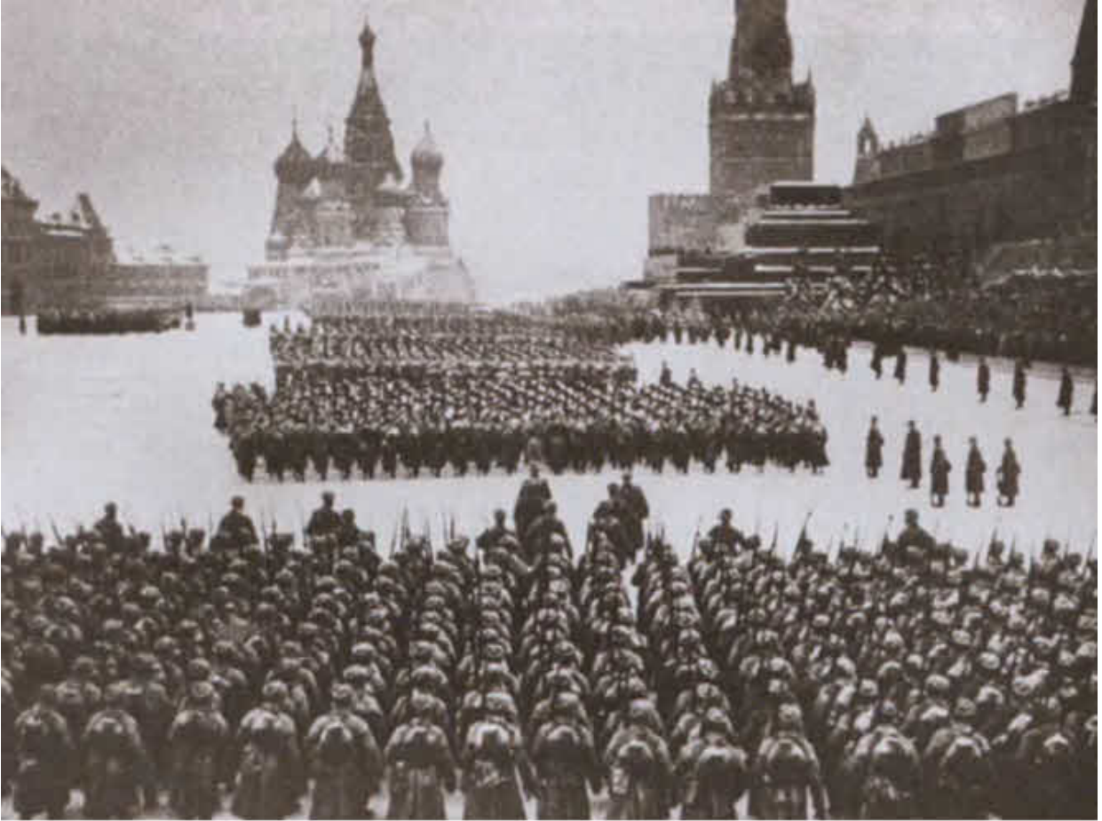
Парад на Красной площади 7 ноября 1941 года