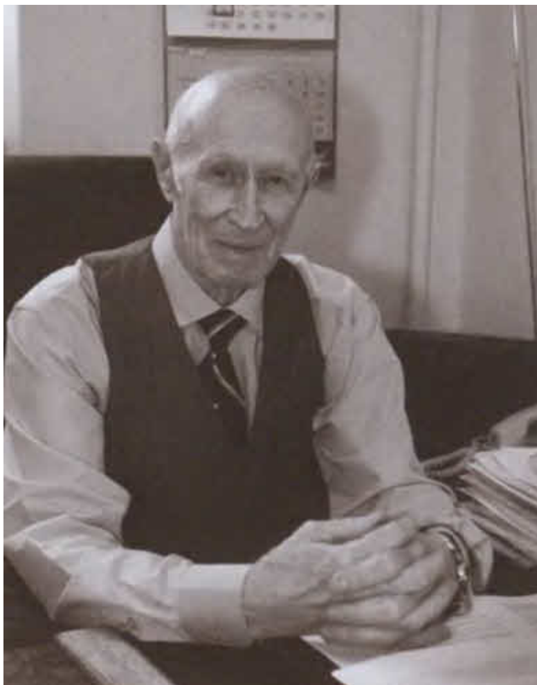
Юрий Иванович Дроздов, начальник советской нелегальной разведки в 1979-1991 годах