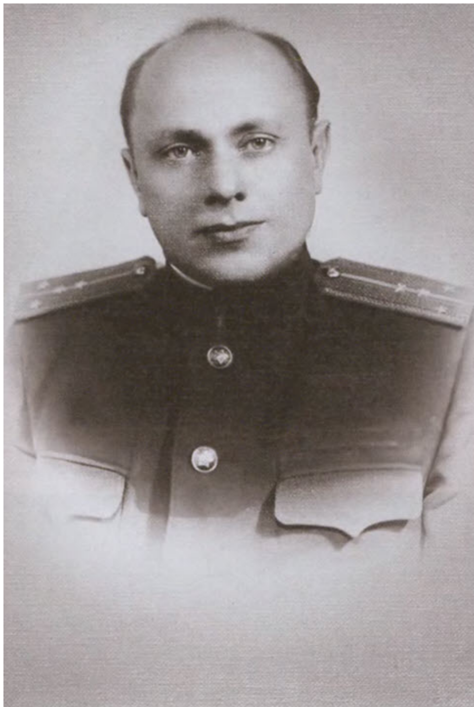
Алексей Николаевич Ботян, капитан госбезопасности. 1950-е гг.