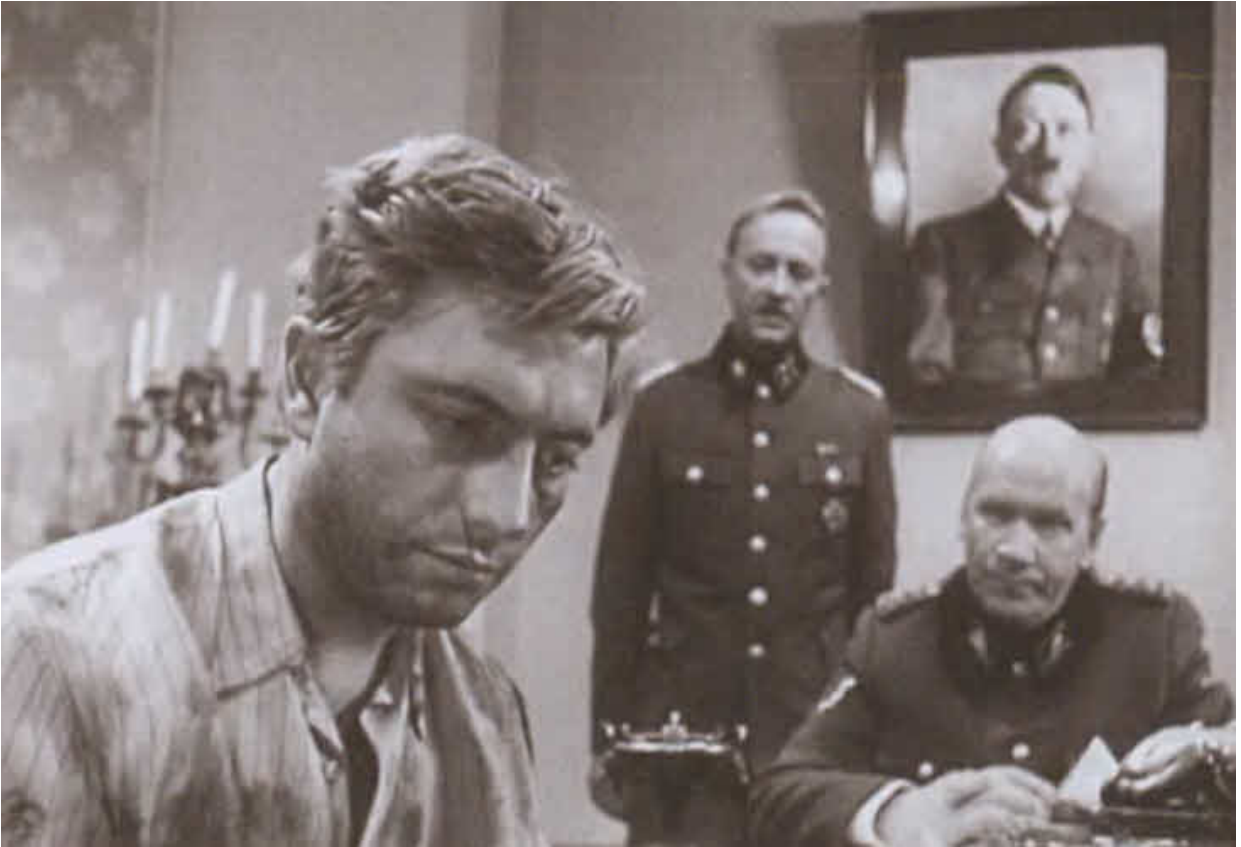
Кадр из фильма «Майор Вихрь». 1967 г.