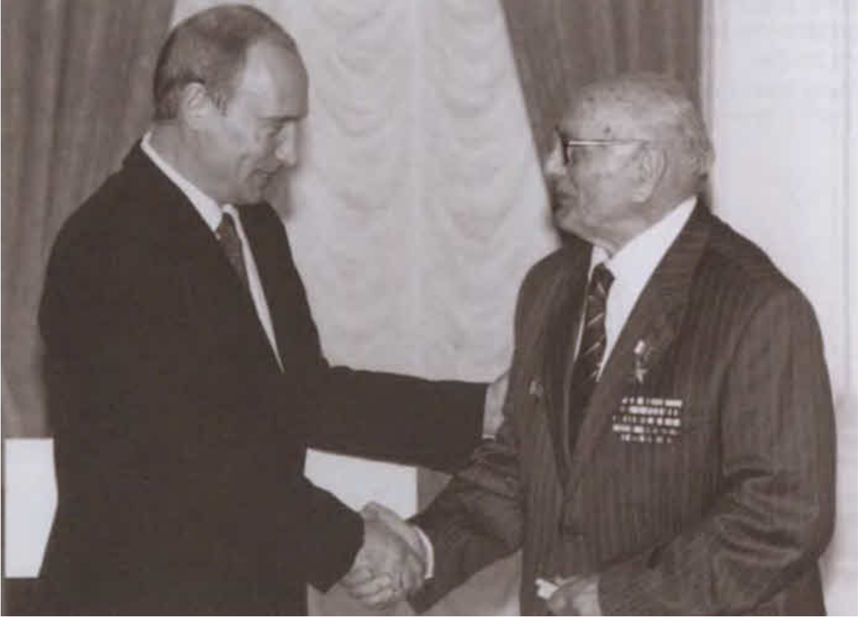
Президент России В. В. Путин поздравляет А. Н. Ботяна с 90-летием и присвоением ему звания Героя России