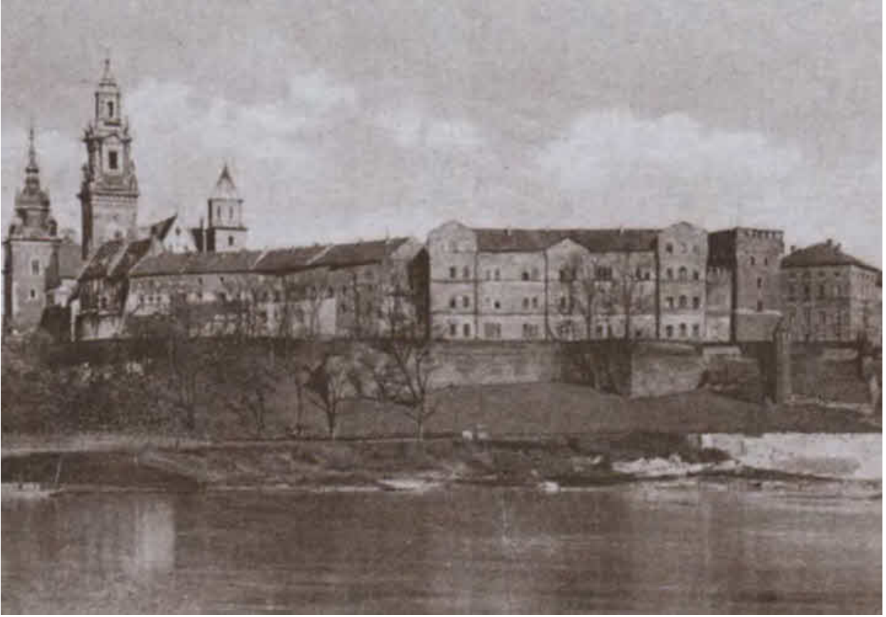
Краков. Почтовая открытка. 1944 г.