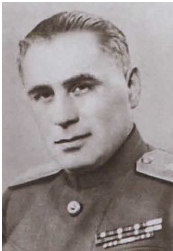
Павел Анато́льевич Судоплатов