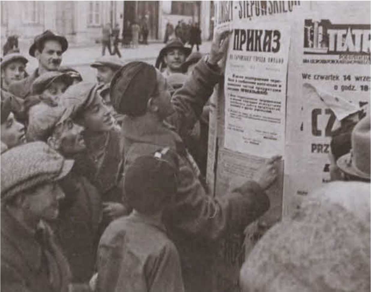
Жители города Вильно читают один из первых приказов советской власти. Сентябрь 1939 г.