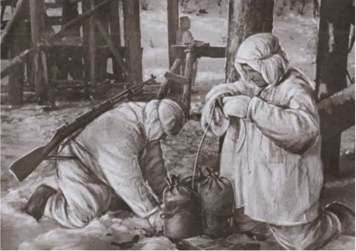
Сапёры минируют мост. 26 марта 1943 г.