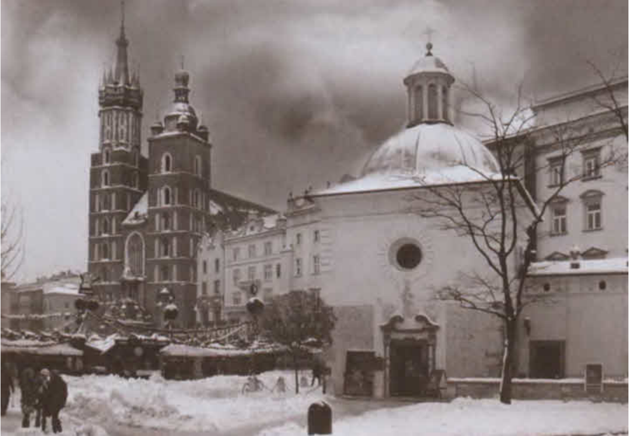
Старинный Краков сегодня