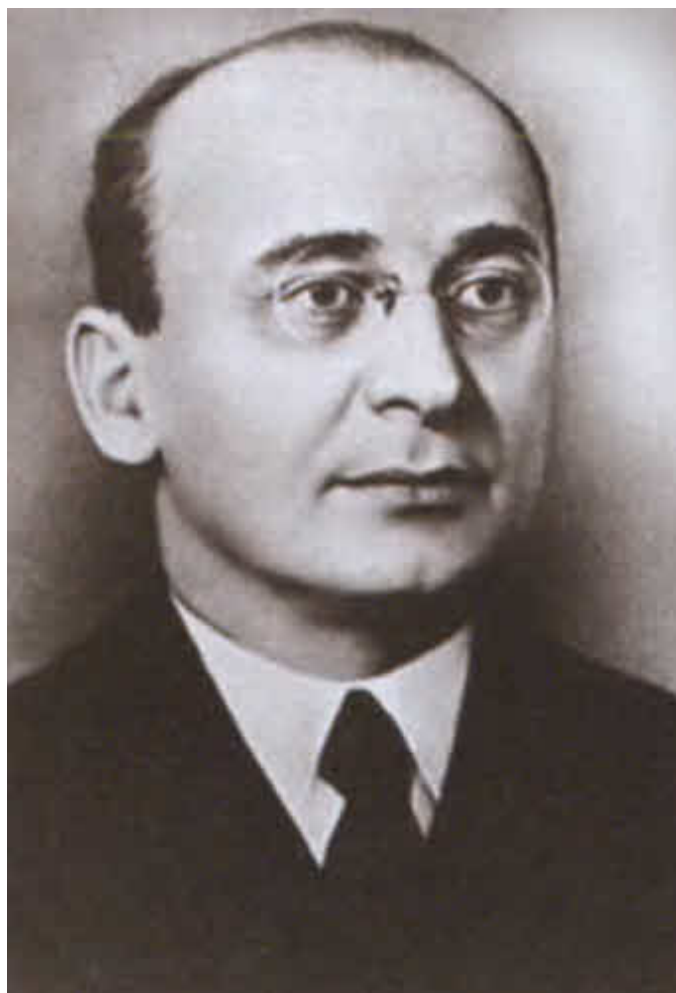
Лаврентий Павлович Берия