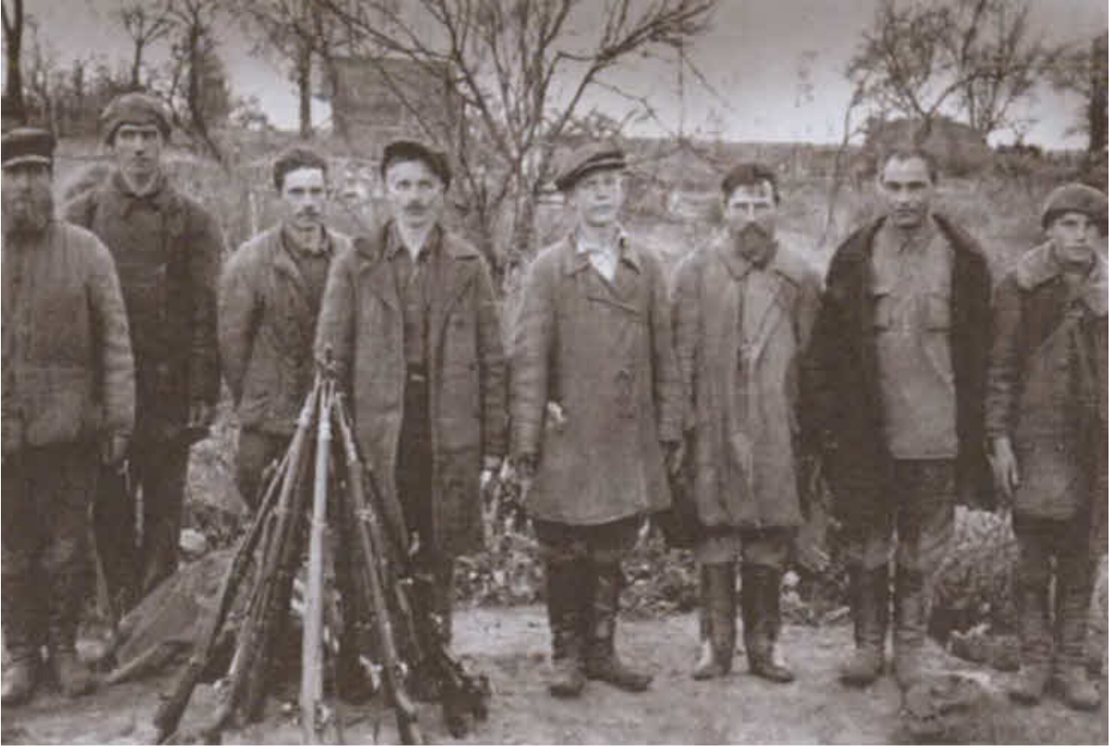
Лжепартизанский отряд на Украине. 1943 г.