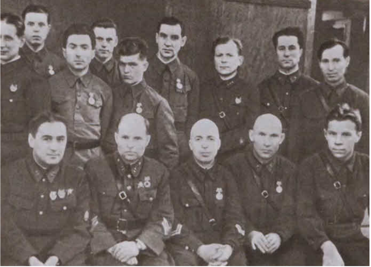
Начальник Четвёртого управления НКВД — НКГБ СССР П. А. Судоплатов (в нижнем ряду первый слева) с командованием и бойцами ОМСБОН