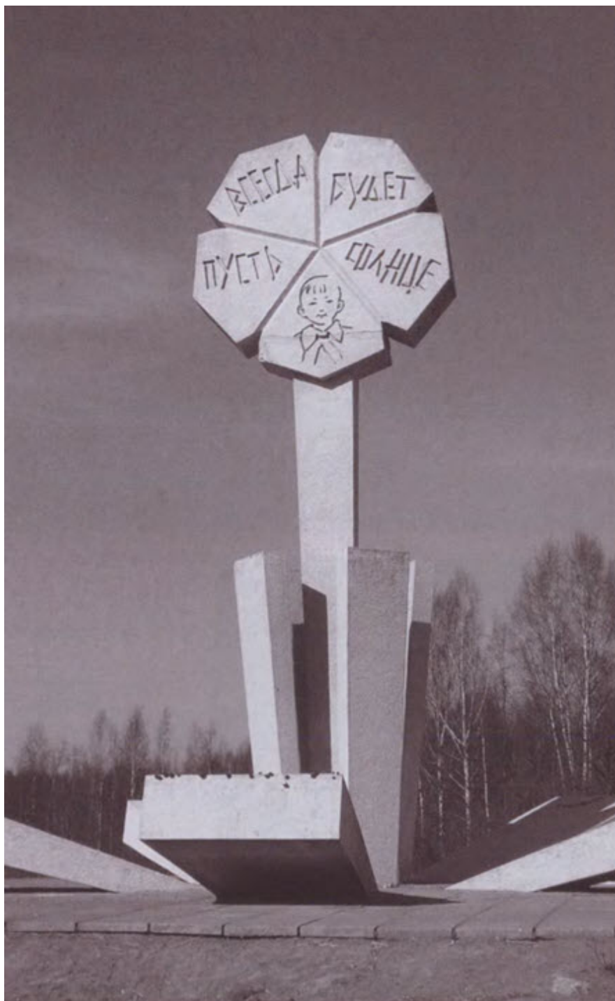
Памятник «Цветок жизни» в память о погибших детях блокадного Ленинграда