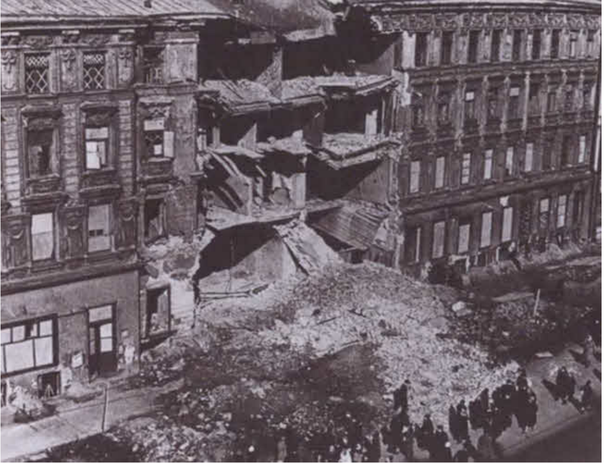
Последствия авианалета в блокадном Ленинграде. 1941 г.