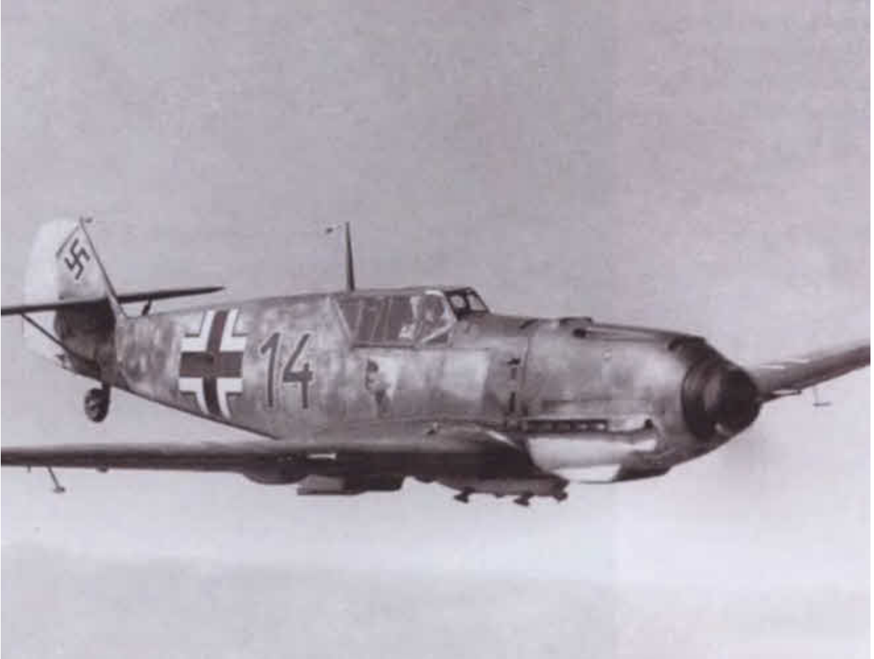
«Мессершмитт» Bf. 109. 1941-1945 гг.