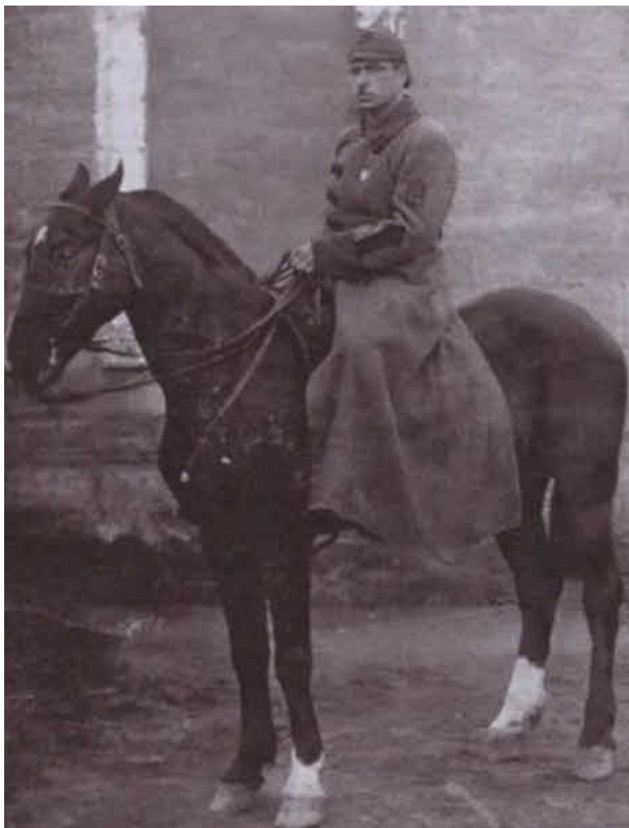
Л. А. Говоров. 1923-1924 гг.