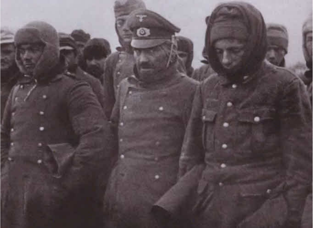
Немецкие солдаты и офицеры, захваченные в плен во время операции по прорыву блокады Ленинграда