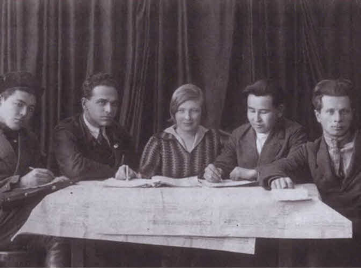
Ольга Берггольц с сотрудниками редакции газеты «Советская степь» в Казахстане. 1930 г.