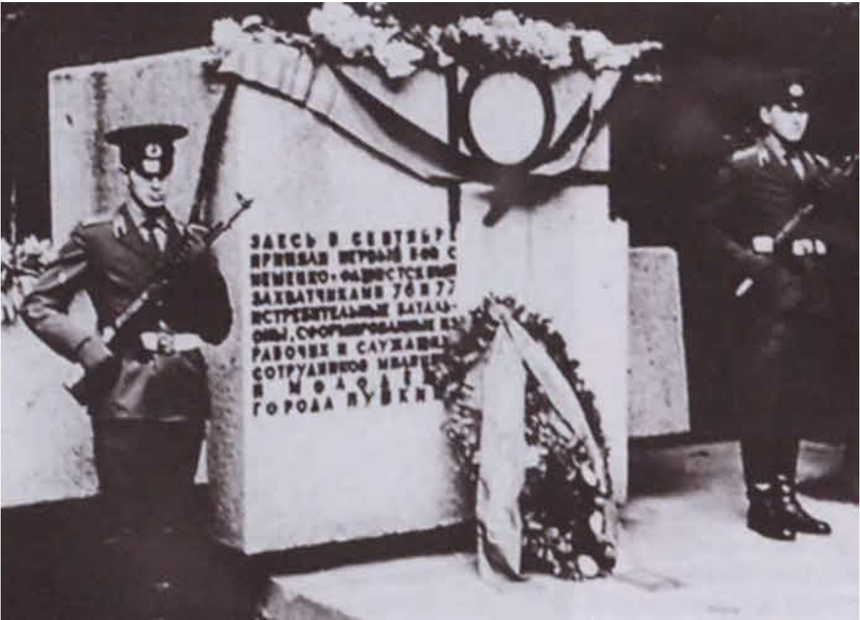
На открытии памятника 76-му и 77-му истребительным батальонам в городе Пушкине. 1969 г.