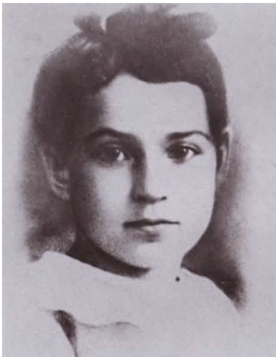
Таня Савичева. 1936 г.