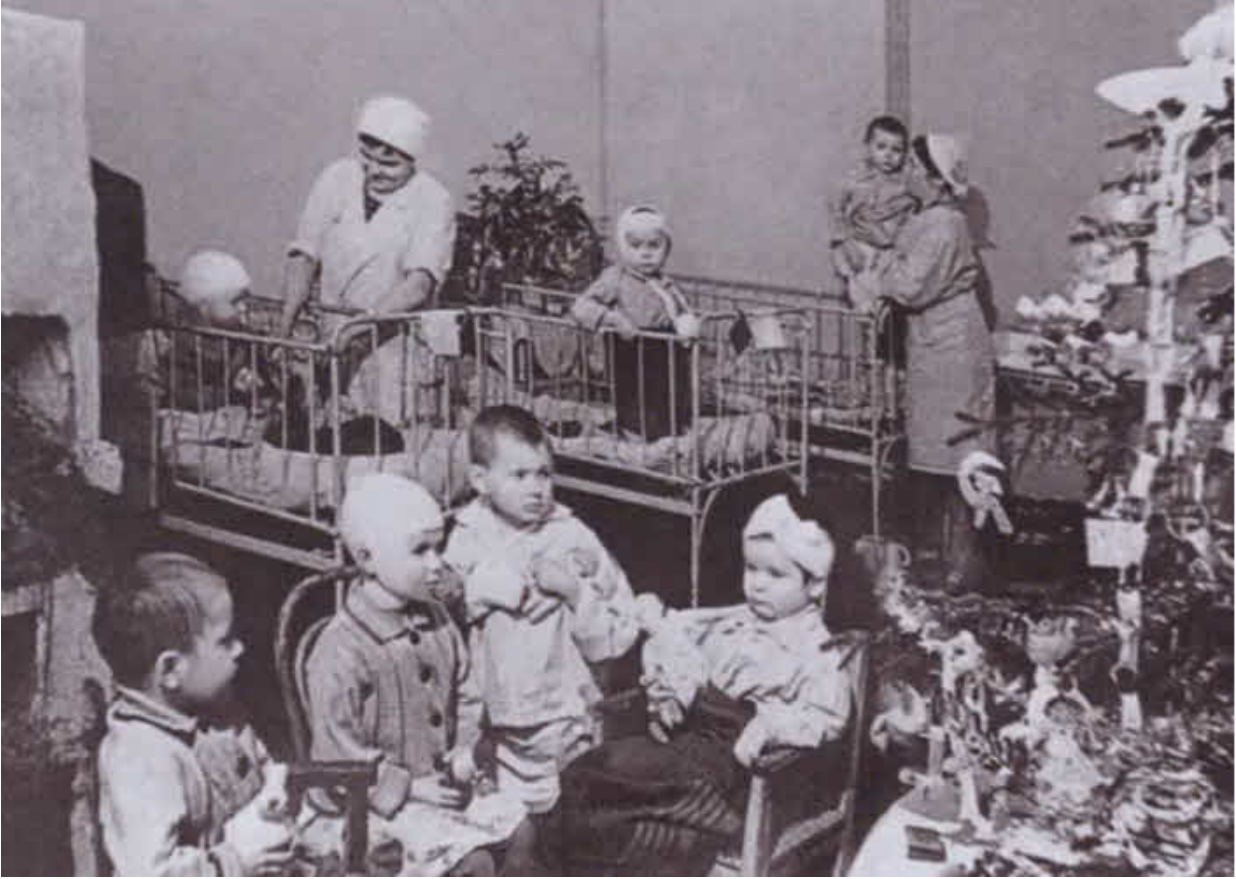
Елка в палате детской больницы в блокадном Ленинграде. Январь 1942 г.