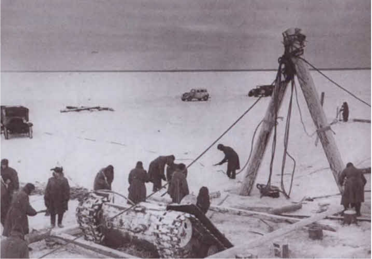
Подъем провалившегося под лед танка КВ. Около 1942 г.