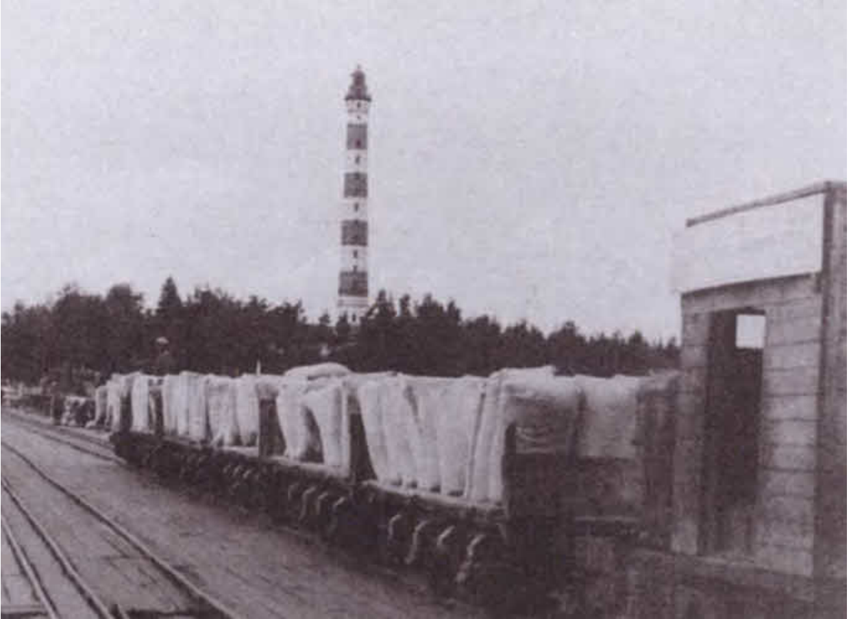
Железнодорожный причал в Осиновце. Около 1942 г.