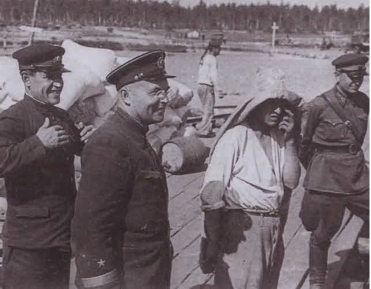
Во время погрузки в Осиновецком порту. 1942 г.