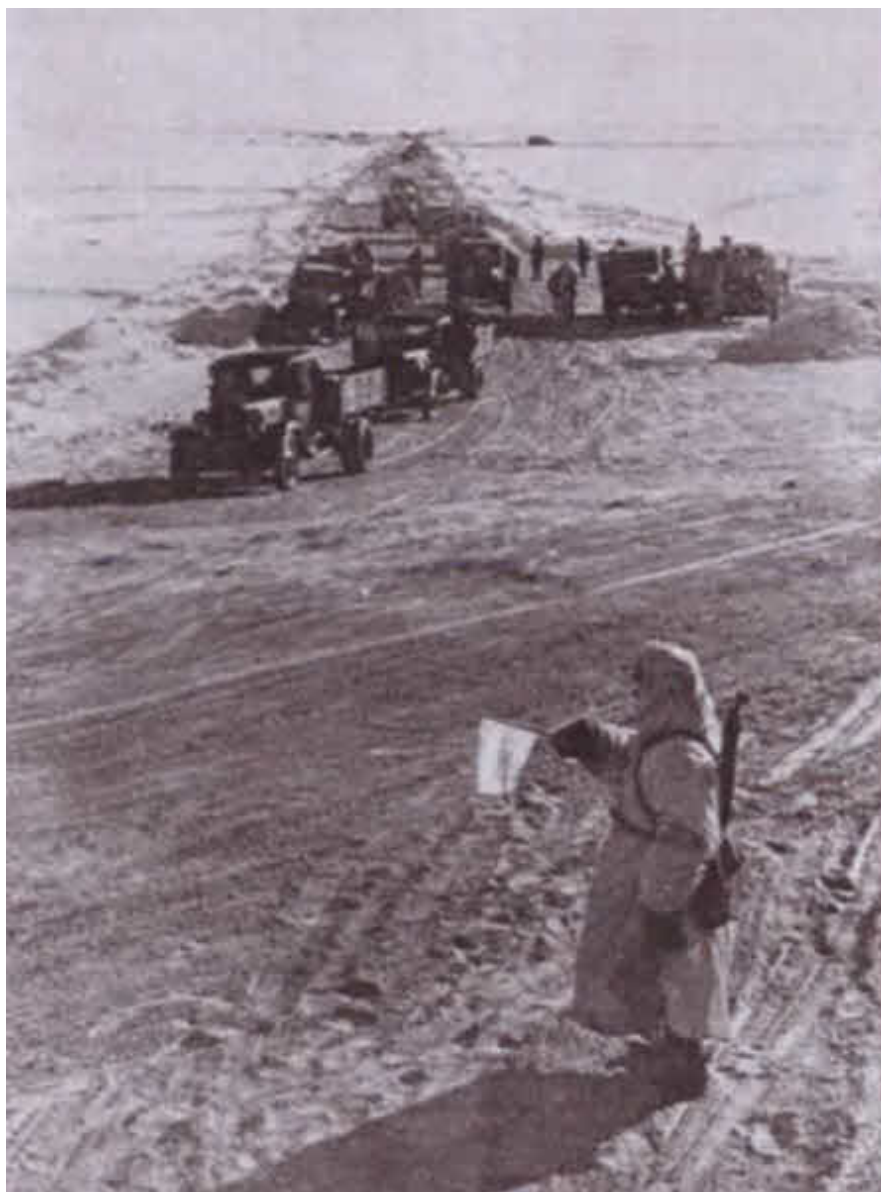
Регулировщики на Дороге жизни