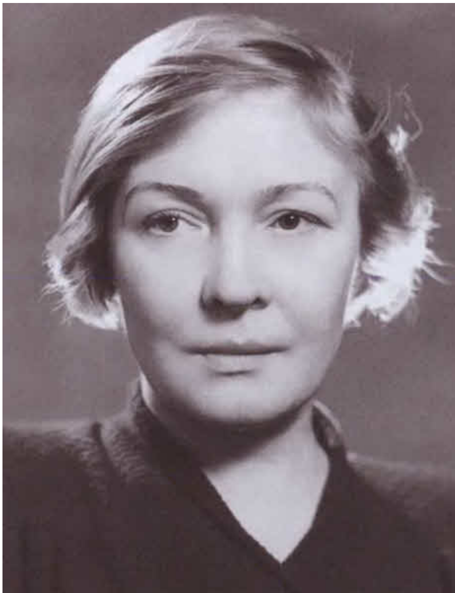
Ольга Берггольц. 1946 г.