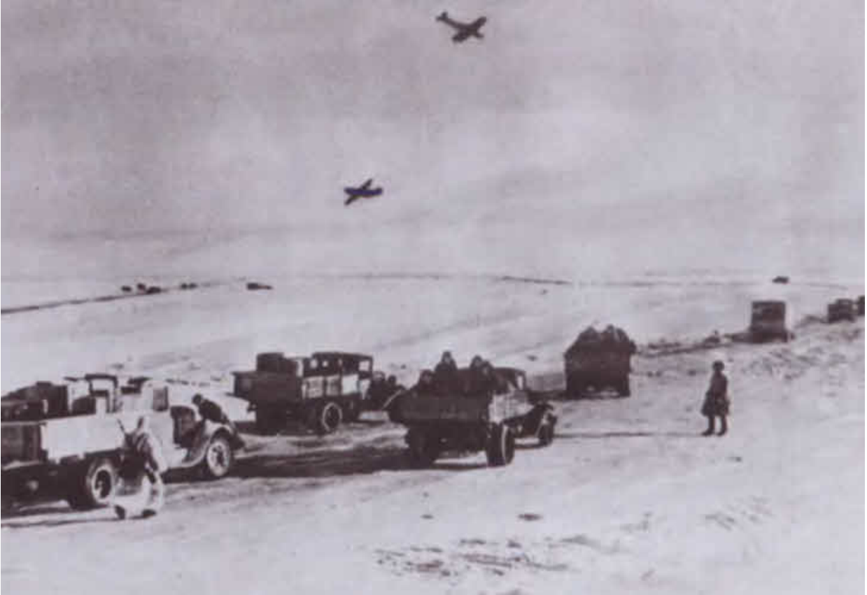
Работа ледовой трассы Дороги жизни в апреле 1942 года