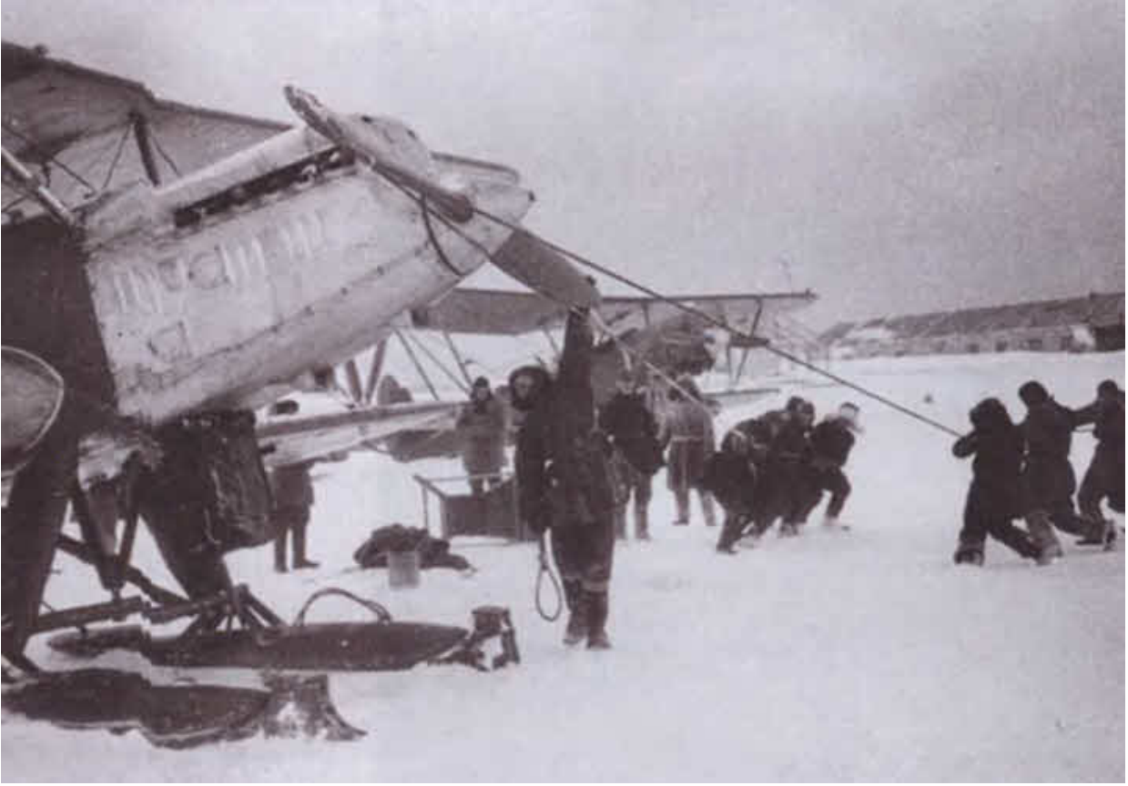
Спасение экипажа парохода «Челюскин». 1934 г.