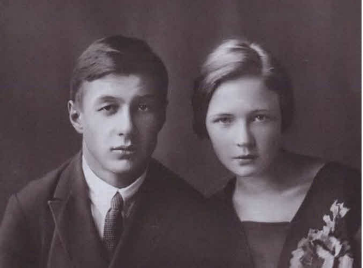
Ольга Берггольц и Борис Корнилов. 1929 г.