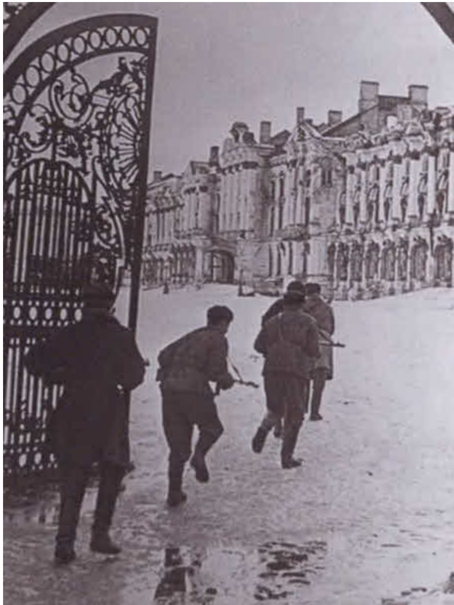
Бои за город Пушкин в январе 1944 года