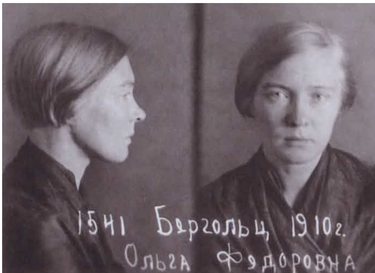
Фотография из уголовного дела О. Ф. Берггольц. 1938 г.