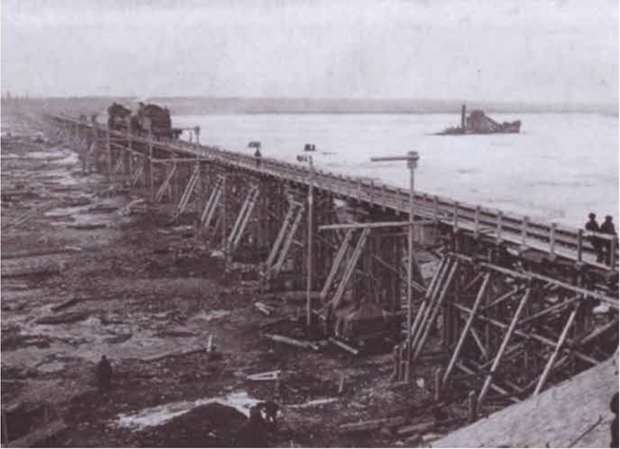
Строительство моста через Неву в районе Шлиссельбургской губы. 7 февраля 1943 г.