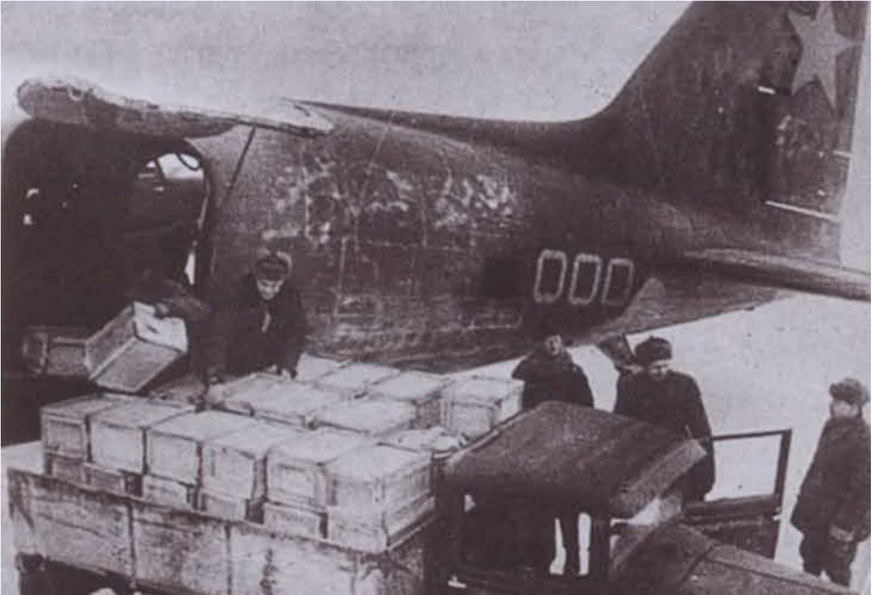
Транспортный самолет с продовольствием для блокадного Ленинграда