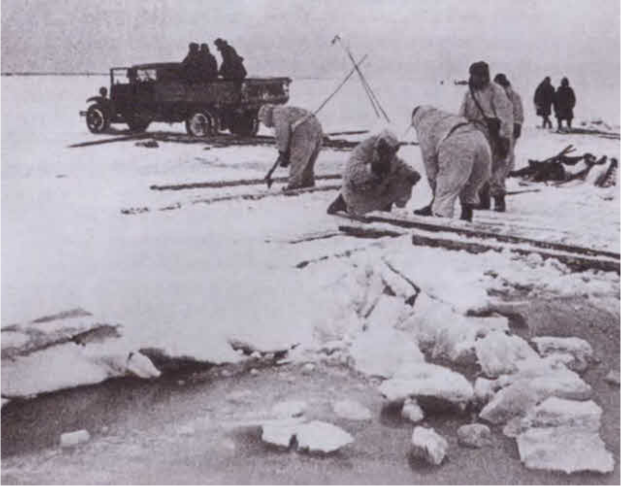
Прокладка деревянных настилов через полынью на льду Ладожского озера