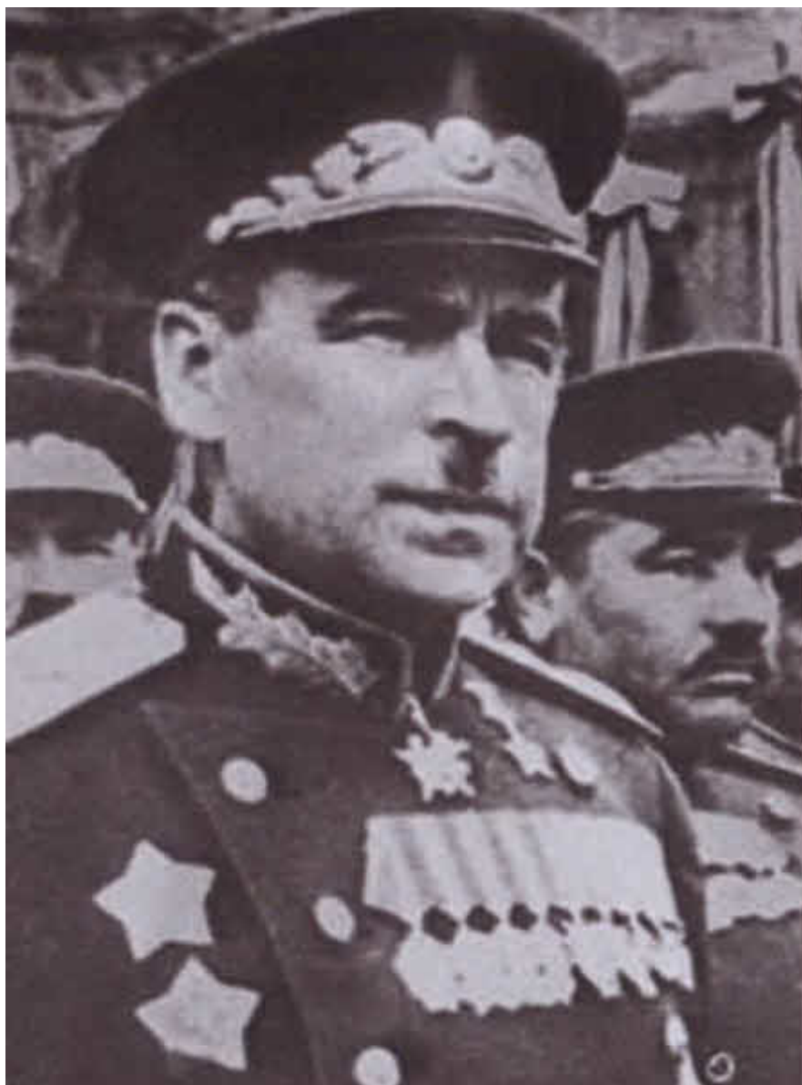
Маршал Л. А. Говоров во главе сводных войск Ленинградского фронта на Параде Победы. 24 июня 1945 г.