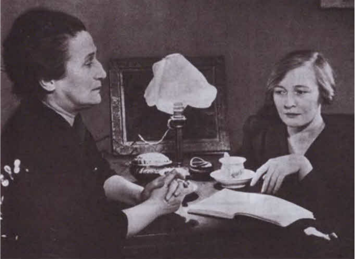
Анна Ахматова и Ольга Берггольц. 1947 г.