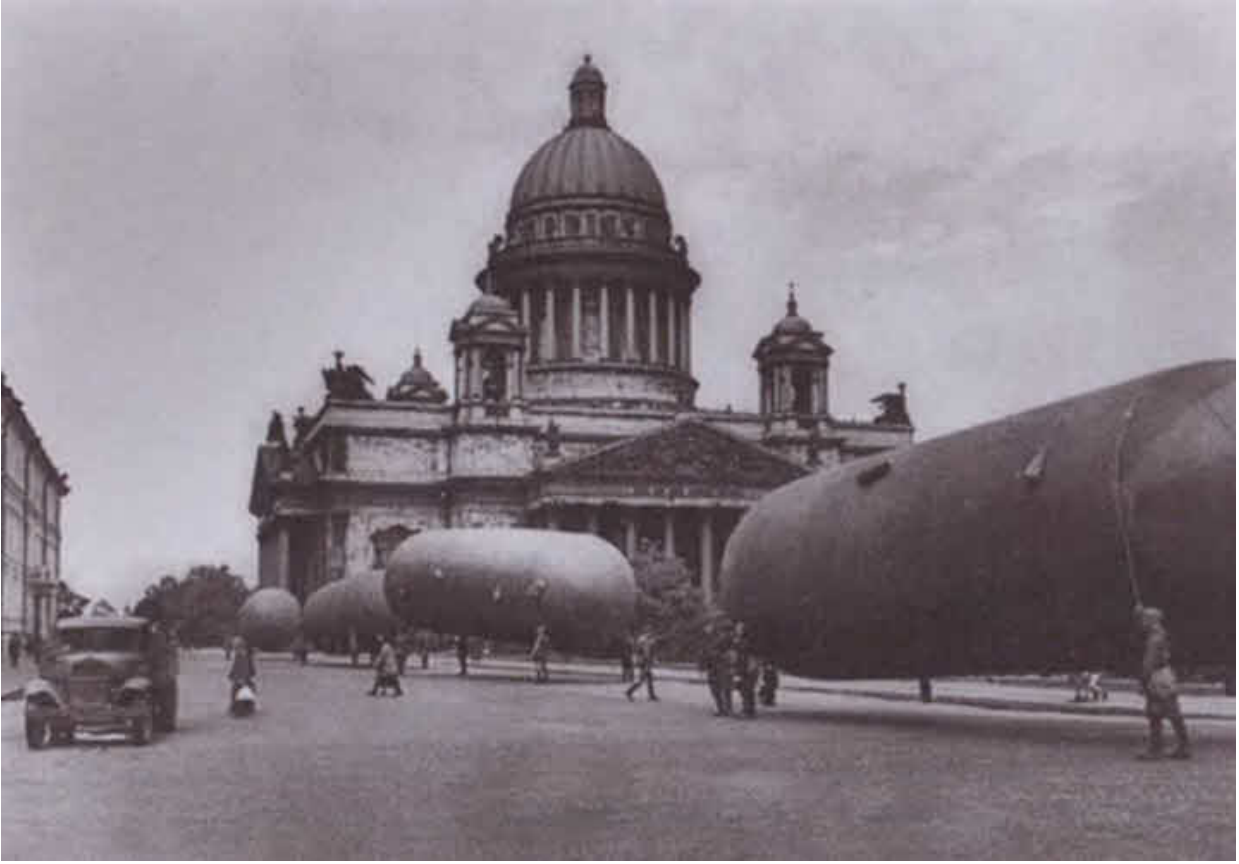
Аэростаты заграждения в блокадном Ленинграде. 1941 г.