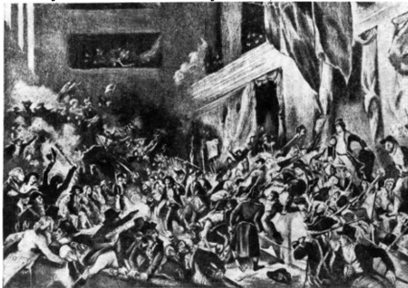
Прериальские дни. Толпа восставших в Конвенте. С картины Делакруа

масс. Экономическое положение катастрофически ухудшается изо дня в день. После 9 термидора срыв максимума, задолго до формальной его отмены, приобретает массовый характер. Параллельно с этим начинается полный развал ассигнационного обращения и резкое падение курса бумажных денег. Если в июле 1794 г. за 100 ливров бумажными деньгами давали 34 золотых ливра, то в январе 1795 г. дают только 18. Таким образом, за эти семь месяцев средний курс ассигнаций понижается на 50 %, причем в общей своей стоимости они теряют 83 %. Торговцы, чтобы не отстать от падающего курса, ежедневно взвинчивают цены, чем со своей стороны способствуют окончательному обесценению ассигнаций.