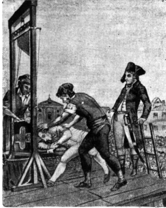
Казнь Робеспьера. С картины английского художника Бенса