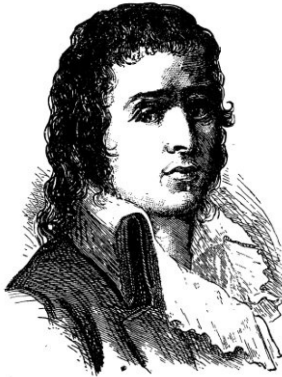
Гракс-Бабёф. С современной гравюры

декретировали выкуп «реальных» прав сеньора, к которым бесповоротно отнесли все наиболее ценные с точки зрения сеньора повинности, сделав условия этого выкупа чрезвычайно тягостными для крестьянина.