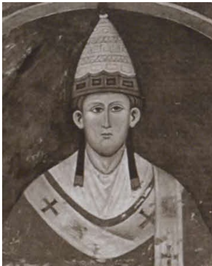
Папа Иннокентий III.

Фреска. XIII в. Субьяко, монастырь Сан-Бенедетто (Сакро Спеко)