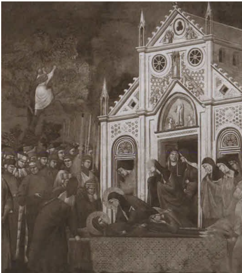
Оплакивание Франциска монахинями-клариссами.

Художник Джотто и мастерская. Около 1298 г. Фреска. Ассизи, верхняя церковь базилики во имя Святого Франциска