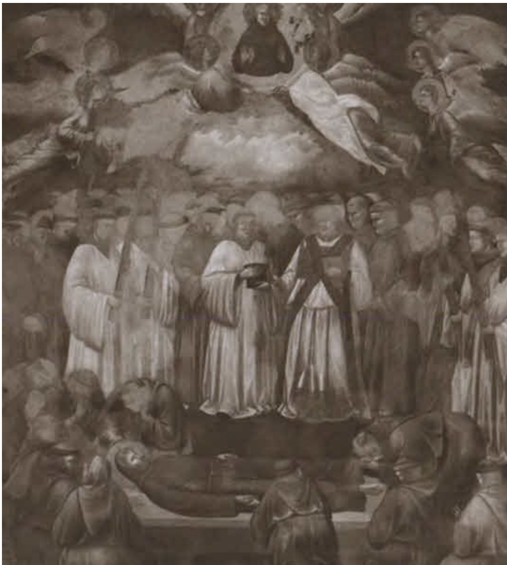
Смерть и вознесение святого Франциска.

Художник Джотто и мастерская. Около 1298 г. Фреска. Ассизи, верхняя церковь базилики во имя Святого Франциска