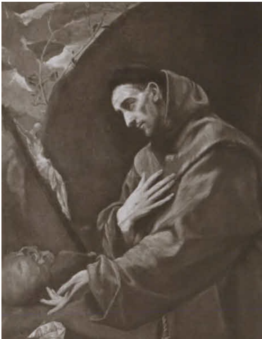
Молитва Святого Франциска.

Художник Эль Греко. 1587–1597 гг. США, Небраска, Омаха, Художественный музей Джослин