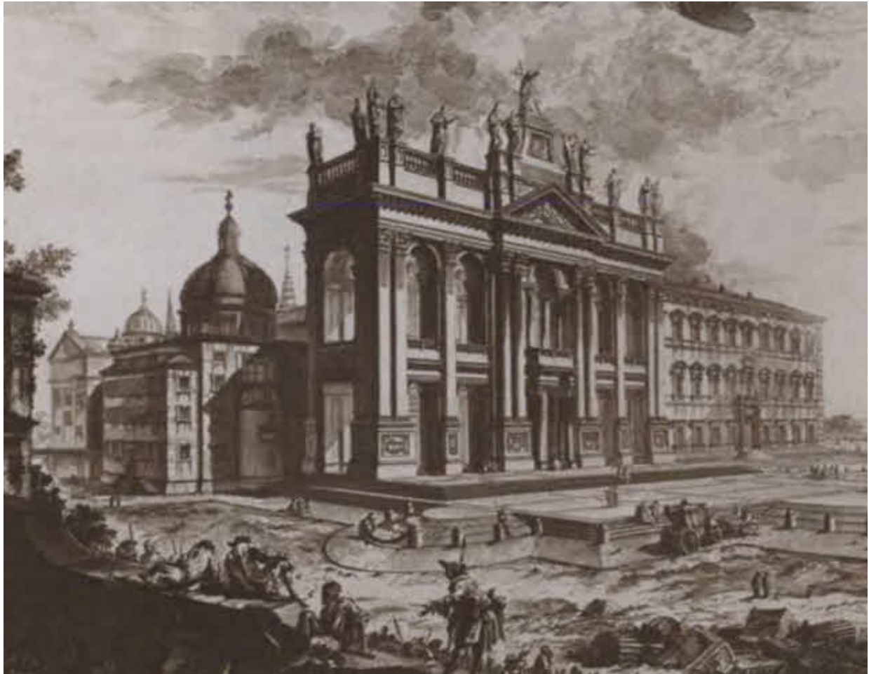
Собор во имя Святого Иоанна Крестителя на Латеранском холме (Сан-Джованни-ин-Латерано). Гравюра Дж. Б. Пиранези. XVII в.