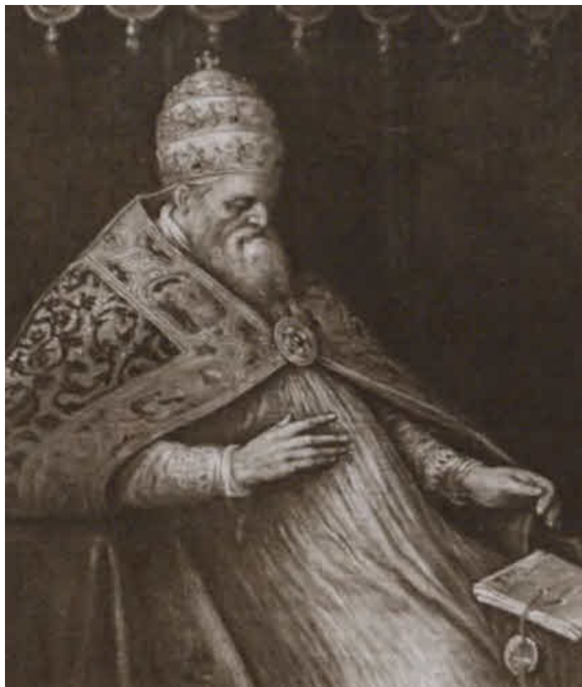
Папа Гонорий III.

Художник Л. Бассано. XVII в. Венеция, собор во имя Святых Иоанна и Павла (Санти-Джованни-э-Паоло)