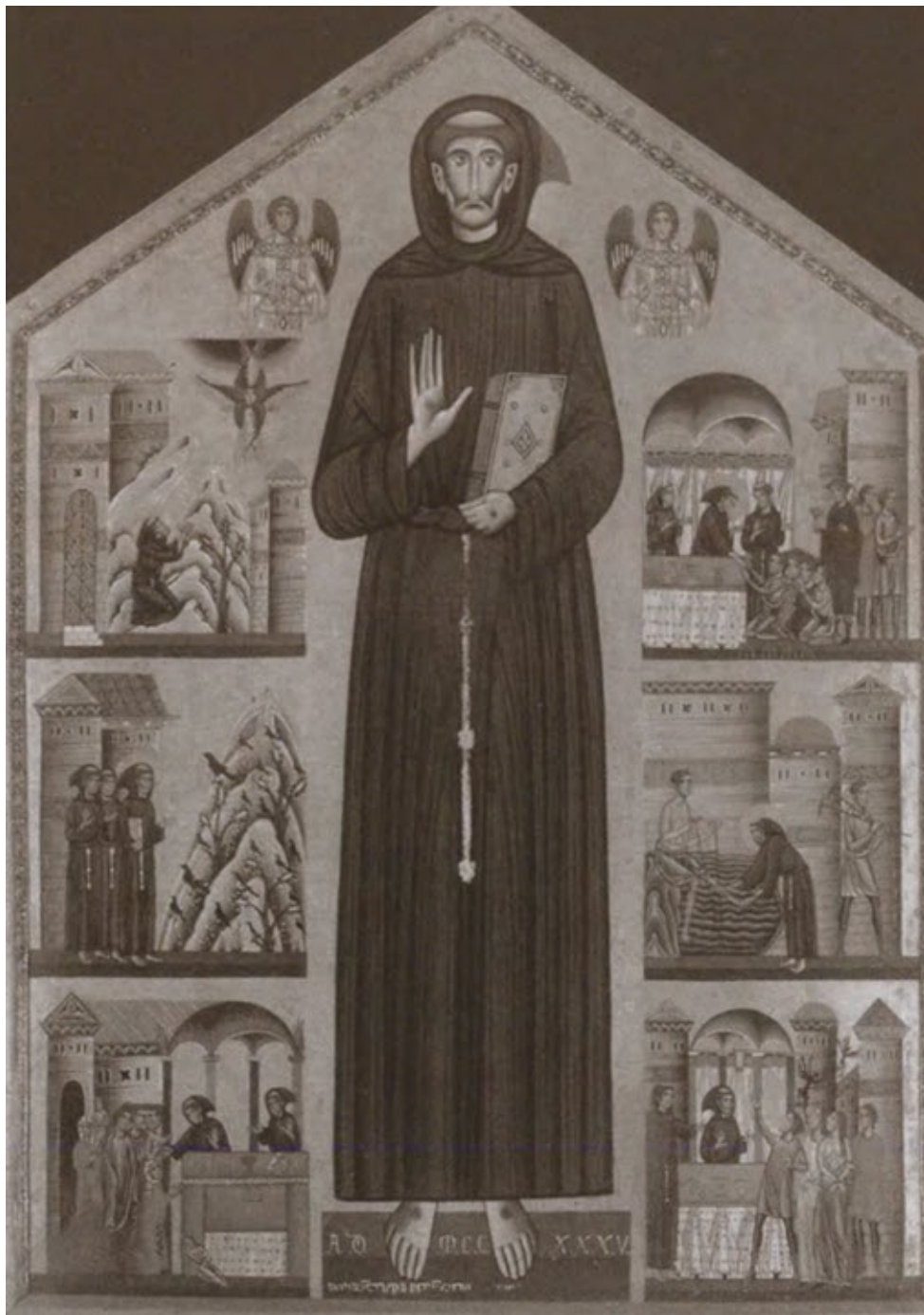
Святой Франциск и сцены из его жизни.

Художник Б. Берлигьери. 1235 г. Дерево, темпера. Италия, Пистоя, церковь во имя Святого Франциска