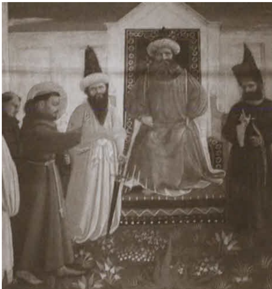
Святой Франциск перед султаном.

Художник Фра Беато Анджелико. 1440-е гг. Дерево, темпера. ФРГ, Тюрингия, Альтенбург, Музей Линденау