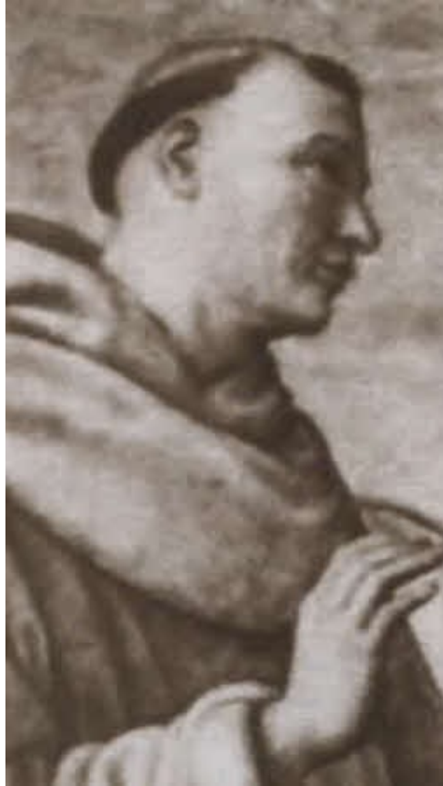
Брат Бернард ди Квинтавалле