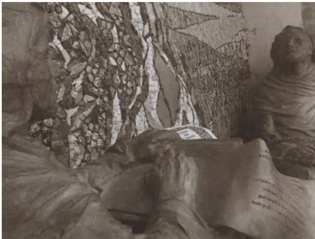
Франциск, диктующий «Гимн брату Солнцу». Фрагмент скульптурной композиции. Ассизи, монастырь Сан-Дамиано. 2015 г.