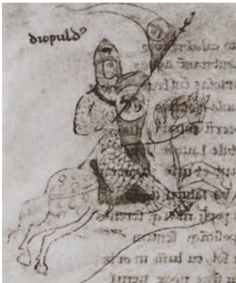
Рыцарь Диапольдо Ачерра. Миниатюра П. де Эболо из книги «Liber ad honorem Augusti sive de rebus Siculis». 1196 г.