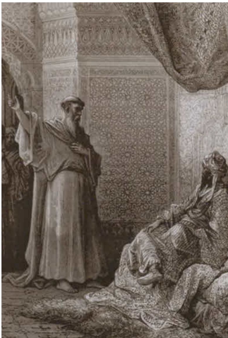
Святой Франциск перед султаном.