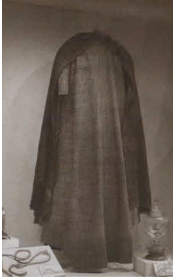
Ряса и мантия святой Клары.