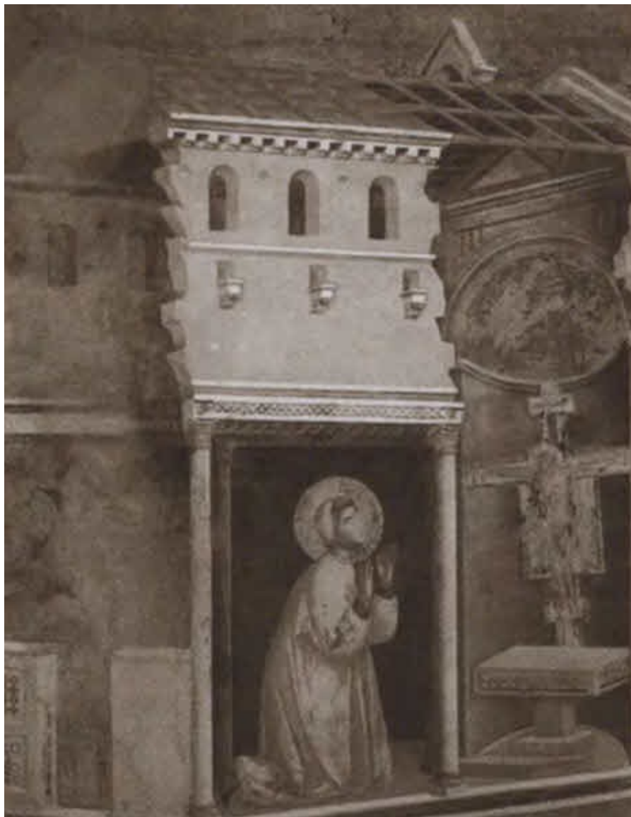
Распятие из Сан-Дамиано.

Художник Джотто и мастерская. Около 1298 г. Фреска. Ассизи, верхняя церковь базилики во имя Святого Франциска