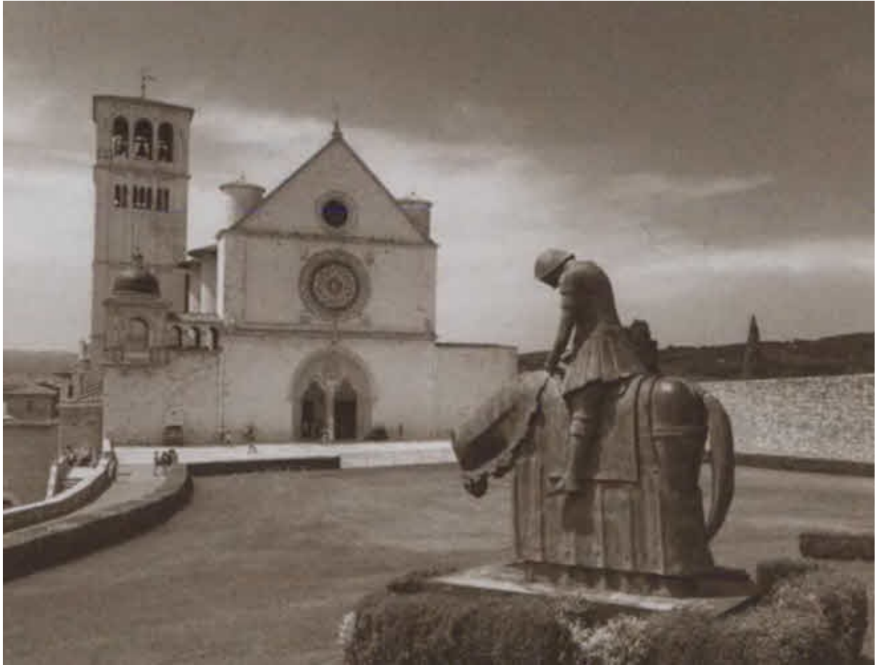
Базилика во имя Святого Франциска (фасад верхней церкви) и скульптура Франциска на ослике.