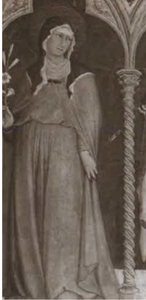
Святая Клара Ассизская.

Художник С. Мартини. 1317 г. Фреска. Ассизи, базилика во имя Святого Франциска