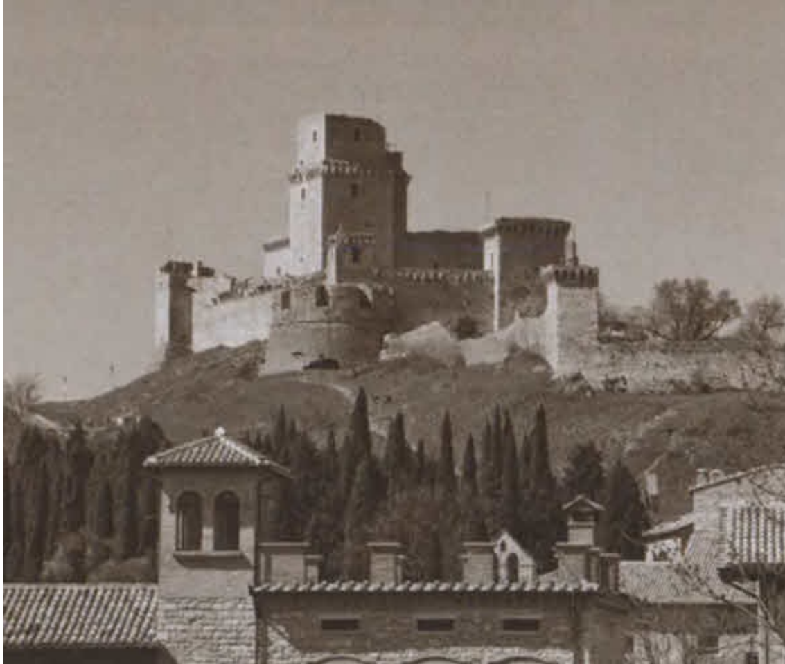
Большая крепость (Рокка Маджоре) времен завоевания Умбрии Карлом Великим. XI в. Ассизи. Современный вид