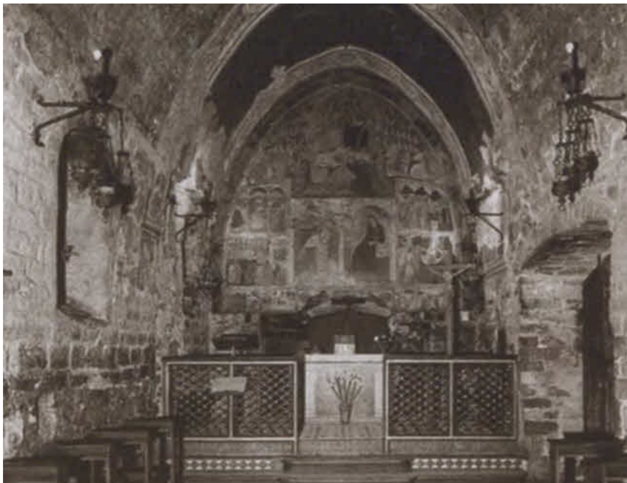
Внутреннее убранство Порциункулы — церкви Божией Матери Ангелов. IX в. Современный вид