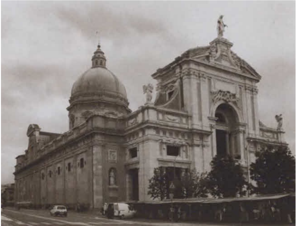
Базилика Божией Матери Ангелов (Санта-Мария-дельи-Анджели). XVII в.