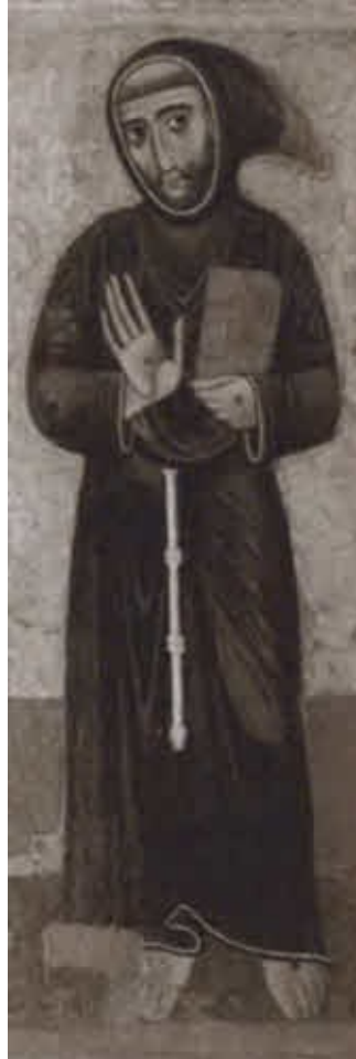
Святой Франциск Ассизский.

Художник Маргаритоне д'Ареццо. Алтарный образ. Дерево, темпера, золото. 1250–1270 гг. Ватикан, Пинакотека