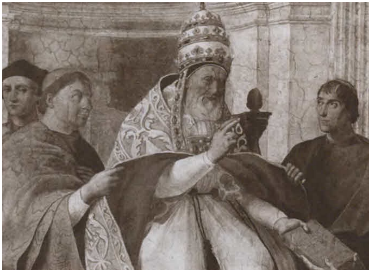
Папа Григорий IX.

Художник Рафаэль. Фреска. 1511 г. Ватикан, Апостольский дворец