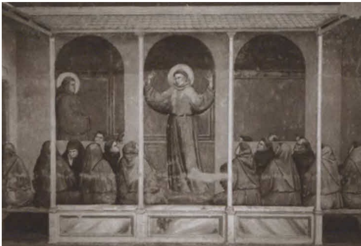
Святой Франциск с братьями-миноритами.

Художник Джотто и мастерская. Фреска. Около 1298 г. Ассизи, верхняя церковь базилики во имя Святого Франциска