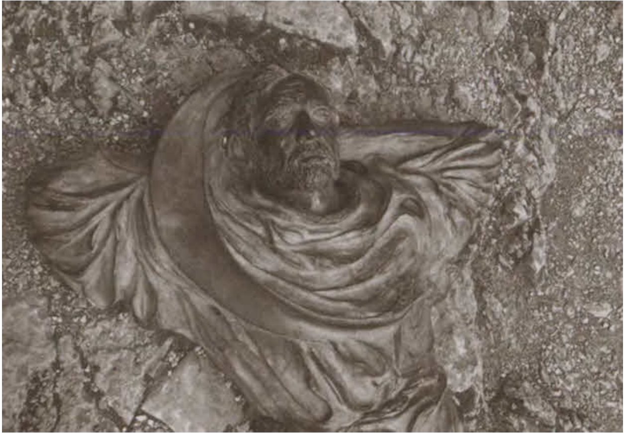
Лежащий Франциск. Фрагмент скульптурной композиции. Ассизи, обитель Эremo-делле-Карчери. 2015 г.