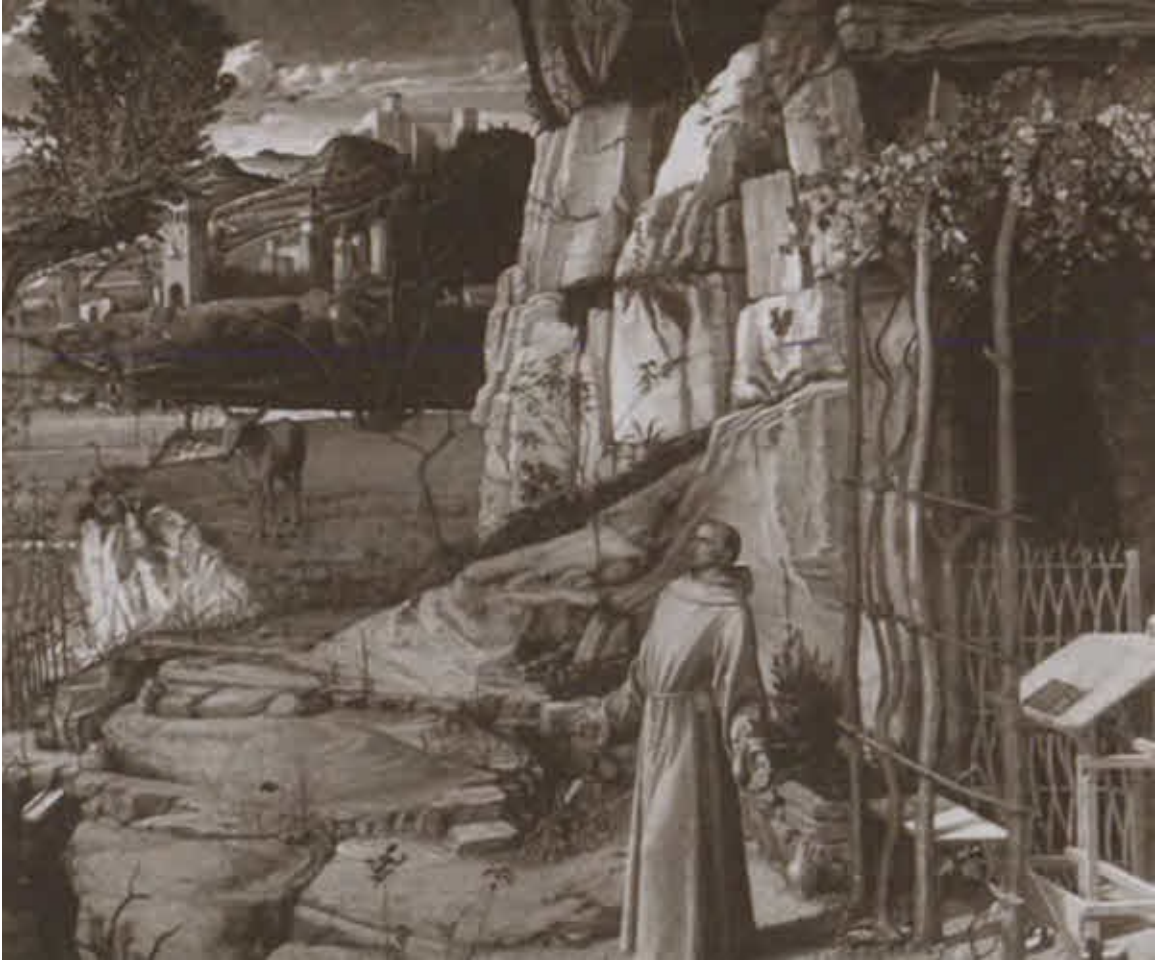
Экстаз святого Франциска.

Художник Дж. Беллини. Около 1480 г. Нью-Йорк, Собрание Фрика