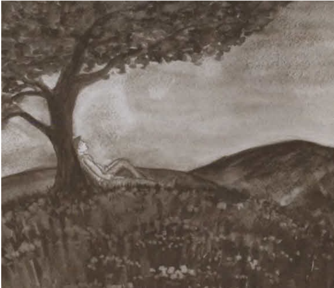
Юный Франциск, размышляющий о своем пути. Рисунок В. Будылиной. 2015 г.