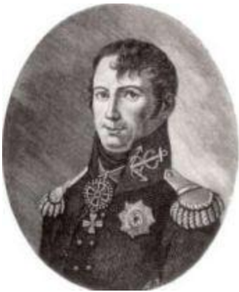
Адмирал Павел Васильевич Чичагов (1767–1849).