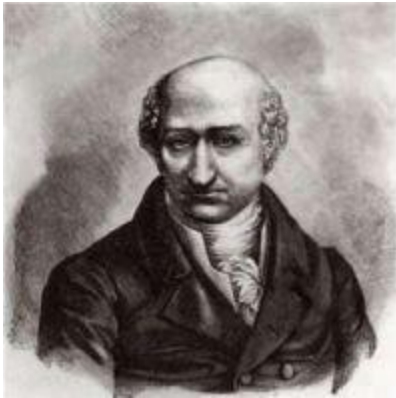
Барон Генрих Фридрих Штейн (1757-1831).