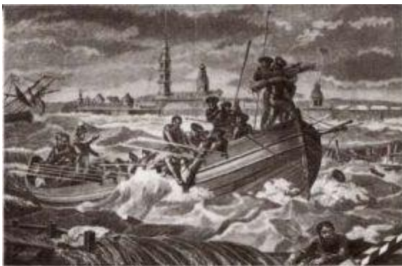
Наводнение в Петербурге.