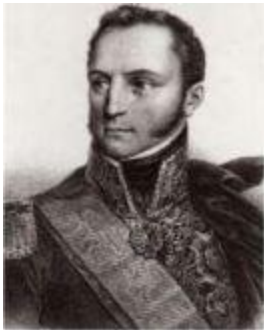
Маркиз Армон Опостен Коленкур, герцог Виченцкий (1773-1827).