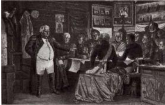
Военный совет в Филях.