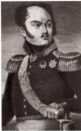
Граф Михаил Федорович Орлов (1788–1842).