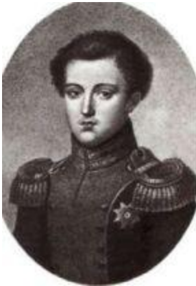
Будущий император Николай I, великий князь Николай Павлович в юности.