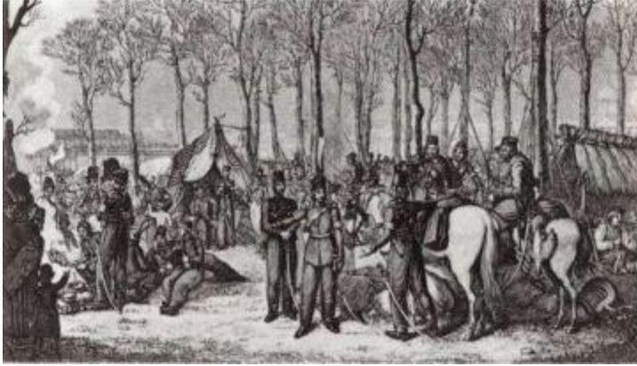
Бивуак казаков на Елисейских полях.