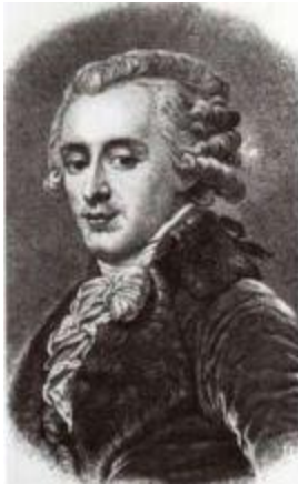
Князь Платон Александрович Зубов (1767–1822).