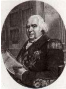
Король Франции Людовик XVIII (1755–1824).