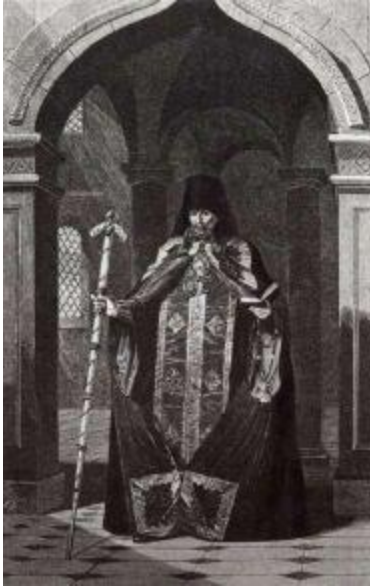
Архимандрит Фотий (1792–1838).