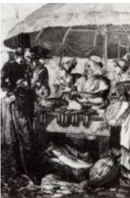
Русские в Париже в 1814 году.