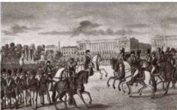
Смотр союзных войск в Париже в 1815 году.