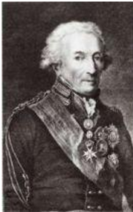
Князь Николай Иванович Салтыков (1736–1816).