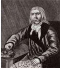
Кондратий Селиванов (1737–1832), основатель секты скопцов.