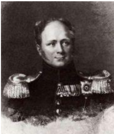
Император Александр I.