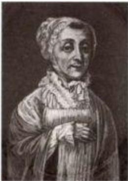
Баронесса Варвара Юлия Крюденер (1764-1825), урожденная Фитингоф.