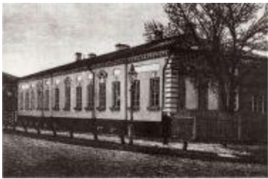
Дом в Таганроге, в котором провел последние дни император Александр I.