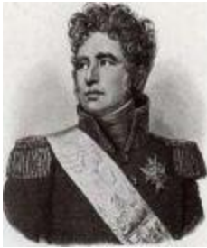
Граф Александр Жак Лористон (1768–1828).