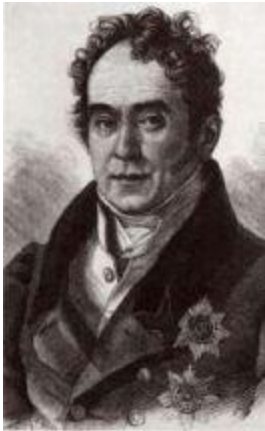
Князь Виктор Павлович Кочубей (1768–1834).