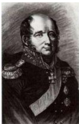
Граф Михаил Богданович Барклай-де-Толли (1761-1818).