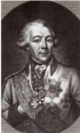
Граф Петр Алексеевич Пален (1745–1826).