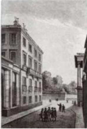
Дом Талейрана в Париже, в котором жил император Александр I в 1814 году.