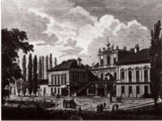
Дворец Чарторыйских в Пулавах, где не раз останавливался император Александр I.