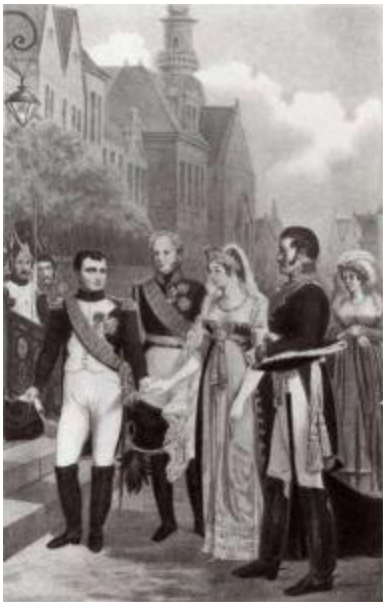
Встреча в Тильзите. Слева направо: Наполеон, Александр I, прусская королева Луиза и Фридрих Вильгельм III.