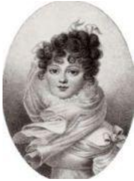
Великая княгиня Екатерина Павловна (1788–1819).