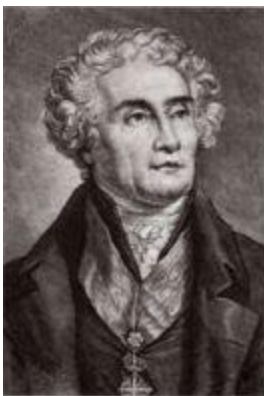
Граф Жозеф де Местр (1753-1821).