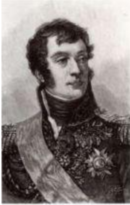
Маршал Огюст Фредерик Мармон (1774-1852), герцог Рагузский.