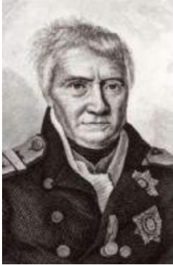
Адмирал Александр Семенович Шишков (1754–1841).