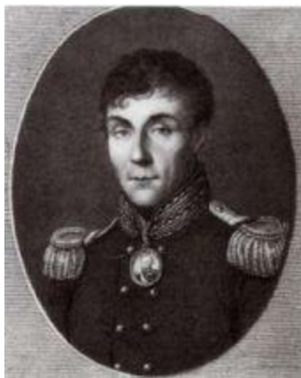
Граф Алексей Андреевич Аракчеев (1769-1834).