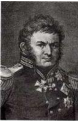
Генерал Алексей Петрович Ермолов (1777–1861).