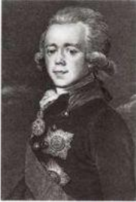
Император Павел I (1754-1801).