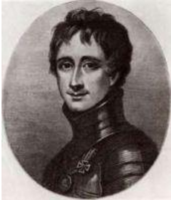
Роберт Томас Вильсон (1777-1849).