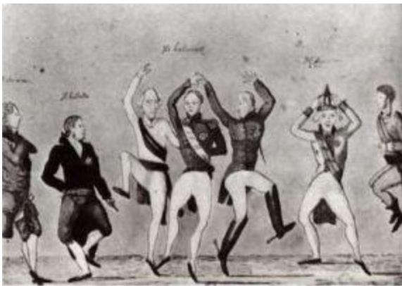
Карикатура на Венский конгресс.