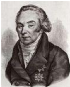
Граф Николай Петрович Румянцев (1754-1826).