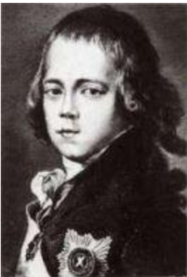
Великий князь Константин Павлович (1779-1831) в детстве.