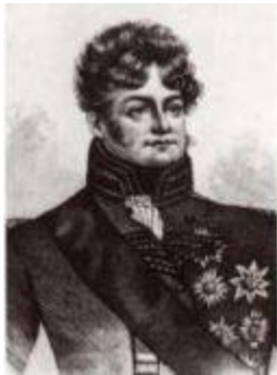
Георг IV (1762–1830), принц-регент (1811–1820); король Великобритании (с 1820 года).