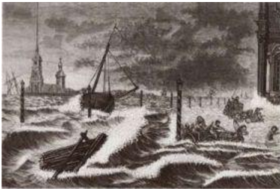
Наводнение в Петербурге, на Дворцовой набережной.