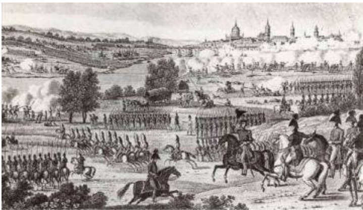
Сражение при Дрездене.