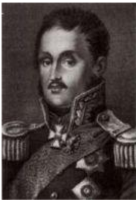
Князь Петр Христианович Витгенштейн (1768–1842).