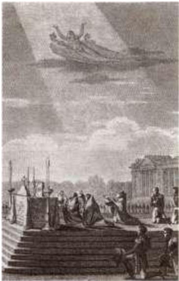
Православная Божественная Пасхальная литургия в Париже.