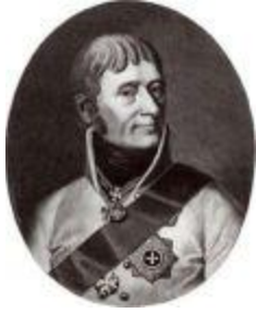
Граф Леонтий Леонтьевич Беннигсен (1745-1826).