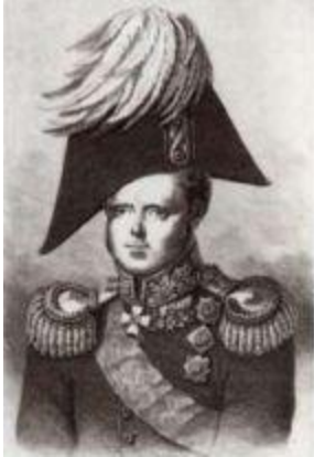
Великий князь Константин Павлович.