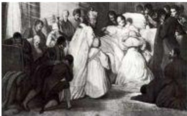
Александр I на смертном одре причащается Св. Таин.