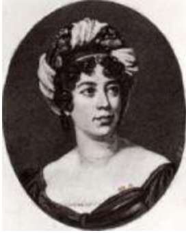
Анна Луиза Жермена де Сталь (1766-1817).