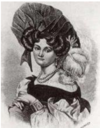
Графиня Алексеевна Орлова-Чесменская (1785-1848).