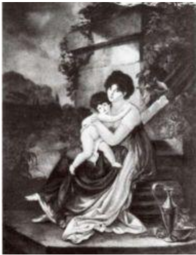
Графиня Мария Нарышкина, возлюбленная Александра I. Очевидно, на портрете она изображена со своей дочерью Софьей.