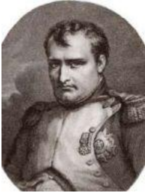
Наполеон в 1815 году.