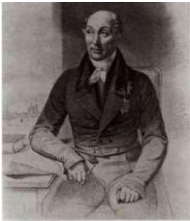
Михаил Михайлович Сперанский (1772–1839).