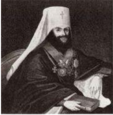
Митрополит московский Филарет (1782-1867).