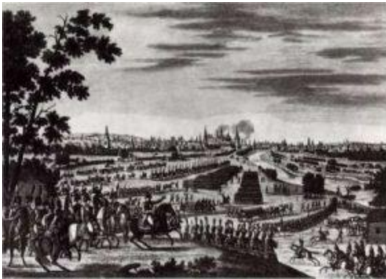
Вступление наполеоновской армии в Москву.