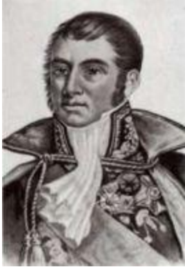
Генерал Савари (1774–1833).