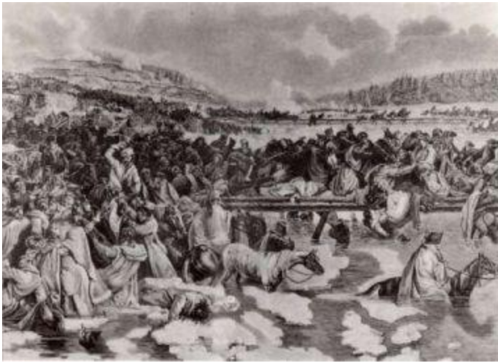
Переправа французской армии через Березину.