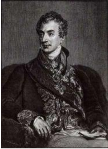
Князь Клеменс Венцель Метгерних (1773–1859).