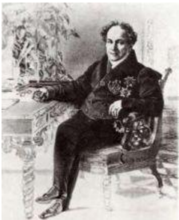
Князь Александр Николаевич Голицын (1773-1844).