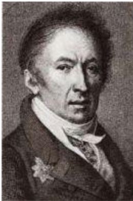
Николай Михайлович Карамзин (1766–1826).