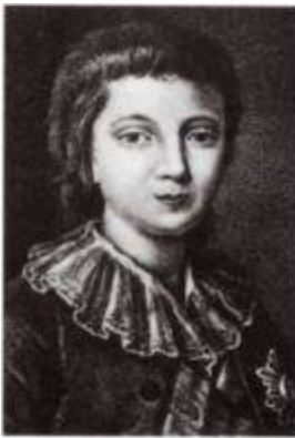
Великий князь Александр Павлович в 1787 году.