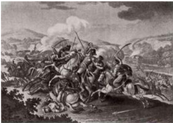
Взятие в плен генерала Вандама во время Кульмского сражения.