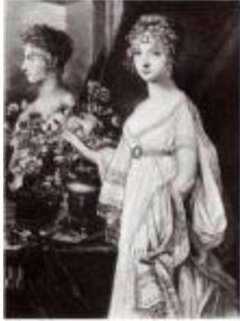
Императрица Елизавета Алексеевна (1779–1826).