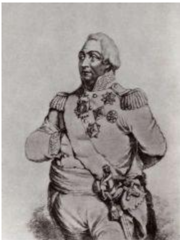
Генерал-фельдмаршал Михаил Илларионович Голенищев-Кутузов (1745–1813), светлейший князь Смоленский.