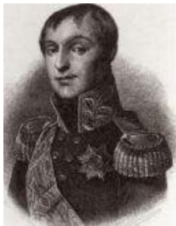
Принц Георгий Ольденбургский (1784–1812).