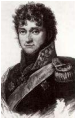
Граф Павел Александрович Строганов (1772–1817).