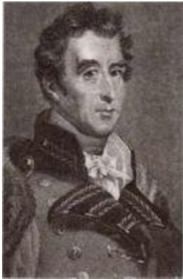
Фельдмаршал Артур Уэлсли, герцог Веллингтон (1769–1852).