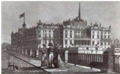
Михайловский замок, в котором совершено злодейское убийство императора Павла I.