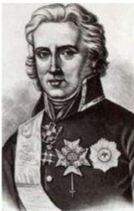
Граф Густав Мориц Армфельд (1757–1814).