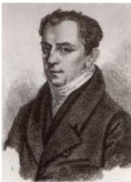
Граф Иоаннис Каподистрия (1776–1831).