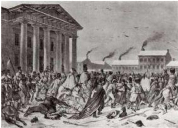
Отступление французов через Вильну.