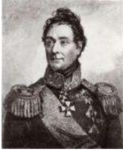
Граф Александр Федорович Ланжерон (1763–1831).