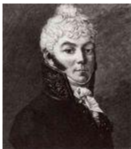
Граф Николай Николаевич Новосильцев (1768-1838).