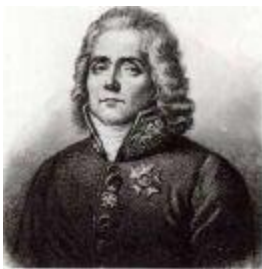
Шарль Морис Талейран (1754-1838), князь Беневентский, герцог Дино.