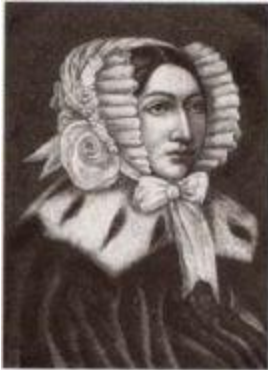
Графиня Роксандра Скарлатовна Эдлинг, урожденная Стурдза.