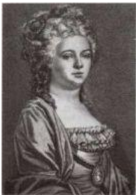
Императрица Мария Федоровна (1759-1828), урожденная принцесса Вюртембергская.