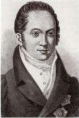
Граф Карл Васильевич Нессельроде (1780–1862).