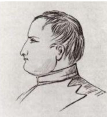
Наполеон. Рисунок адъютанта великого князя Константина Павловича, сделанный в Эрфурте.