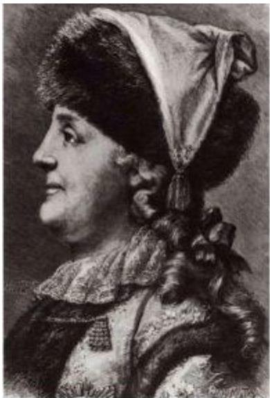
Императрица Екатерина II (1729-1796).