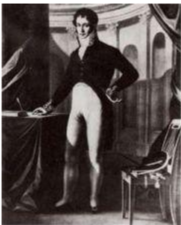
Адам Ежи Чарторыйский (1770–1861).