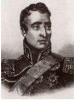
Граф Карл Андрей Поццо ди Борго (1764-1842).