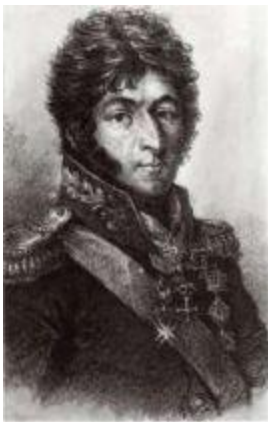
Князь Петр Иванович Багратион (1765–1812).