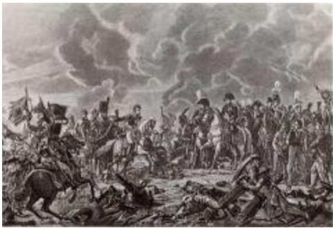
Сражение под Аустерлицем.