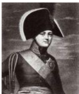
Император Александр I.