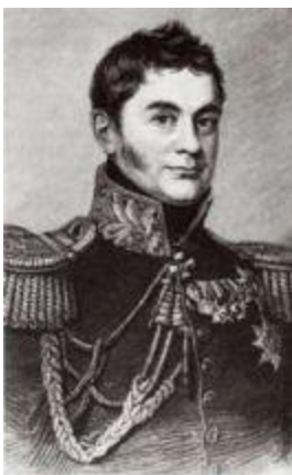
Князь Петр Михайлович Волконский (1776-1852).