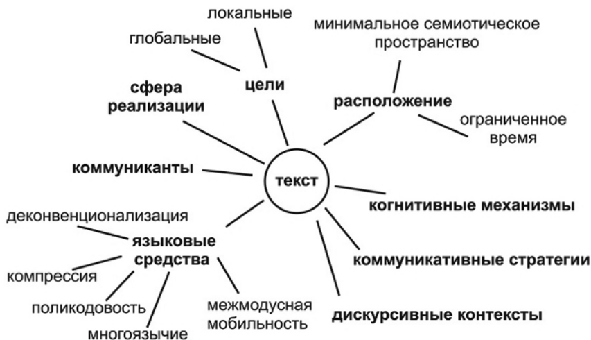
Рис. 1. Сводная модель конstitutивных признаков авангардного, PR- и рекламного дискурсов

гории ( пространство и время, участники коммуникации ) сочетаются со специфическим пониманием дискурса отдельными коммуникантами.