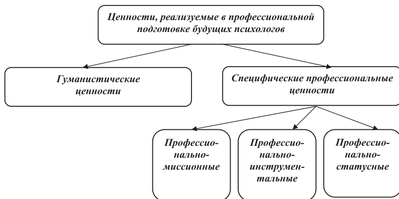
Рис. 1. Система ценностных оснований профессиональной подготовки будущих психологов

учебно-профессиональных функций, характер осуществления различных форм деятельности. Включение студента в данное пространство и систему взаимоотношений обуславливает интериоризацию профессиональных ценностей образовательной системы. Ценности учебно-профессионального сообщества в процессе учебно-профессиональной, квазипрофессиональной деятельности присваиваются будущим профессионалом.