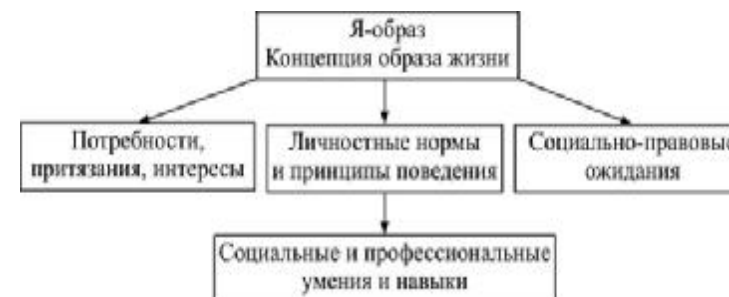
Рис. 3. Структура готовности личности к правопослушному образу жизни

Готовность к правопослушному образу жизни может быть представлена как система свойств его личности, которые в своей совокупности будут определять субъективную необходимость и возможность правомерного поведения в различных сферах жизнедеятельности. Совокупность этих свойств можно представить структурно (рис. 3).