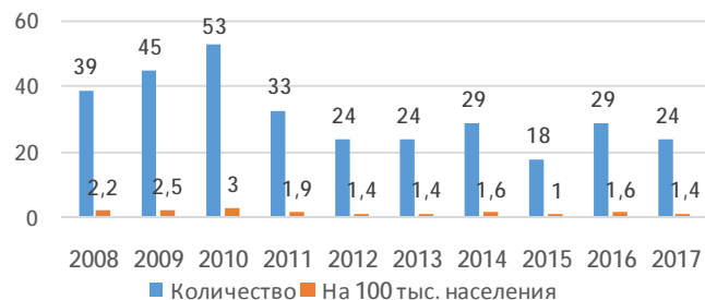
Рис. 1. Динамика уровня детских суицидов в Республики Беларусь в 2008–2009 гг.

Аутоагрессия. За последние 10 лет в Беларуси зафиксировано 318 детских суицидов (до 17 лет включительно), всплеск которых приходится на 2009–2010 гг. (рис. 1). Как правило, родители (опекуны) ребят не обращаются к специалистам по поводу изменений в их поведении (только 6,5 % из них оказывалась психоконсультационная или психиатрическая помощь). По статистическим данным, на одну девочку приходится 2,5 мальчика в возрасте 15–17 лет.