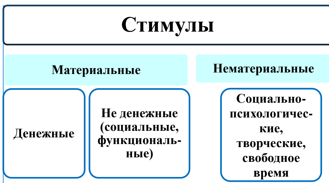
Схема 4.1. Система стимулирования служебной деятельности сотрудников ОВД

Не денежные стимулы способствуют уверенности в завтрашнем дне. Эти стимулы становятся актуальными при экономической нестабильности общества, выполнении служебных задач повышенной опасности.