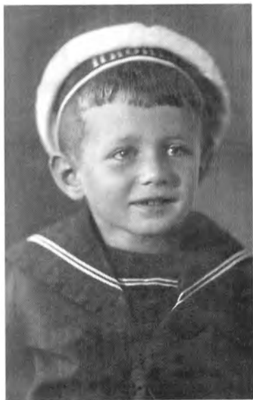
Юре 4 года.