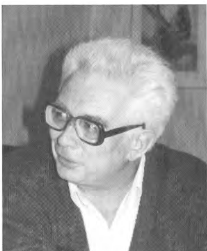
Дома (осень 1992 г.).