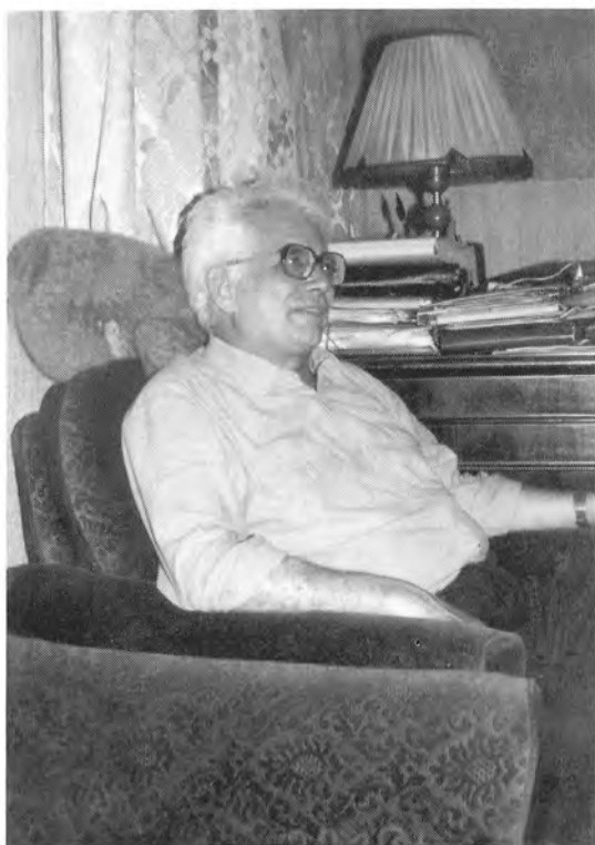
В рабочем кабинете (лето 1990 г.).