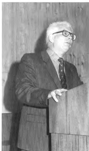
Выступление на симпозиуме (Киев, 1986 г.).