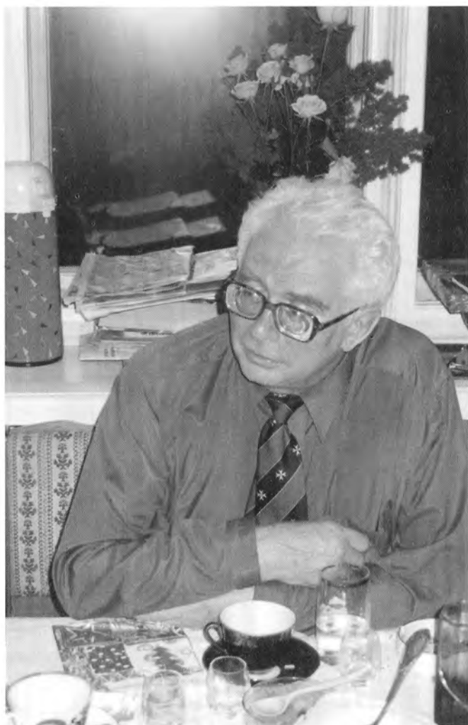
В гостях у сына (апрель 1999 г.).