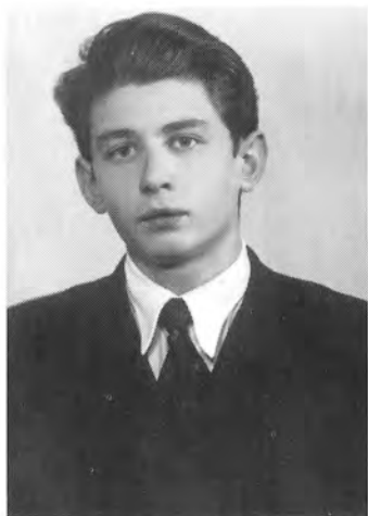
В школьные годы (9-й класс).