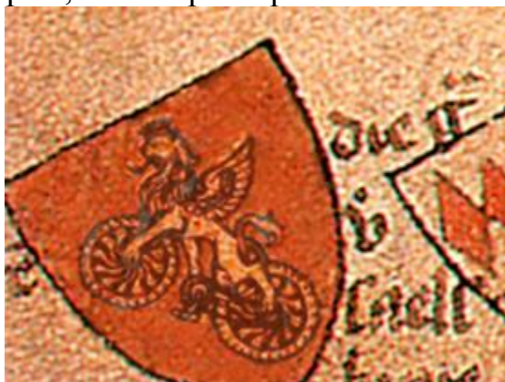
Фрагмент миниатюры из старинной рукописи «Деяния римлян» (FAITS DES ROMAINS) XIII в. (фальшивка)

Но фальсификация со средневековым рыцарским велосипедом на этом не заканчивается. Фальсификатор идет дальше. В подтверждении этой сенсации, ее автор приводил сведения о каком-то ранее малоизвестном (!) потому и тайном рыцарском ордене «Солнца и Луны», существовавшем в XII - XV веке в Европе, члены которого передвигались с помощью двухколесных экипажей, «железных коней», по сути, это были первые воины-велосипедисты средневековья. В доказательство этого приводились рыцарские гербы, на которых красовался велосипед.