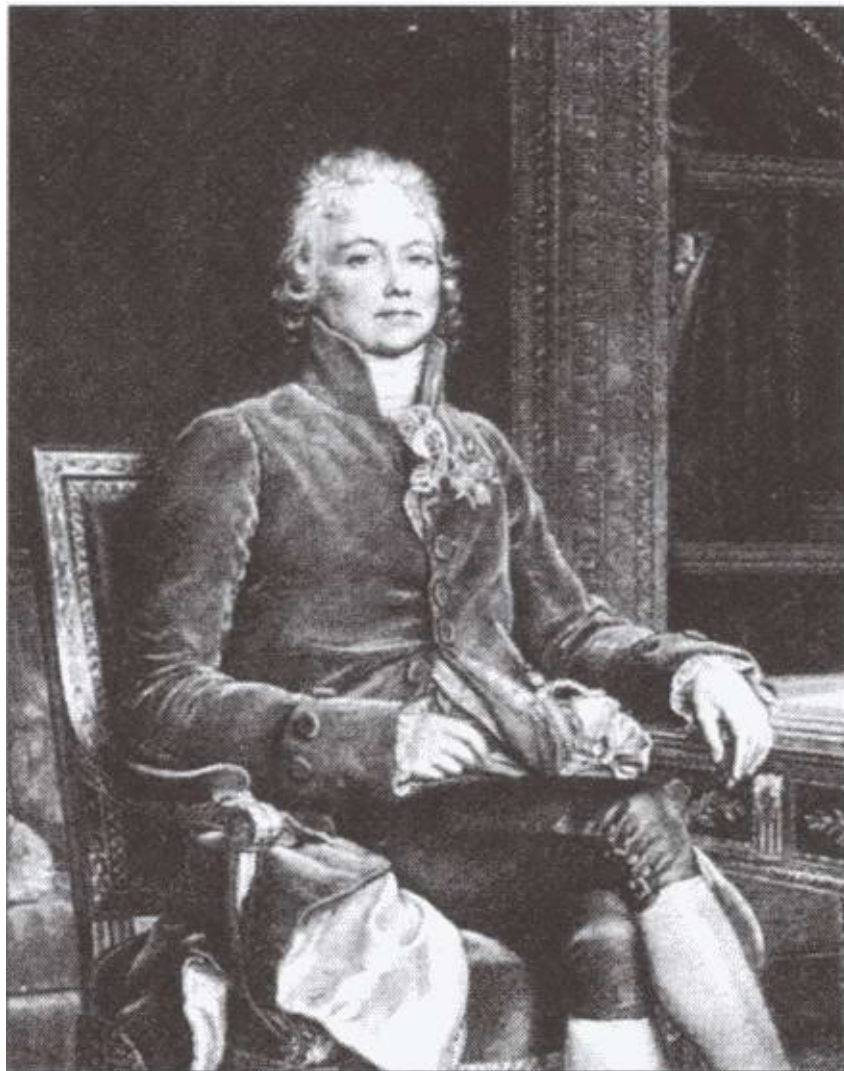
Ш.-М. Талейран-Перигор. С портрета работы Ф. Жерара