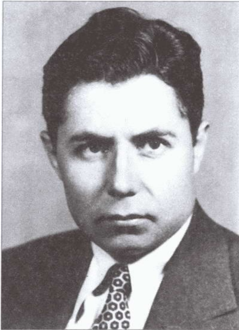
Герой Российской Федерации А.А. Яцков. 1950-е гг.