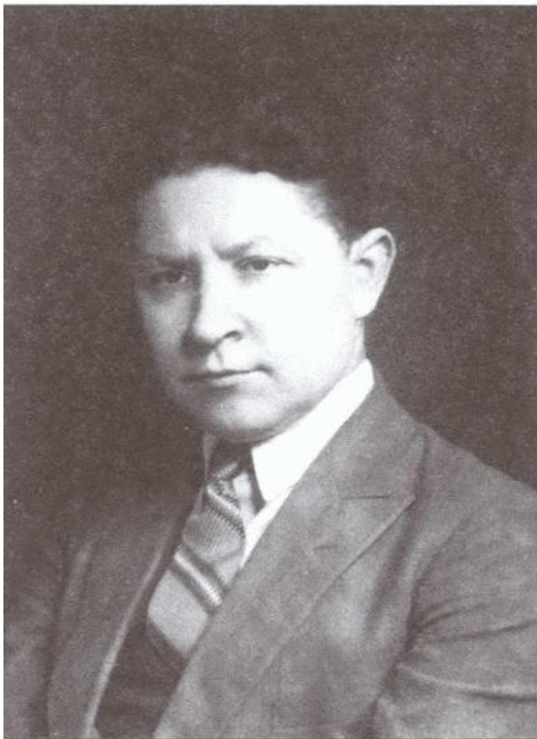
Представитель советской разведки в Лондоне И.А. Чичаев