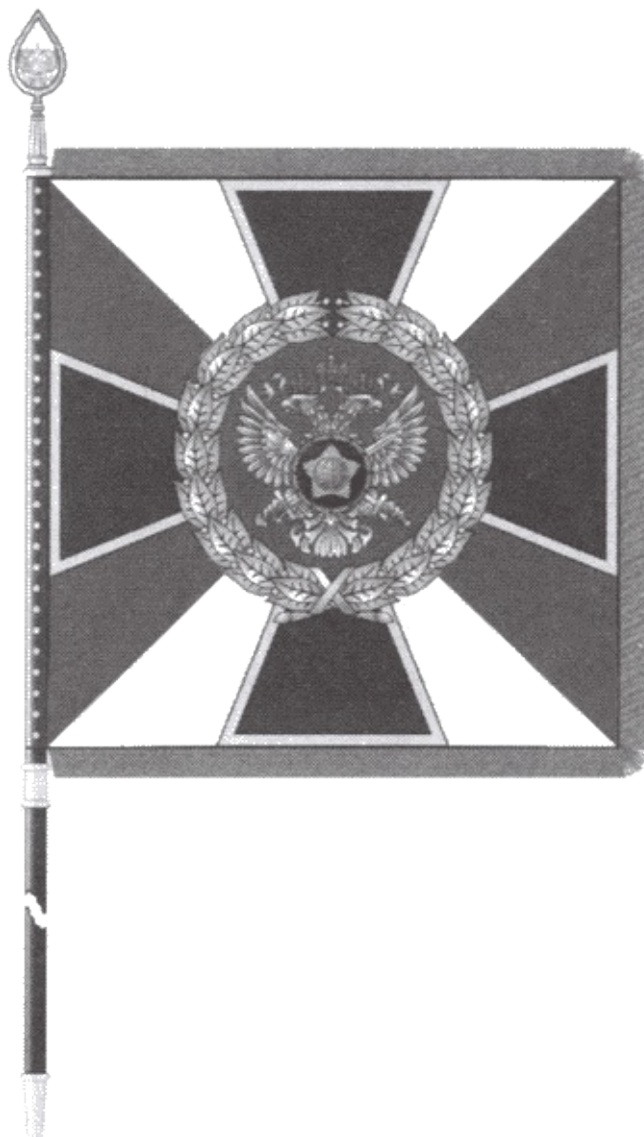
Штандарт Директора СВР