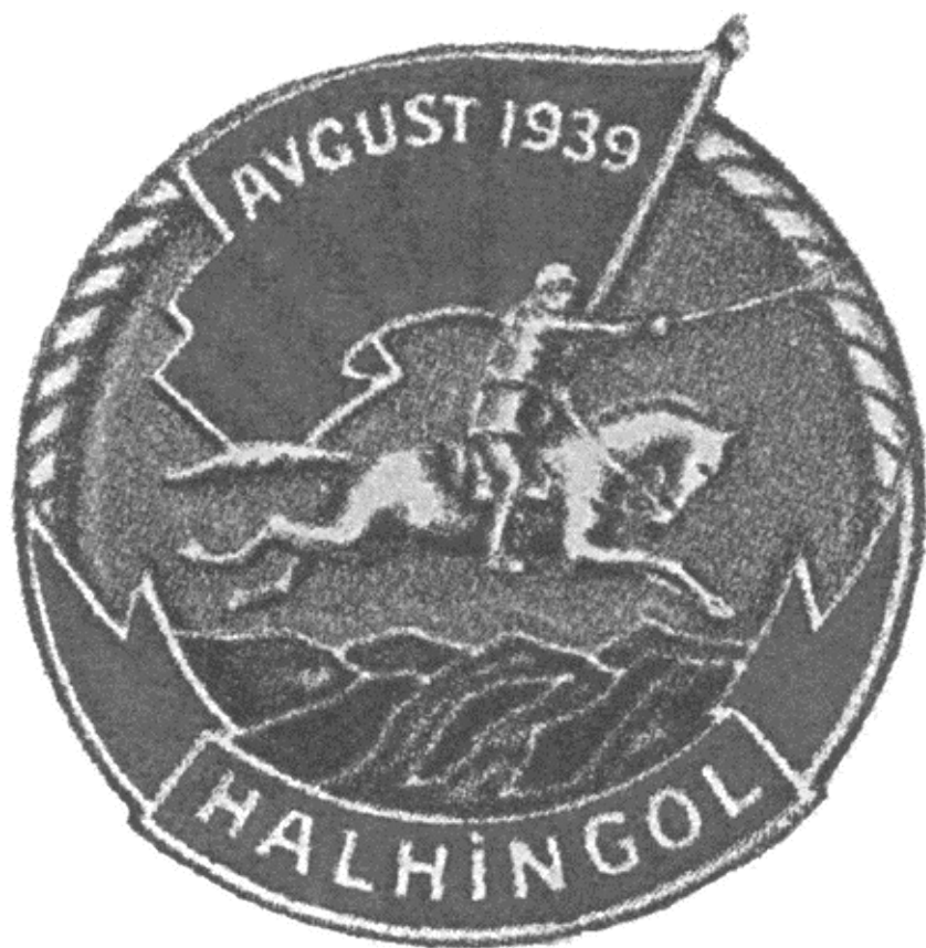
Знак «Участнику боев у Халкин-Гола»