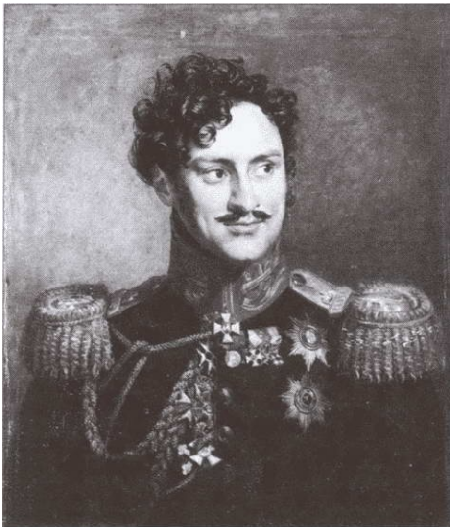
А.И. Чернышов. Художник Дж. Доу