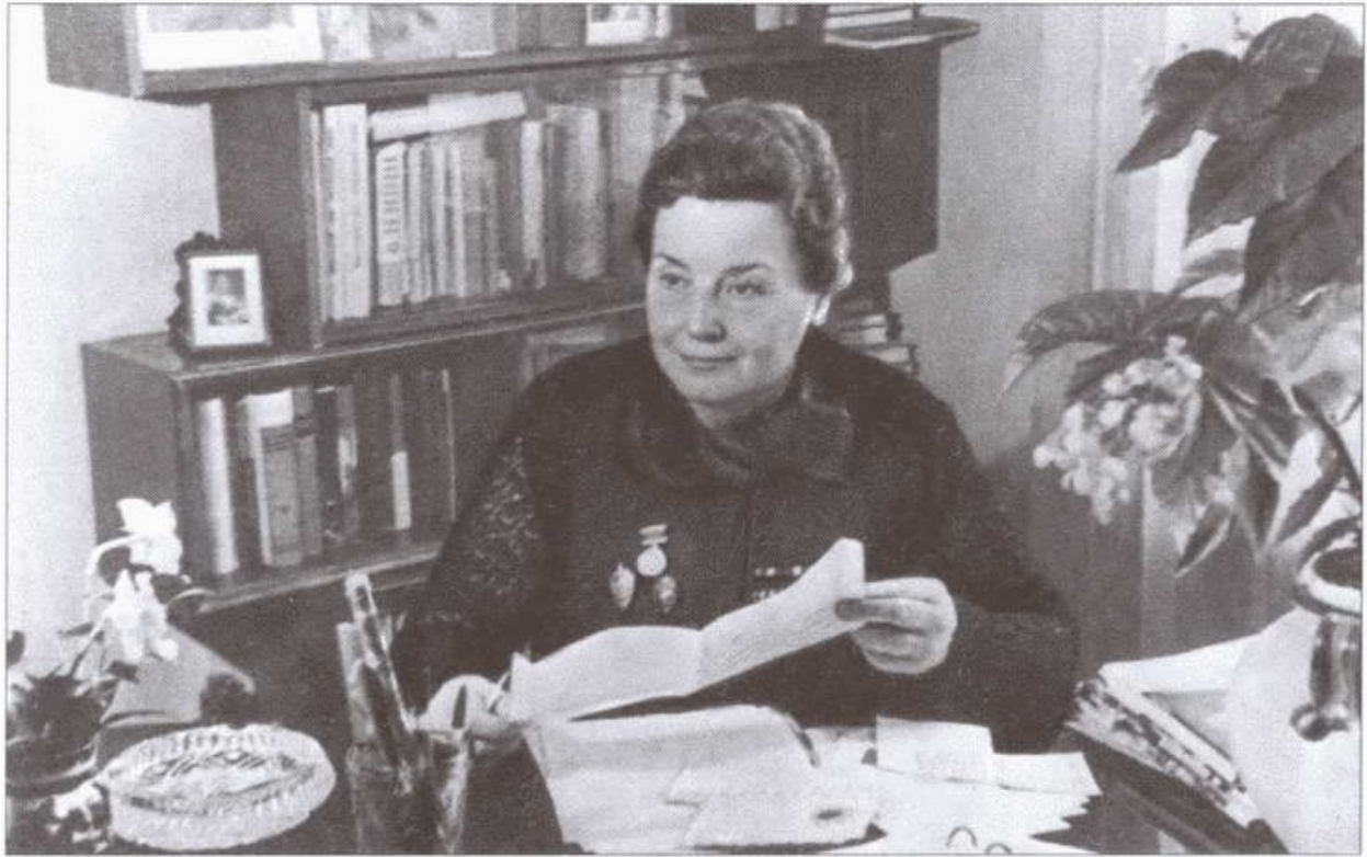
Писательница З. Воскресенская в рабочем кабинете. 1968 г.