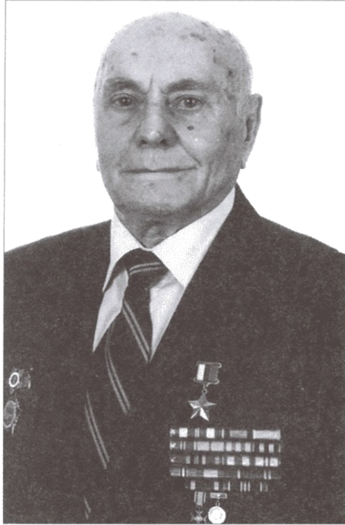
Герой Российской Федерации А.Н. Ботян. 2013 г.