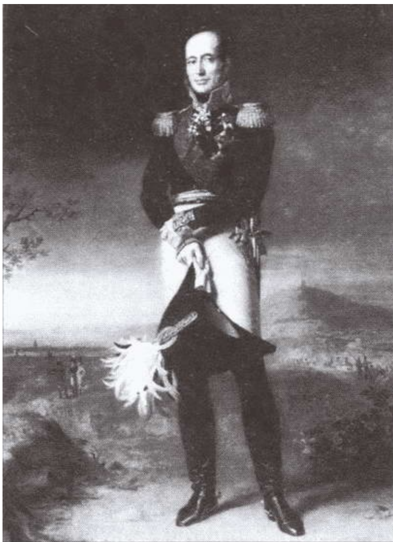
М.В. Барклай-де-Толли. Художник Дж. Доу