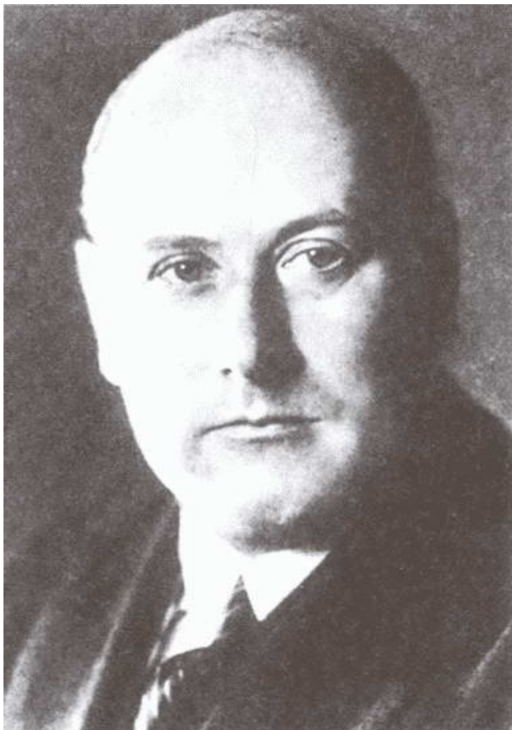
Представитель английских спецслужб в Москве Дж. Хилл