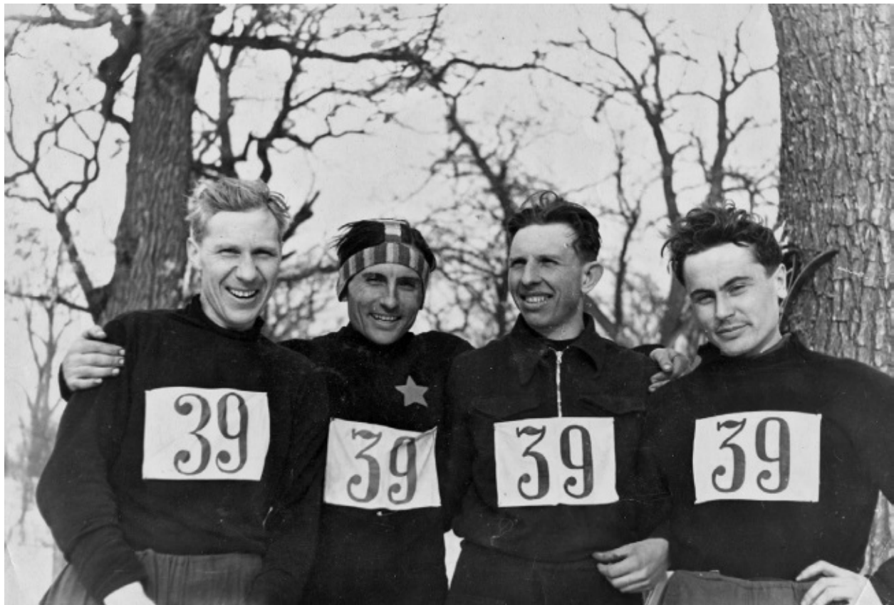
Первенство Киевского военного округа. Победители лыжной эстафеты

...Однако минут через пятнадцать надсмотрщик принес в камеру допотопную чернильницу, ручку и бумагу.