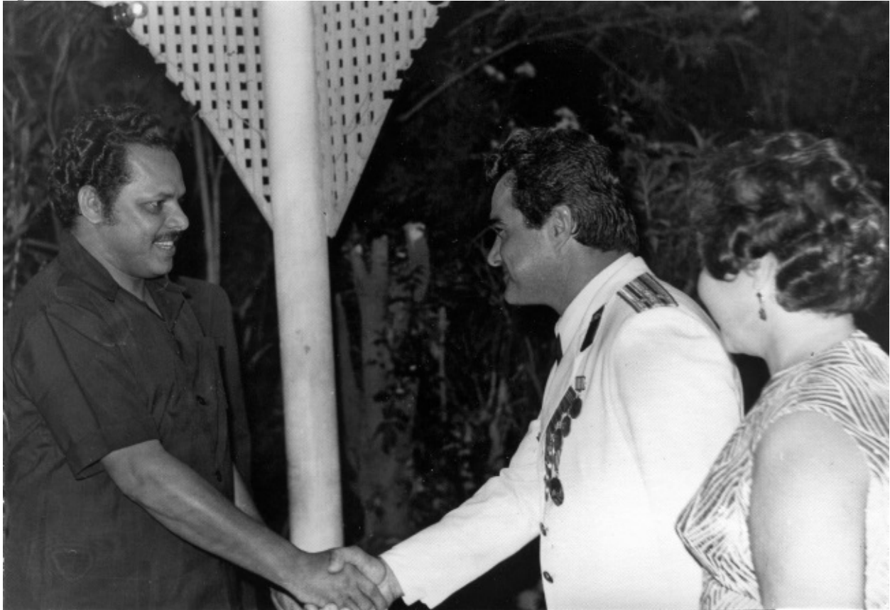
Премьер-министр НДРЙ Мухаммед на приеме в советском посольстве. Аден, 1980 г.

Резидент приглашал к себе подполковника Наона еще и еще раз. Но ничего нового Владимир Ованесович добавить не мог, кроме того, что источник надежный, а решение в Каире было принято в узком кругу президента Садата и его самых близких соратников.