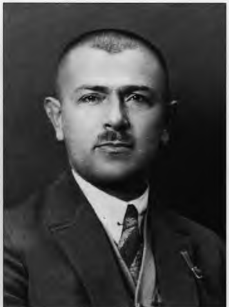
Казимир Баранский – резидент советской разведки в Варшаве. Публикуется впервые