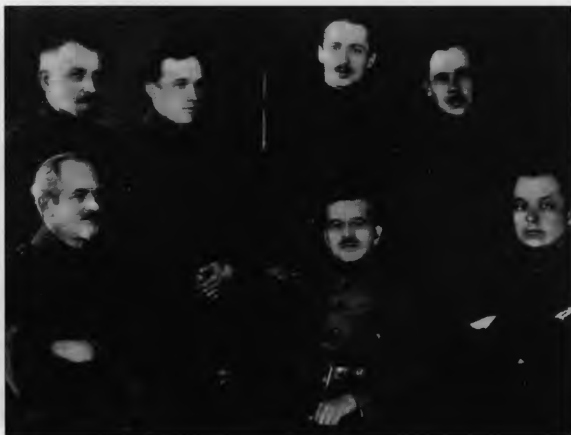
Польские коммунисты на Западном фронте