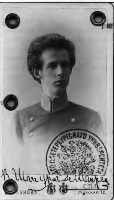
Витольд Штурм-де-Штрэм – польский коммунист