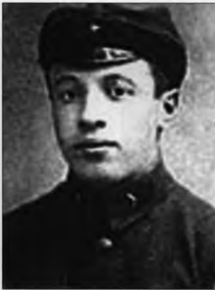
Виктор Осоловский – начальник польского отделения советской контрразведки в 1936–1937 гг. Публикуется впервые