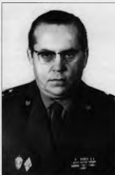
Виктор Пахомов – начальник отделения Следственного управления КГБ СССР