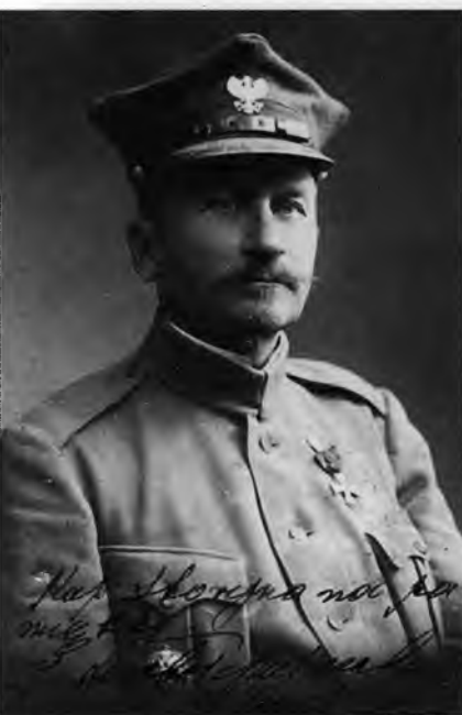
Иосиф Довбор-Мусницкий – командир польского корпуса в 1918 г.