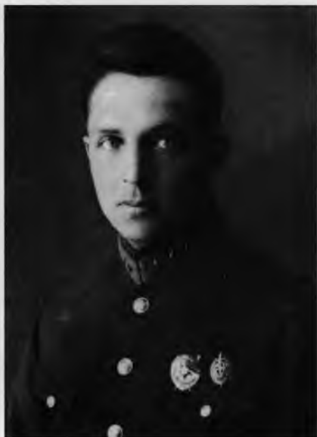
Игнатий Сосновский – сотрудник советской контрразведки