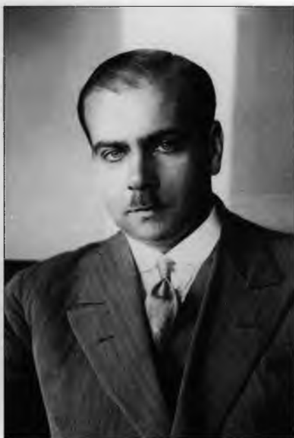
Игнаци Матушевский – начальник польской разведки в начале 1920-х гг.