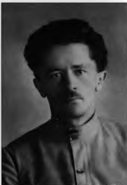
Юрий Маковский – начальник польского отделения ОО ВЧК в 1922 г. Публикуется впервые