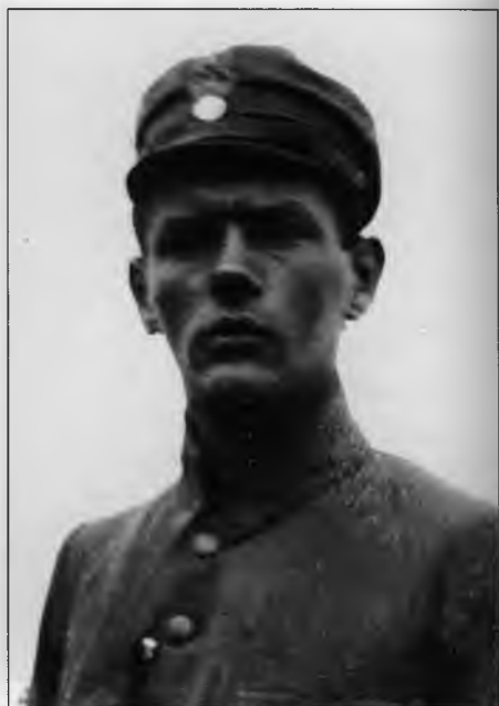
Виктор Витковский – начальник польского отделения ОО ВЧК в 1920 г. Публикуется впервые