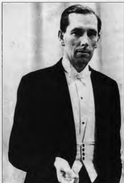
Тадеуш Кобылянский – польский атташе в Москве