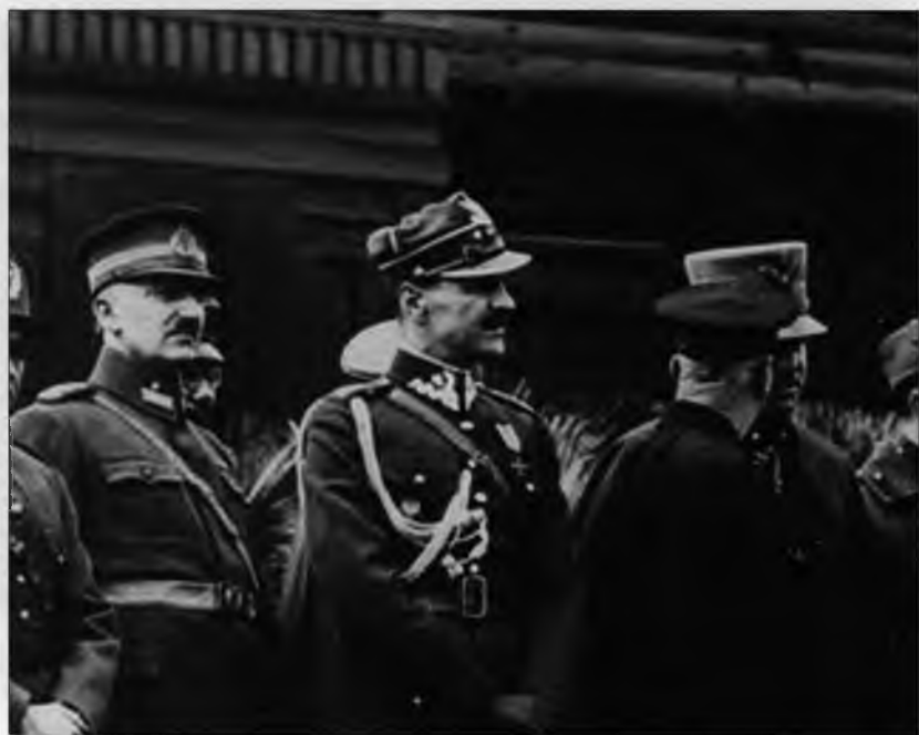
Польский военный атташе на Красной площади