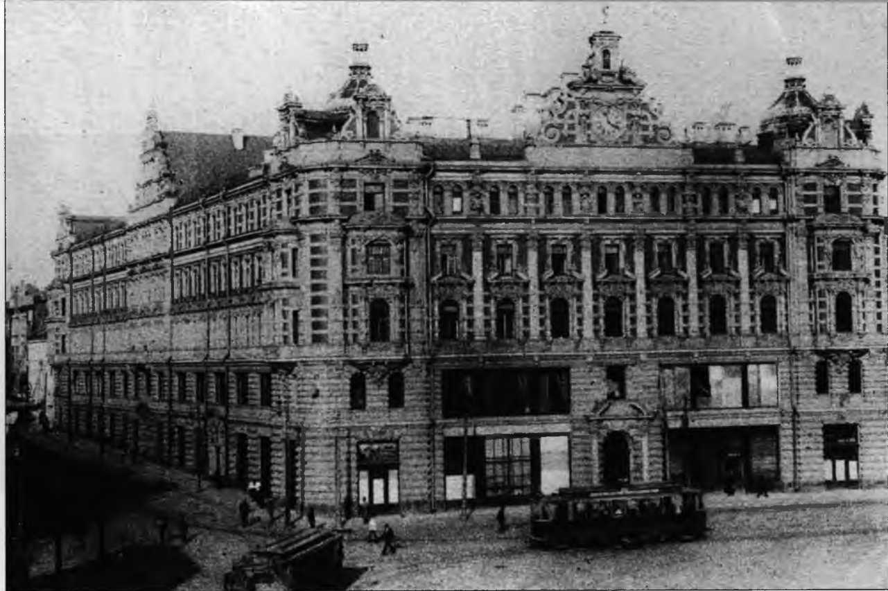
Вид здания Лубянки (ВЧК) в 1920-е гг.