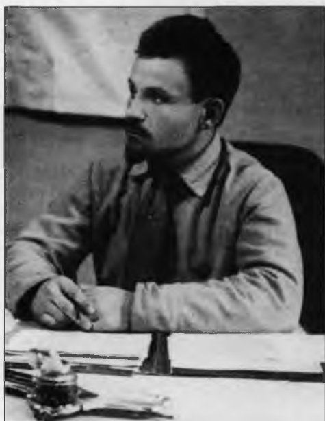
Артур Артузов – начальник советской контрразведки