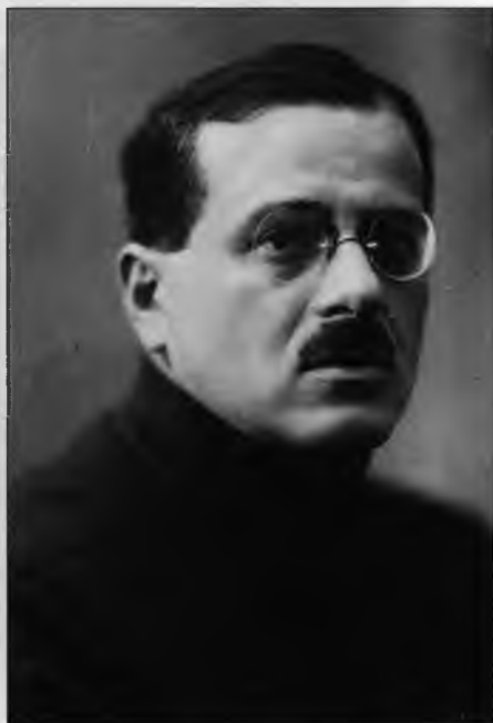
Иосиф Униликхт – заместитель председателя ВЧК