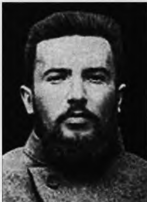
Станислав Пестковский – заместитель Наркомнаца