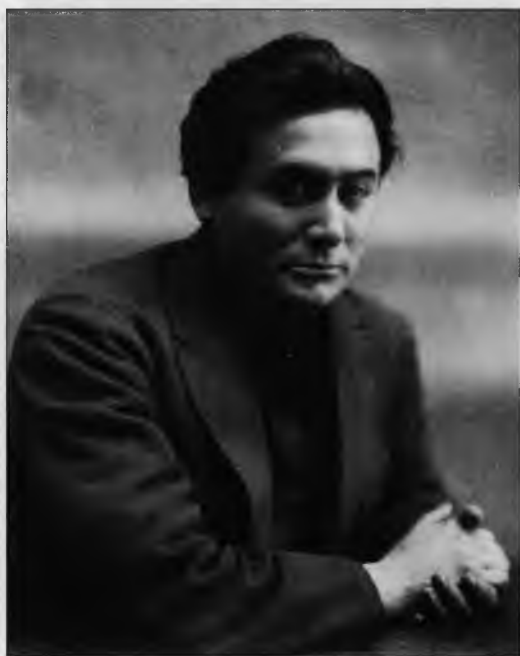
Яков Агранов – особоуполномоченный ОО ВЧК в 1920 г.