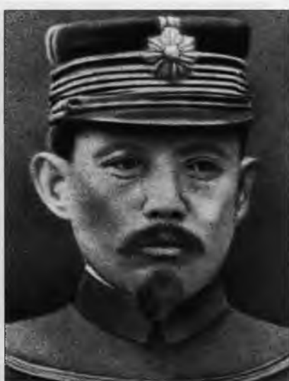
Мотодзиро Акаси – японский военный атташе в России