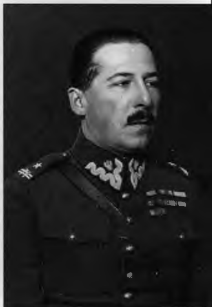
Ян Ковалевский – военный атташе Польши в Москве в 1920-е гг.