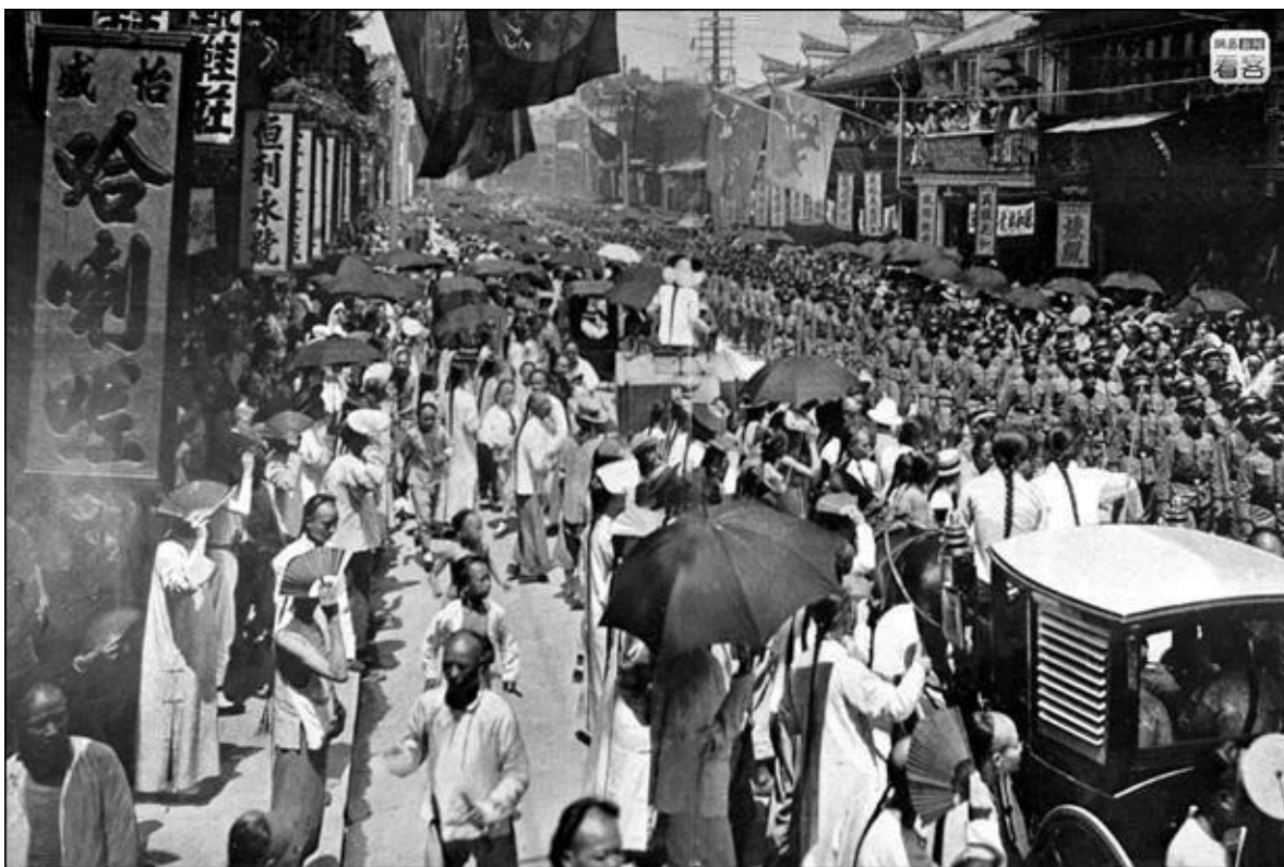
Шанхай. Первая половина XX в.