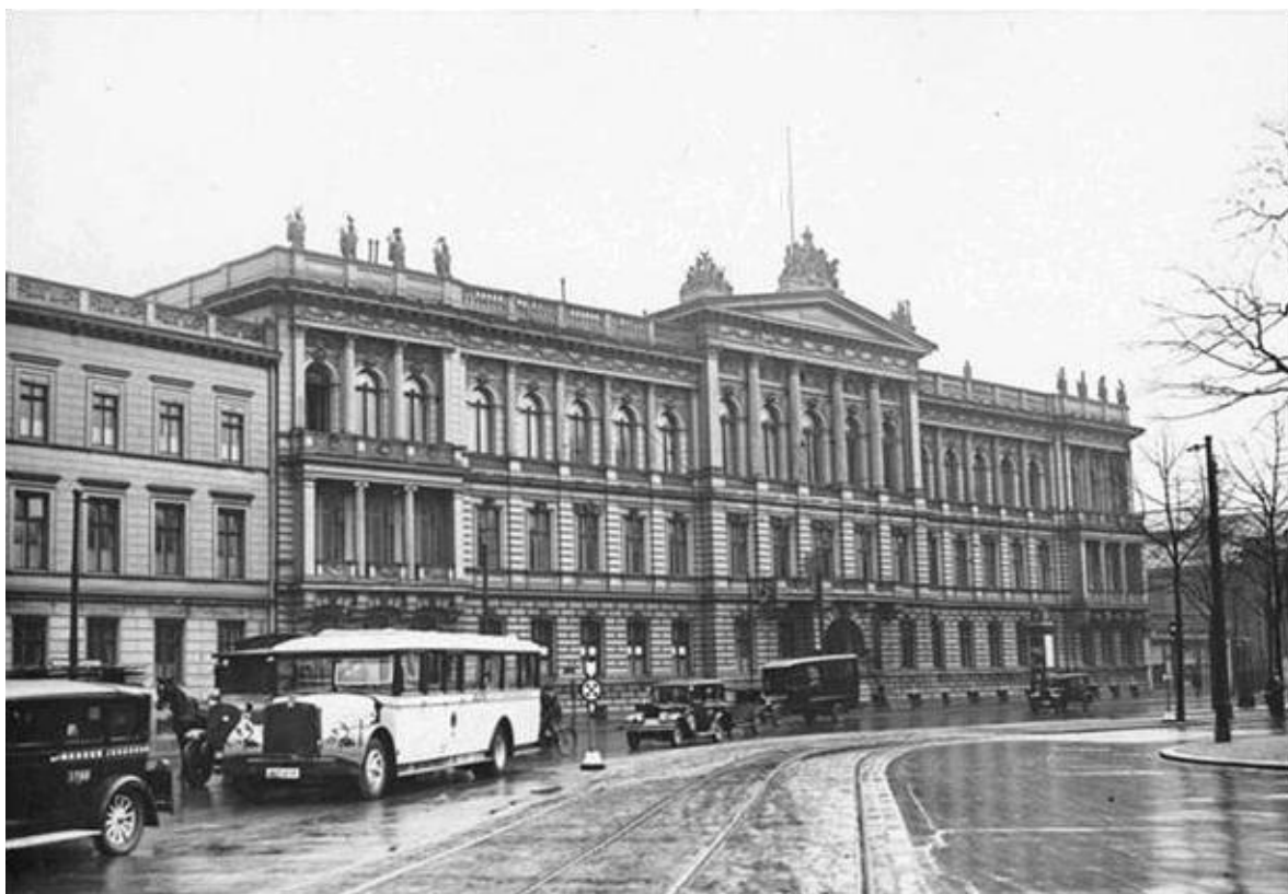
Американское посольство в Берлине. 1930-е гг.