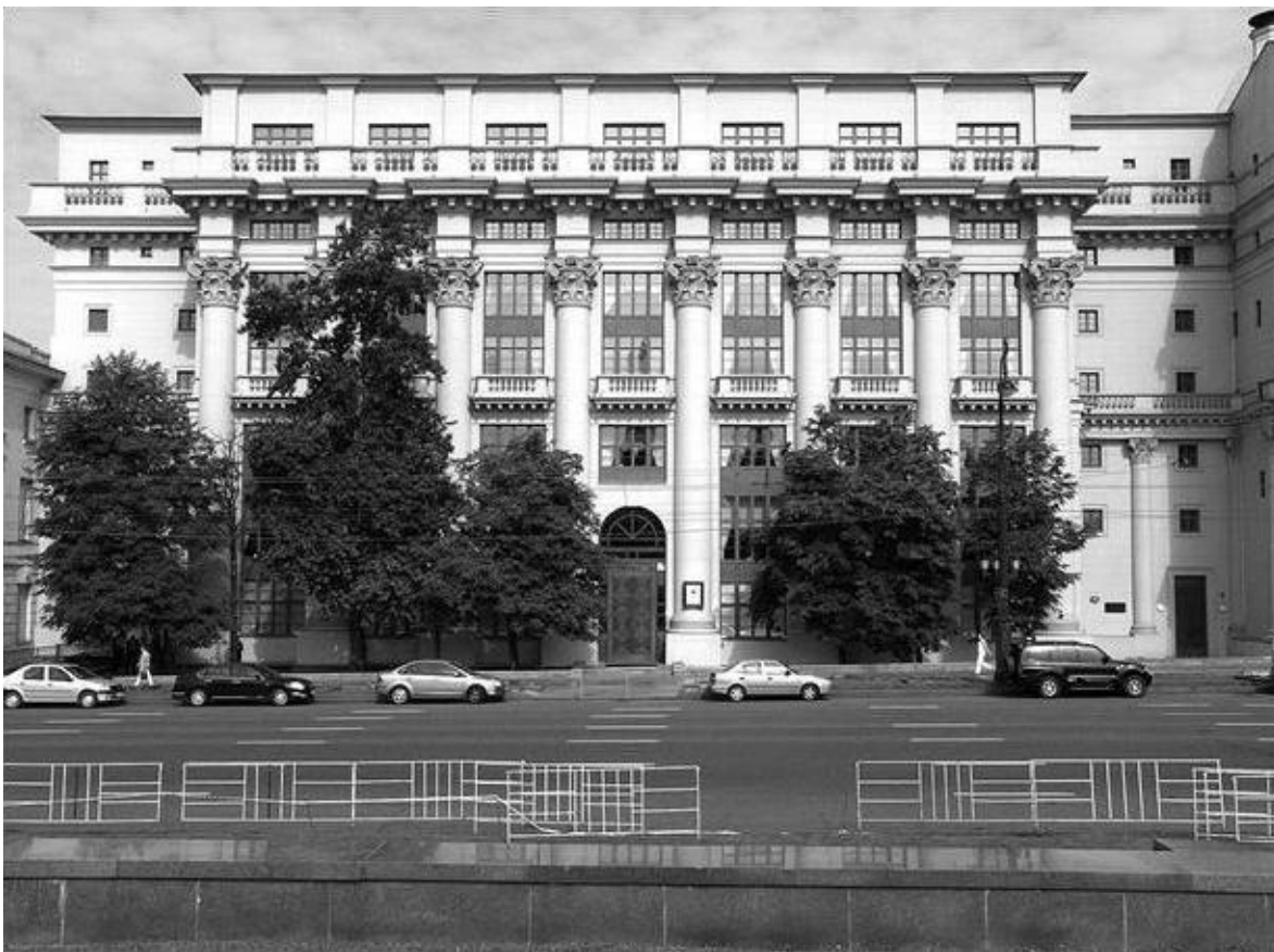
Американское посольство в Москве (до 1953 г.)