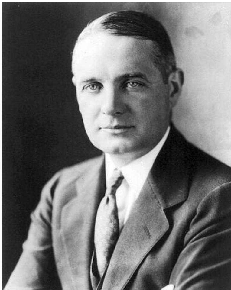
Уильям Джозеф Донован