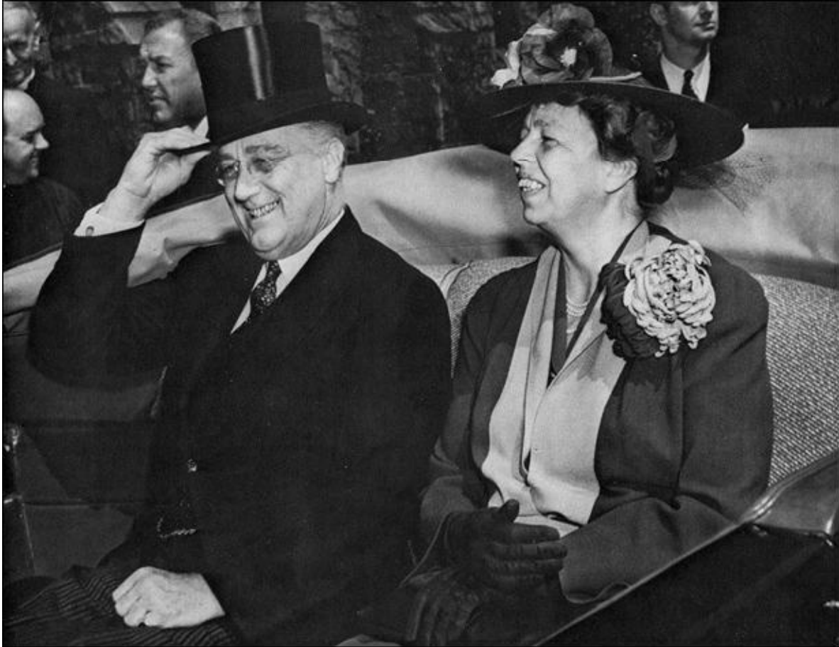
Ф.Д. Рузвельт с супругой