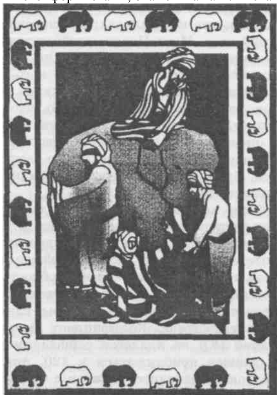
Слепые и слон

имеют абсолютно никакого отношения к творчеству. Широкое поле зрения, упомянутое ранее, существует. Длительность и упорный труд существенны при этом, — Эдисон говорил о необходимости 90% пота и 10% вдохновения. Изобретатели должны быть самоуверенными и решительными и не обескураживаться отрицательной практикой. Им следует быть бунтовщиками и неконформистами; знаменитая английская чопорность — вот тип творческой личности.