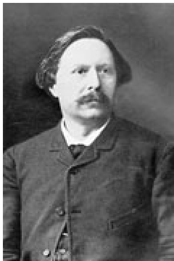
Édouard Schuré (1841-1929)

A French writer. The author of books on musical history and on mysticism, novels, verse, as in La Vie Mystique (1893) and L'Âme des Temps Nouveaux (1909), dramas, as Les Enfants de Lucifer (1900) and Léonardo de Vinci (1905), and critical works.