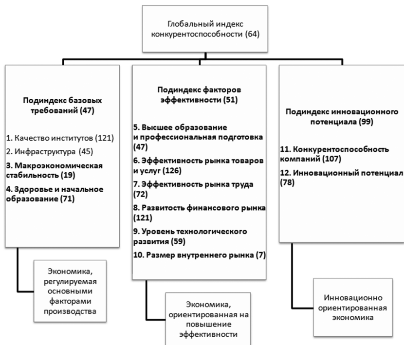
Рисунок 1. Структура индекса глобальной конкурентоспособности (в скобках показано место РФ в мире по соответствующему показателю)

В России поставлена задача модернизации экономики [3]. Для ее решения принципиальное значение имеет выявление главных, базовых факторов развития. Действительно, некорректное определение причинно-следственных связей неизбежно ведет к тому, что ограниченные финансовые, временные, человеческие ресурсы будут использоваться, как минимум, неэффективно, как максимум, постепенно начнется разрушение основ существования общества.