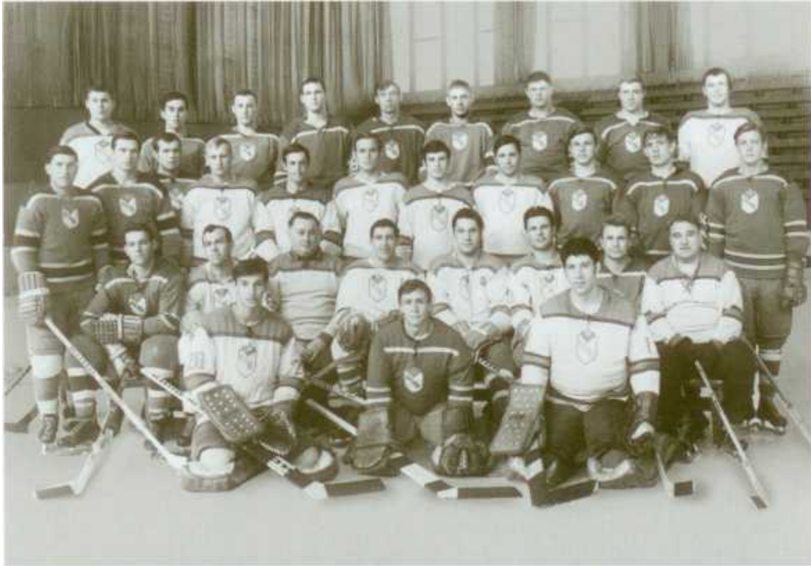
Команда ЦСКА. 1969 год. Харламов — во втором ряду в центре