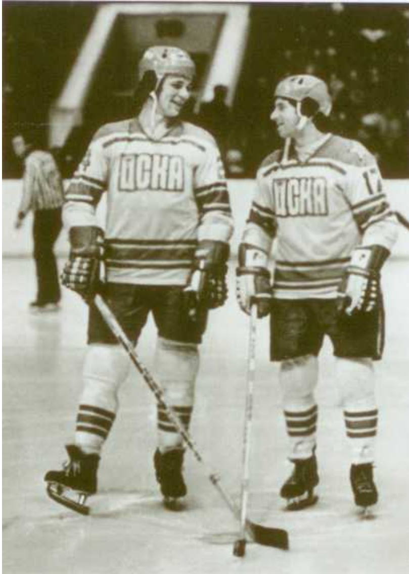
С Вячеславом Фетисовым