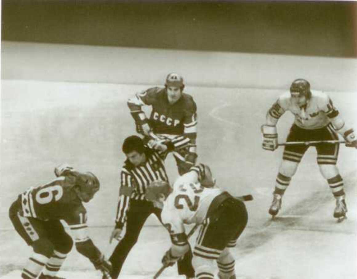
В игре против сборной Швеции