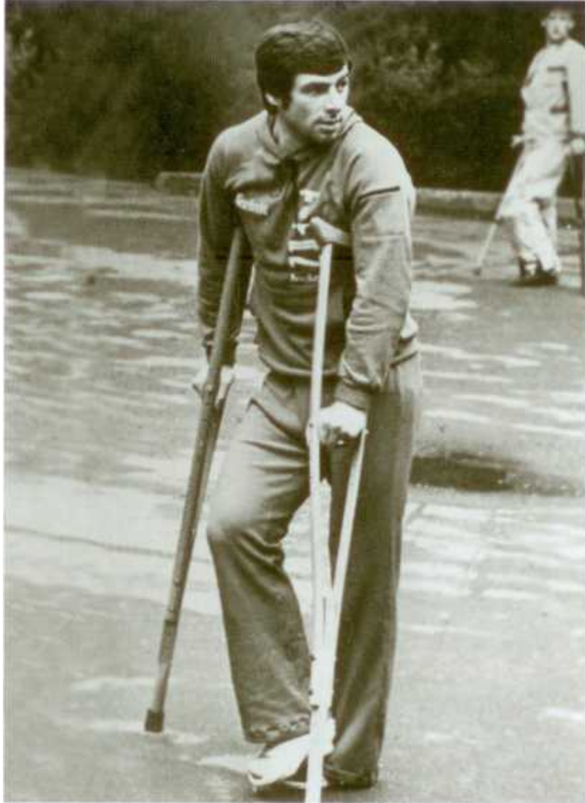
В военном госпитале им. Н. Н. Бурденко после первой аварии