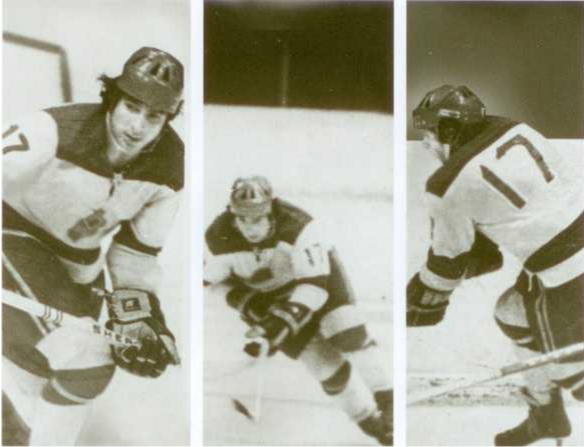
В атаке — Валерий Харламов