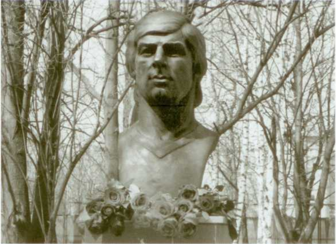
Памятник Валерию Харламову