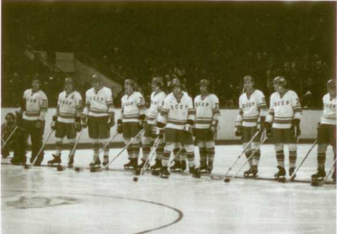
Валерий Харламов на представлении суперсерии-1972