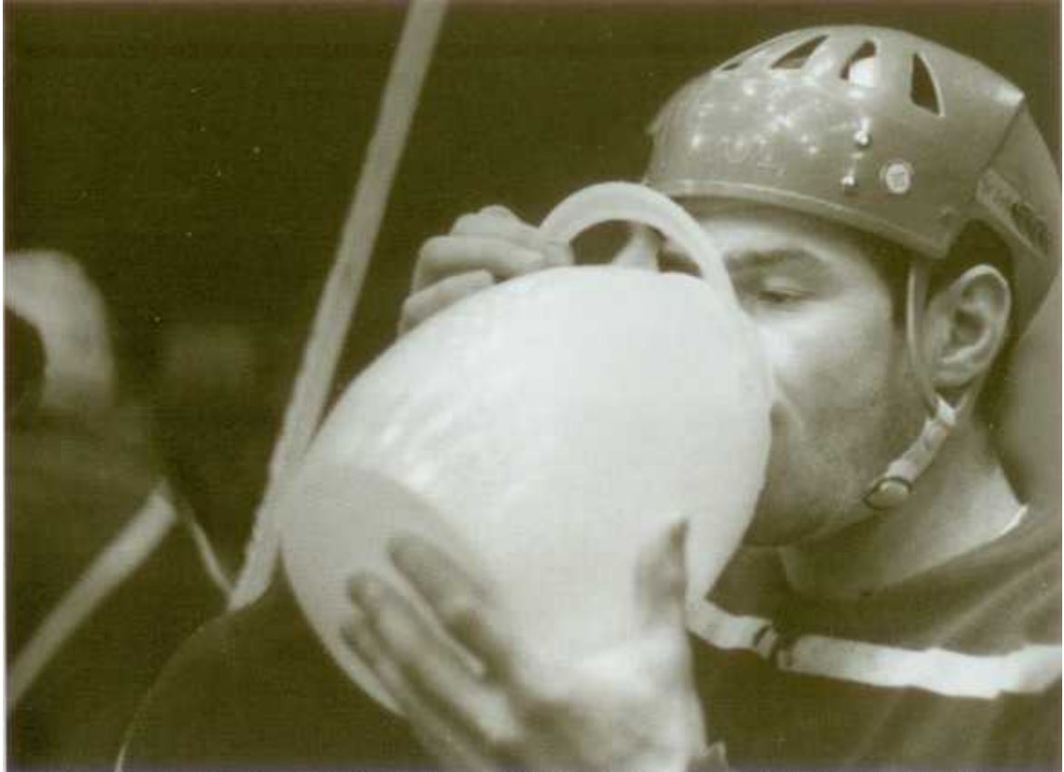
На скамейке запасных