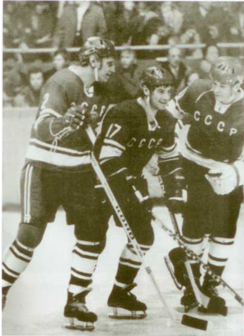
На льду — игроки сборной СССР: Александр Гусев, Валерий Харламов и Александр Мальцев