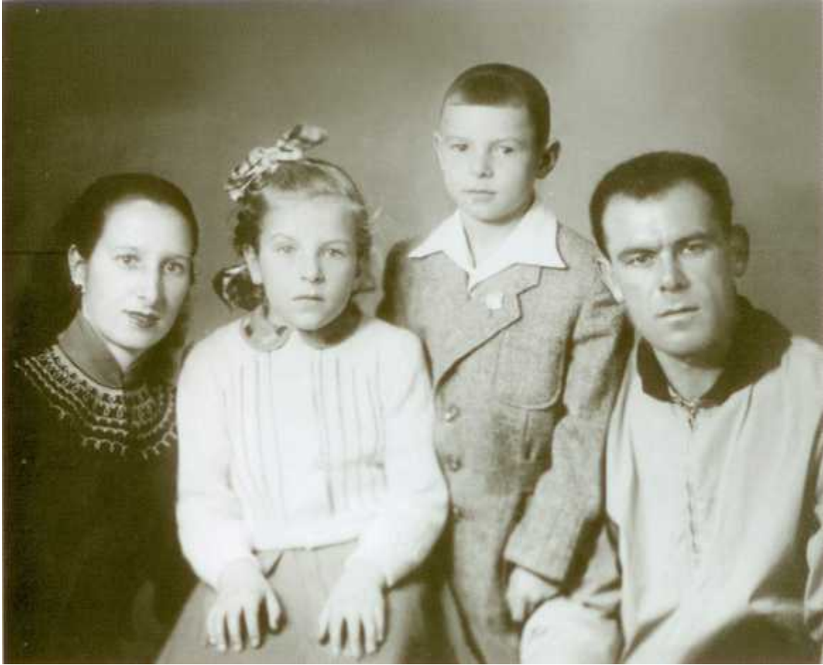
Перед отъездом в Испанию. 1956 г.