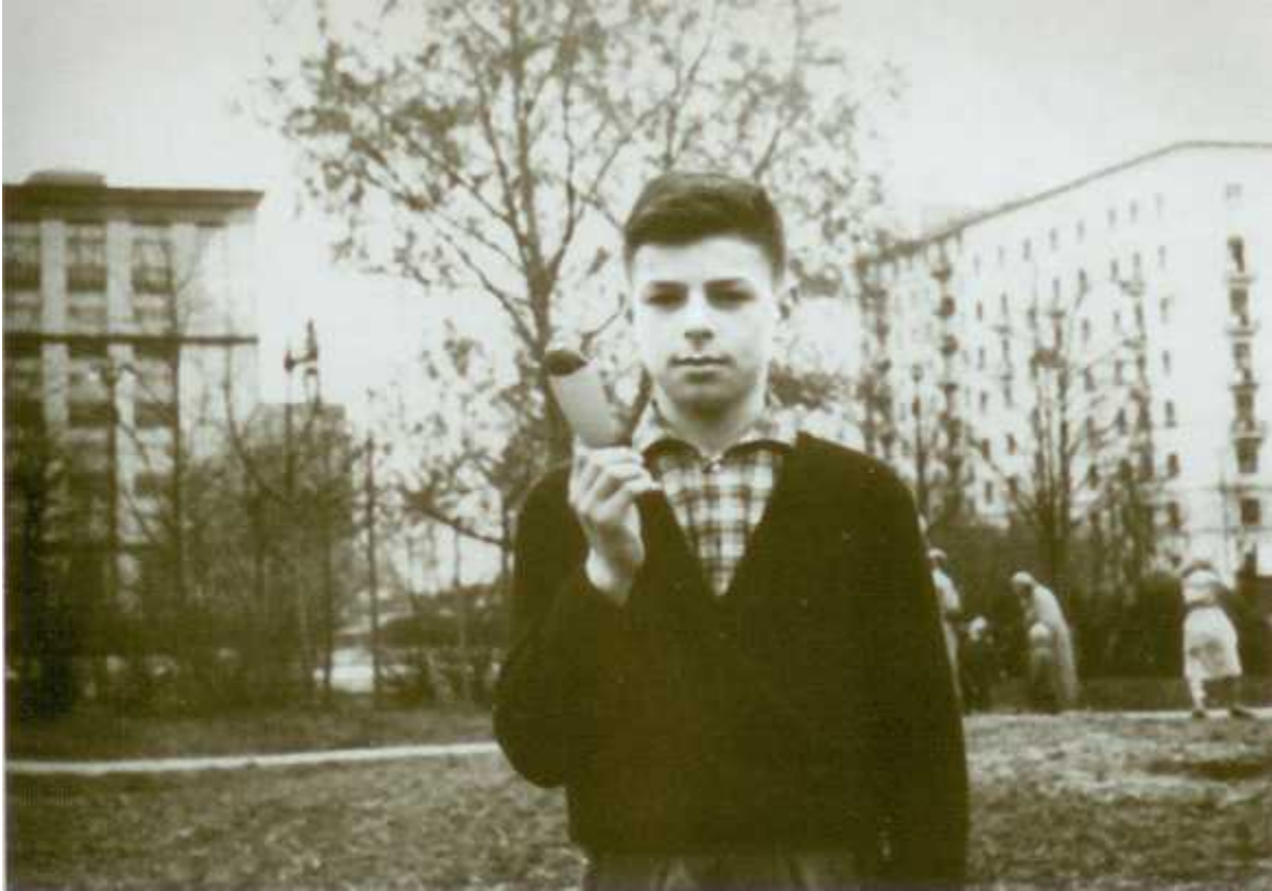
Валере тринадцать лет