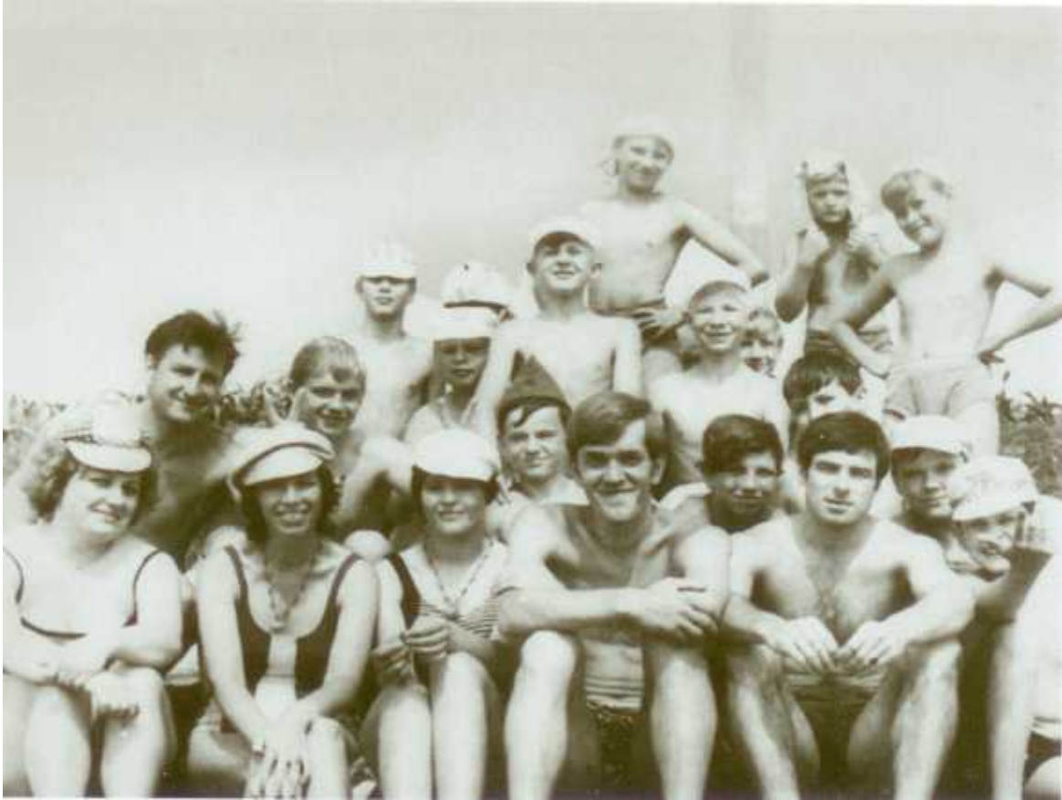
В заводском пионерском лагере с вожатыми