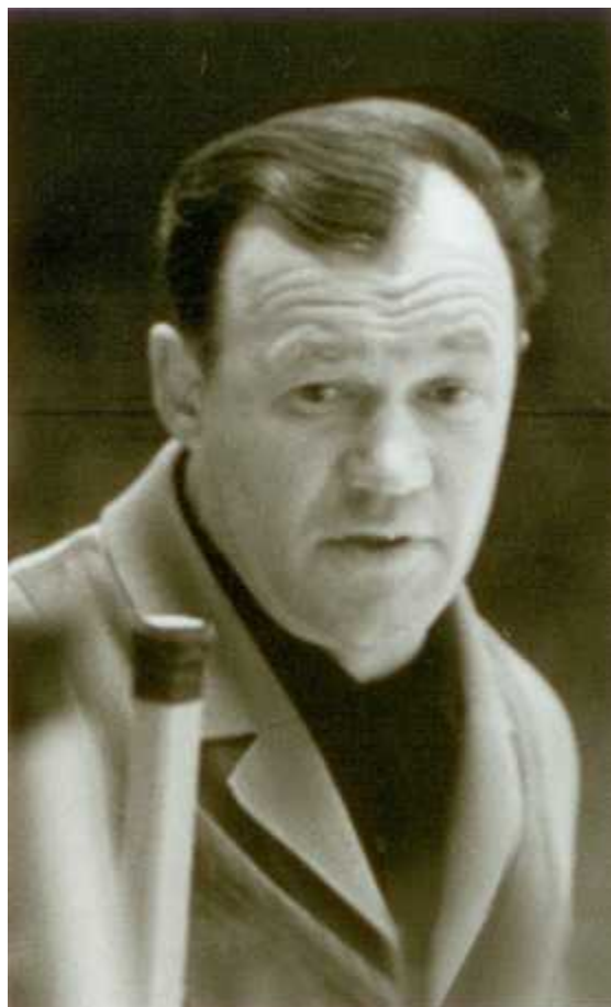
Всеволод Михайлович Бобров