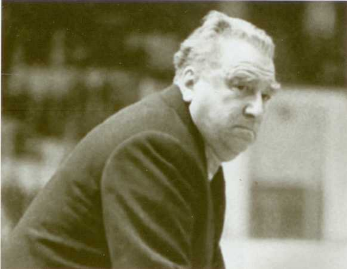
Анатолий Владимирович Тарасов