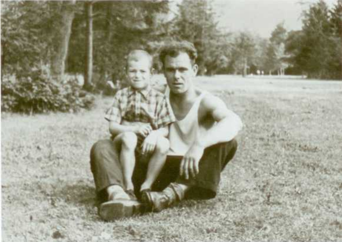
С отцом. Валере три года