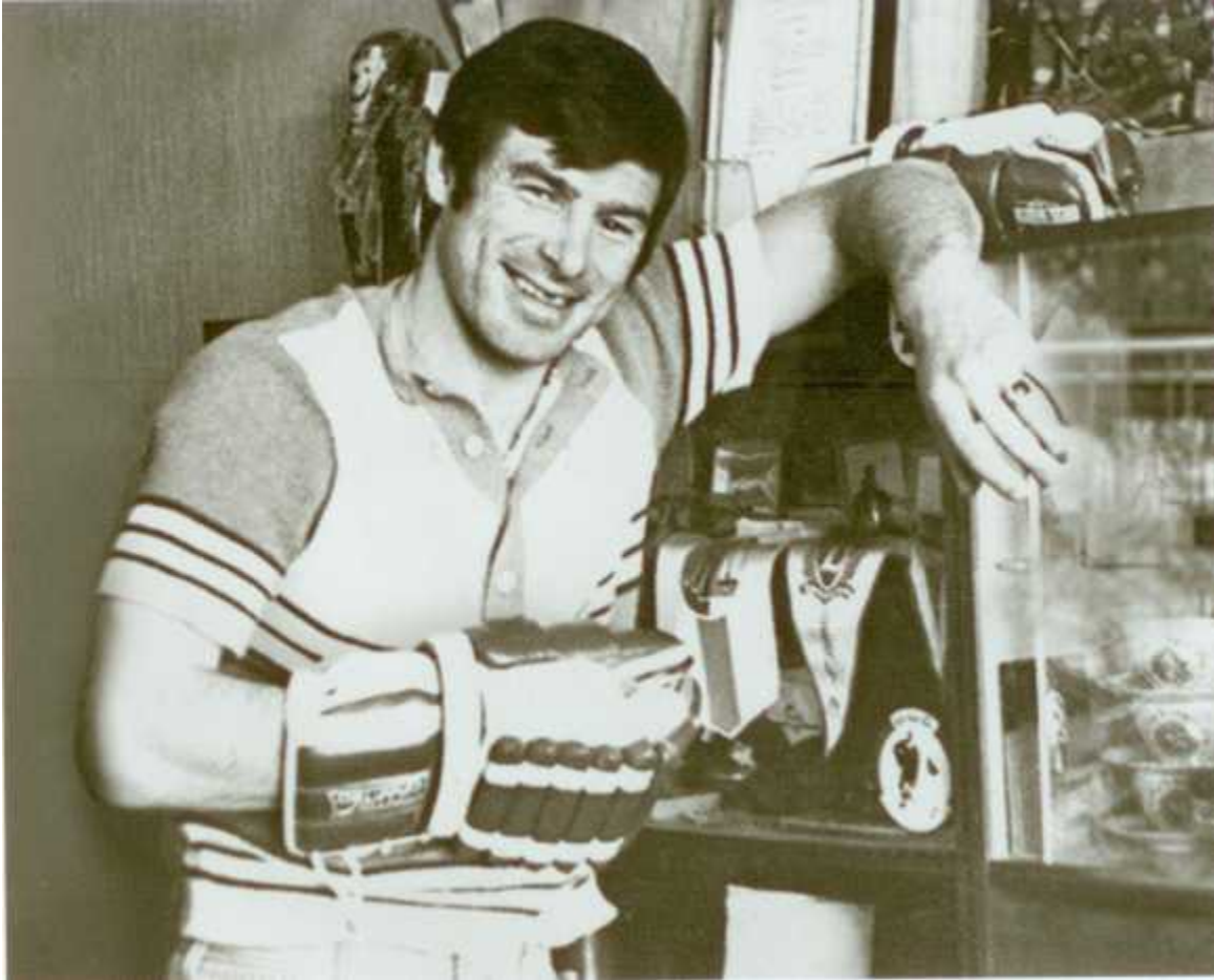
Валерий Харламов с чемпионскими наградами