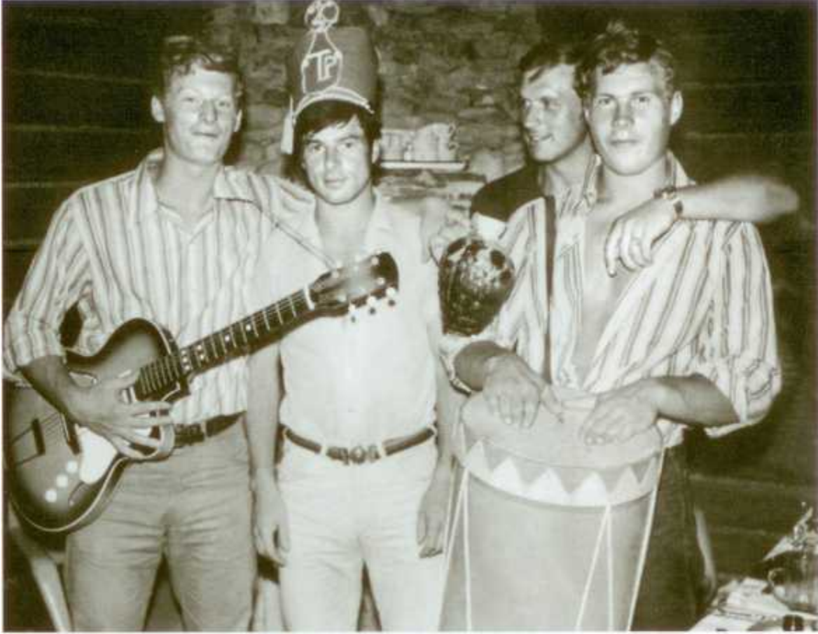
На отдыхе в Алуште. 1972 год. В центре — Валерий Харламов, справа — Владимир Лутченко