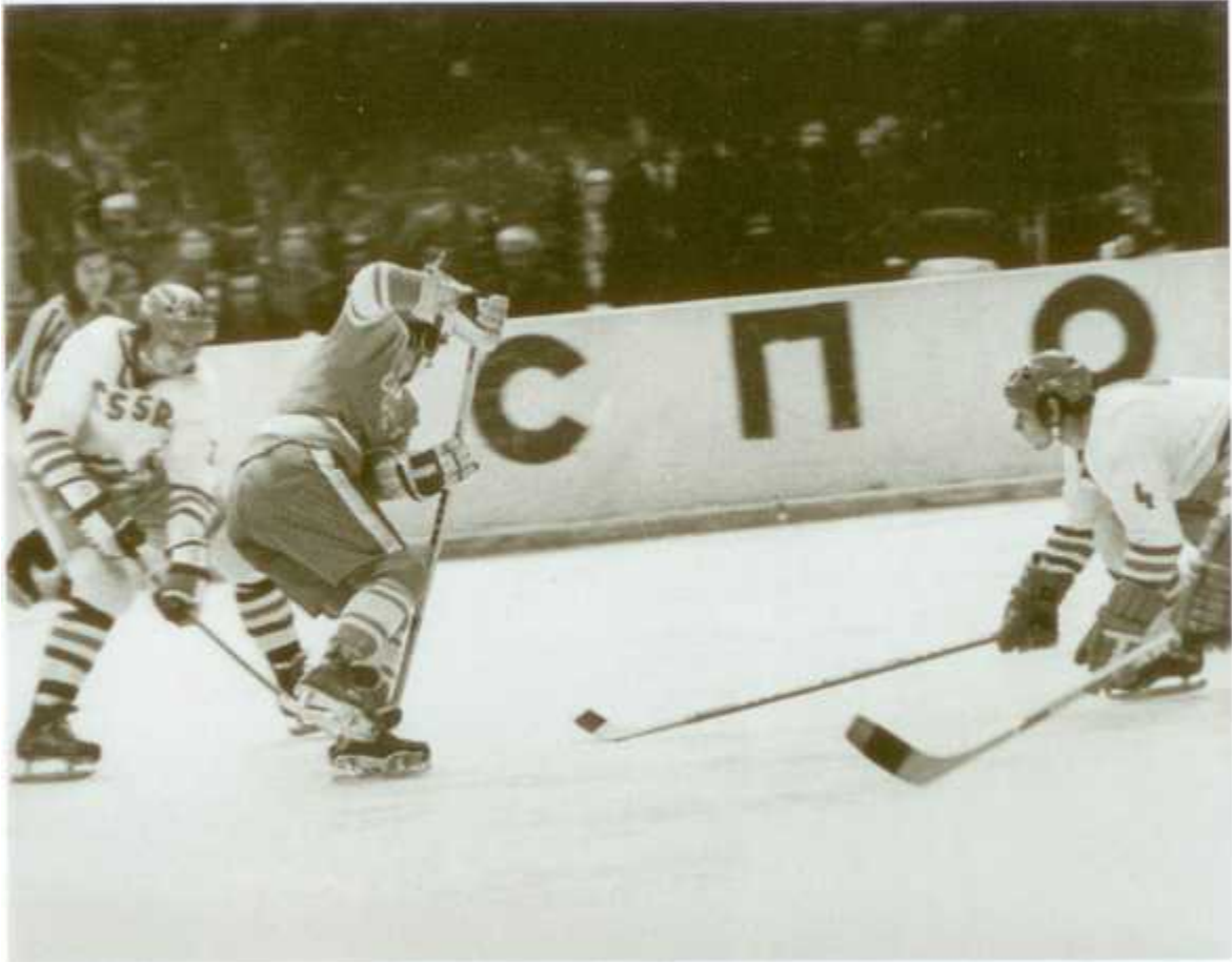
Атака на ворота сборной ЧССР