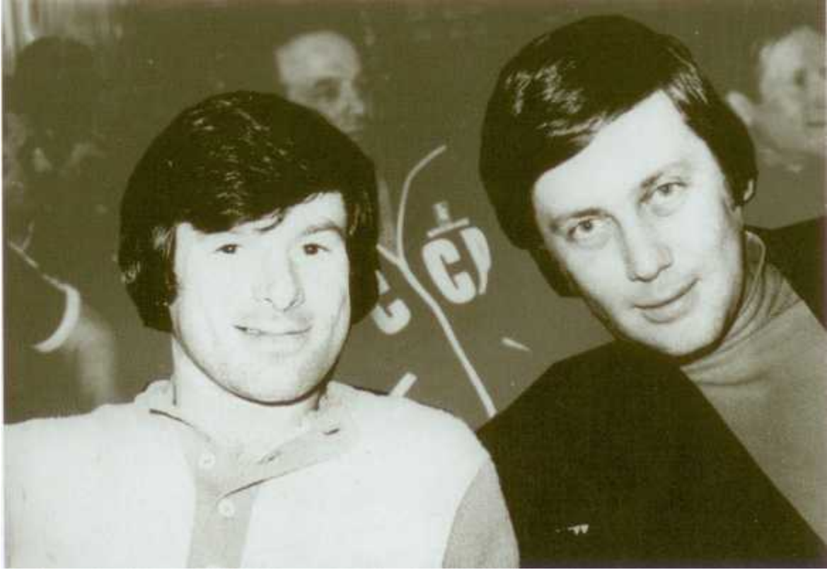
С артистом Владимиром Винокуром