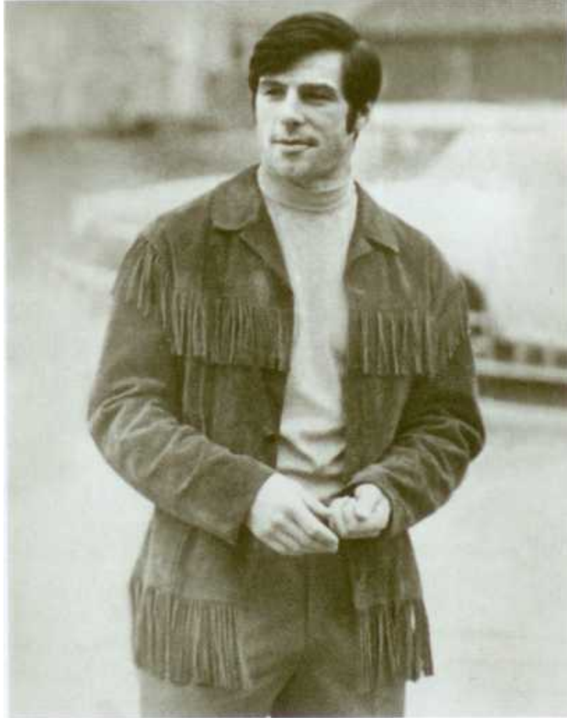
Харламов всегда одевался со вкусом