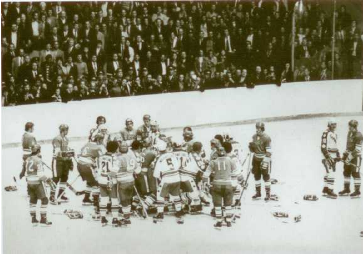
Хоккейное побоище на матче СССР — Канада. 1972 год. Харламов — крайний справа