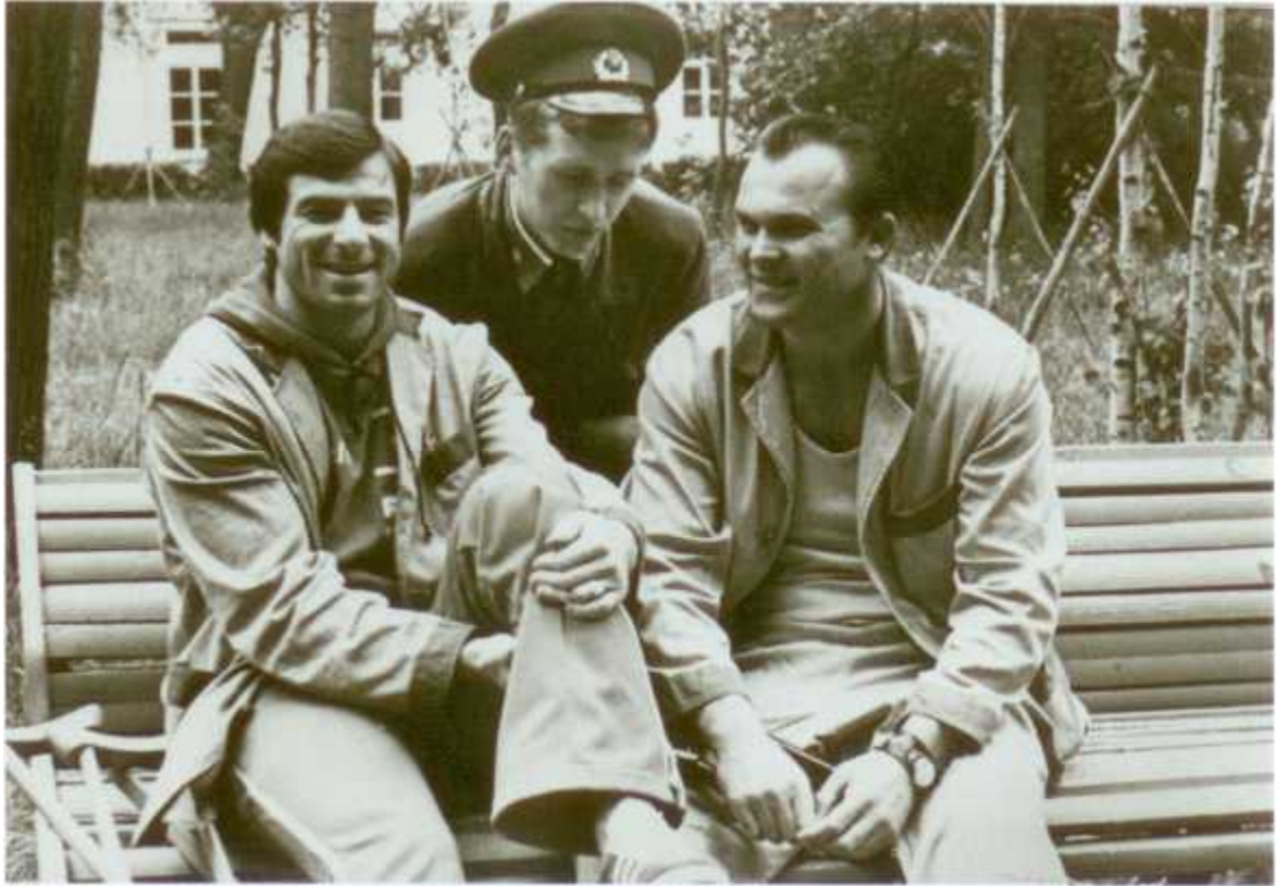
Общение с болельщиками продолжалось и здесь