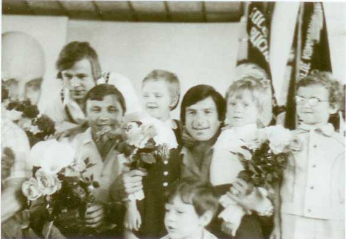
С детьми из своей родной школы