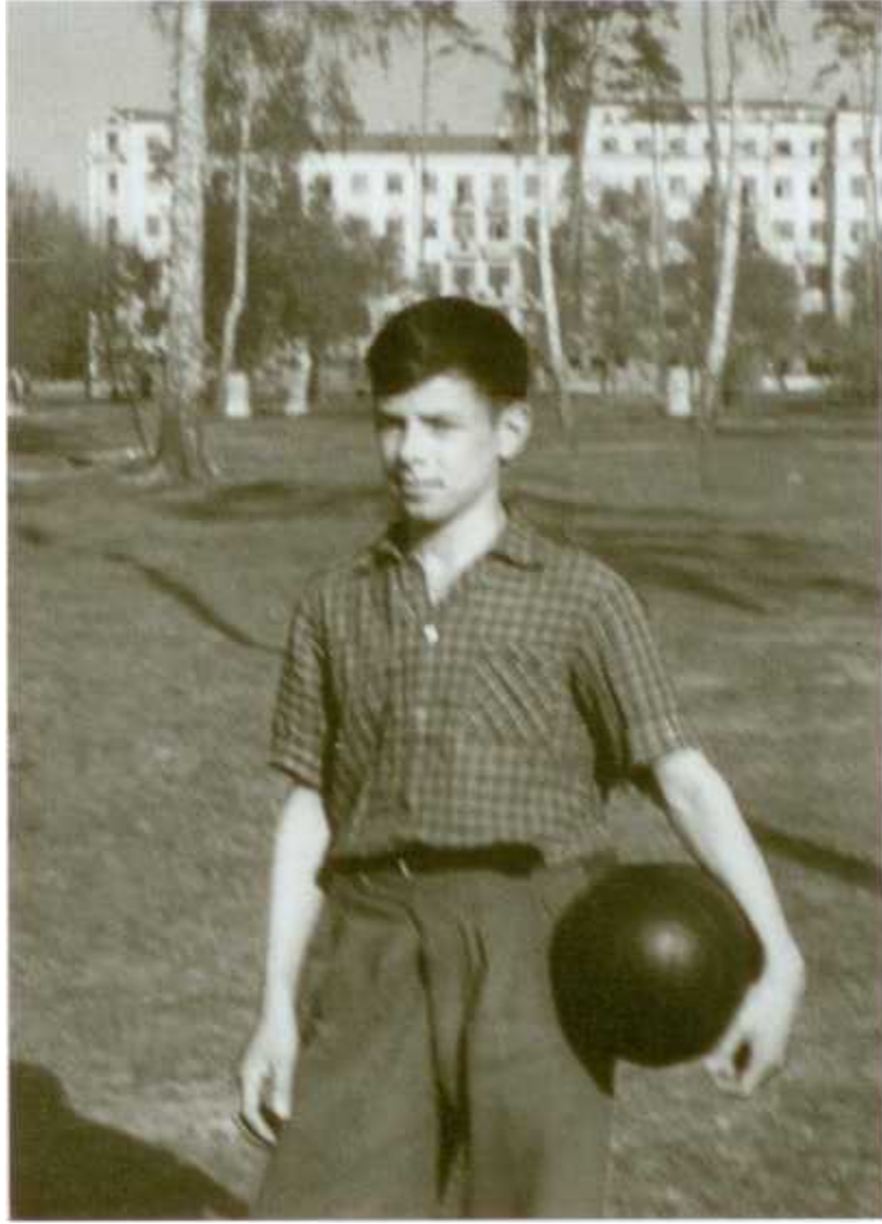
Перед тренировкой. 1962 г.