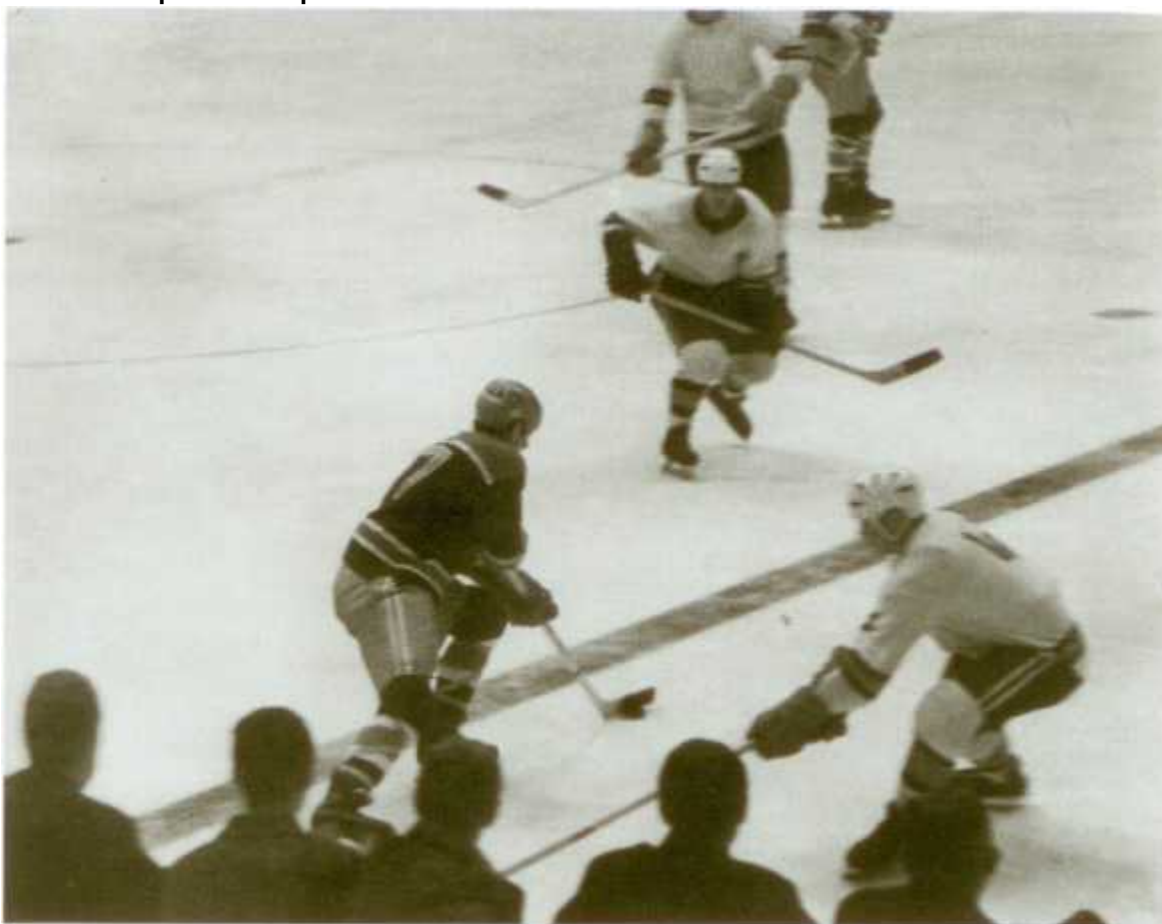
17-й номер набирает ход