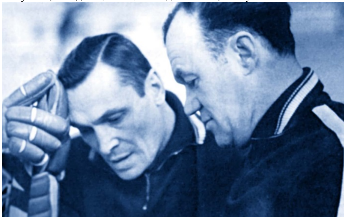
Тренеры сборной СССР Николай Пучков и Всеволод Бобров

На ЧМиЕ наша сборная провела 10 матчей, из которых семь выиграла, одну проиграла и две свела к ничьей. Самыми важными для нас, как всегда, были игры с чехословаками, которых тренировали все те же Ярослав Питнер и Владимир Костка — первый находился на своем посту 6-й год, а второй... 11-й. Как мы помним, Костка не являлся тренером какой-то чехословацкой команды, а вот Питнер с 1959 года стоял у руля одного из сильнейших клубов ЧССР — «Дуклы» из Йиглавы. Эта команда с 1967 по 1972 год была чемпионом Чехословакии, однако это не значило, что в сборной ЧССР игроков этого клуба было большинство. Так, в сборной образца 1972 года игроков «Дуклы» было четверо: защитники Ян Клапач, Ярослав Голик и нападающие Иржи Голик и Богуслав Штясны. Столько же было и игроков из «Слована» (Братислава), который в 1972 году занял 2-е место во внутреннем чемпионате: вратарь Владимир Дзурилла, защитник Милан Кужела, нападающие Вацлав Недоманский, Юлиус Гаас.