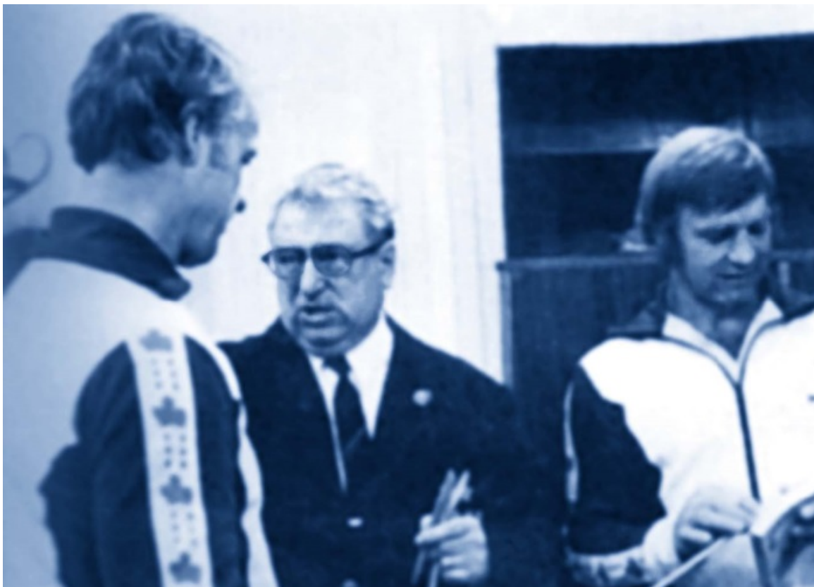
С канадскими игроками Горди Хоу и Бобби Халлом

Между тем самым разгромным для армейцев стал матч 23 февраля 1969 года, где спартаковцы снова обыграли их по всем статьям, причем забили вдвое больше шайб, чем в предыдущем матче. И снова во главе этого разгрома стоял тренер «Спартака» Николай Карпов, который и в этом случае сумел подобрать ключики к грозной команде. Заметим, что у Карпова к Тарасову были старые счеты. А началась история их противостояния еще в самом начале 50-х, когда Карпов попал в ЦДСА (он играл на позиции защитника). Причем он был воспитанником «Спартака», но пришла пора служить в армии, вот его и забрали в ЦДСА. Далее послушаем его собственный рассказ: «1951-й год, в матче с ВВС Бобров один нас раскатал. Тарасов был играющим тренером и запутался совсем. Сологубову кричал: «Да убей ты Севку этого, курносого!» Колька стал за ним гоняться — но Боброва не поймаешь, он видит все! В какой-то момент показал ему, что в одну сторону пойдет, сам скользнул в другую, и Сологубов едва борт плечом не прошиб. А Бобер тихонечко ворота объехал, да и положил нам третью шайбу.