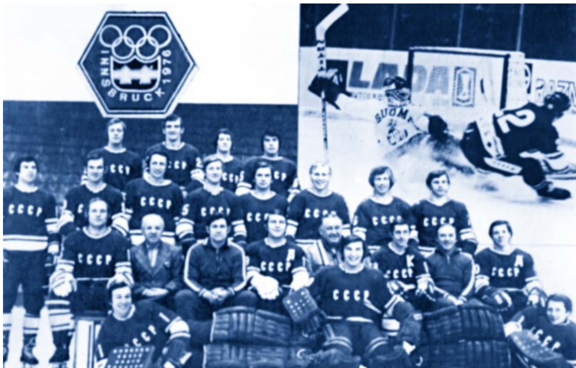
Сборная СССР — победитель Олимпиады в Инсбруке (1976)

Тот чемпионат начался для нашей сборной так, как еще никогда не начинался — с поражения. Причем проиграла наша сборная команде Польши, которую мы всегда легко проходили, забивая ей больше десятка шайб (в 1973 году даже обыграли ее 20:0). Но в этот раз мы проиграли 4:6. Это была сенсация того чемпионата. Это поражение выбило из колеи нашу сборную, которая в психологическом плане выглядела неидеально. Впрочем, и тактически она привезла в Катовице достаточно однообразный хоккей, без каких-либо открытий. А тут еще и травмы ведущих игроков сделали свое дело. Например, отыграв пять матчей (ровно половину), сел на скамейку запасных Александр Мальцев, который, как мы помним, заменил строптивного Владимира Петрова. Вместо него тренеры поставили сначала Владимира Голикова (он сыграл с ними три матча), потом его сменил его брат Александр. Однако большого эффекта эти замены не имели. В итоге в пяти последних турах наша сборная недосчиталась половины возможного «улова» — пяти очков. И сборная СССР чудом зацепилась за 2-е место, уступив чемпионство сборной ЧССР, причем наше отставание составило 6 очков (13 против 19), чего раньше никогда не случалось.