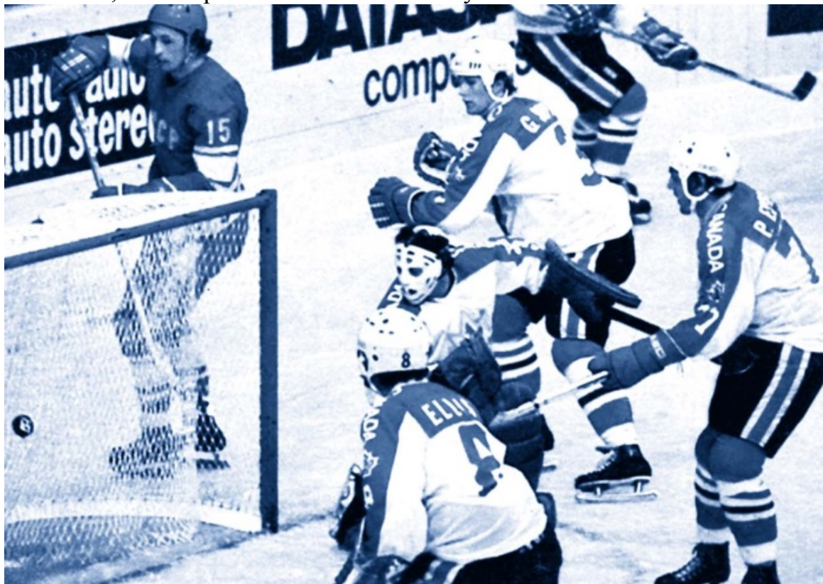
Чемпионат мира 1977 года в Вене

О причинах нашего поражения (кстати, второго подряд после Катовице-76) размышляет В. Тихонов: «Жизнь идет вперед, не стоит, понятно, на месте и хоккей. Но, судя по всему, степень тактической оснащенности игроков сборной не менялась, она явно отставала от требований времени. Именно этим и объясняю я поражение в Вене: в «Штадтхалле» весной 1977 года наша команда, напомним, осталась на третьем месте, от которого советский хоккей уже отвык.