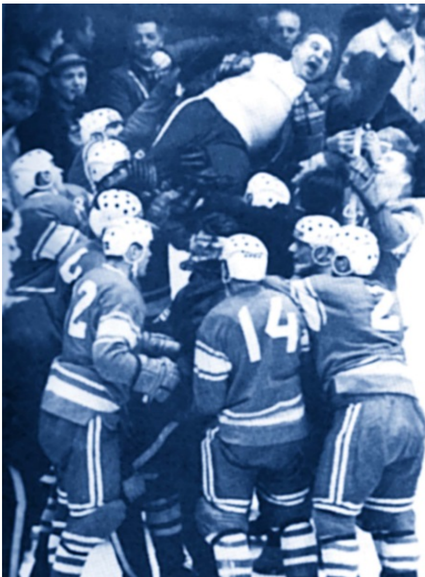
«Качать Тарасова!» После победы на Олимпиаде в Инсбруке (1964)