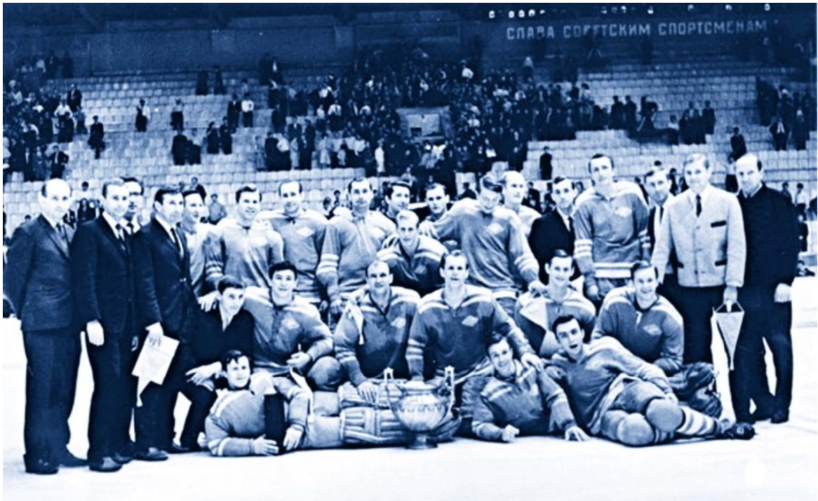
Чемпионы СССР 1969 года — «Спартак» (Москва)