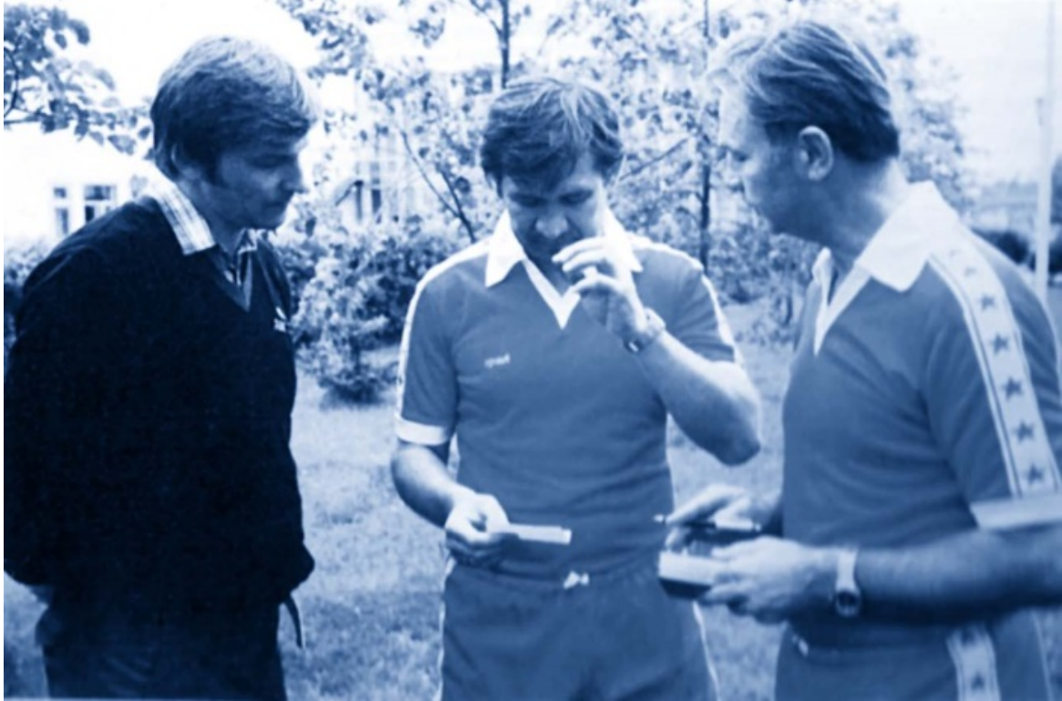
Есть над чем подумать: Третьяк, Юрзинов и Тихонов

Однако на Кубок вызова, который проходил в начале февраля 1979 года в Нью-Йорке, отправилась уже несколько иная сборная — в четырех звеньях. В первом звене играли: защитники — Геннадий Цыганков (Валерий Васильев) — Сергей Стариков, нападающие — Борис Михайлов, Владимир Петров и Валерий Харламов; второе звено: защитники — Сергей Бабинов и Юрий Федоров, нападающие — Хельмут Балдерис, Виктор Жлуктов и Сергей Капустин; третье звено: защитники — Зинэтула Билялетдинов и Василий Первухин, нападающие — Сергей Макаров, Владимир и Александр Голиковы; четвертое звено: защитники — из разных звеньев, нападающие из горьковского «Торпедо» Александр Скворцов, Владимир Ковин и Михаил Варнаков (кстати, горьковчане завоюют в чемпионате СССР 1979 года 5-е место). В запасе были: Ирек Гимаев («Салават Юлаев», Уфа; спустя несколько месяцев он перейдет в ЦСКА), Виктор Тюменев («Крылья Советов»).