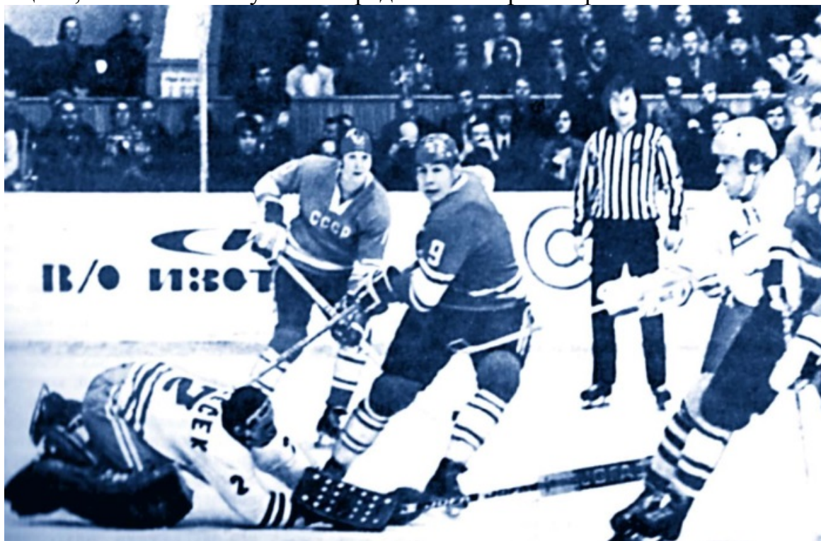
Сборная СССР атакует ворота чехословацкого голкипера Иржи Холечека

Для регистрации происходящего ему не требовались помощники, он все успевал сам. Он был строг, в команде поддерживал беспрекословный порядок, умел добиваться от игроков стопроцентного выполнения своих обязанностей и пользовался уважением. Из-за его манеры поведения у него имелось немало врагов. Но он считал, что человек, неуклонно следующий к своей цели, неизбежно вступит в определенные противоречия».