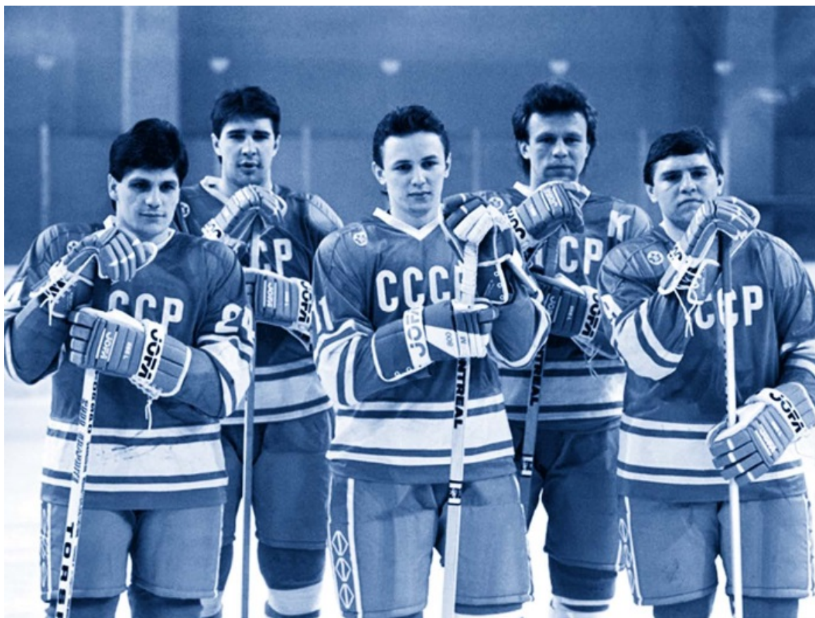
Великолепная пятерка: Сергей Макаров, Алексей Касатонов, Игорь Ларионов, Вячеслав Фетисов, Владимир Крутов

После этой победы до золотых медалей было рукой подать — надо было обыграть в следующем матче сборную Швеции. Что наша команда и сделала с разгромным счетом 7:1. Поэтому на последнюю игру с финнами советские хоккеисты вышли в ранге олимпийских чемпионов (мы опережали соперника на три очка). Как итог — последнюю игру сборная СССР проиграла с минимальным разрывом 1:2, что позволило финнам впервые в истории взять серебряные медали. А вот сборную ЧССР ждал настоящий провал — 6-е место.