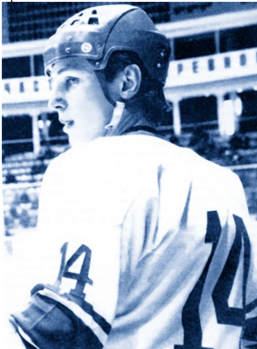
Суперфорвард 80-х Игорь Ларионов. В 1988 году написал скандальное письмо тренеру В. Тихонову