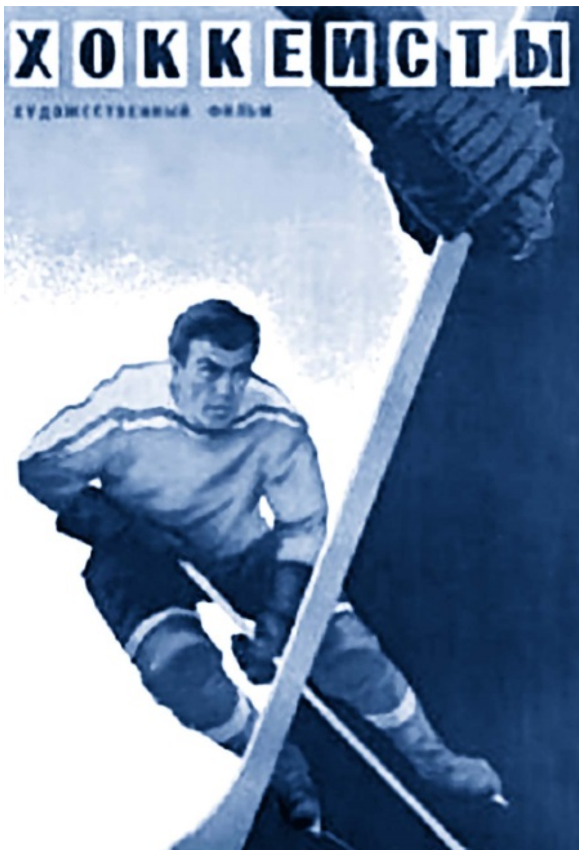
Афиша фильма «Хоккеисты»

Сценаристом фильма выступил писатель Юрий Трифонов, который дружил с «братьями Губовыми» и хорошо знал всю подоплеку происходивших в ЦСКА конфликтов. Тема была очень актуальной по тем временам, когда шла борьба с так называемым «культом личности» во всех сферах общества: с одной стороны, тренер-диктатор, которого люди за глаза называли «Сталиным в хоккее», с другой — игроки с независимыми и свободолюбивыми характерами. Консультантами в картину были приглашены вечные соперники армейцев — динамовцы Аркадий Чернышев и Виктор Тихонов. Так что своим участием в этом фильме Чернышев ясно