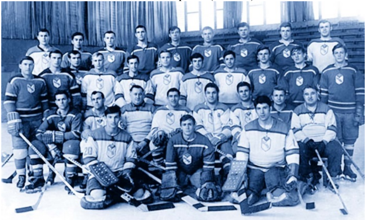
Серебряные призёры и обладатели кубка СССР — ЦСКА (Москва)

Таким образом, его поведение во время воскресного матча — отнюдь не случайность. Только на этот раз оно больно ударило по интересам 14 тысяч зрителей и миллионов телезрителей, смотревших матч. Кстати, 35-минутная