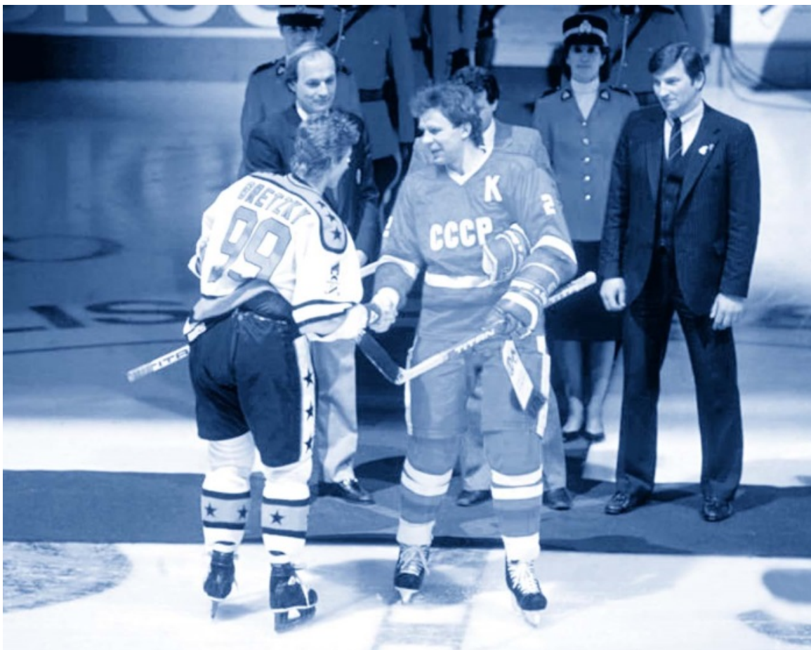
«Рандеву-87». Капитаны команд Уэйн Гретцки и Вячеслав Фетисов

Наша сборная играла в четыре звена, которые выглядели следующим образом: 1) защитники — Алексей Касатонов и Вячеслав Фетисов (оба — ЦСКА), нападающие — Сергей Макаров, Игорь Ларионов, Владимир Крутов (все — ЦСКА); 2) защитники — Михаил Татаринов и Василий Первухин (оба — «Динамо», Москва), нападающие — Сергей Светлов, Анатолий Семенов (оба — «Динамо», Москва) и Михаил Варнаков («Торпедо», Горький); 3) защитники — Сергей Стариков и Игорь Стельнов (оба — ЦСКА), нападающие — Андрей Хомутов, Вячеслав Быков и Валерий Каменский (все — ЦСКА); 4) — защитники — Зинэтула Билялетдинов («Динамо», Москва) и Алексей Гусаров (ЦСКА), нападающие — Сергей Пряхин («Крылья Советов»), Анатолий Семенов («Динамо», Москва), Юрий Хмылев («Крылья Советов»).