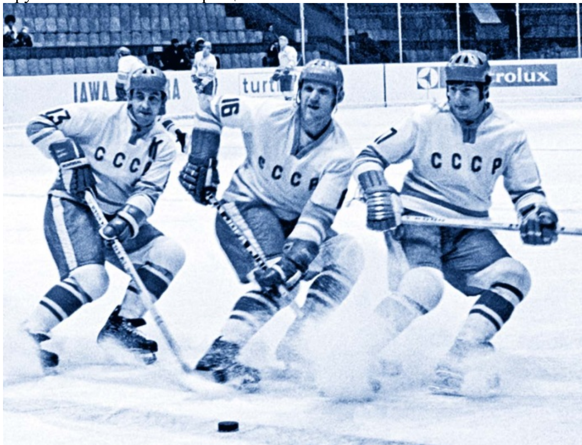
Великолепная тройка Михайлов — Петров — Харламов

Согласитесь, это не могло не вносить в работу тренеров определенные трудности. Легко ли управлять коллективом, в котором кто-то желает со стороны наблюдать за подготовкой, за учебной деятельностью товарищей? Нагрузки солидны, и еще у кого-то может появиться искушение последовать примеру более опытного товарища.