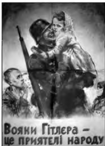
Рис. 13. «Солдаты Гитлера – друзья народа»