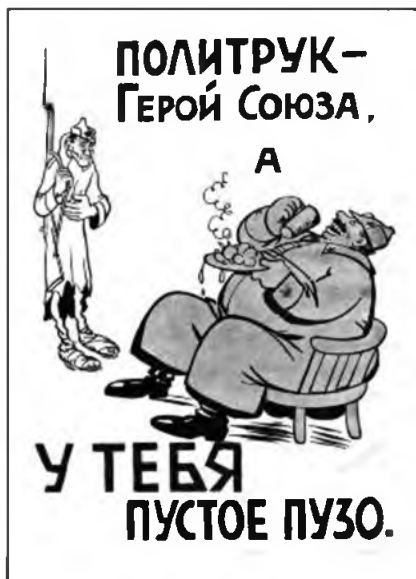
Рис. 17. Финская

В целом, советскую пропагандистскую кампанию осени 1939 г. можно признать успешной. Ее положительно восприняла армия, гражданское население СССР и население Западной Украины и Западной Белоруссии.