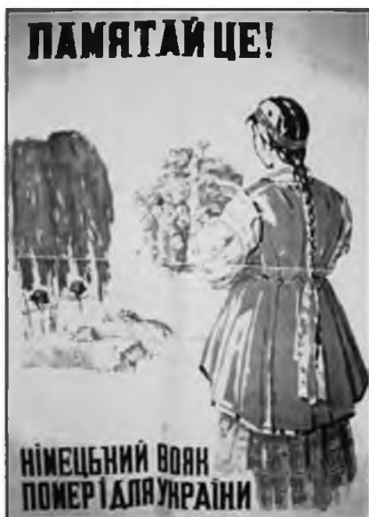
Рис. 14. Помните! Немецкий солдат погиб за Украину»

«великой Германии». В национал-социалистских плакатах и листовках отчетливо звучал мотив долга перед «избавителями»: «Работая в Германии, ты защищаешь свое отечество! Иди в Германию!», «Украинцы! Включайтесь в европейский фронт обороны против большевизма!» и т.д.