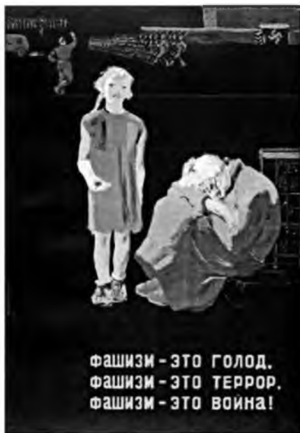
Рис. 8. П. Я. Караченцев «Фашизм — это голод. Фашизм — это террор. Фашизм — это война!»

Характерно, что в советском плакате осени 1939 г. практически не отражена тема германской агрессии против Польши 1 , которая, согласно «Краткому курсу истории ВКП(б)», должна была бы квалифицироваться как война несправедливая, захватническая, имеющая целью захват и порабощение чужих стран, чужих народов. Антифашистские мотивы появляются в советской внешнеполитической пропаганде с середины 1930-х годов,