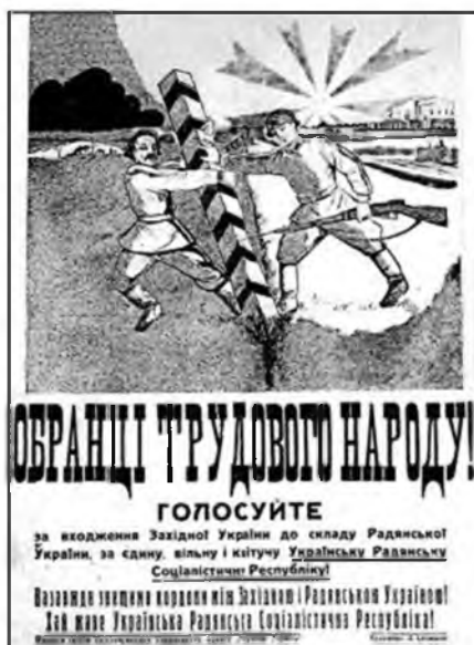
Рис. 5. Л. Сечишин. Предвыборный плакат

— Мы знали, — говорит он, — как радостно живет крестьянство по ту сторону границы, в советской стране.