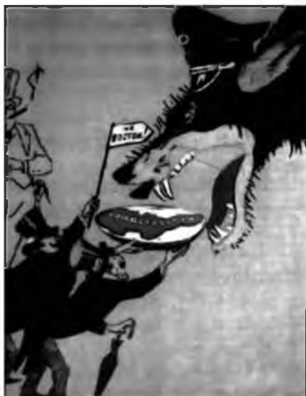
Рис. 9. Плакат, осуждающий «Мюнхенский сговор»