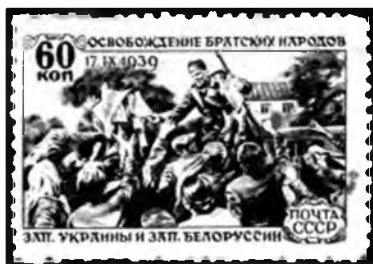
Рис. 7. «Освобождение братских народов Западной Украины и Западной Белоруссии 17 сентября 1939 г.»

Когда на рассвете мы шли работать к помещику, мы смотрели на восток, откуда всходило яркое солнце, которое восходит с той стороны, где жить хорошо. Мы слышали гул тракторов на необозримых колхозных полях, мы видели зарево от множества электрических ламп, освещающих советские села. Настали, наконец, радостные дни и в нашей жизни, сбылись наши мечты» 1 .