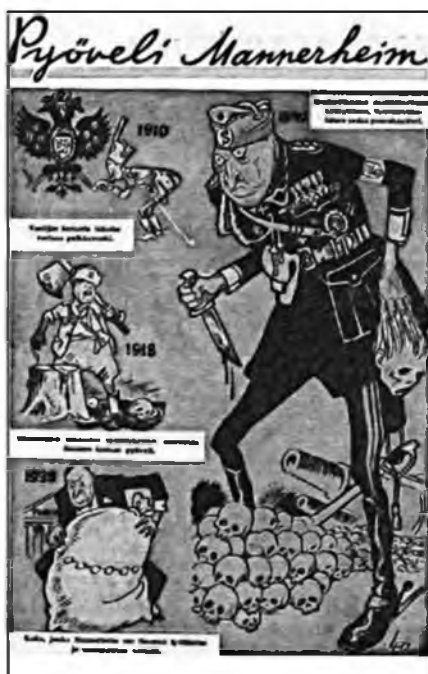
Рис. 16. Мясник Маннергейм»

В условиях тяжелой ситуации, сложившейся на финском фронте в начале 1940 г., пришлось перестраивать пропагандистскую работу в самой РККА, об «освободительной миссии» которой говорить уже не приходилось. Высокий боевой дух финской армии не шел ни в какое сравнение с боевым духом отступающего почти без сопротивления в сентябре 1939 г. Войска Польского. Руководство Политического управления Красной армии было вынуждено перестраиваться «на ходу». 4 февраля 1940 г. в действующую армию была направлена директива ПУРККА за № 29 «О задачах агитационно-пропагандистской работы в связи с финляндской войной». В директиве утверждалось следующее: вместо повседневного разъяснения личному составу, что основной задачей в этой