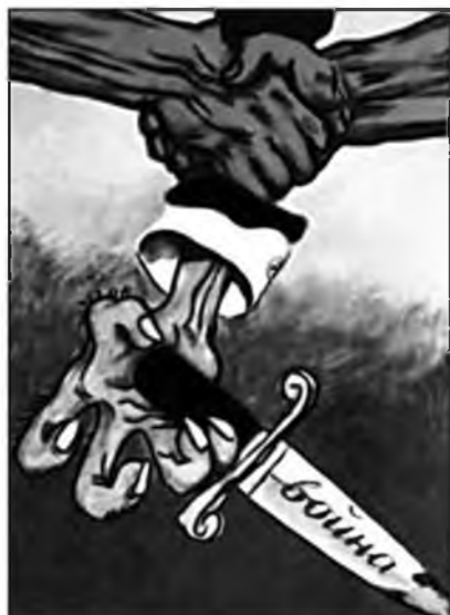
Рис. 10. Советский антивоенный плакат

«собираания немецких земель» Германия осуществляла под лаконичным и емким лозунгом «Один народ, один рейх, один вождь». Советская пропаганда не породила подобного лозунга, однако в ее идеологических клише — «единокровные братья», «советская страна», «великий вождь» и т.п. — можно найти аналог практически всем его составляющим.