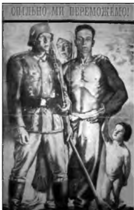
Рис. 12. «Вместе мы победим!»

за мировую революцию ставит целью сделать все народы рабами так, как это уже сделали с Вами.