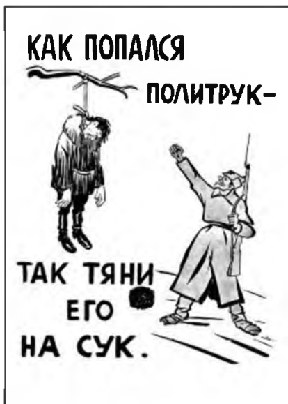
Рис. 18. Финская