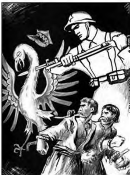
Рис. 2. «Польский орел и советский солдат»