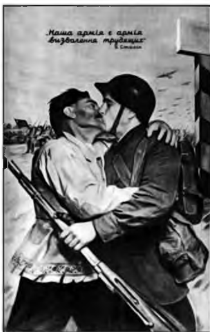
Рис. 1. В. Б. Корецкий «Наша армия есть армия освобождения трудящихся»

С точки зрения такого открытого выражения эмоций примечателен плакат известного советского художника-плакатиста В. Б. Корецкого «Наша армия есть армия освобождения трудящихся» (рис. 1), (в книге В. Корецкого «Товарищ плакат», изданной в 1978 г., использовано другое название – «Боец, Белоруссия ждет этого дня!» 2 ). Именно эта работа принесла первую широкую известность своему автору. 22 сентября 1939 г. плакат был помещен на 1-й странице «Правды» 3 . Затем «он воспроизводился в журналах и газетах, в школьном учебнике истории СССР, печатался в календарях и т.д.» 4 . Сопроводительный текст – «Наша армия есть армия освобождения трудящихся». И. Сталин» – приводился на русском, белорусском или украинском языках.