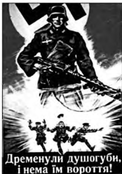
Рис. 11. «Драпанули душегубы и нет им возврата»