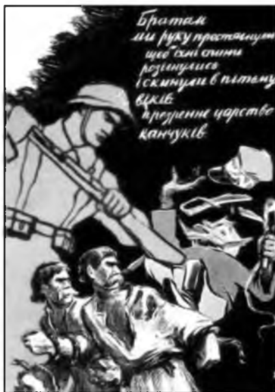
Рис. 3. «Царство канчуков»

из рук. Тем не менее, никакого сочувствия к поверженной армии, защищавшей, кстати, свое государство, у зрителя не может и не должно быть, ведь с выбитой из рук сабли капает свежая кровь, а в рукоять плети (канчука) пальцы офицера вцепились намертво.