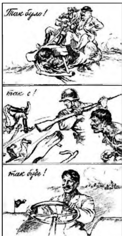
Рис. 6. «Так было! Так е! Так буде!»