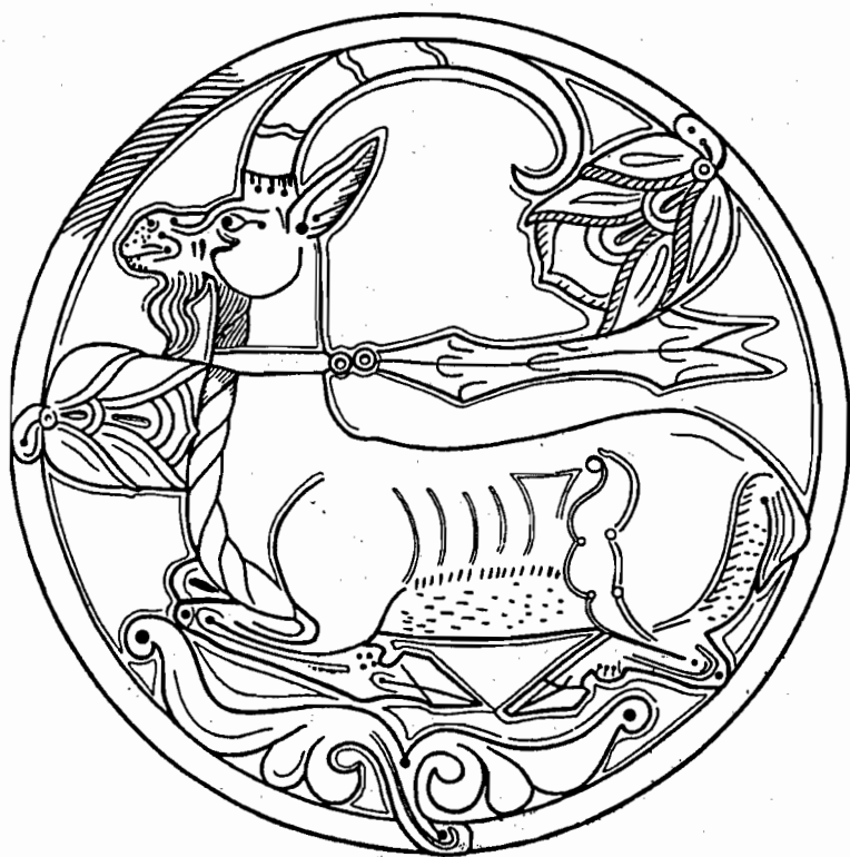
Рис. 5. Блюдо с изображением козерога с ленточкой фарна, VIII в., прорись, деталь