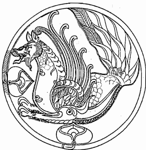
Рис. 3. Блюдо с изображением Сэнмурва, VIII в., прорись, деталь