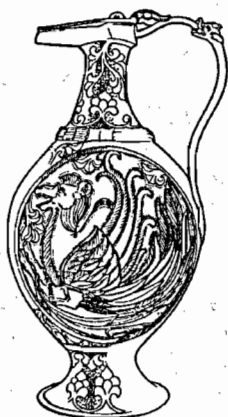
Рис. 4. Кувшин с изображением крылатого верблюда, VII–VIII вв., прорись

Между тем хвост Сэнмурва на серебряном блюде VIII в. очень близок по трактовке к явно состоящему из перьев хвосту крылатого верблюда 240 , изображенного на серебряном кувшине VII–VIII вв. 241 (рис. 4) (оба эти произведения стилистически близки и часто сопоставляются в литературе 242 ). И у Сэнмурва, и у крылатого верблюда мастера точно воспроизвели характерные для хвостового оперения птиц рулевые контурные перья: стержень, расположенные в одной плоскости два опахала, состоящие из бородок. Что же касается «чешуек», то это, конечно, не рыба чешуя, а попытка передать изобразительными средствами покрывающие тело Сэнмурва перья — с помощью того же приема (налегающие друг на друга под углом в 45 градусов полукружия) на «сасанидском металле» передавались перья птиц, перья на теле фантастических крылатых существ типа грифонов, на крыльях крылатых лошадей 243 ; сам этот прием использовался в искусстве Ирана еще при Ахеменидах 244 .