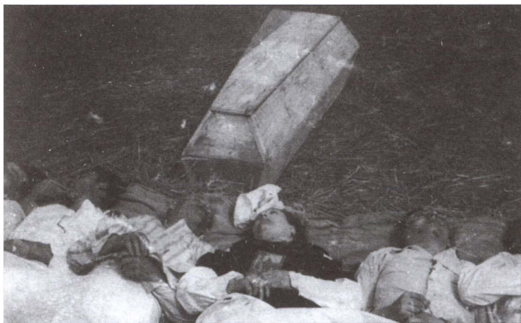
Жертвы «Волынской резни»