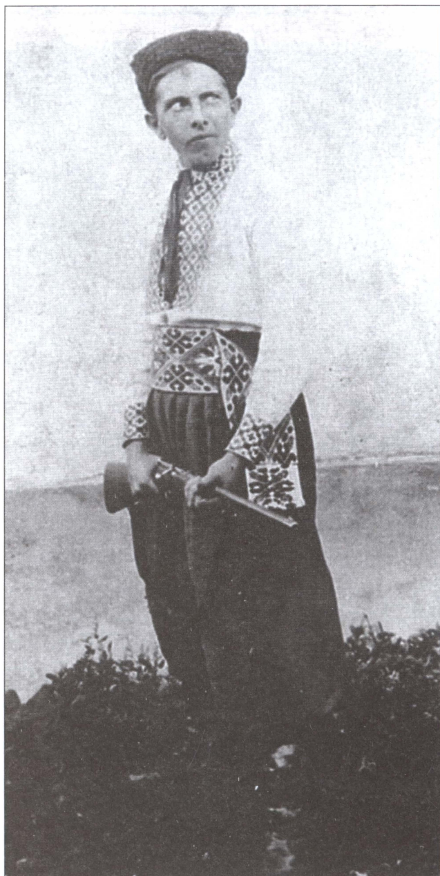
С. Бандера в национальном костюме