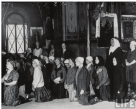
В православном храме. Москва август 1941 г.