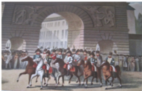
Въезд Императора Александра I в Париж