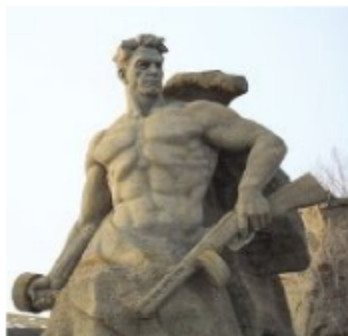
Стоять насмерть. Монумент на Маммаевом кургане