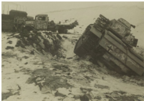
Разбитая немецкая техника