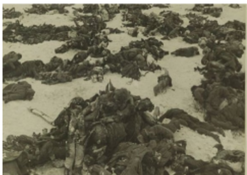
Немцы, убитые под Сталинградом