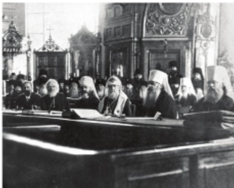
Поместный собор. 1917 г.