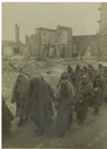
«Непобедимые» в Сталинграде