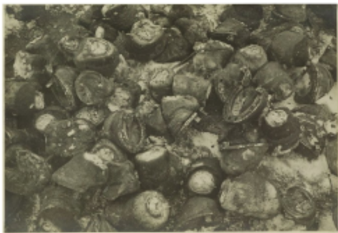
Остатки съеденных немцами лошадей