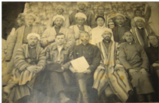
Таджикистан, 1920-е годы