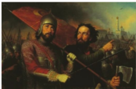
Минин и Пожарский возглавили народное ополчение