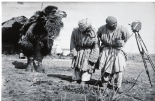
Каракумская степь, Узбекистан 1926 г.