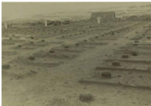
Немецкое кладбище в селе Городище