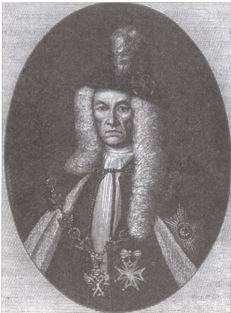
Я.В. Брюс. Портрет из «Брюсова календаря»