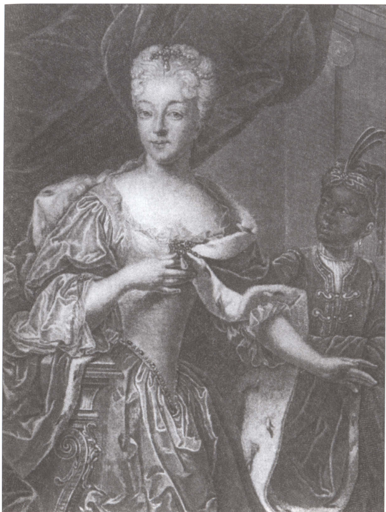
Шарлотта-Христина-София, супруга царевича Алексея Петровича, мать императора Петра II. Гравюра XVIII в.