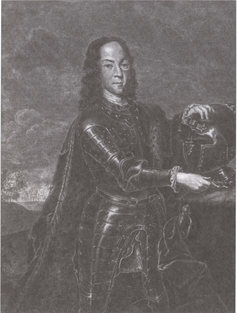
Царевич Алексей Петрович. Гравюра XVIII в.