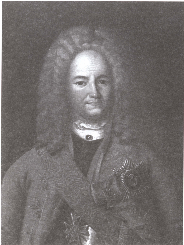
А.Д. Меншиков. Неизвестный художник