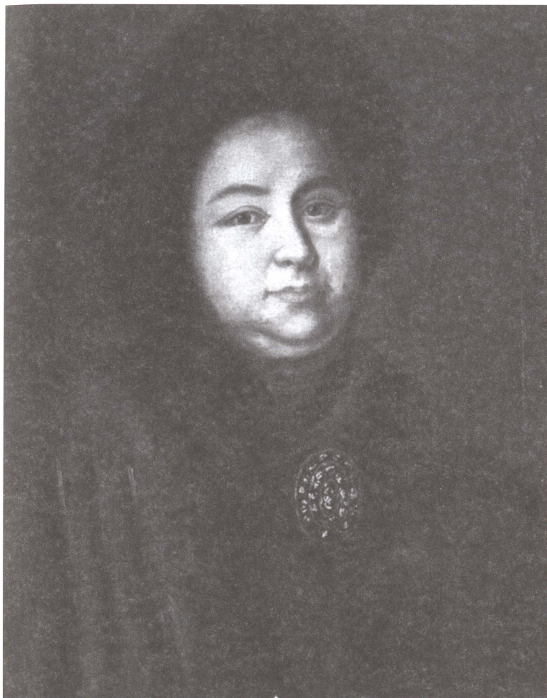
Евдокия Лопухина, первая супруга Петра I, бабушка Петра II. Неизвестный художник