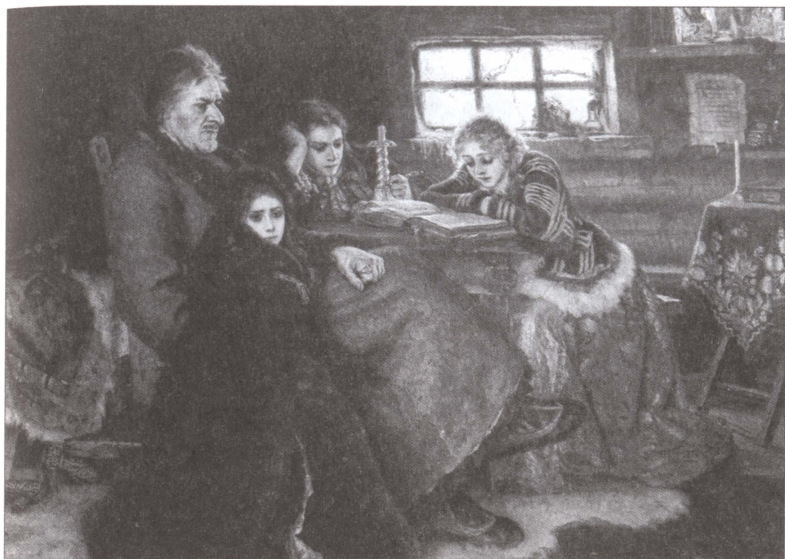
Меншиков в Березове. Художник В.И. Суриков