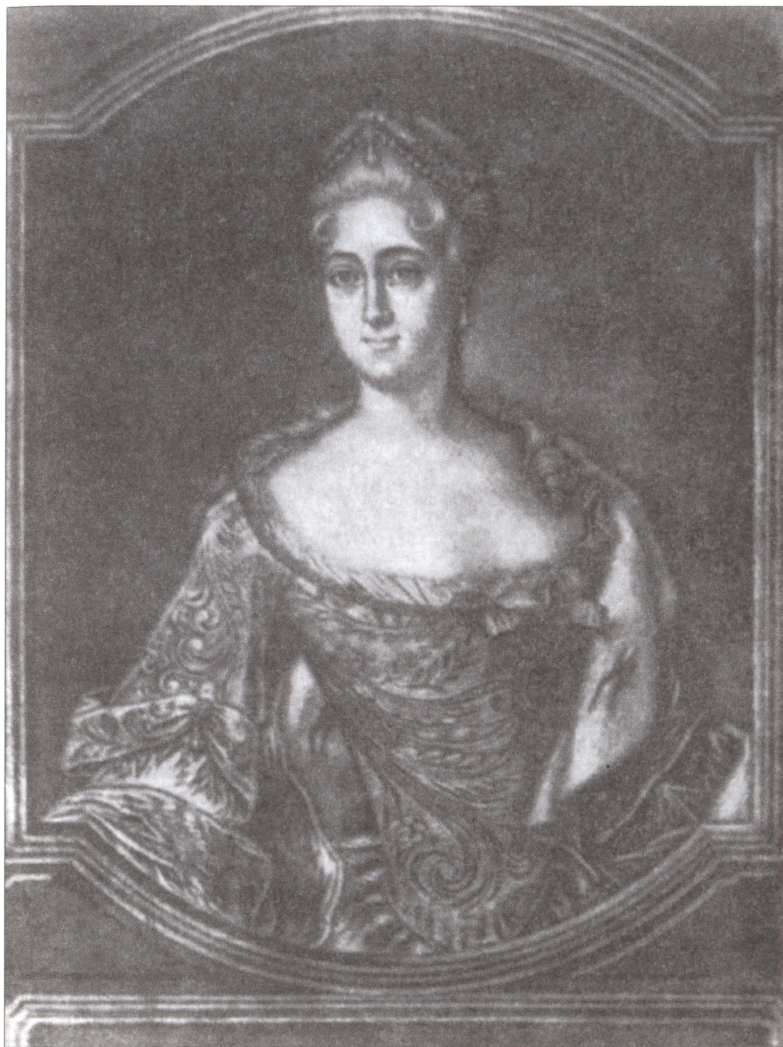
М.А. Меншикова. Гравюра XVIII в.