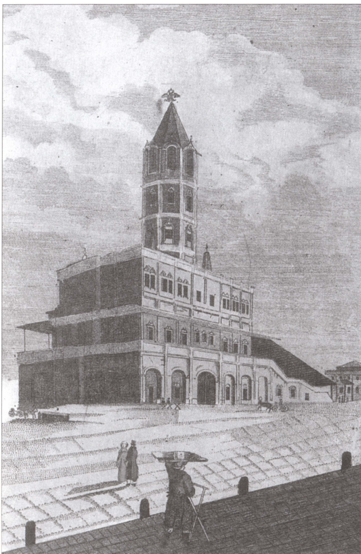
Вид Сухаревой башни. Москва. Гравюра XIX в.