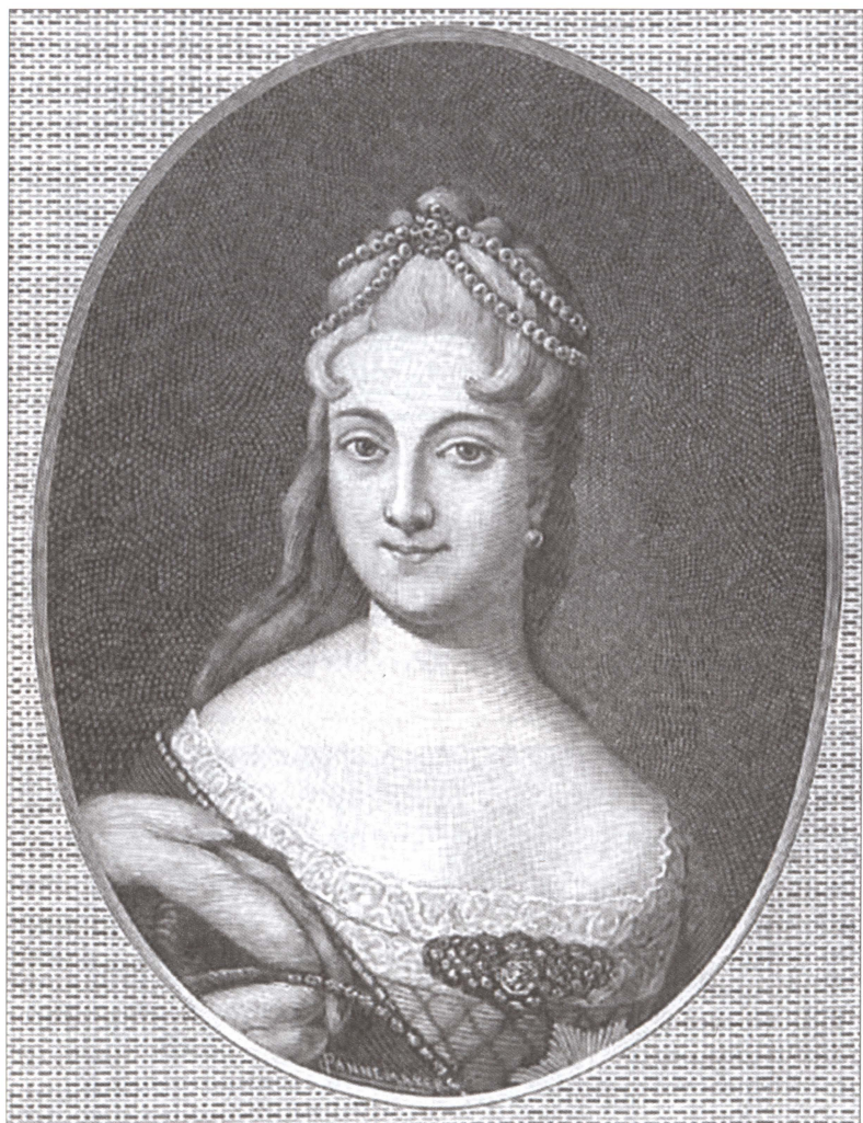
Е.А. Долгорукая. Гравюра XVIII в.