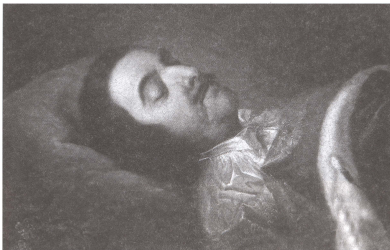
Петр I на смертном одре. Художник И.-Г. Таннауер