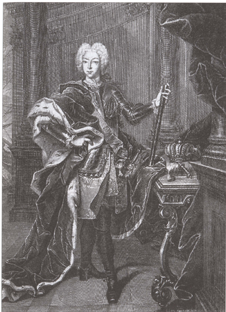
Император Петр II. Неизвестный художник