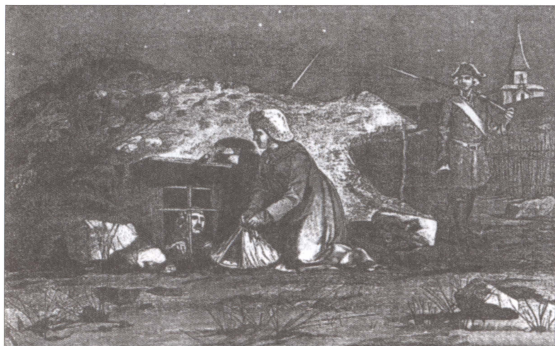
Супруги Долгорукие в остроге. Художник А.П. Рябушкин