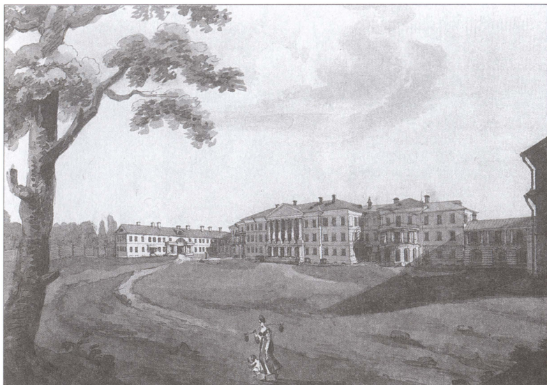
Усадьба Горенки. Вид со двора. Неизвестный художник