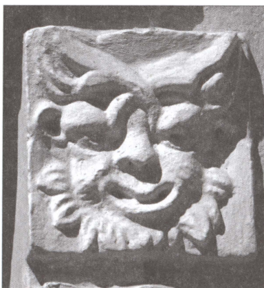
Барельефы над окнами дома Брюса в Глинках