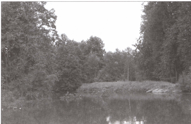
Остров Уединения. Усадьба Горенки. Современный вид