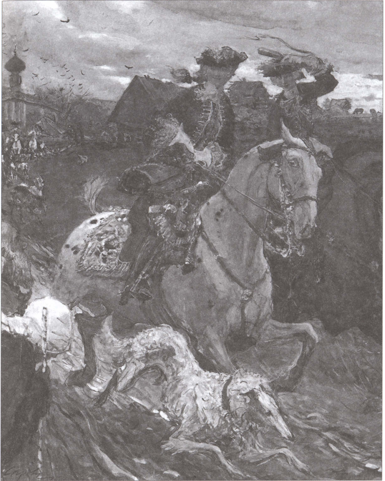
Выезд императора Петра II и царевны Елизаветы Петровны на охоту. Художник В.А. Серов