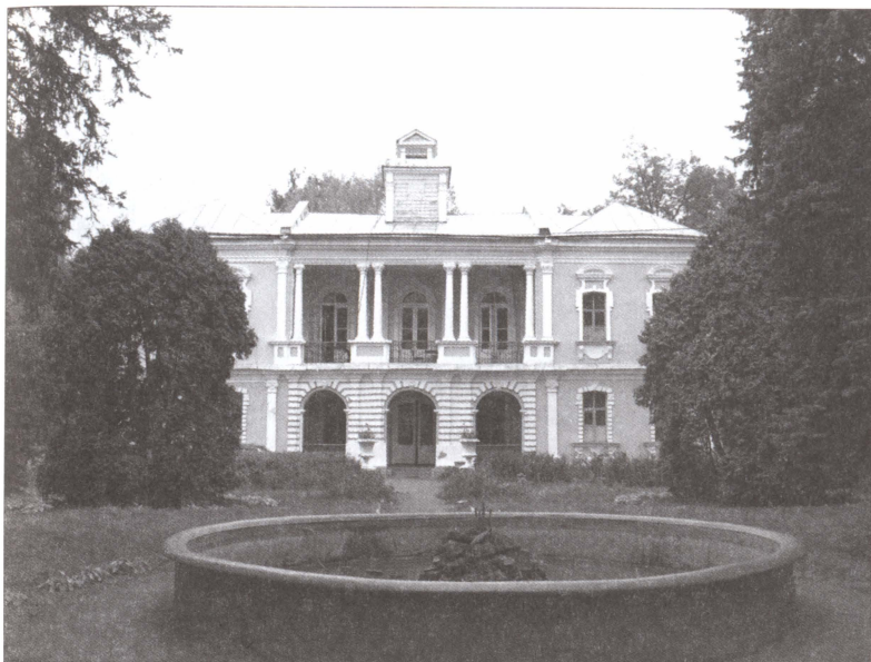
Обсерватория Брюса в его усадьбе в Глинках