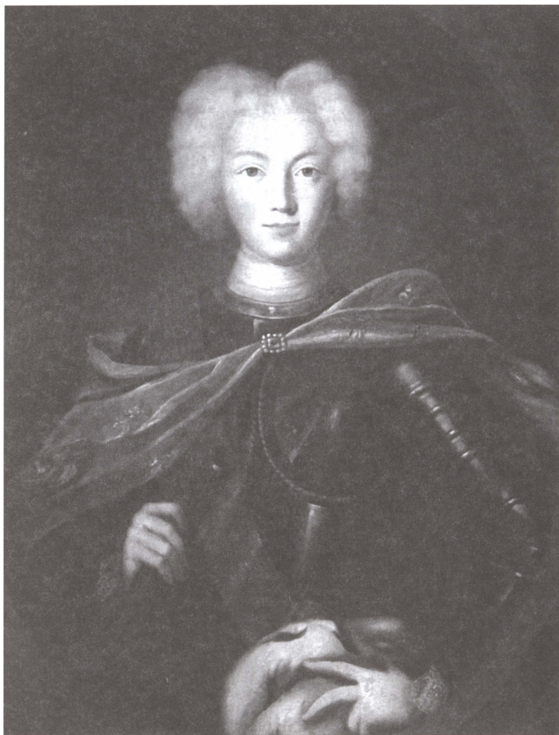
Петр II. Неизвестный художник