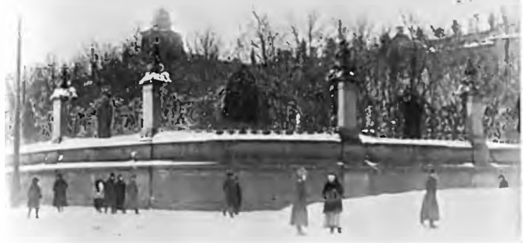
Обхода Зимнего дворца после победы Февральской революции. 1917 г.