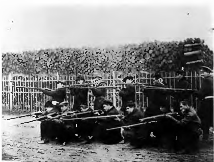
Красногвардейцы у ограды Смольного. Октябрь 1917 г.