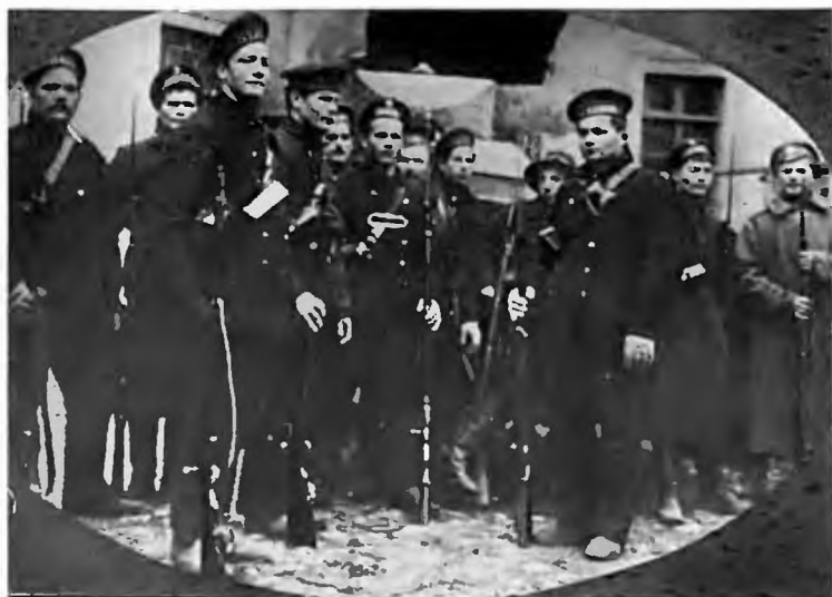
Матросы — участники Великой Октябрьской социалистической революции.