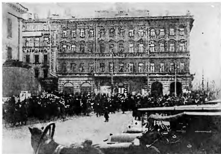
У городской думы в дни Октября.