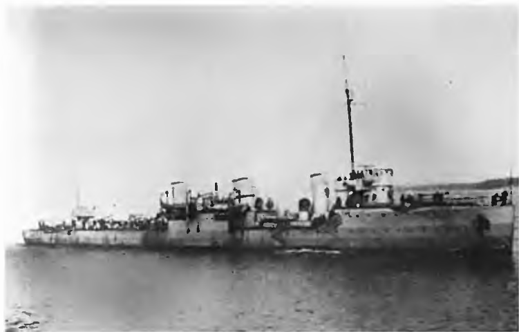
Эсминец «Забияка» — один из кораблей, участвовавших в Октябрьской революции.