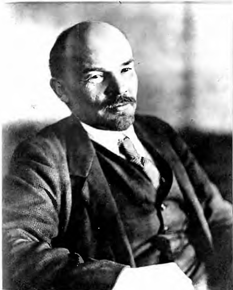
В. И. Ленин. Петроград. Смольный.