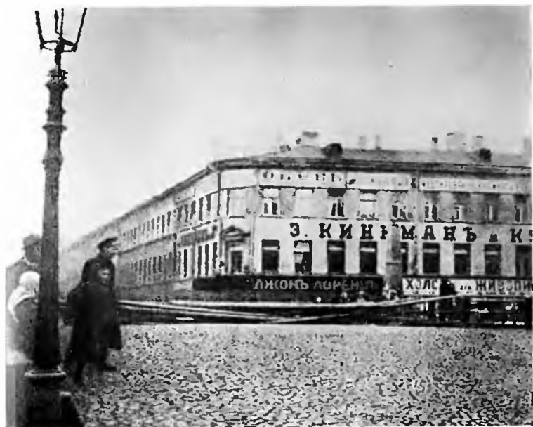
Заграждения на Гороховой улице (ныне — улица Дзержинского) в дни Октября.