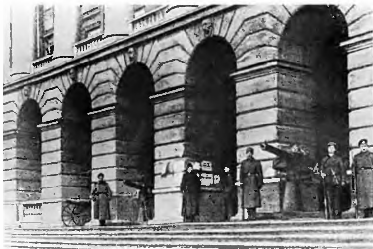
Штаб революции Смольный в дни Октября.