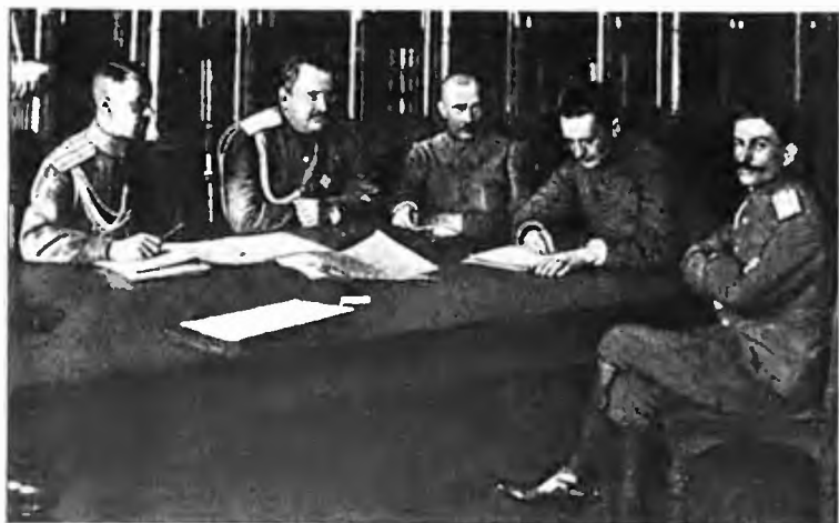
Прежде чем назначить себя министром-председателем, Керенский (второй справа) занимал место военного и морского министра во втором коалиционном Временном правительстве