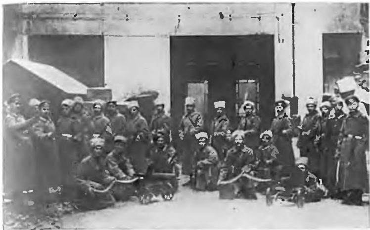
Солдаты Кексгольмского полка во дворе Центральной телефонной станции. Октябрь 1917 г.