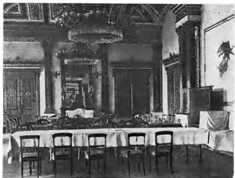
Малахитовый зал Зимнего дворца.