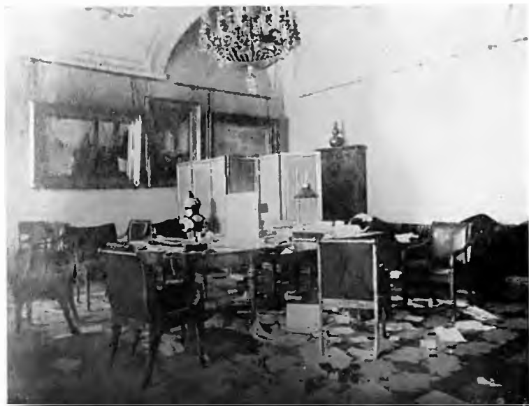
Кабинет Керенского в Зимнем дворце (после штурма)