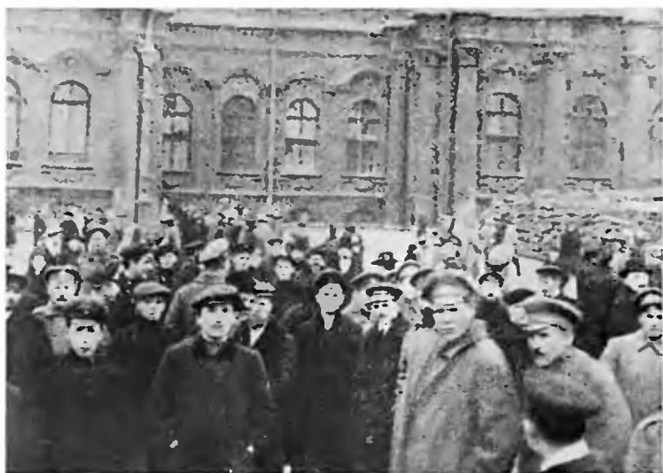
У Зимнего дворца утром 26 октября (8 ноября) 1917 г.