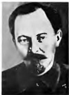
А. С. Бубнов, Ф. Э. Держинский.