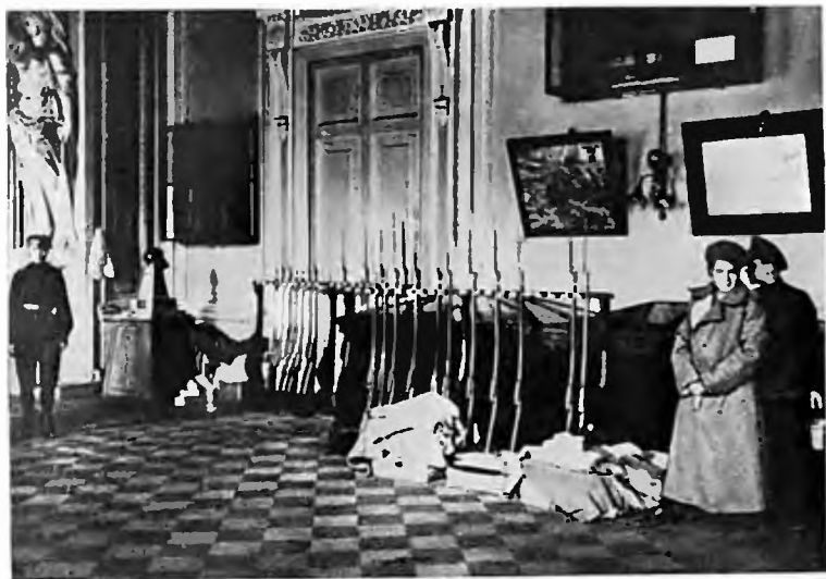
Помещение ударниц Женского батальона в Зимнем дворце. 1917 г.