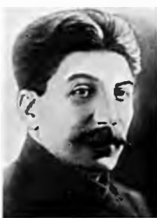
Я. М. Свердлов, Н. В. Сталин.