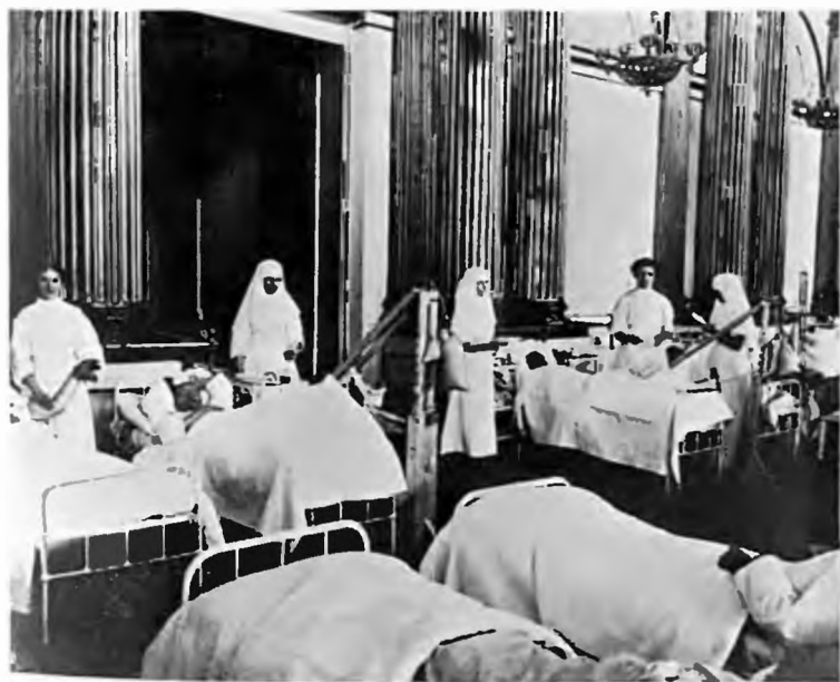
В Зимнем дворце в 1916—1917 гг. размещался госпиталь. Так выглядела одна из палат