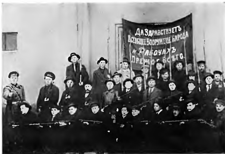
Одни из отрядов Красной гвардии Петрограда. Октябрь 1917 г