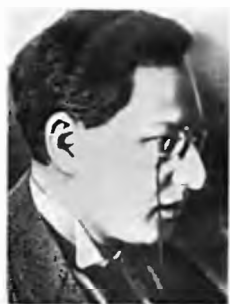
М. С. Урицкий.