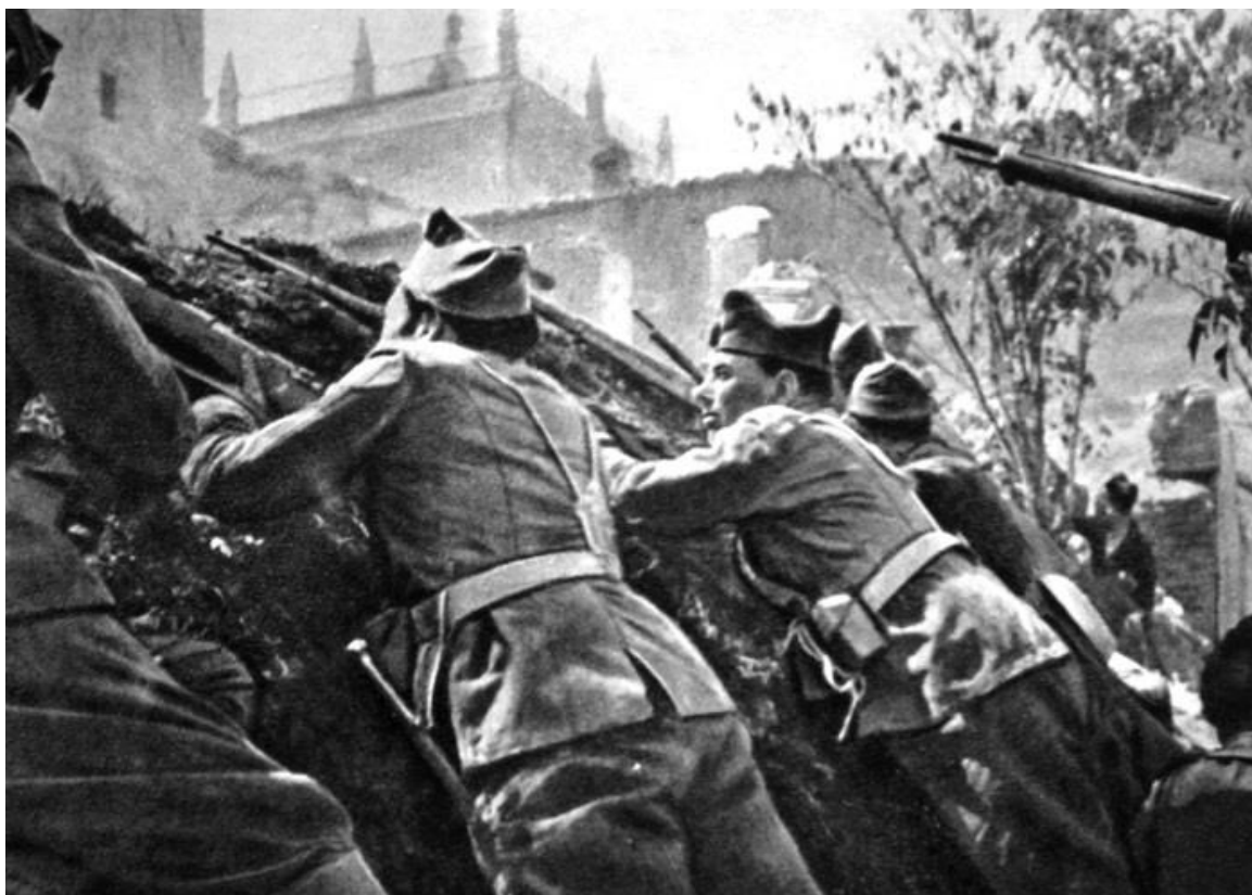
Республиканцы осаждают Альказар