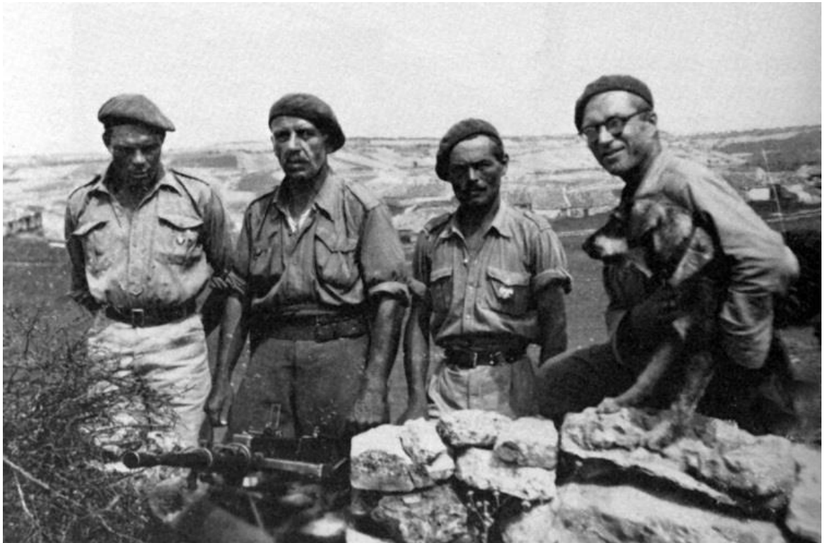
Русские добровольцы в терсио Дона Мария де Молина.

Терсио Дона Мария де Молина было образовано путем слияния двух независимых подразделений. Терсио Марко Белло было названо в честь одного из лидеров 3-й карлистской войны дона Мануэля Марко-и-Родриго, родившегося в живописном арагонском поселке Белло. Командиром этого терсио был капитан Панталеон Лопес Линарес. Другое терсио – Донна Мария де Молина было названо в честь королевы Кастилии и Леона (1265–1321), оно было сформировано в Сарагосе, но затем 8 августа 1936 г. переведено в городок Молина де Арагон. Командиром этого терсио был капитан Антионио Фернандес Кортес. В конце 1936 г. из-за своей малочисленности оба терсио были объединены под названием Дона Мария де Молина.