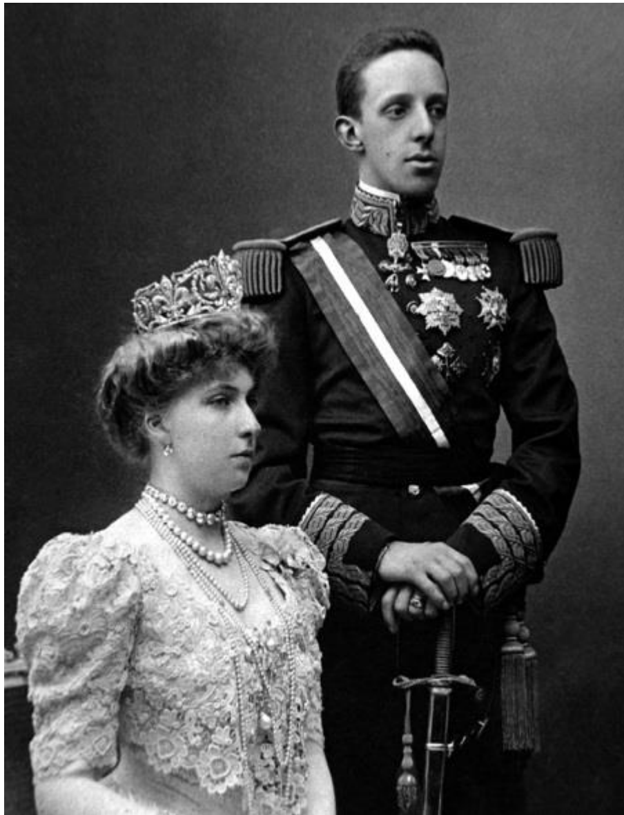
Король Испании Альфонс XIII с супругой

Затяжная война в Марокко предостерегла Испанию от вступления в Первую мировую войну. Испания смогла разбогатеть на поставках в воюющие страны, но это не отразилось на благосостоянии неимущих слоев. На фоне социальных проблем резко активизировалась деятельность профсоюзов и анархистов. Февральская революция в России стала для республиканцев всего мира сигналом к действию. В августе 1917 г. по всей Испании началась всеобщая забастовка, возглавляемая профсоюзными деятелями. В стране было объявлено военное положение и армия приступила к наведению порядка. Через шесть дней порядок в стране был восстановлен.