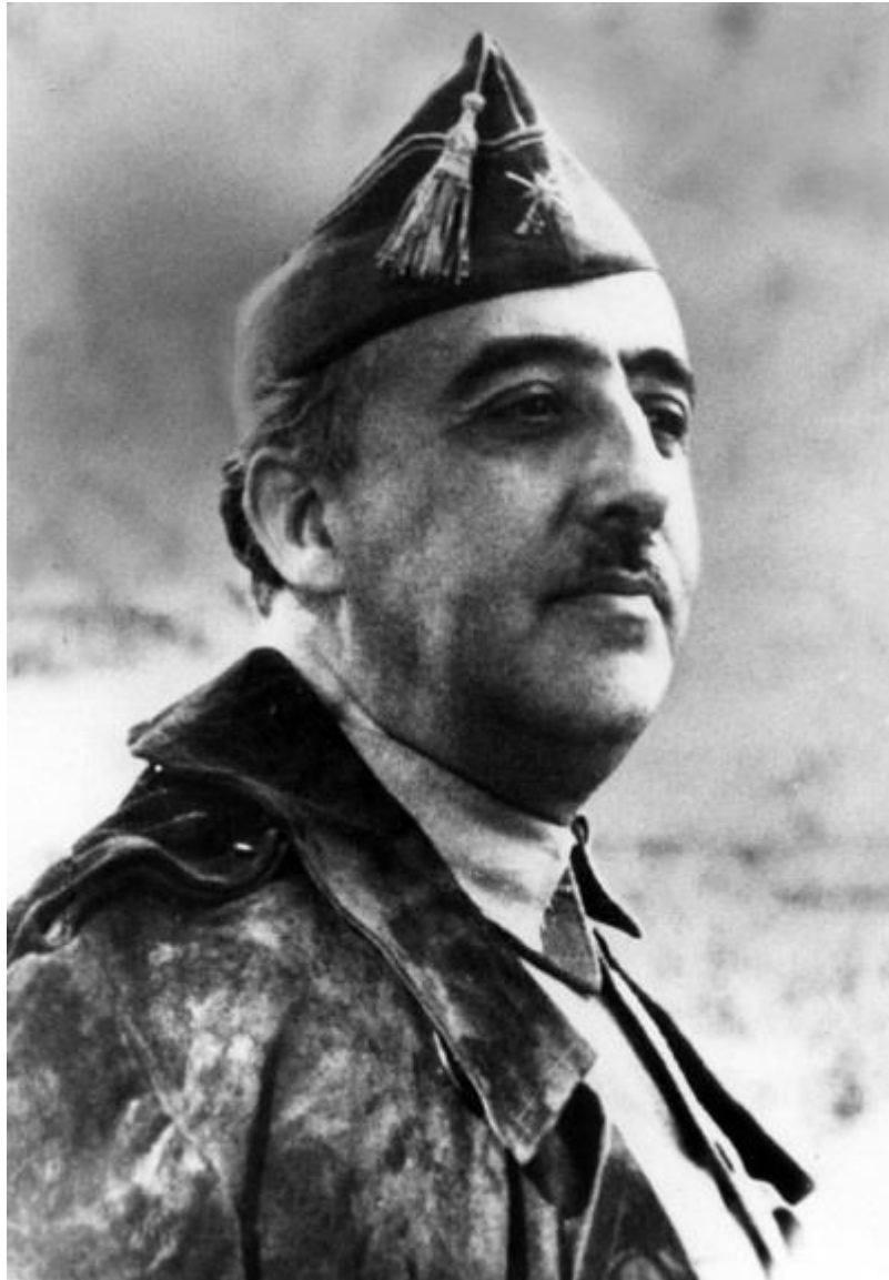
Генерал Ф. Франко

Но главные события восстания развернулись в Астурии. Здесь левым удалось договориться о тесном сотрудничестве. Движущей силой астурийского восстания стали шахтеры. Уже задолго до восстания ими были сделаны большие запасы оружия и взрывчатки, кроме того, в первые дни восстания был захвачен оружейный завод со всей продукцией. За три дня почти вся Астурия оказалась в руках мятежников. Было объявлено о создании социалистической республики и образовании Красной армии, в ряды которой было мобилизовано 30 000 рабочих 71 .