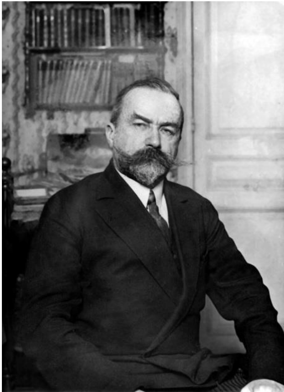
Глава РОВСа генерал Е.К. Миллер

Вернемся теперь к назначению генерала Миллера. В эмиграции генерал Миллер был одним из ближайших сотрудников генерала Врангеля, и его назначение на пост руководителя РОВСа было закономерным. Однако в отличие от предыдущих возглавителей союза Евгений Карлович был мало известен основной массе чинов РОВСа (в годы Гражданской войны он сражался с большевиками на Северном фронте, а большая часть чинов РОВСа – на юге России). Генерал Миллер был хорошим командиром, неплохим организатором, но имел очень мягкий характер. Для упрочения своего положения и ознакомления с членами союза он во второй половине 1930 г. совершил ряд инспекционных поездок по отделам союза. Им была предпринята попытка повысить уровень подготовки офицеров РОВСа. С этой целью в конце 1930 г. с одобрения Миллера в Париже и Белграде началась широкомасштабная работа по организации различных курсов повышения квалификации офицеров. В сентябре 1931 г. были открыты и унтер-офицерские курсы при отделении Общества галлиполийцев в Варне 146 .