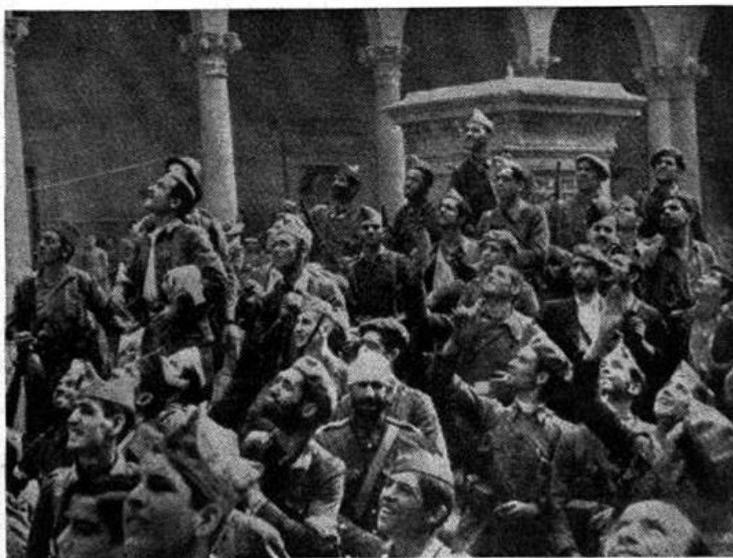
Осажденные Альказара въ моментъ освобожденія.

Номер журнала «Часовой», посвященный Альказару