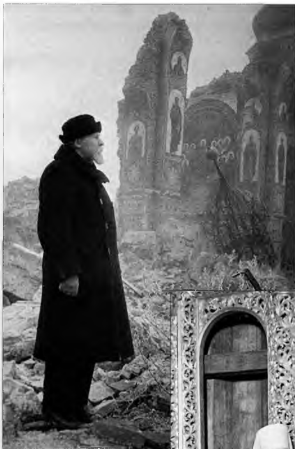
Митрополит Николай осматривает руины Успенского собора Киево-Печерской лавры Киев, 1943