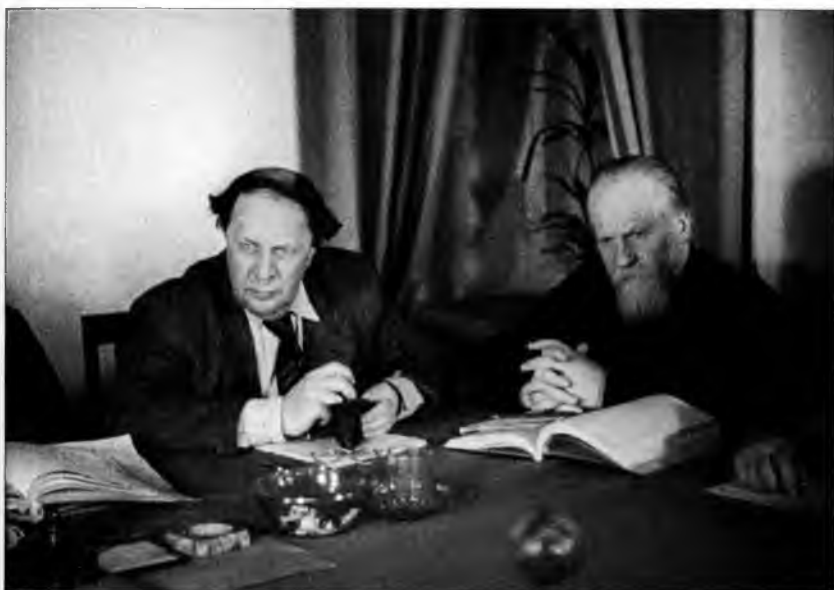
Митрополит Николай и писатель А. Н. Толстой на заседании Чрезвычайной Государственной комиссии Кинофильм «Разрушение памятников культуры», 1943