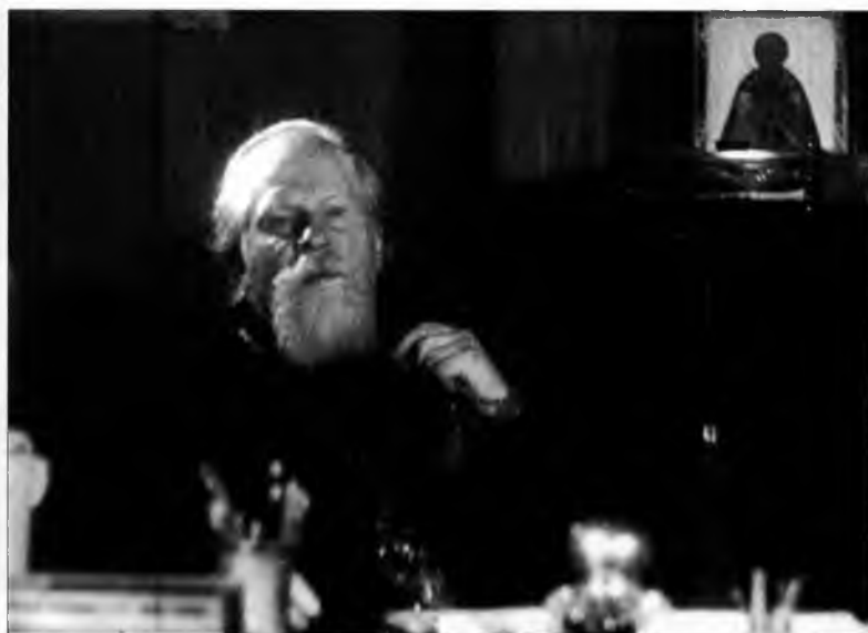
Митрополит Николай рассказывает о работе комиссии Кинофильм «Разрушение памятников культуры», 1943