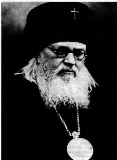
Святитель Лука (Войно-Ясенецкий) В 1943 г. становится архиепископом Красноярским; в 1944 г. переведен в Тамбов архиепископом Тамбовским и Мичуринским