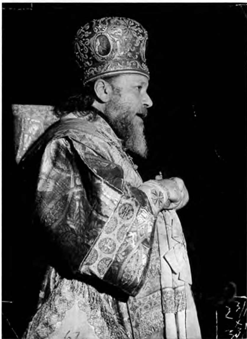
Митрополит Ленинградский и Новгородский Алексий (Симанский) проповедует в храме август, 1941