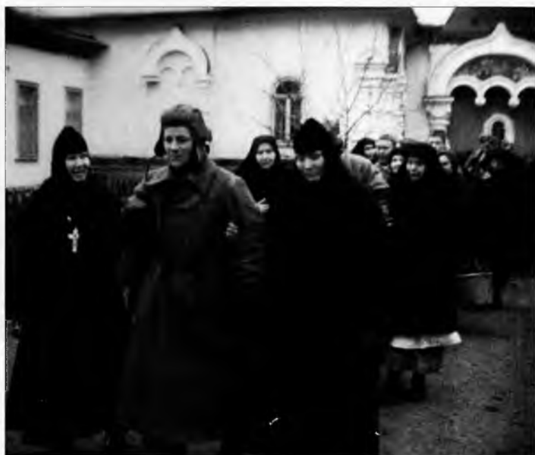
Монахини принимают раненых