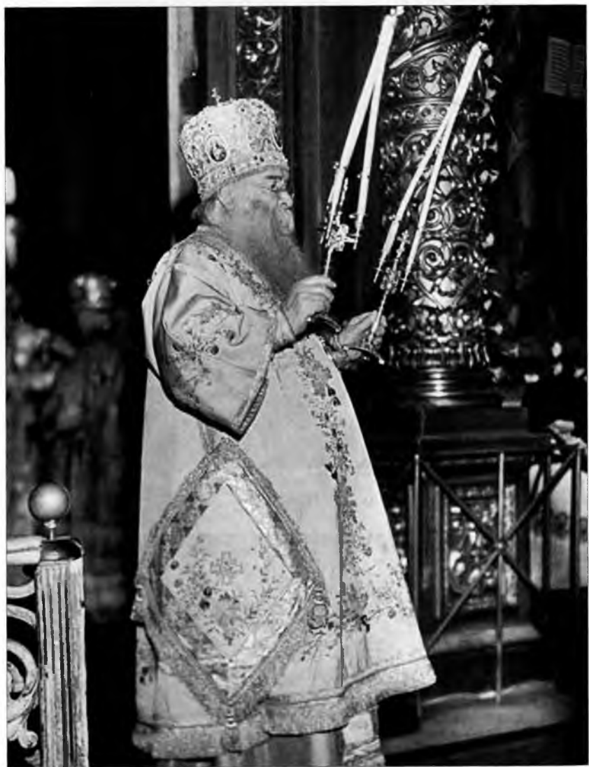
Митрополит Сергей (Страгородский) за богослужением в Богоявленском соборе в Елохове Москва, август 1941