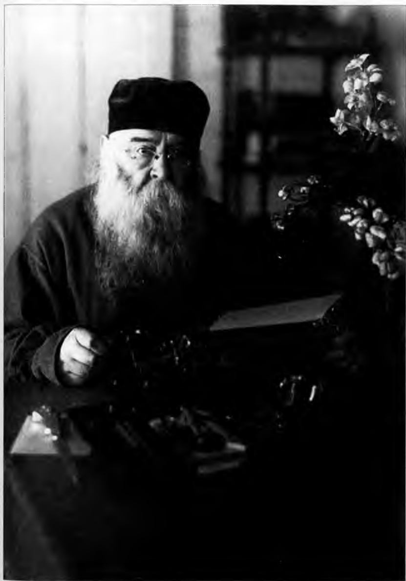
Митрополит Сергей в своем кабинете за рабочим столом 1941