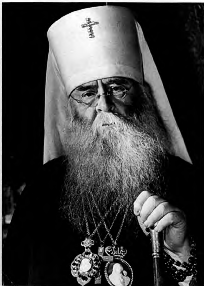
Блаженнейший Сергей (Страгородский), митрополит Московский и Коломенский август 1941