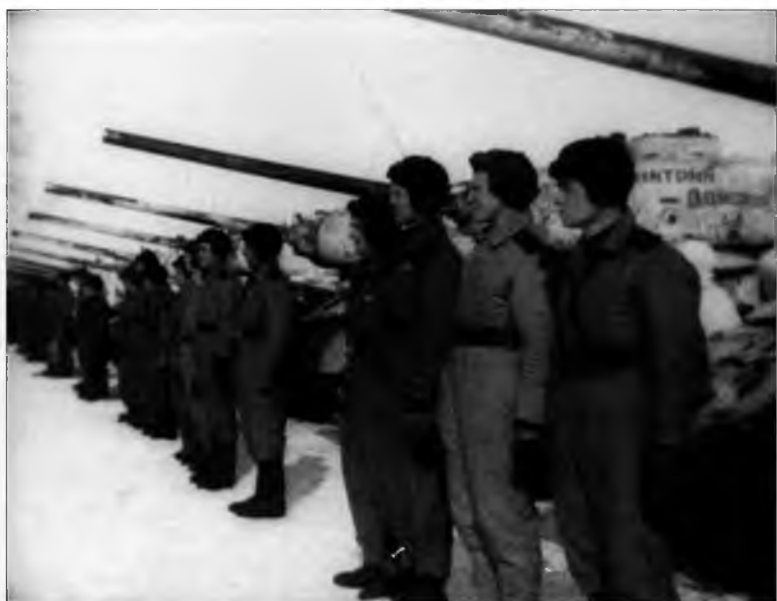
Танкисты у колонны танков