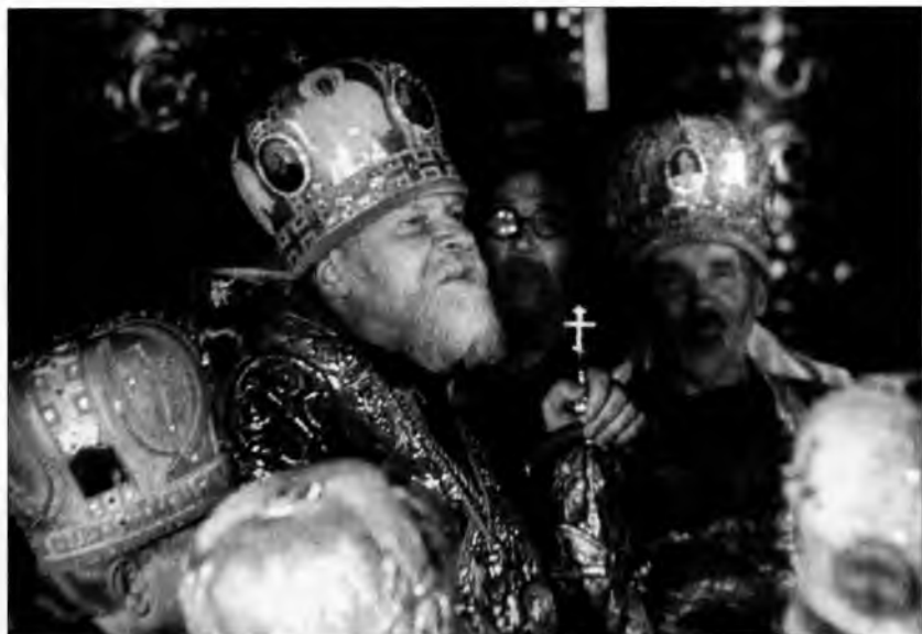
Митрополит Николай на молебне о даровании победы в день годовщины начала войны в Богоявленском кафедральном соборе Москва, 22.06.1942