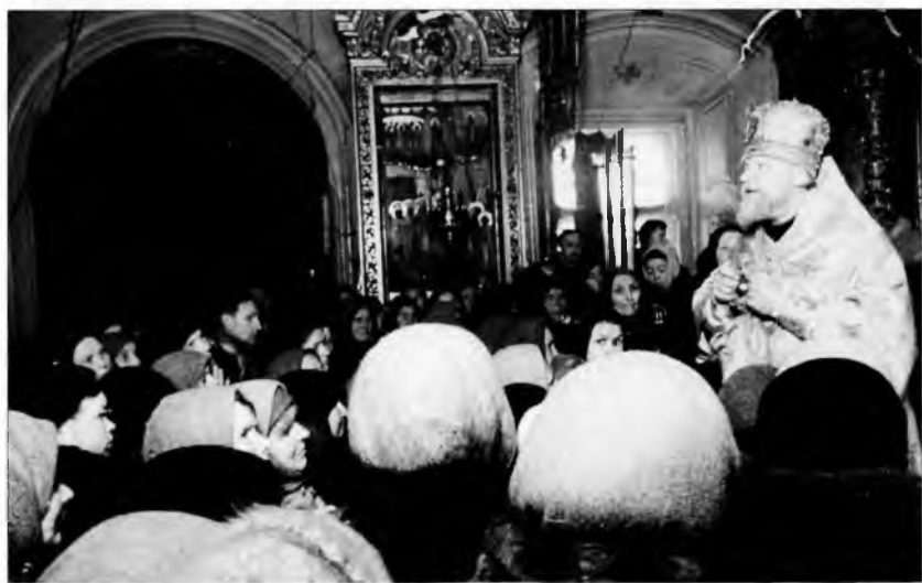
Митрополит Николай произносит проповедь в храме Преображения Господня, призывая верующих к борьбе с врагом Москва, 1942