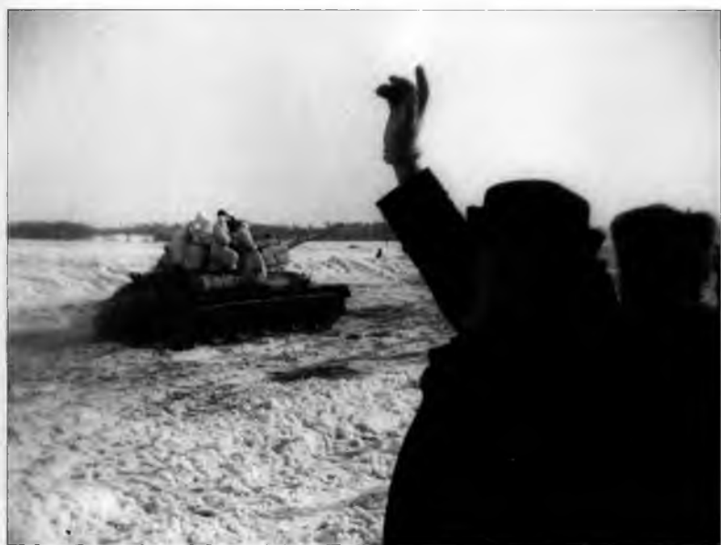
Митрополит Николай благословляет танкистов, уходящих на фронт