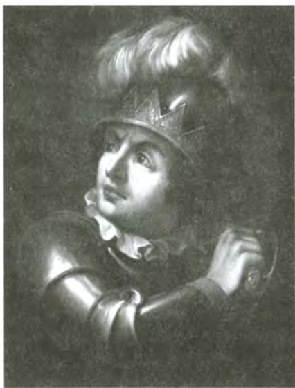
Король Польши Владислав III Варненчик

Войска крестоносцев меж тем брали крепость за крепостью, и в начале ноября 1444 г. достигли Черноморского побережья в районе города Варны. Здесь они должны были погрузиться на обещанные генуэзцами суда и отправиться в Константинополь. Но никаких судов не оказалось, а вместо них (по некоторым сведениям, с помощью кораблей тех же генуэзцев) прибыла армия султана Мурада II. Численность турецких войск, по современным нам оценкам, составляла около 40 тысяч человек. 10 ноября под стенами Варны