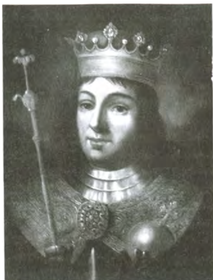
Король Польши Ян-Альбрехт