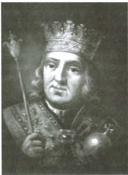
Король Польши и великий литовский князь Казимир