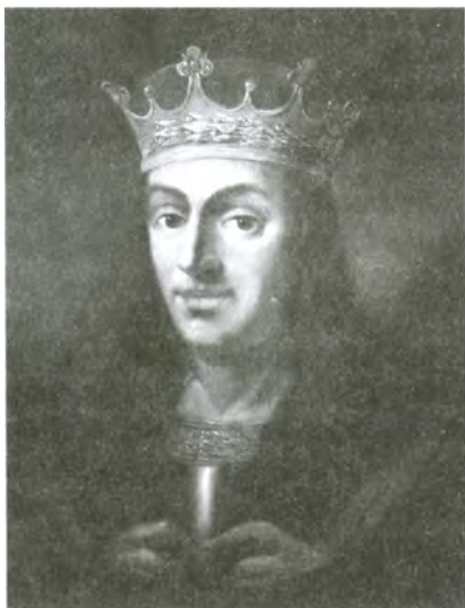
Король Польши и великий литовский князь Александр

Следует также дополнить, что новогрудский сейм 1502 г. интересен для нашего повествования не только теми мерами, которые были там приняты, но и вопросами, которые сейм не стал рассматривать. Как мы помним, для вступления в силу Мельницко-Петроковского акта об унии с Польским королевством он должен был быть «одобрен, ратифицирован и подтверждён» постановлением сейма и грамотами «всех прелатов, князей, панов, шляхты и виднейших городов» Литовского государства. Спустя девять месяцев после данного полякам обещания, сейм, который мог утвердить указанный акт, был созван. Однако вопрос о подтверждении династической унии между Литвой и Польшей сейм не обсуждал и не рассматривал. Великое княжество продолжало сохранять отдельную систему государственного управления и финансовую самостоятельность, в силу которой даже после избрания Александра королём Польши литовские и польские денежные счета велись по отдельности. Таким образом, идея создания «одного