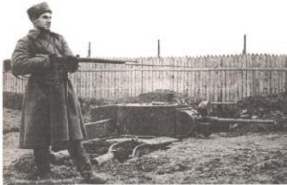
Неисправный танк БТ-7, превращенный в неподвижную огневую точку и арытый в пригороде Москвы. Рядом стоит солдат (предположительно — ополченец) с французской винтовкой Лебеля

подвергаются «безжалостному анализу», да еще «на огромном фактическом материале»? Ведь есть же реальные подвиги, подтвержденные документально, причем не только с советской, но и с немецкой стороны. Мединский, однако, ими интересоваться не стал.