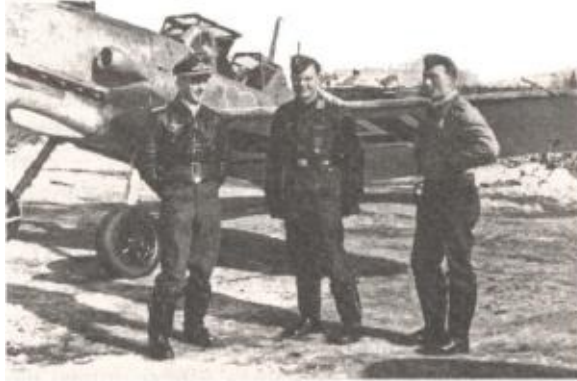
Обер-лейтенант Финк, обер-фельдфебель Клемм и гауптман Юнг из истребительной эскадры JG54 «Grünherz» («Зеленое сердце») на фотографии, сделанной в честь 2000-й победы эскадры 5 апреля 1942 г. Известные подразделения Люфтваффе, подобные «Зеленым сердцам», на деле были обычными линейными частями, укомплектованными рядовыми летчиками