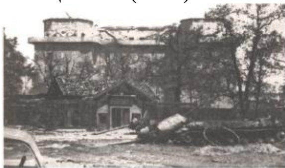
Подбитый тяжелый танк ИС-2 на фоне Flakturm muna Bayart 1. Берлин, 1945 г. Именно эти внушительные сооружения высотой в 39 м, со стенами толщиной 3,5 м и пятиметровыми перекрытиями, способные вести огонь из зенитных орудий на 20,9 км в горизонтальной плоскости, представляли основную проблему для войск Красной Армии, штурмовавших Берлин

упускает даже на ровном месте. Так, в частности, он пишет: «Рейхстаг был главным опорным пунктом в обороне Берлина, который позволял контролировать весь центр города» (с. 548, выделено мной. — А.И.). Рейхстаг — достаточно низенькое здание, для того чтобы что-то контролировать в условиях плотной берлинской застройки начала 1945 г. С другой стороны, а почему именно Рейхстаг, а не, скажем, Ангальтский вокзал, с которым советские войска возились дольше? На роль опорных пунктов с натяжкой могли претендовать Флактурымы со 128-миллиметровыми пушками на крышах и толстенными стенами. Не зря же во Флактурме «Зоо» сидел комендант Берлина Вейдлинг. Рейхстаг с гарнизоном, вооруженным лишь стрелковым оружием, уступал Флактурам по всем параметрам, а в Берлине было аж три Флактура. Но Мединский этих азов не знает, и поэтому у него Рейхстаг становится главным опорным пунктом в системе берлинской обороны. Кстати, из-за того же незнания азов 9-ю армию Бюссе к юго-востоку от Берлина, которой не дали отойти в город, автор благополучно перепутал с 12-й армией Венка к западу от столицы Рейха (с. 418).