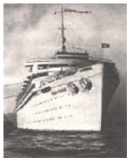
Немецкий лайнер «Вильгельм Густлов», потопленный лодкой С-13. Легким движением клавиши Мединский превратил 406 погибших на нем подводников в 1300.

За один поход Маринеско стал самым результативным подводником русского флота на все времена, и его имя будет навсегда вписано в отечественную историю. Но Мединскому этого недостаточно, и он с энтузиазмом занимается любимыми приписками. В реальности на «Густлове», помимо прочих, плыли 902 курсанта и 16 офицеров (включая 8 военных врачей) 2-го батальона 2-й учебной дивизии подводных сил, из которых погибло только 406 человек. Маловато будет? И легким тычком в клавиатуру четыре сотни покойников превращаются в «1300 немецких подводников, среди них — полностью сформированные экипажи подводных лодок и их командиры» (с. 287).