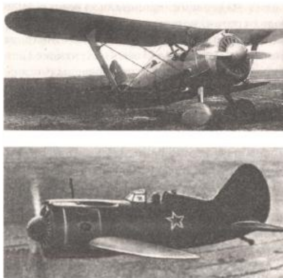
Истребители И-15 (сверху) и И-16 (снизу). Мединский не видит разницы между ними.

Также сеньор Хосе никак не мог возглавить в те дни Хунту национальной обороны. Наступление Франко на столицу Испании, о котором пишет Мединский, происходило осенью 1936 года, и орган, которым руководил тогда Миа-ха, назывался Хунтой обороны Мадрида (Junta de Defense de Madrid). Хунта же (или точнее Совет) национальной обороны (Consejo Nacional de Defense), формально возглавляемый Миахой, а фактически командующим обороняющими Мадрид войсками полковником Касадо, — возникла 5 марта 1939 года. В ночь на 6 марта она подняла мятеж против правительства, а после провала переговоров с Франко и развала фронта большинство путчистов благополучно сбежало. Сеньор Хосе, хотя и «сжег все пути к отступлению», тоже успешно смылся и умер в 1958 году в Мексике, чуть-чуть не дожив до 80-летнего юбилея, но оглушенному собственной типа патриотической трескотней автору не до таких мелочей. Мало ли в Бразилии Педро, то бишь в Испании хунт! Не до них, когда в России бабло рубить надо!