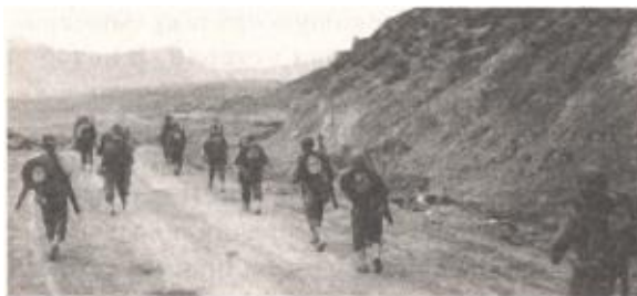
Американские солдаты на тунисском перевале Кассерин, у которого фельдмаршал Роммель в феврале 1943 года разбил 1-ю танковую дивизию США. Если верить Мединскому, этого сражения никогда не было.

Но Мединский сам признается, что пишет «не научную книгу» (с. 641), и потому продолжает тиражировать давно обнаруженный ляп переводчика. Ну и конечно, не забывает повторить старую байку о немецких потерях в Корсунь-Шевченковской операции. Впервые о 52 тыс. убитых и 11 тыс. пленных гитлеровцев заявил Сталин в приказе от 18 февраля 1944 года. Потом историки и политработники округлили количество немецких трупов до 55 тыс., довели число пленных до 18 тыс. и от щедрот добавили еще 20 тыс. немецких покойников, уничтоженных вне Корсунь-Шевченковского котла. Можно было округлять и дальше, но появился перевод скучных немецких документов, согласно которым общие потери противника составили около 40 тыс. человек, в том числе более 20 тыс. убитыми и пленными.