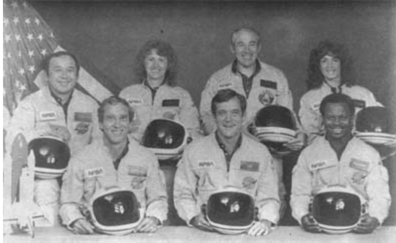
Экипаж космического корабля «Челленджер», США, 1985. Первый ряд (слева направо): М.Смитт, Ф.Скоби, Р.Макнейр; второй ряд: Э.Онизука, К.Маколифф, Т.Джарвис, Ю.Резник