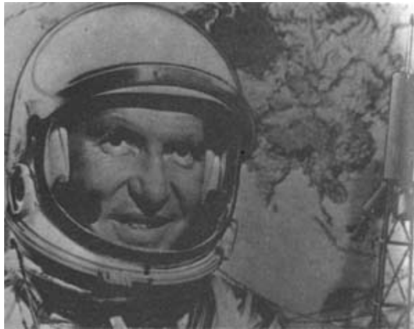
Пилот космического корабля «Меркурий» Уолтер Ширра. Мыс Канаверал (штат Флорида), 1962 год