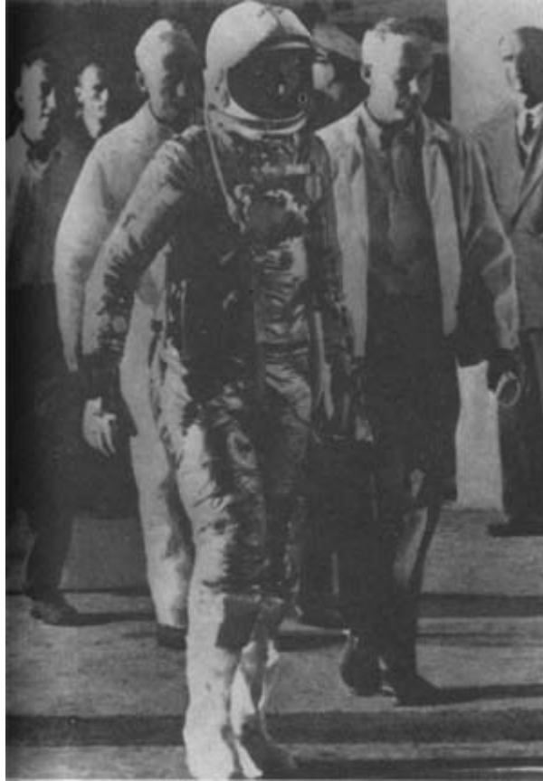
Джон Гленн направляется на стартовую площадку. 20 ноября (20 февраля - Хл.) 1962 года

корабля «Меркурий». Мыс Канаверал (штат Флорида), 1962 год