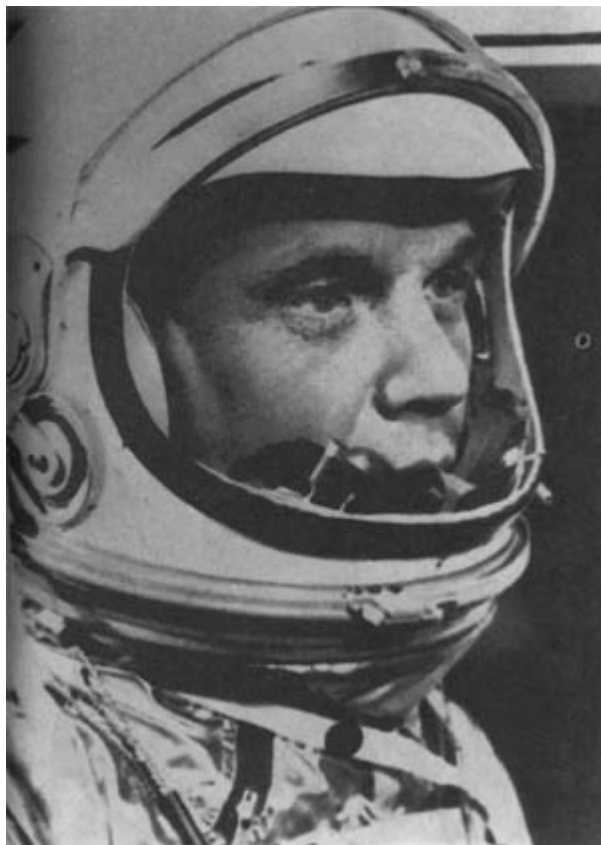
Пилот космического корабля «Меркурий» Гленн. 1961 год