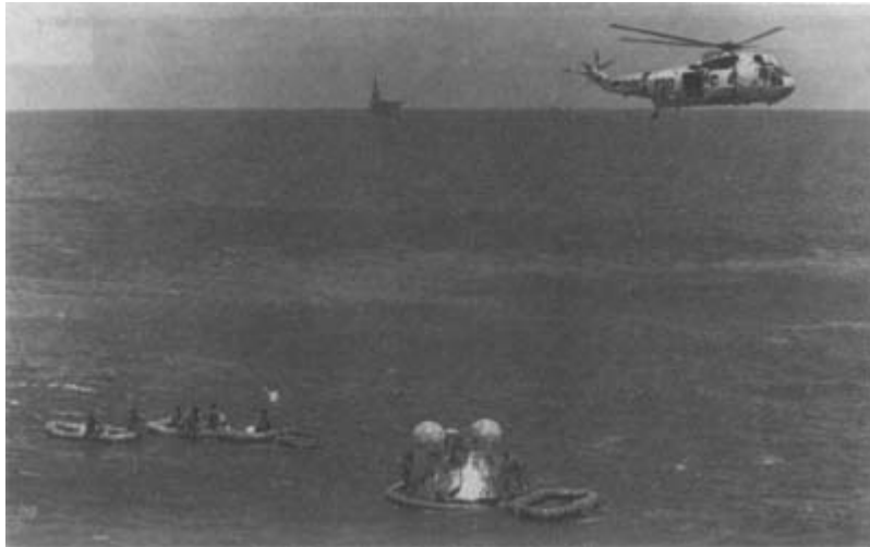
Вертолёт поисковой службы над местом приводнения командного модуля космического корабля «Аполлон» после завершения полёта по программе ЭПАС. 24 июля 1975 года.