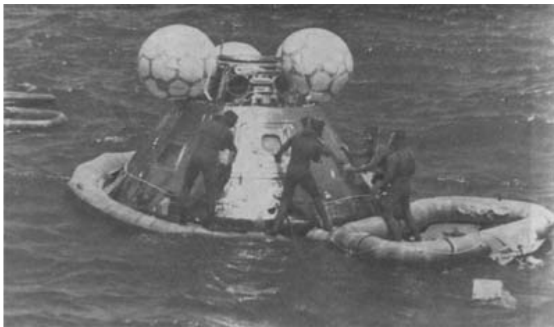
Аквалангисты подводят надувное резиновое кольцо под командный модуль космического корабля «Аполлон» после приводнения в Тихом океане. 24 июля 1975 года