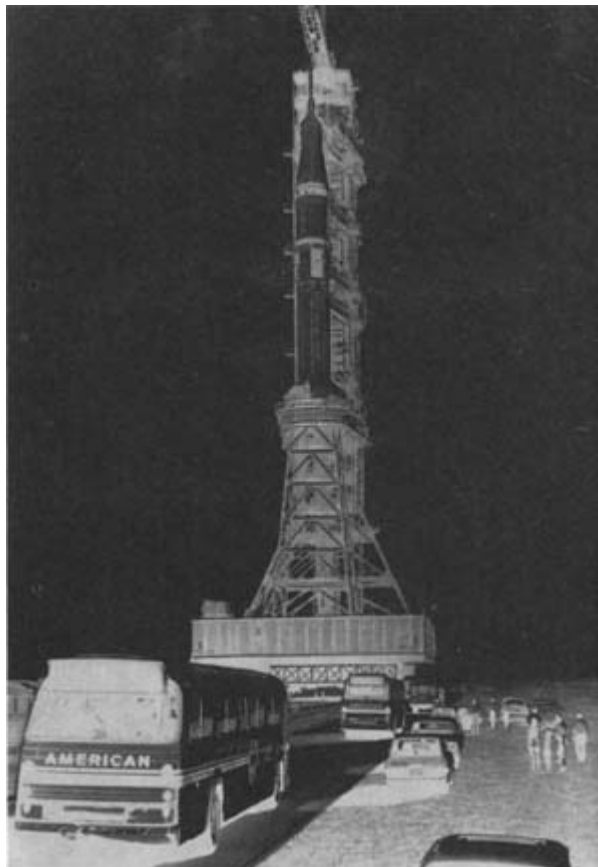
Транспортировка ракеты-носителя «Сатурн-1В» («Сатурн-1В» - Хл.) в космическом Центре им.Кеннеди (штат Флорида). 1975 год