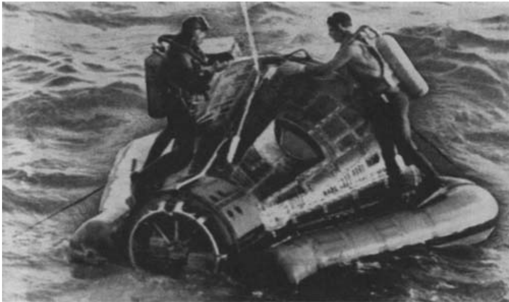
Подготовка корабля «Джемини-3», приводнившегося в Атлантическом океане, к подъёму на борт военно-морского судна. На борту космического корабля Вирджил Гриссом и Джон Янг. 23 марта 1965 года