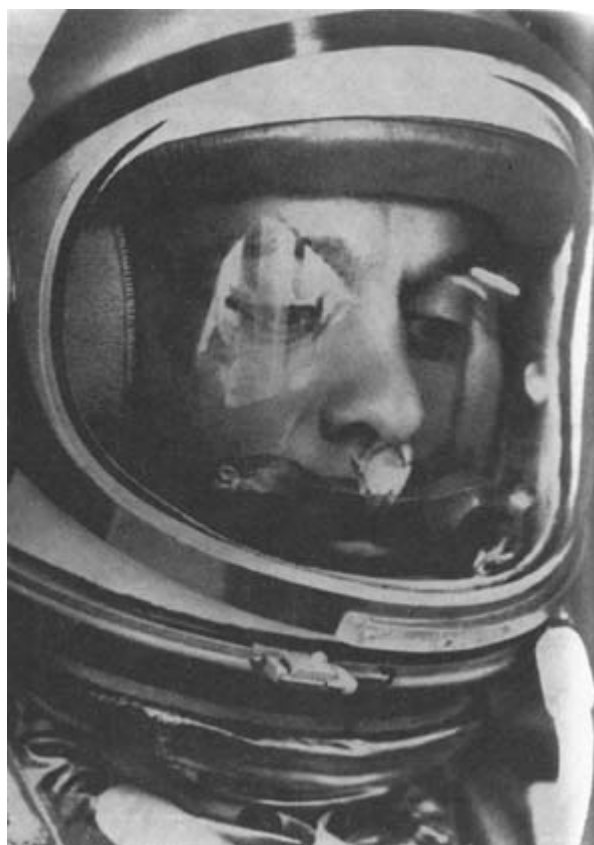
Пилот ракеты «Редстоун» Алан Шепард. Мыс Канаверал (штат Флорида), 1961 год