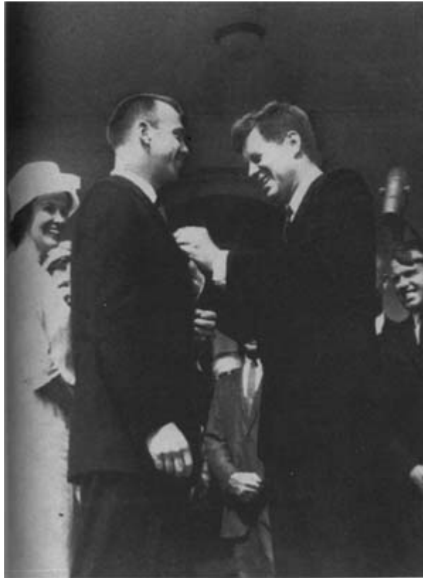
Президент США Джон Кеннеди вручает Алану Шепарду медаль за отличную службу. Вашингтон, май 1961 год