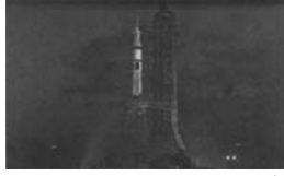
Ракета-носитель «Сатурн-15» («Сатурн-1В» - Хл.) космического корабля «Аполлон» в предполётной готовности по программе ЭПАС. Космический Центр им. Кеннеди (штат Флорида), 2 июля 1975 года.