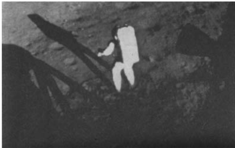
Американский астронавт Нейл Армстронг на Луне. 1969 год