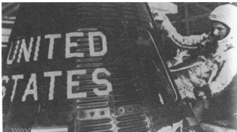
Астронавт Джон Гленн взбирается в капсулу космического