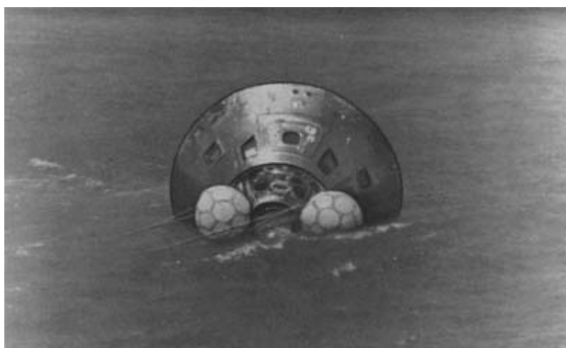
Командный модуль космического корабля «Аполлон» после приводнения в центральной части Тихого океана. 24 июля 1975 года