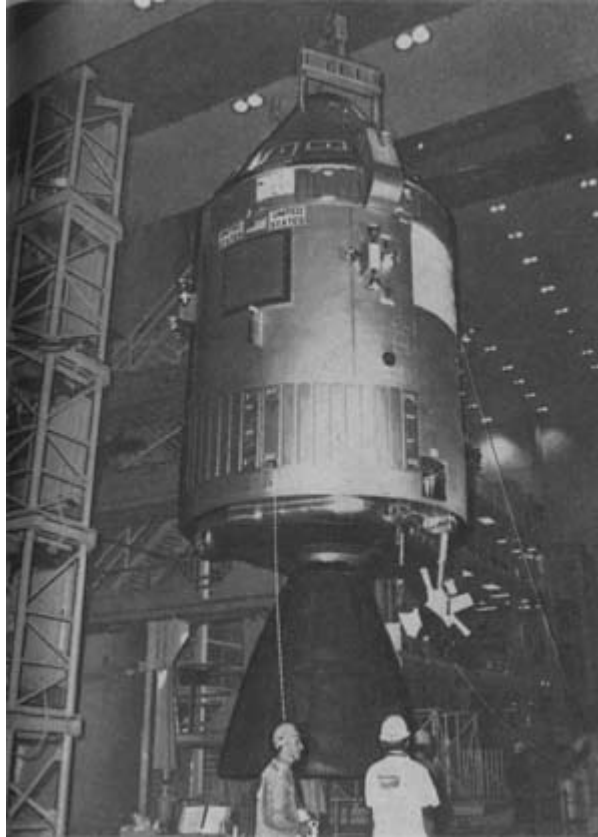
Космический корабль «Аполлон» в корпусе вертикальной сборки космического Центра им.Кеннеди (штат Флорида). 1975 год