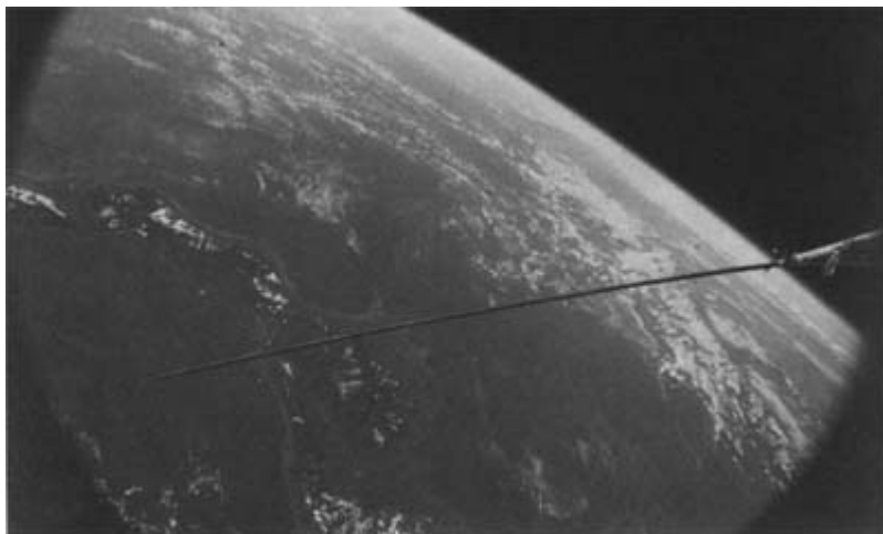
Вид Земли из Космоса