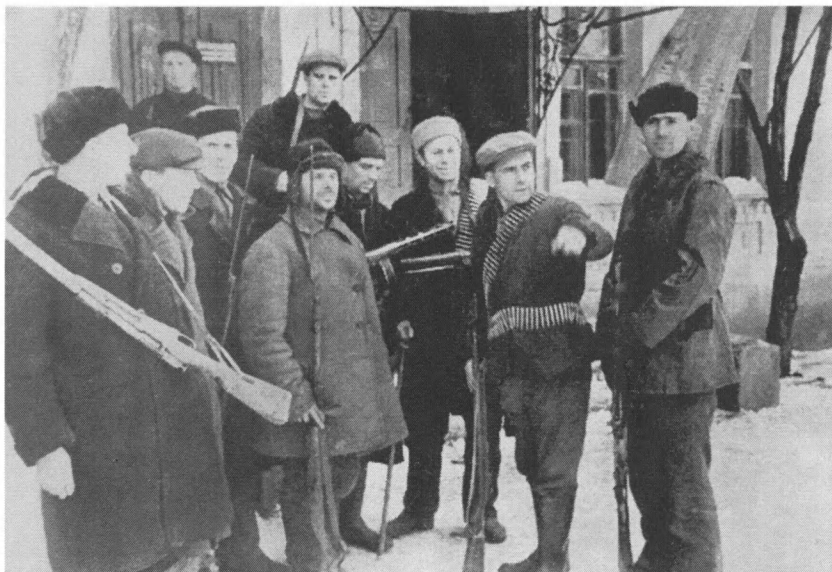
Партизанский отряд «Криворожье» в освобожденном г. Кривом Роге. 28 февраля 1944 г.