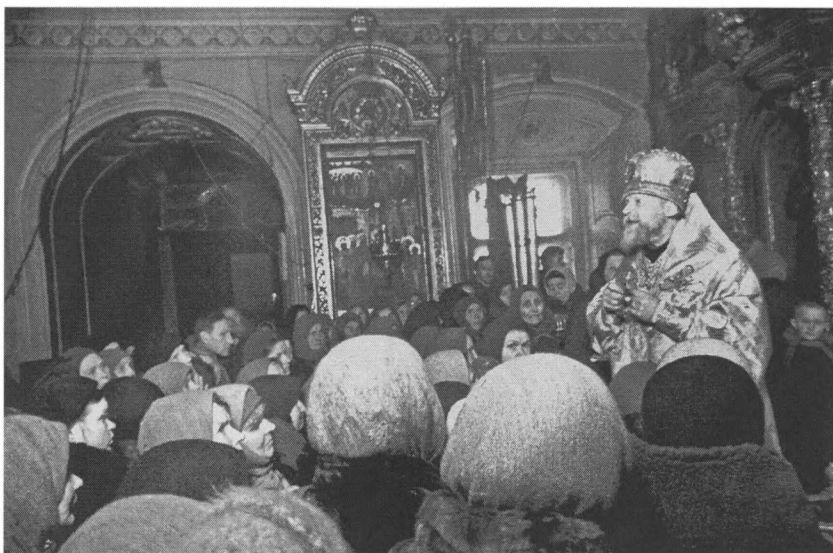
Митрополит Киевский и Галицкий Николай произносит проповедь в храме Преображения. М., 1942.