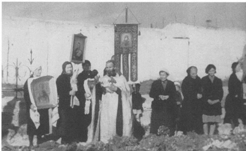
Отпевание жертв оккупации на братской могиле. Операторы Ф. Овсянников, А. Голомб, Петросов. РГАКФД. Арх. № 10840