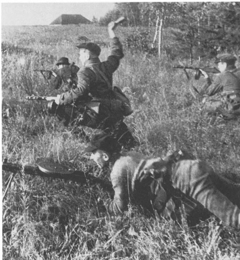
Украинские партизаны на выполнении боевого задания. 1943–1944 гг.