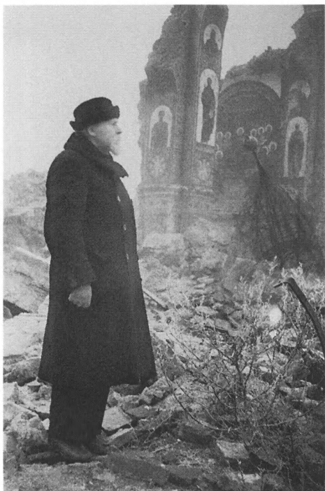
Член Государственной Чрезвычайной комиссии митрополит Киевский Николай осматривает разрушения Успенского собора. Киев, декабрь 1943 г. РГАКФД. Арх. № 0-155103