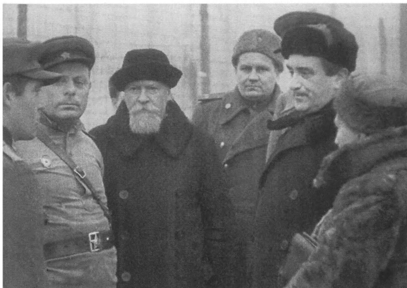
Члены Государственной комиссии, в т. ч. митрополит Крутицкий Николай при допросе пленного немецкого солдата. Чигирин, Кировоградская область, 1944 г. Кадр из документального фильма «Битва за Украину». РГАКФД. Арх. № 8806