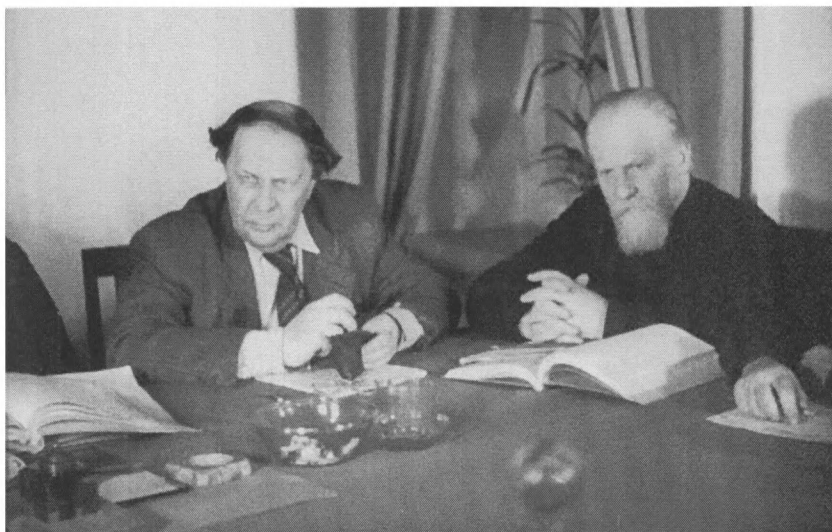
Члены Государственной Чрезвычайной комиссии писатель А.Н. Толстой и митрополит Киевский Николай. 1943 г. Кинолетопись. РГАКФД. Арх. № 10877