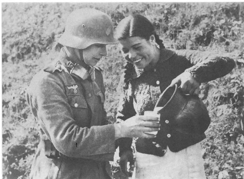
Украинская девушка угощает молоком немецкого солдата. Украинская ССР. 1941–1943 гг. Оп. 3. № 261. Сн. 244