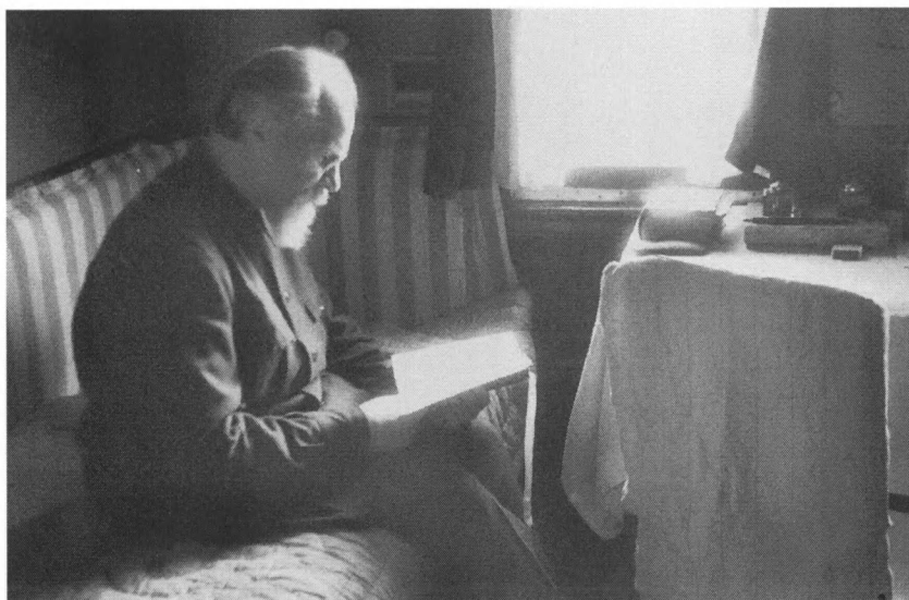
Член Государственной Чрезвычайной комиссии митрополит Киевский Николай. Киев, 1943 г. РГАКФД. Арх. № 104818