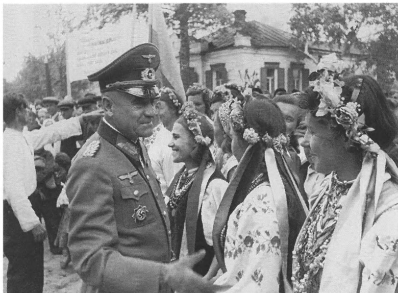
Местное население встречает немецкие войска. Украинская ССР. Июнь–июль 1941 г. Фотограф Киппер. РГАКФД. Оп. 3. № 264. Сн. 61