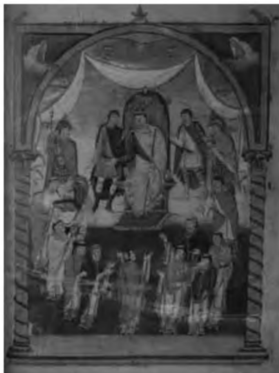
7. Карл Лысый и его двор. Миниатюра из Библии Сан Паоло фуори ле Мура. Третья четверть IX в.