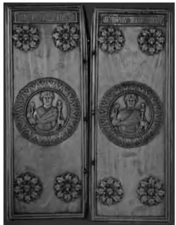
5. Византийский консульский диптих, вручавшийся при введении в должность. VI в.