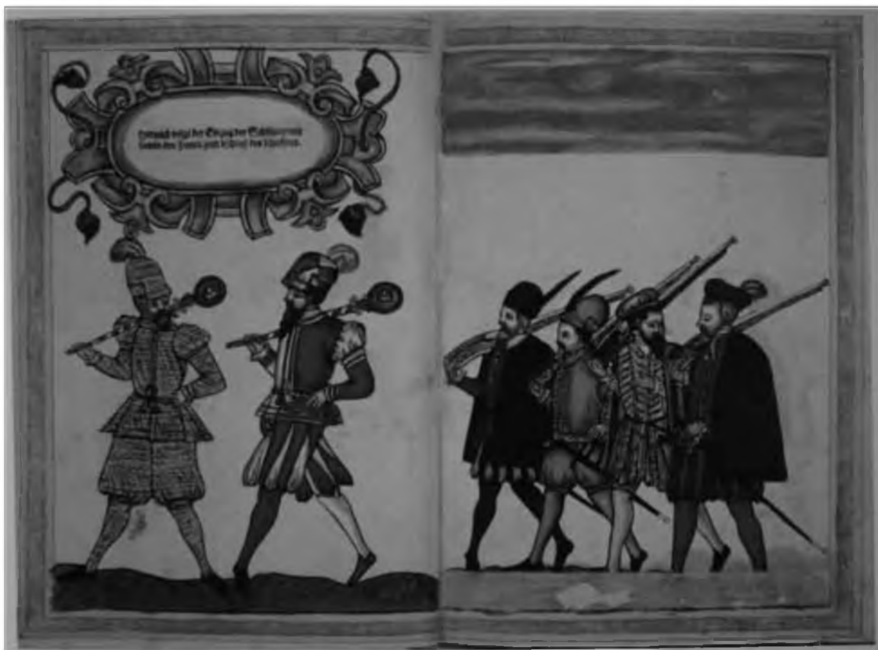
43. Валентин Флексль. Вольные стрелки в Инсбруке. 1569. Цветная гравюра. Вена, Национальная библиотека