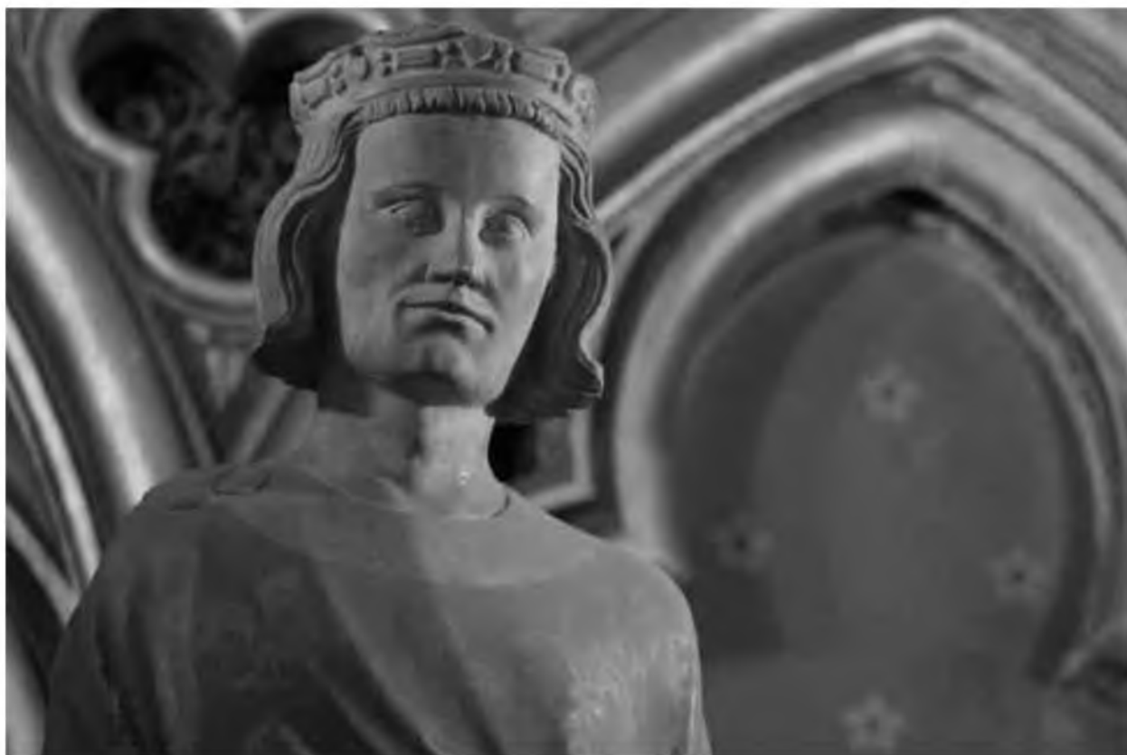
13. Король из династии Капетингов. Статуя в Сент-Шапель. Сер. XIII в.