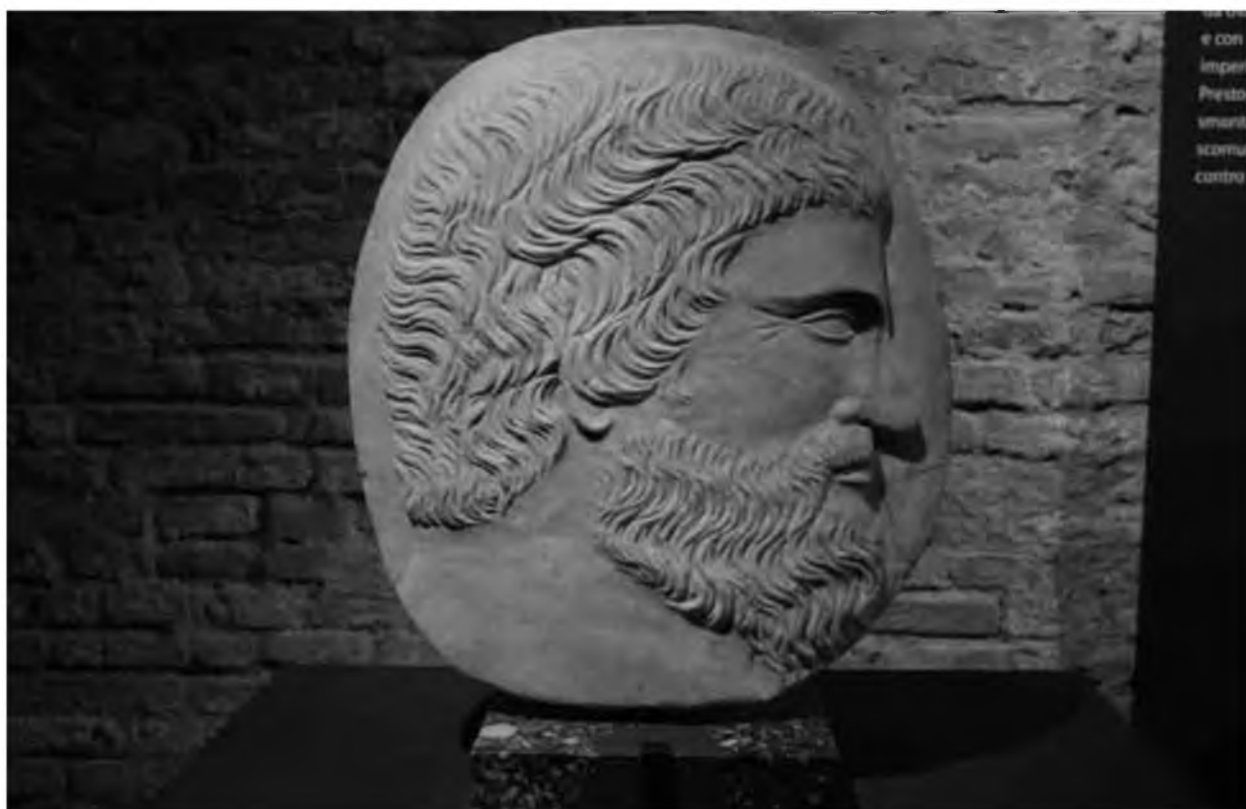
8. Изображение придворного чиновника Фридриха II. Спolieванный фрагмент античного мраморного саркофага. Вторая четверть XIII в. Частная коллекция.