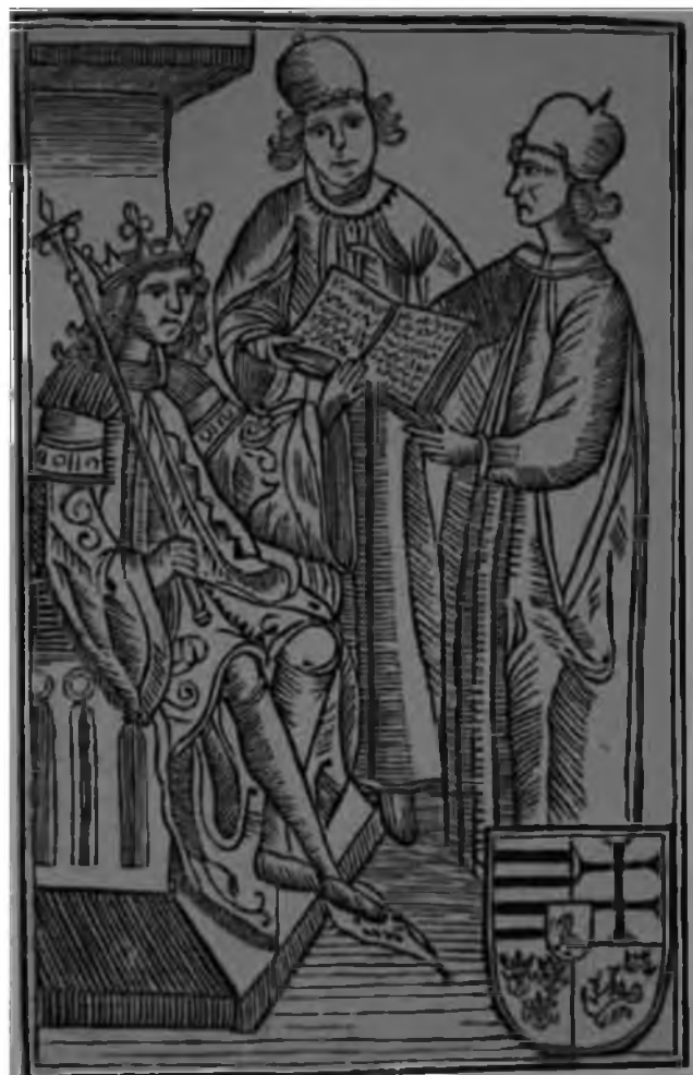
34. Король Матяш Корвин. Титульный лист с печатного издания законов венгерского короля Матяша Корвина. Конец XV в. Будапешт, Национальный музей