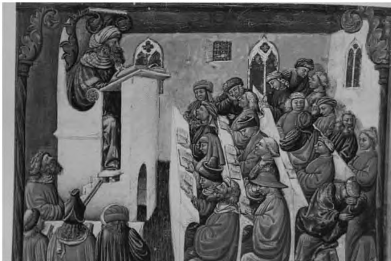
18. Обучение юристов в Болонском университете. XIV в. Миниатюра из итальянской рукописи