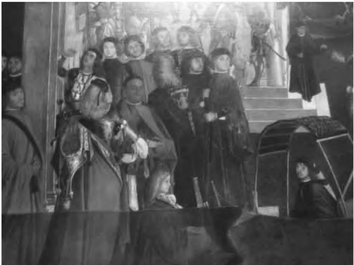
21. Магистраты Венецианской республики. Витторе Карпаччо. Чудеса св. Урсулы. XV в. Фрагмент