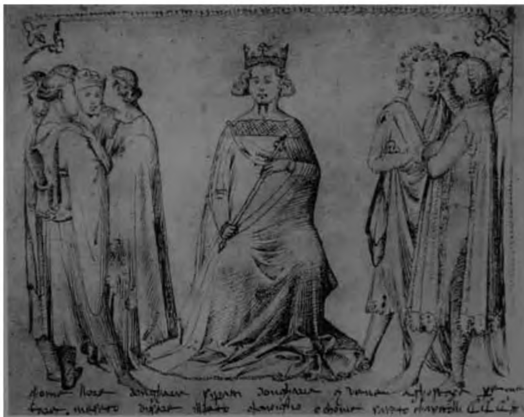
24. Неаполитанский король Владислав и его придворные. Миниатюра из хроники Биндино Чалли да Травале. Сиена, Государственный архив