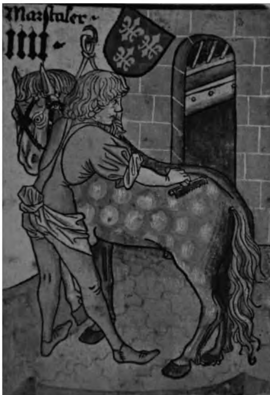
48. Конюх на королевской конюшне. Изображение на австрийских играль- ных картах. Сер. XV в.