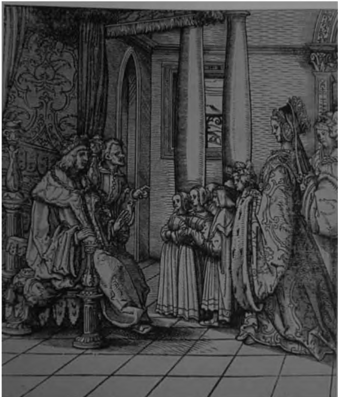
41. Ганс Бургмайр. Император Максимилиан I принимает свою дочь Маргариту и внуков. Гравюра на дереве. Будапешт, Музей изобразительных искусств