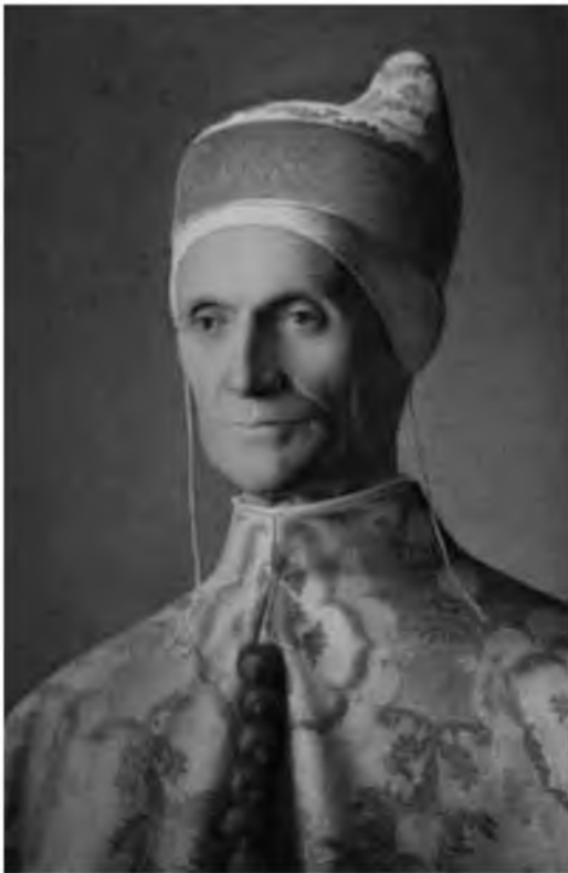
2. Портрет венецианского дожа Лоредана. Джованни Беллини. Конец XV в.