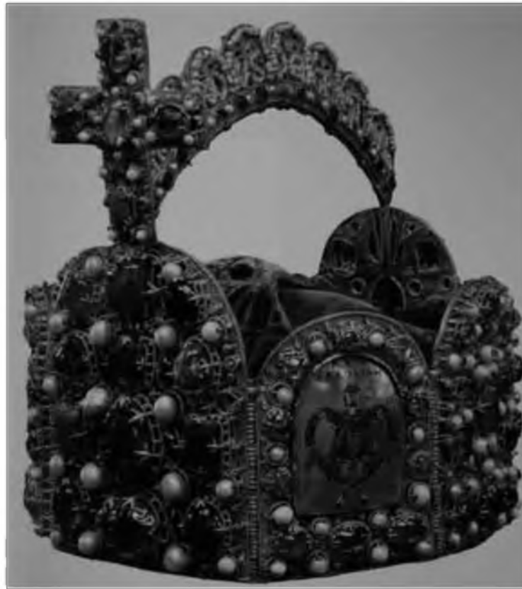
15. Императорская корона. Германия. Вторая пол. X – нач. XI в. Вена, Хофбург, Сокровищница