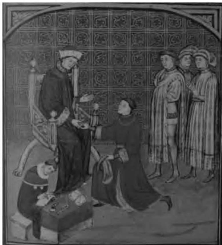
23. Король и его магистраты. Франция. Миниатюра из рукописи начала XV в.