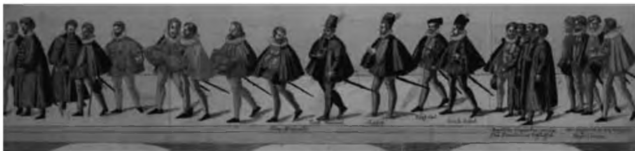
42. Пауль Цеендтнер фон Диллинген (Майер). Церемония принятия в орден Золотого руна в Праге в 1585 г. Фрагмент. Цветная гравюра. Мюнхен, Национальная библиотека