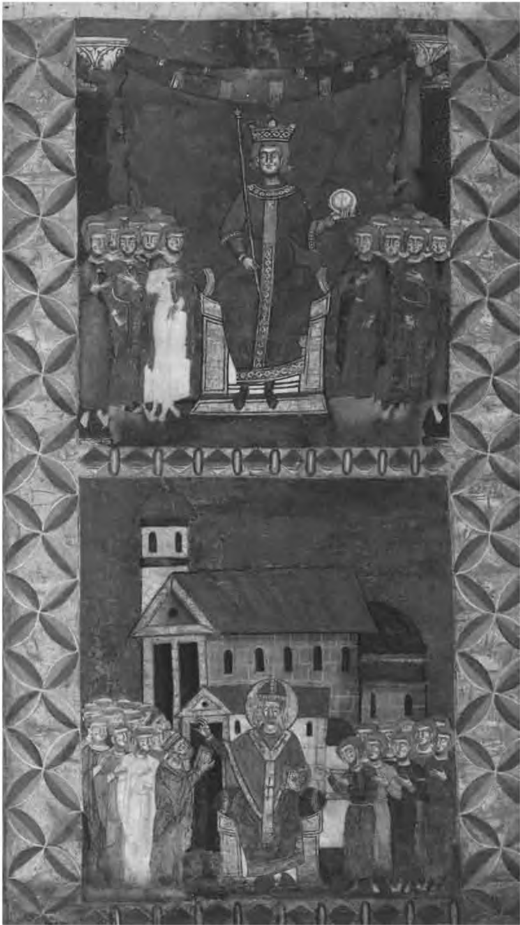
10. Духовная и светская власть. Литургический свиток Exultet. Сер. XIII в. Салерно. Архив соборного капитула