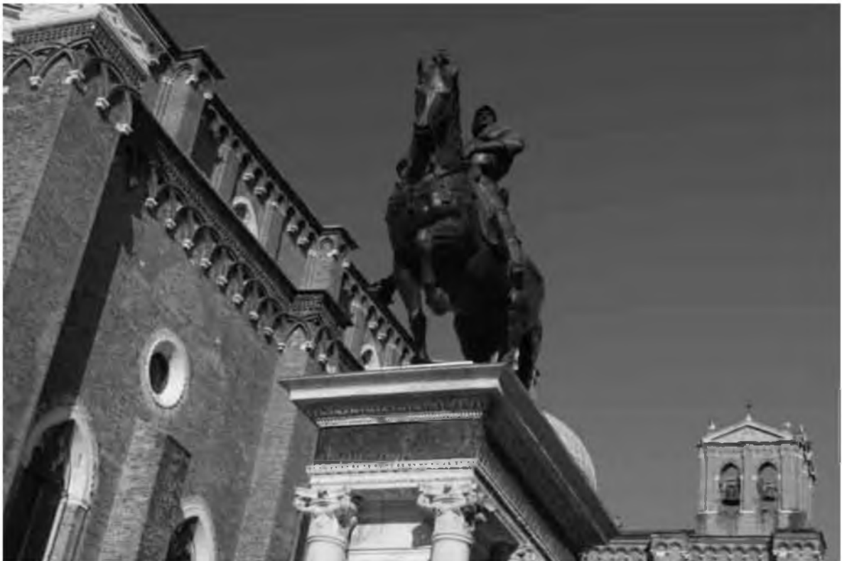
20. Верроккьо. Памятник Бартоломео Коллеоне, кондотьеру Венецианской республики. XV в., бронза. Венеция, площадь Санти Джованни э Паоло