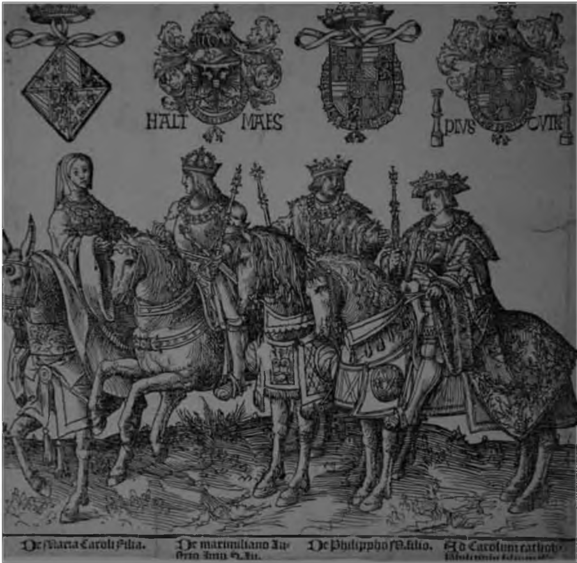
40. Якоб Корнелис ван Оостзанен. Мария Бургундская, Максимилиан Габсбург, Филипп Красивый и Карл Габсбург («Бургундские герцоги»). Гравюра на дереве