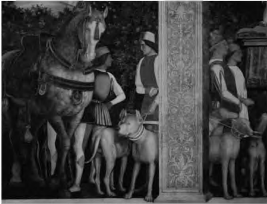
33. Андреа Мантенья. Возвращение с охоты. Фреска в Зале супругов (Камера дельи Спозии). 1473–1474. Мантуя, Герцогский дворец