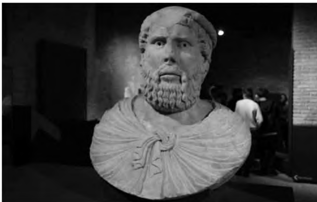
9. Бюст Петра Винейского, протонотария и логофета Сицилийского королевства в виде тогатуса. Фрагмент несохранившихся триумфальных ворот г. Капуя. 1230-е гг.