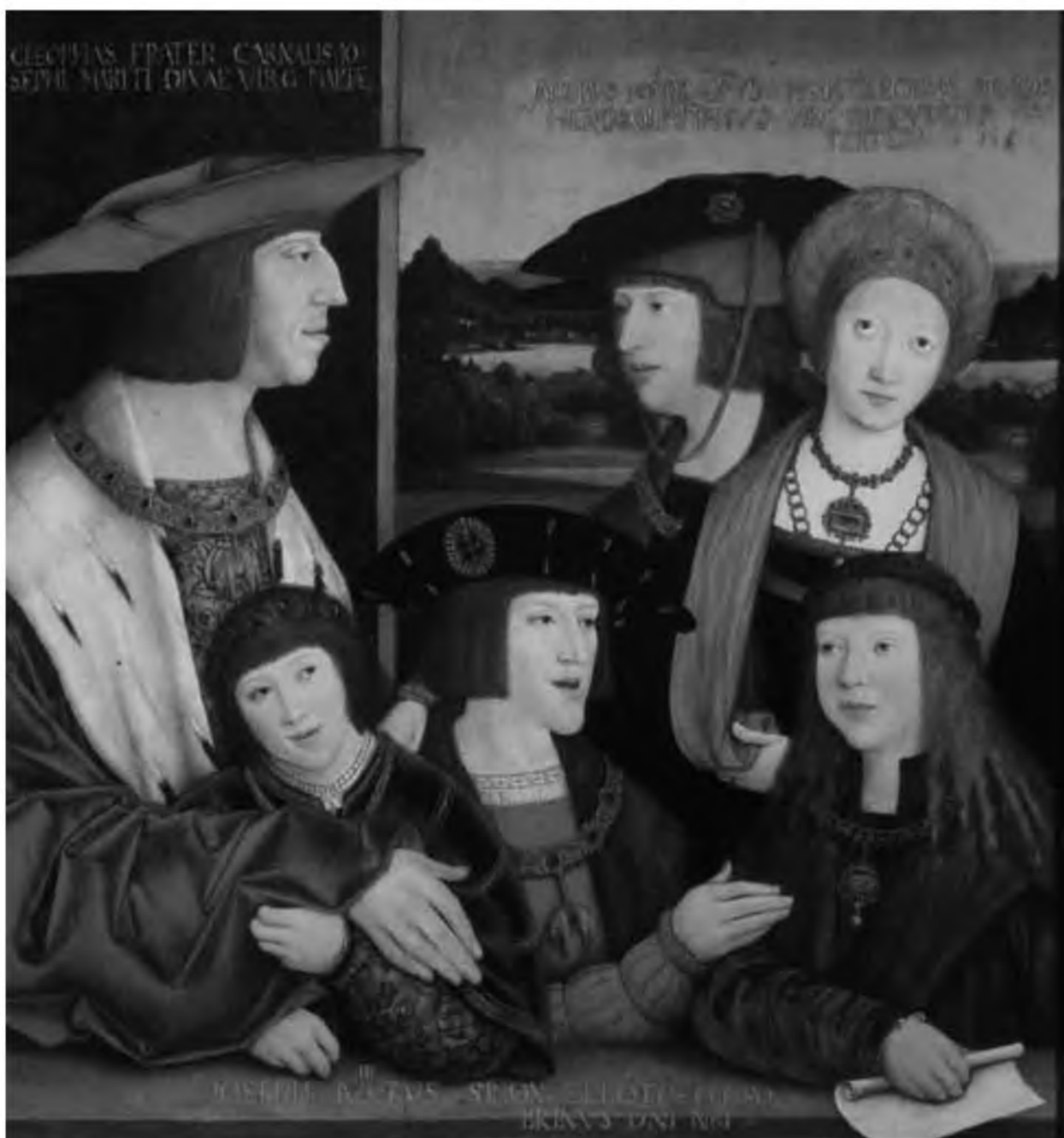
39. Неизвестный мастер. Император Максимилиан I Габсбург с внуками Фердинандом и Карлом, дочерью Маргаритой, сыном Филиппом Красивым и наследником венгерского престола Лайшем II, женихом внучки Максимилиана Марии. Вена, Музей истории искусств