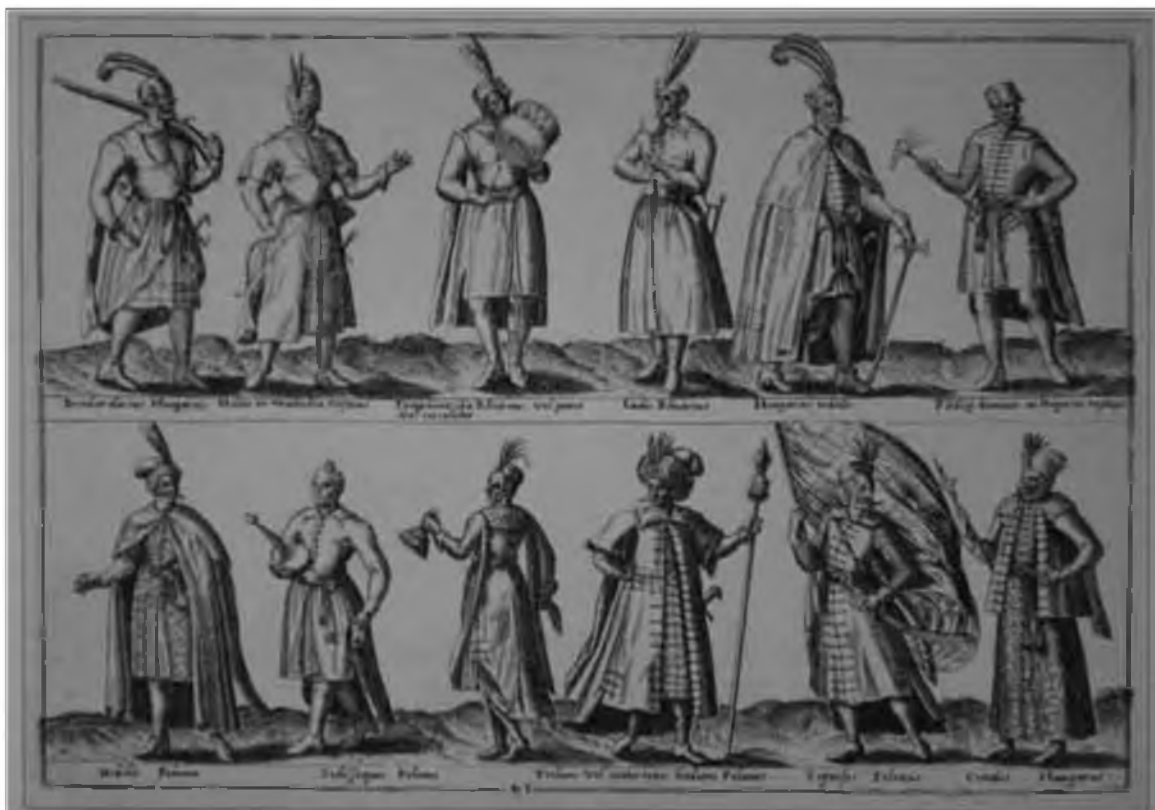
45 Венгерская знать. Гравюра XVI в. Будапешт, Венгерская Национальная галерея