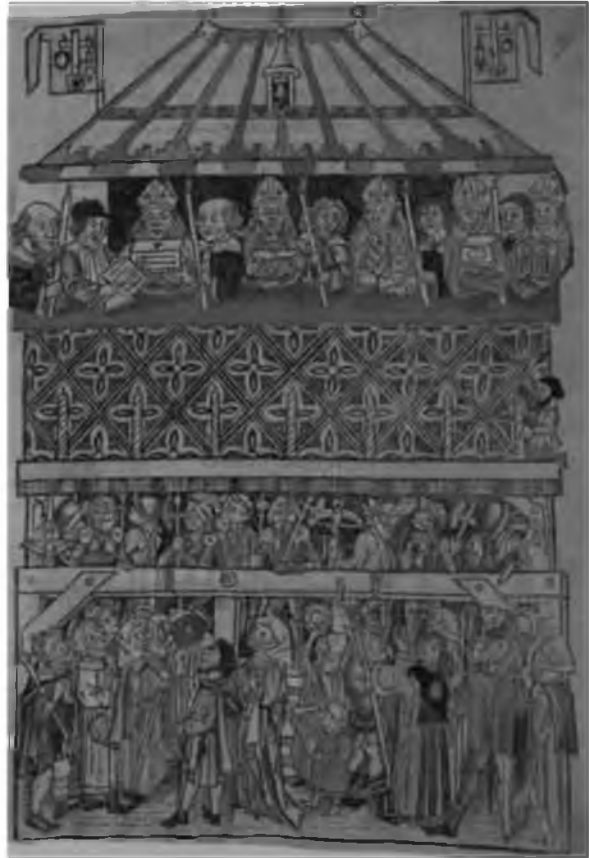
38. Демонстрация святынь верующим. Книжка о святынях 1487 г. Нюрнберг. Цветная гравюра