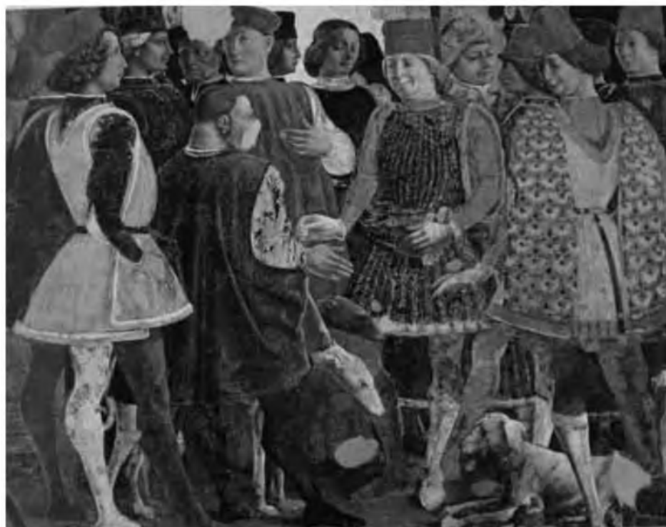
32. Франческо дель Косса. Сцена из придворной жизни. 1469–1470. Фреска. Феррара. Дворец Скифанойя