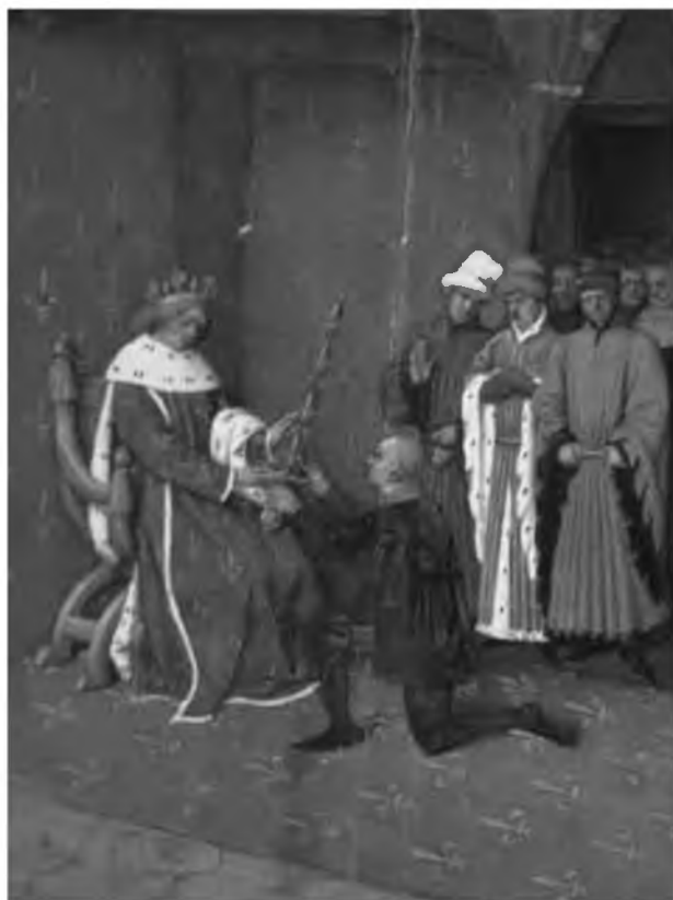
27. Карл V вручает меч коннетаблю Бертрану дю Геклену. Большие французские хроники. Миниатюра 1455–1460. Париж. Национальная библиотека Франции фр. 6465