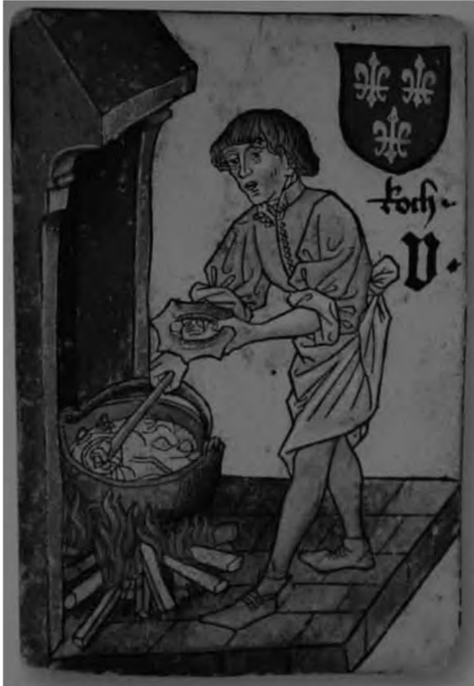
46. Придворный повар. Изображение на австрийских игральных картах. Сер. XV в.