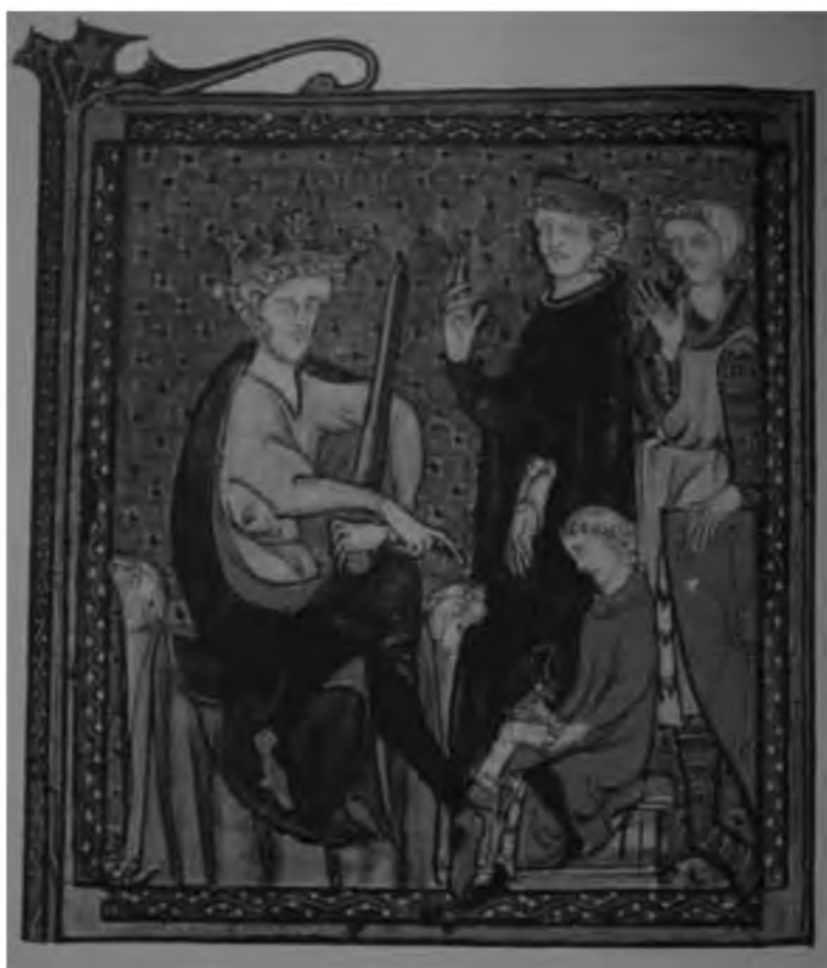
14. Король и его магистраты. Франция. Миниатюра из рукописи начала XIV в.