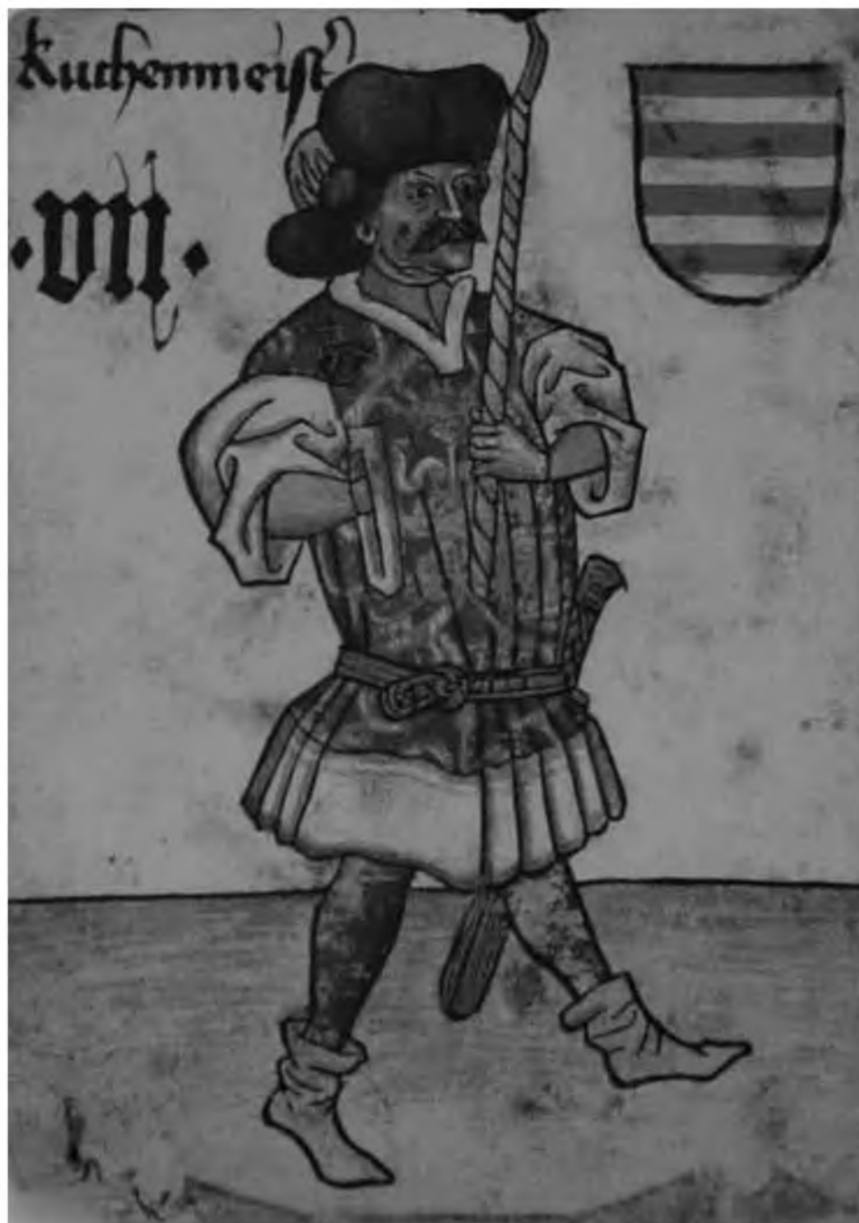
47. Главный придворный повар. Изображение на австрийских игральных картах. Сер. XV в.