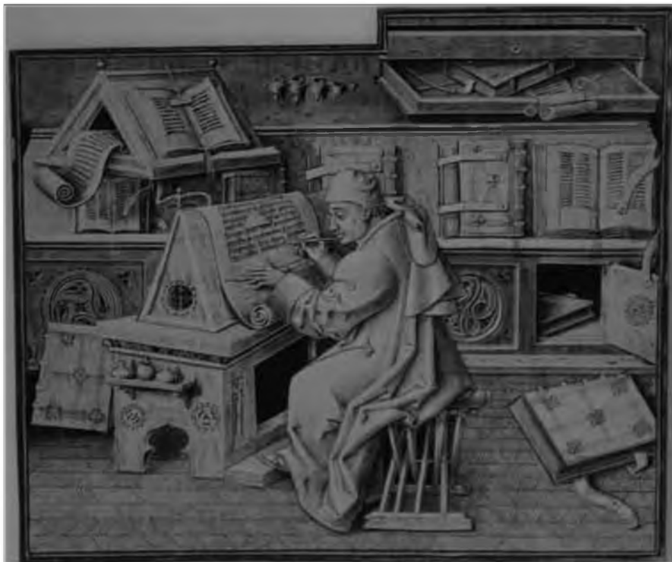
29. Жан Мьело, лилльский каноник и секретарь герцога бургундского Филиппа Доброго. Книжная миниатюра. XV в. Париж, Национальная библиотека