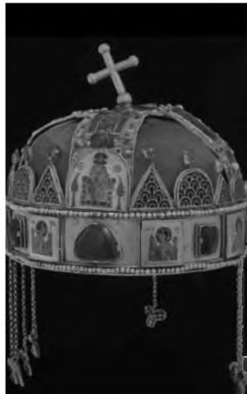
17. Корона Св. Иштвана. XI–XII вв. Будапешт, Парламент