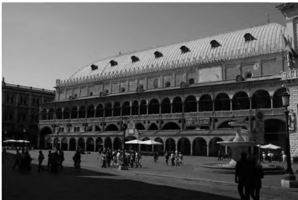
19. Падуя. Палаццо делла Раджоне. XIV в.