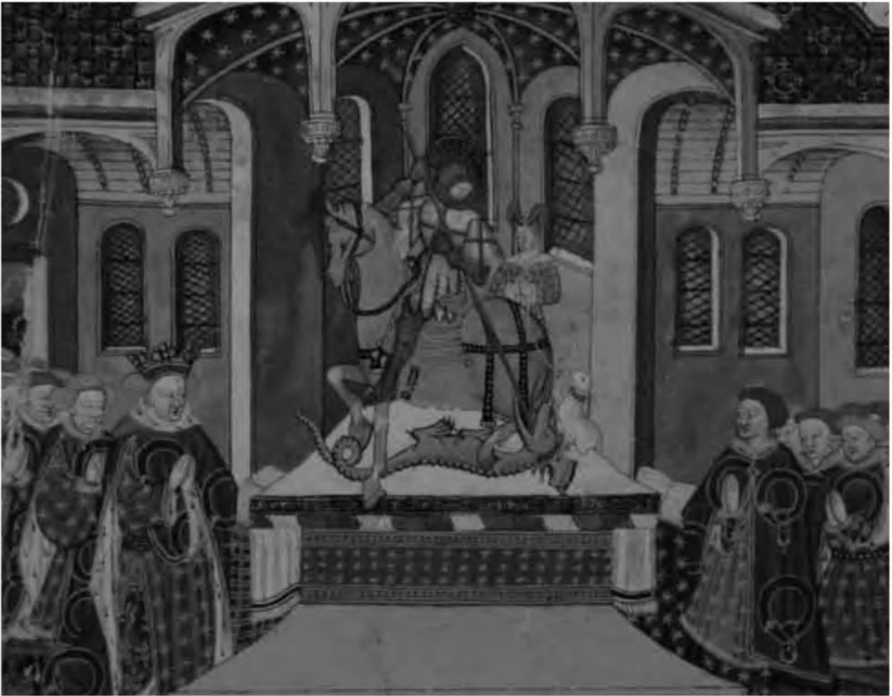
30. Английский король в облачении ордена Подвязки и его свита, преклоненные перед Св. Георгием. Миниатюра, XV в. Лондон. Британская библиотека