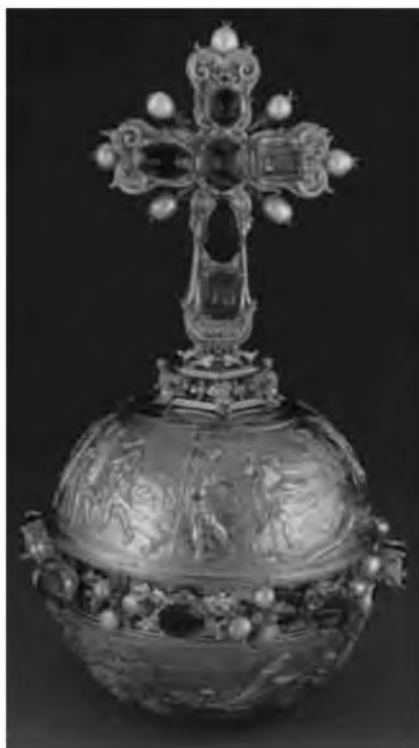
36. Держава короля Фердинанда I Габсбурга. Вторая четверть XVI в.