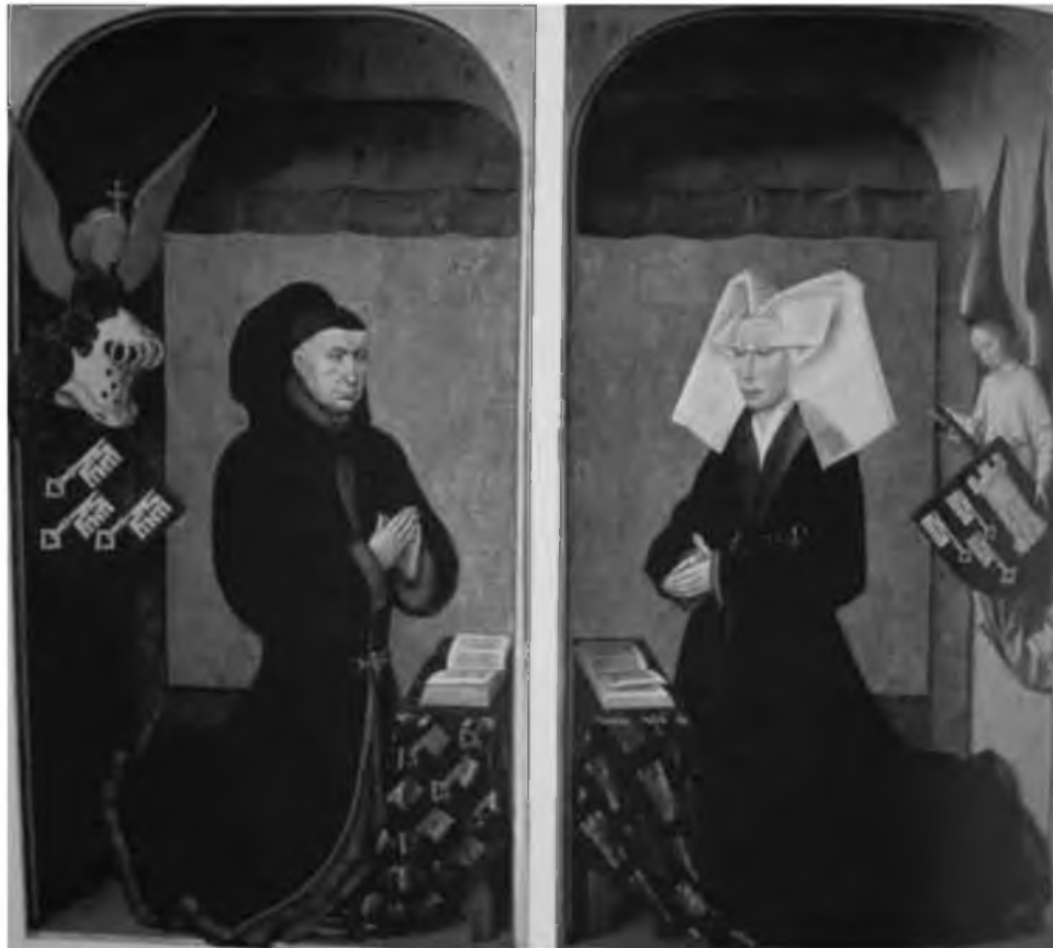
28. Канцлер Франции Николя Ролен с супругой. Рогир ван дер Вейден. Бон. Госпиталь