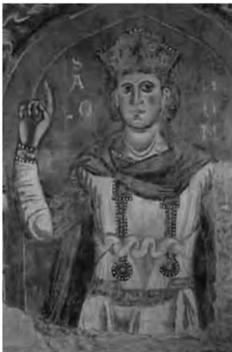
4. Царь Соломон, символ правосудия. Рим. Монастырь Четырех Мучеников. «Готический зал». Фреска. 1240-е гг. Фрагмент