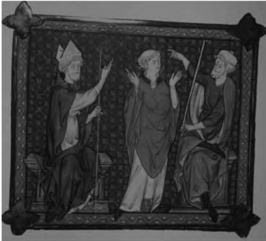
11. Спор духовной и светской власти по вопросу о юрисдикции в суде над духовенством. Миниатюра из французской рукописи XIV в.