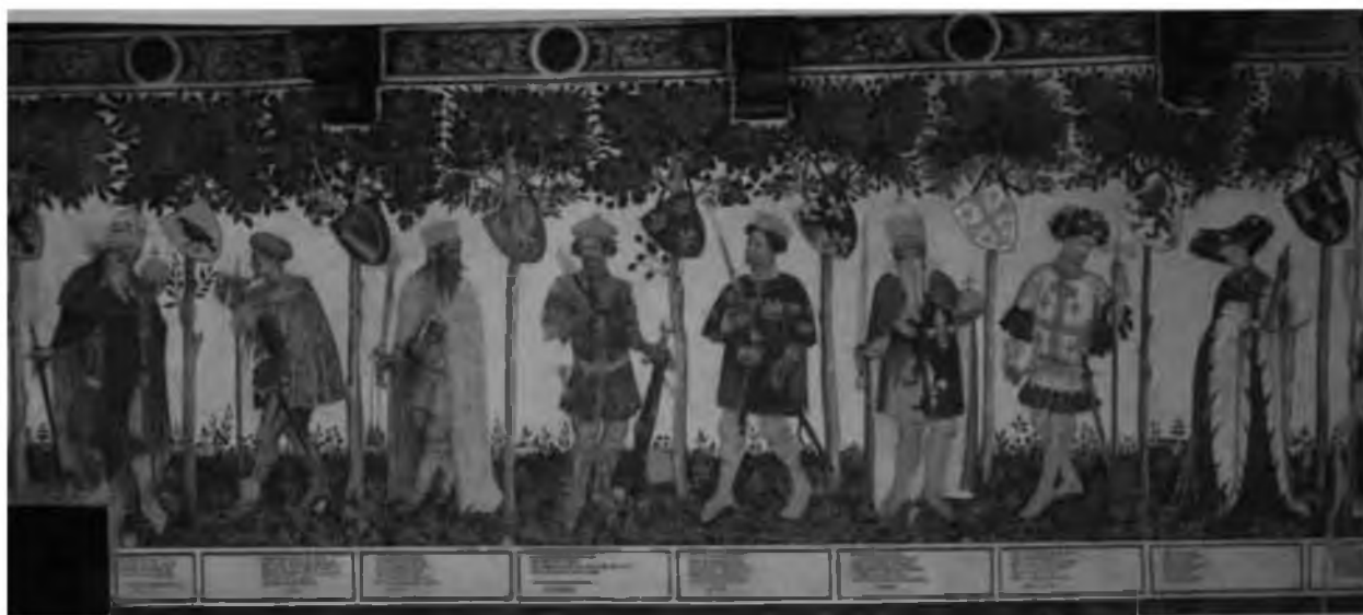
31. Мастер из Кастелло делла Манта. Знаменитые мужи и дамы с императором Сигизмундом в образе Юлия Цезаря. Фреска. XV в. Кастелло делла Манта (Пьемонт)