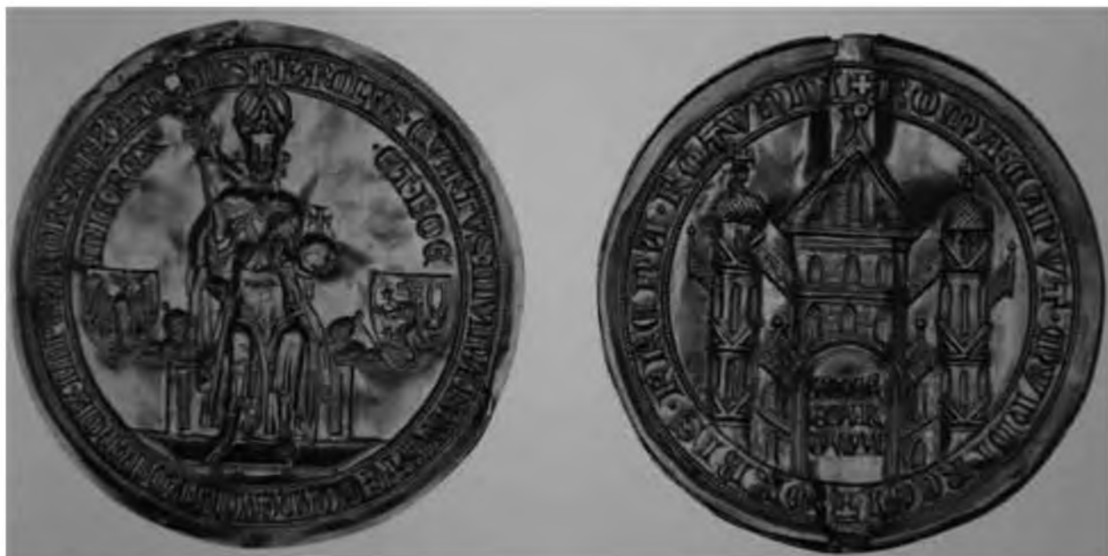
35. Золотая Булла императора Карла IV. 1355. Будапешт, Национальный музей