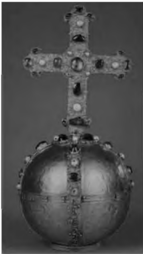
16. Держава императора Генриха VI. Конец XII в. Вена, Хофбург, Сокровищница