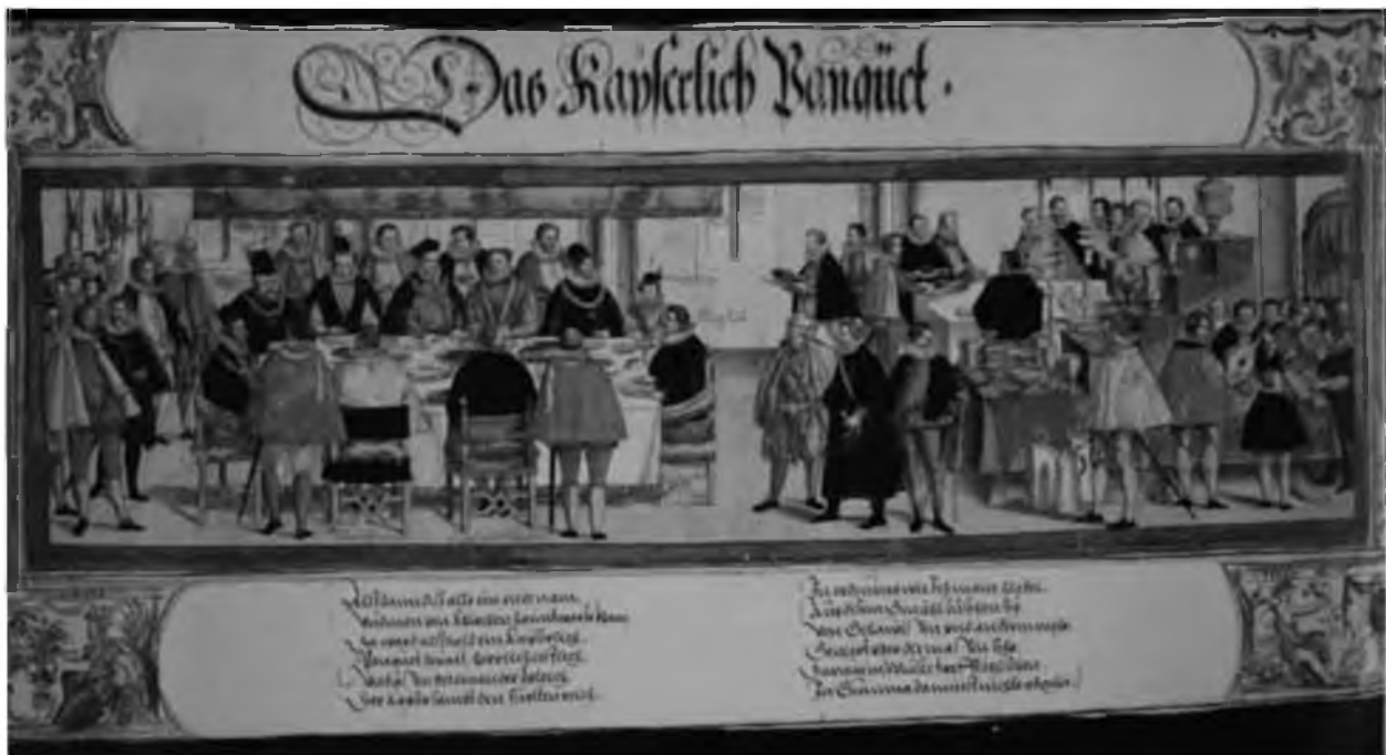
44. Императорский банкет в Праге в 1585 г.