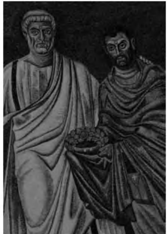
3. Св. Петр и Дамиан в виде позднеантичных сенаторов. Санти Козма э Дамиано на форуме. Рим. Мозаика апсиды. Фрагмент. Сер. VI в.