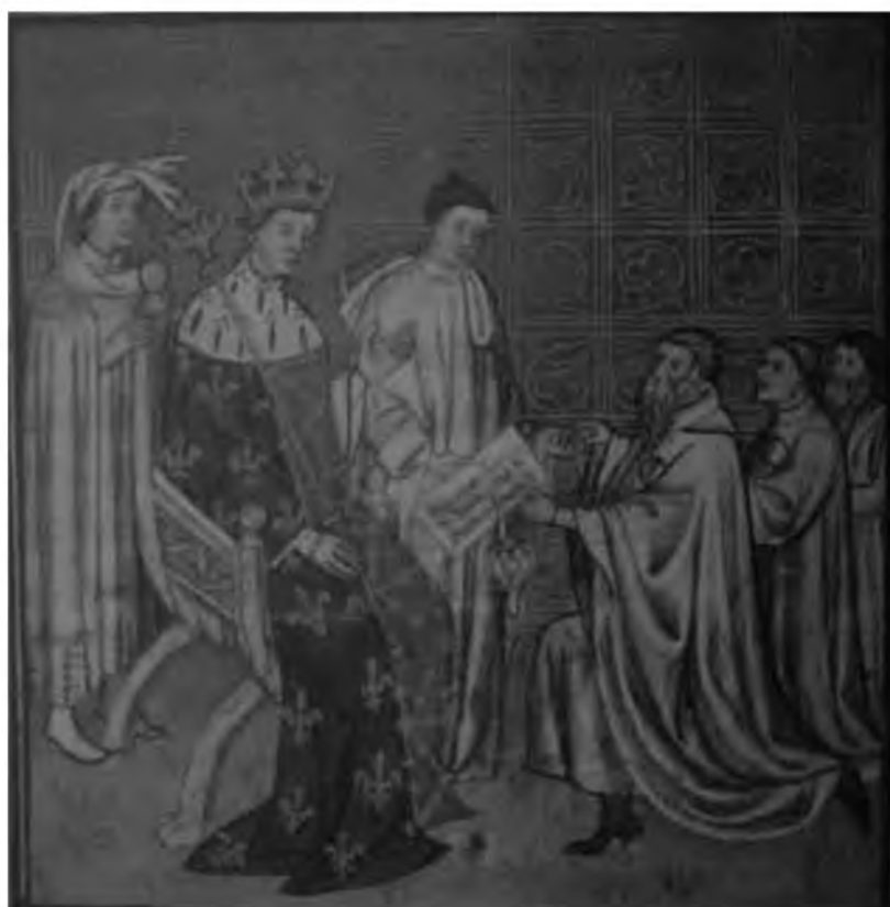
25. Король Карл VII в присутствии придворных дарует привилегии иудеям. Миниатюра из Больших французских хроник. XV в.