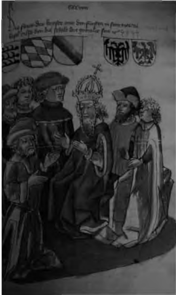
37. Германский император Сигизмунд на Базельском соборе 1433–34 гг. в окружении советников-курфюрстов. Миниатюра, XV в. Ирландия, частное собрание