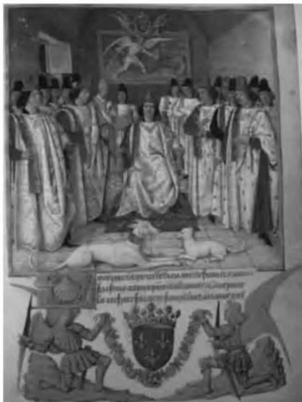
26. Людовик XI председательствует на капитуле ордена св. Михаила. Миниатюра Жана Фуке. Статуты ордена св. Михаила. 1469–1470. Париж. Национальная библиотека