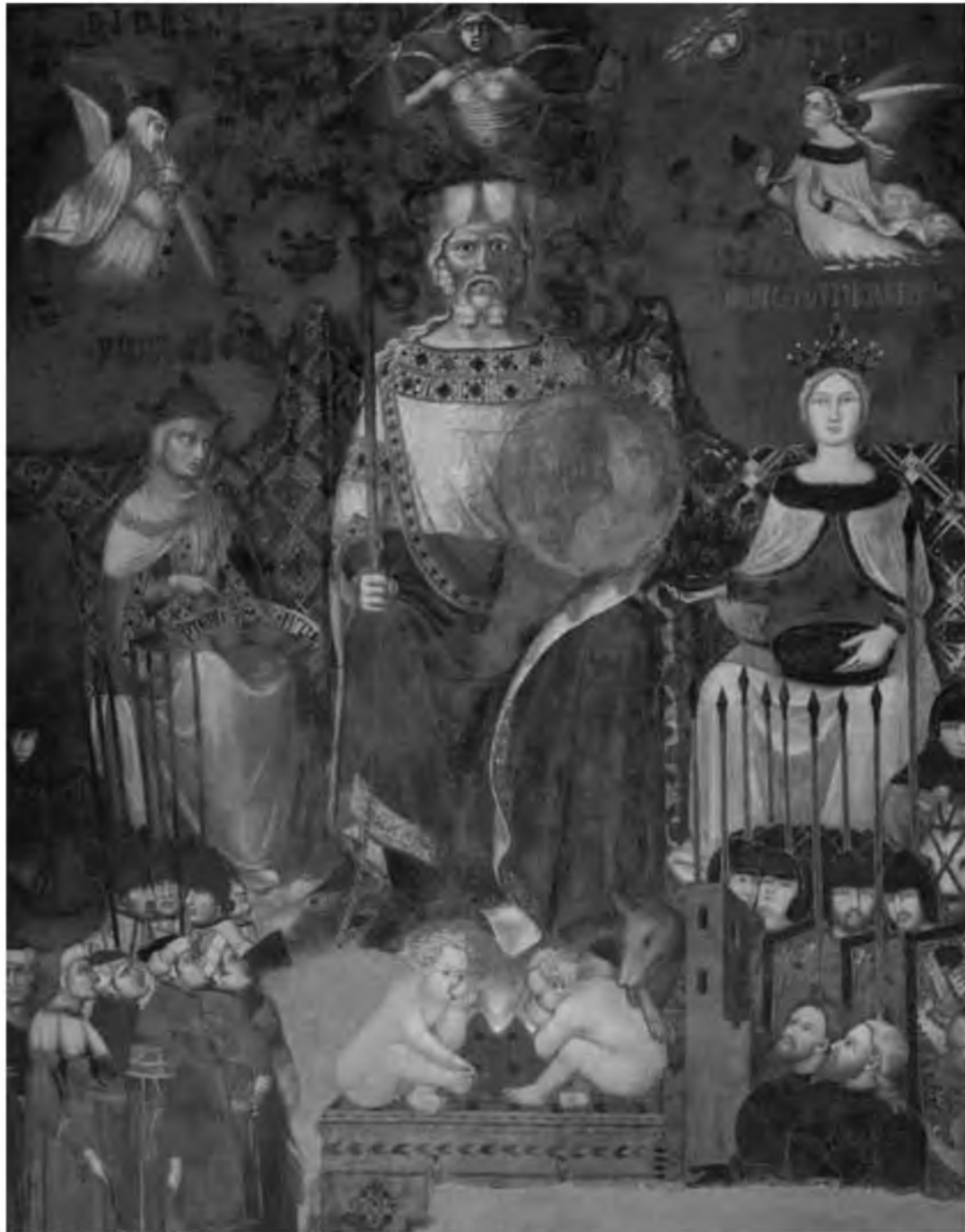
1. Аллегория доброго правления. Амброджо Лоренцетти. Сиена. Палаццо Пубблико. XIV в.