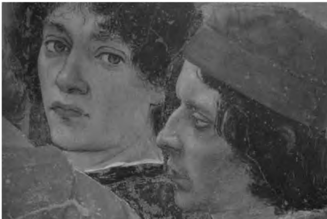
22. Флорентийские магистраты. Беноццо Гоццоли. Поклонение волхвов. Фрагмент. Сер. XV в.