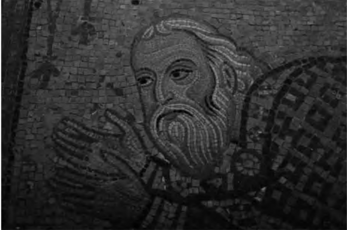
6. Георгий Антиохийский, адмирал Сицилийского королевства при Рожере II. Фрагмент византийской мозаики в церкви Санта Мария дель Аммиральо (Марторана). Палермо. Сер. XII в.