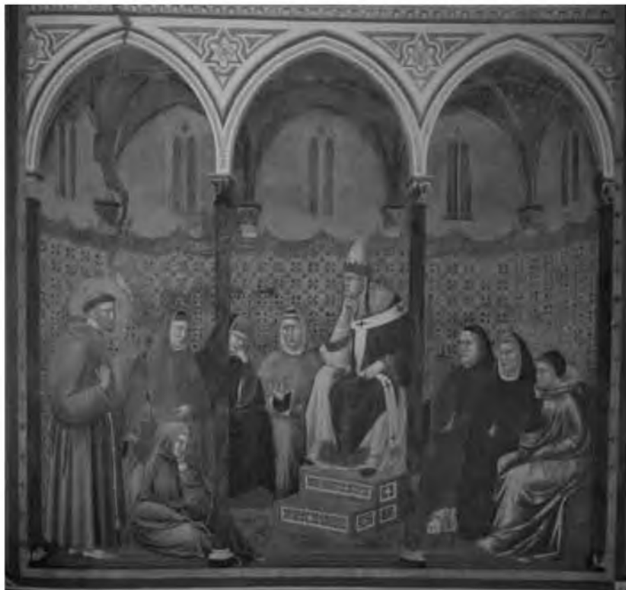
12. Римская курия. Мастерская Джотто. Фреска из цикла жития св. Франциска. Ассизи, верхняя базилика Сан Франческо. Начало XIV в.