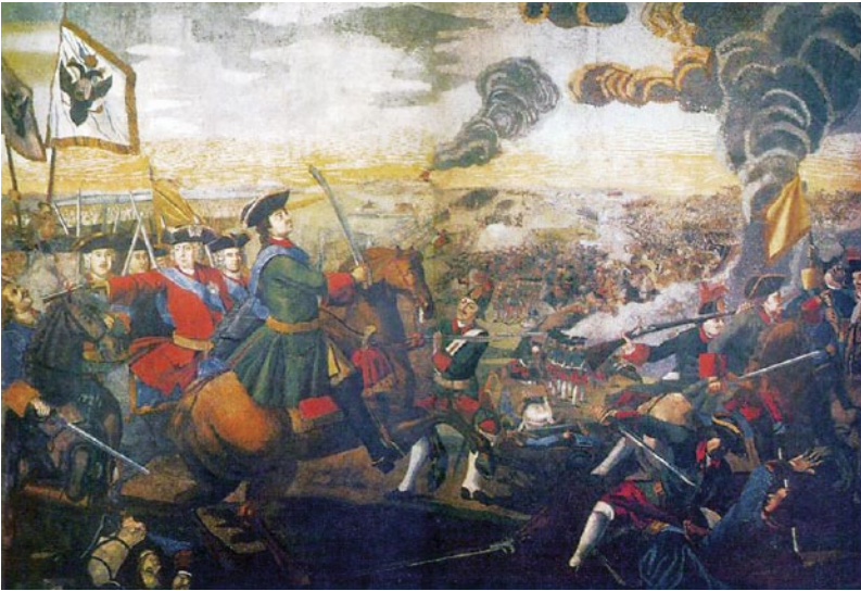
Мозаичное панно «Полтавская баталия». М. В. Ломоносов