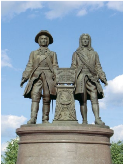
Памятник В.Н.Татищеву и В.И. де Геннину в городе Екатеринбурге

опыт и практику Василия Никитича. Несколько миллионов мальчишек, особенно оставшихся без родителей, прошли обучение в ремесленных училищах. Позже это поколение дало десятки тысяч блестящих инженеров, специалистов-гуманитариев, ставших гордостью Отечества. Ярким примером этого является первый в мире космонавт Юрий Алексеевич Гагарин.