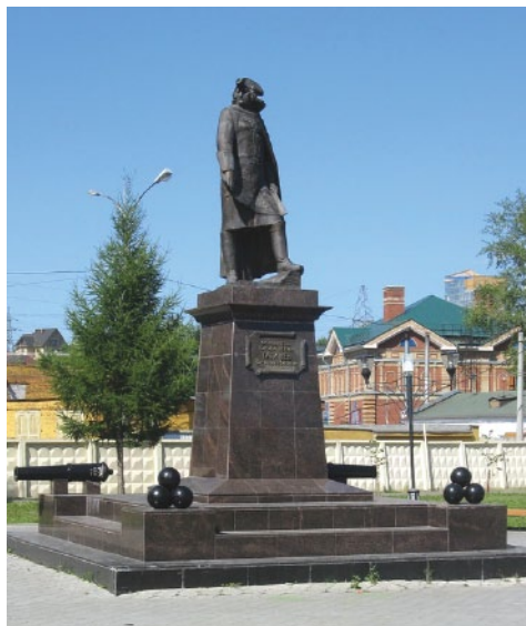
Памятник В. Н. Татищеву в городе Перми