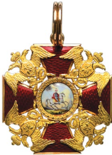
Орден Святого Александра Невского