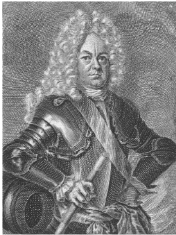
Портрет Я. В. Брюса

Второй пример — из истории Великой Отечественной войны (1941–1945 гг.), когда гитлеровцы покупали стратегические материалы в нейтральной Швеции. Их транспорты регулярно ходили по шведским секретным фарватерам, разведать которые было практически невозможно. В те годы послом СССР в Стокгольме была Александра Коллонтай. Она блестяще знала биографию и работы Татищева. Вспомнила о деятельности Василия Никитича в Швеции и посоветовала поискать в архивах его рапорты и другие документы. Документы нашли! Оказалось, что ещё в 1725 году Татищев добыл секретные лоции, Табель Стокгольмского порта и его окрестностей. По этим лоциям наши подводники точно рассчитали координаты атак на вражеские корабли.