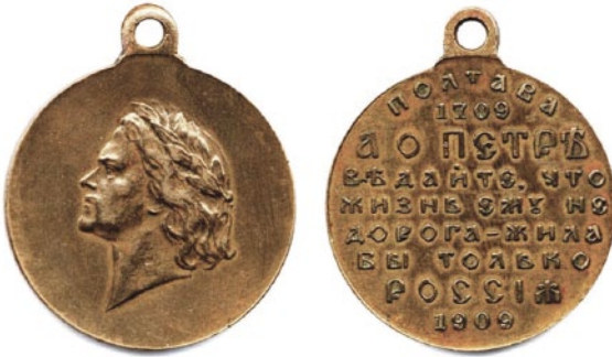
Медаль в честь Полтавской победы