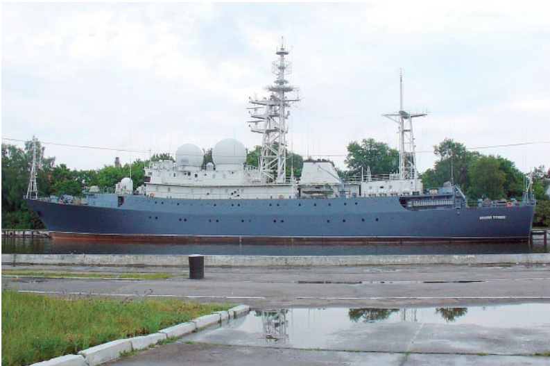
Корабль радиоразведки Краснознаменного Балтийского флота «Василий Татищев»