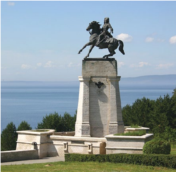
Памятник В. Н. Татищеву в городе Тольятти. Скульптор А. Рукавишников

• Именем В. Н. Татищева названы улицы в Астрахани, Екатеринбурге. Мемориальные доски и бюсты Татищева украшают музеи и административные здания Казани, Саратова, Самары, Астрахани, Тольятти, многих городов Урала.