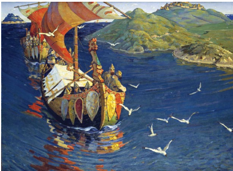
Иллюстрация с картины Н. К. Рериха «Заморские гости»