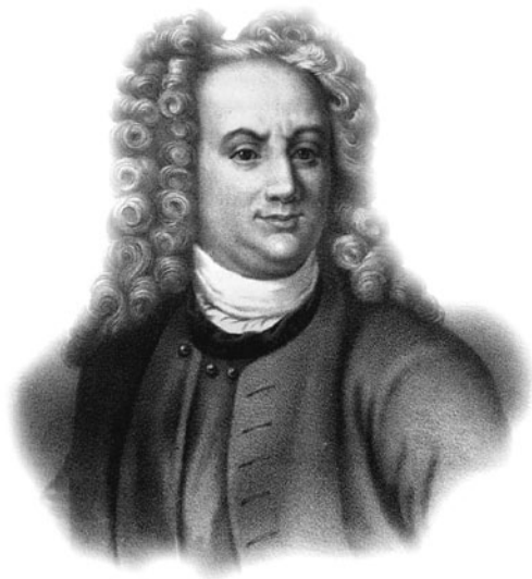
Василий Никитич Татищев (1686–1750 гг.)