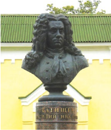
Памятник Татищеву в г. Солнечногорске