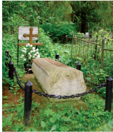
Надгробный памятник В. Н. Татищеву