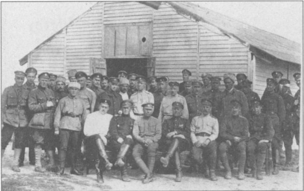
Русская армия в Галлиполи