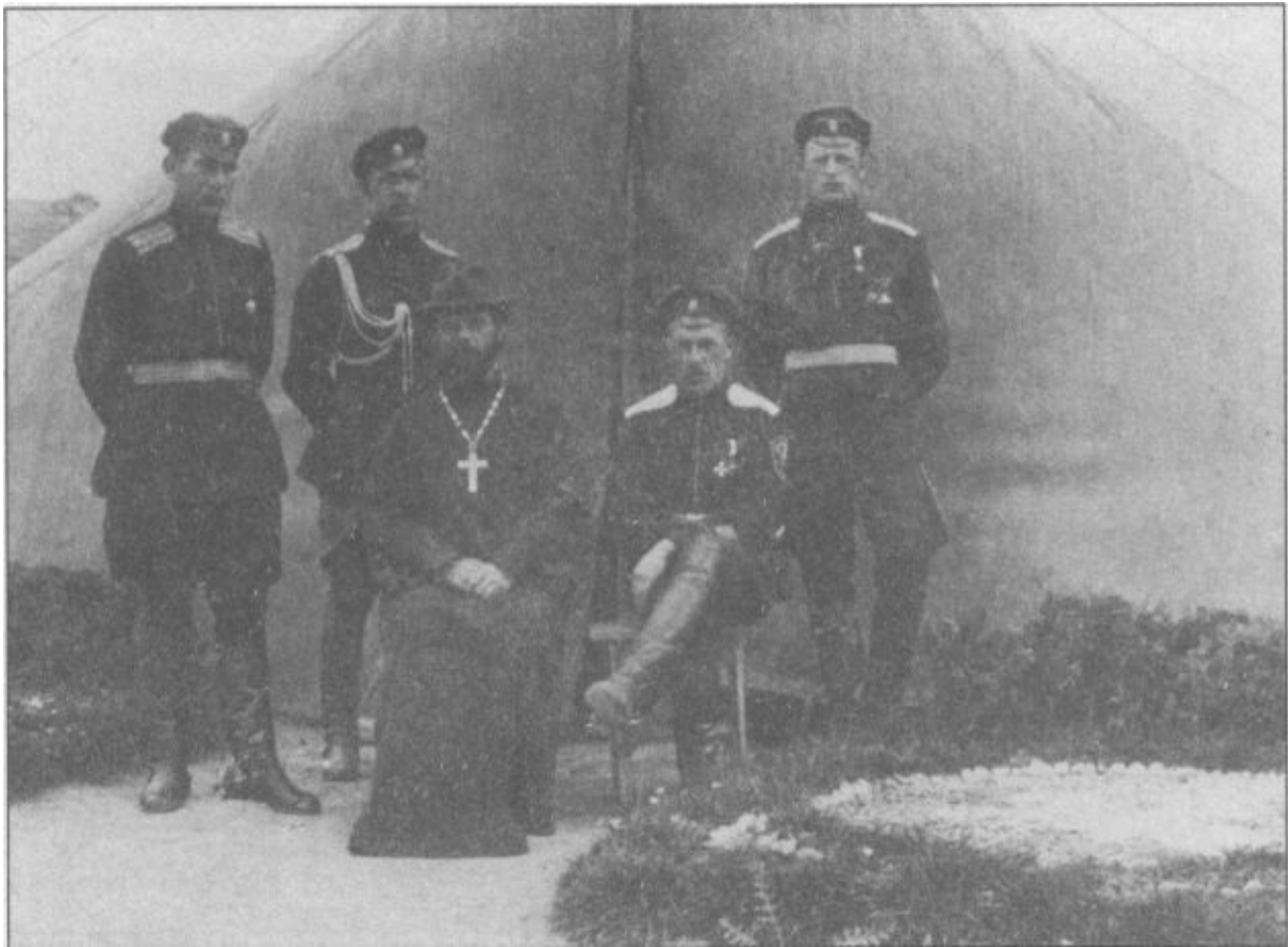
Корниловцы в Галлиполи