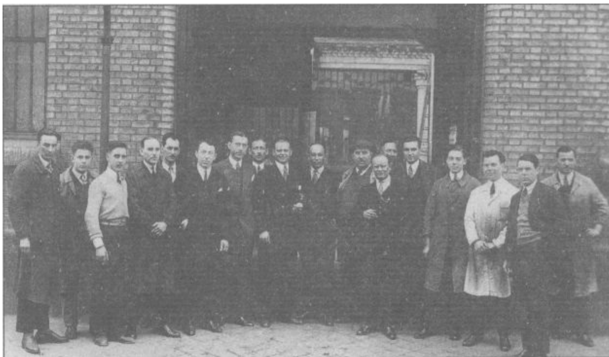
Военнослужащие Алексеевского полка во Франции