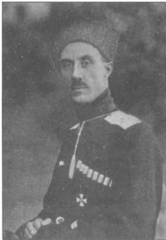
П. Н. Врангель