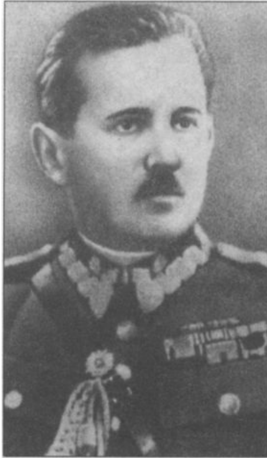
С.Н. Булак- Балахович