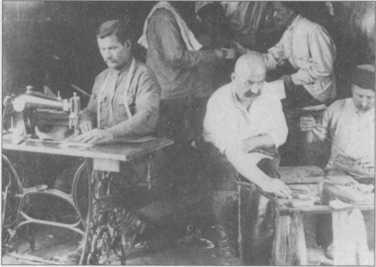
Русская армия на Балканах