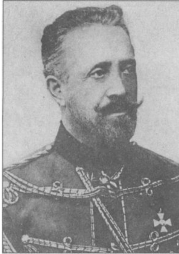
Великий Князь Николай Николаевич