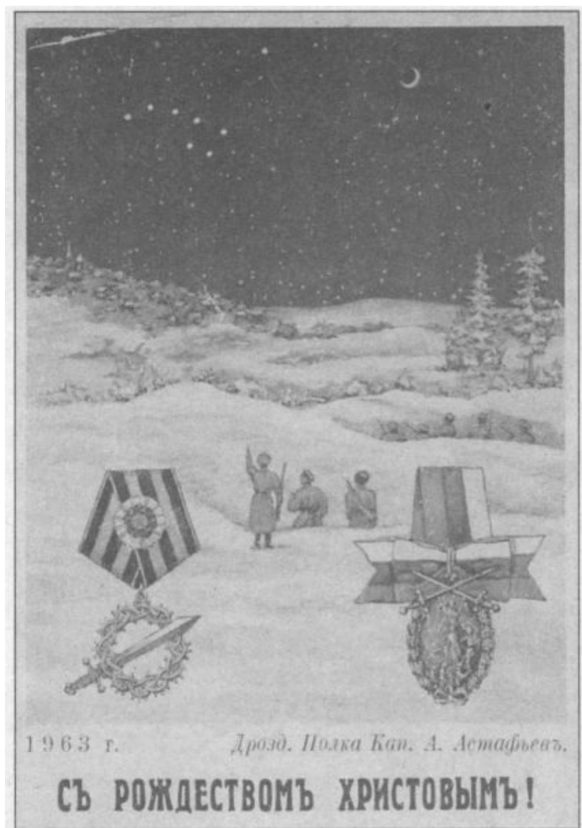
Рождественская открытка Дроздовского полка. 1963 г