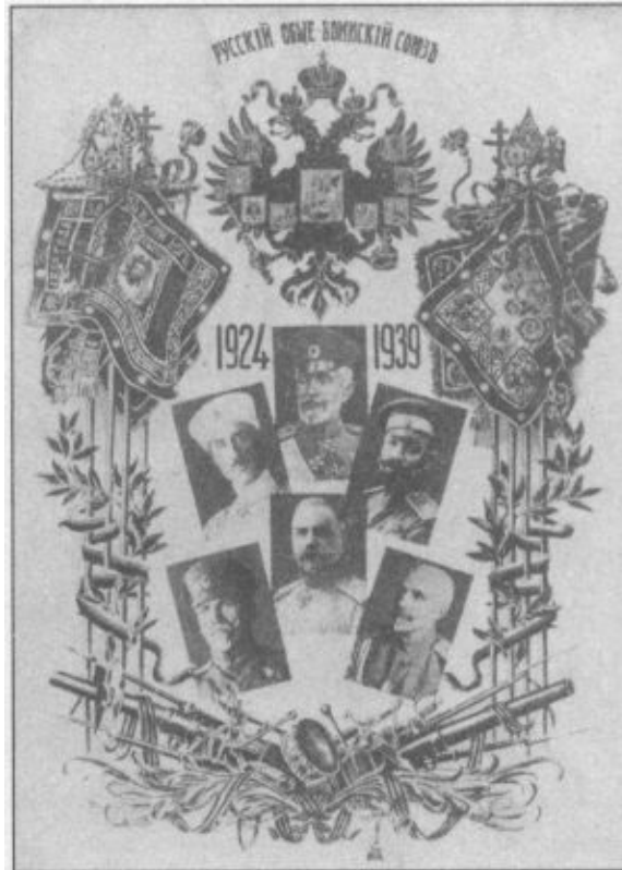
Плакат Русского общевоеинского союза (РОВС). 1939 г.