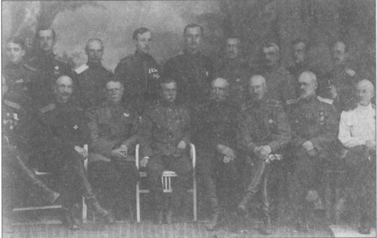
Дроздовцы после Галлиполи