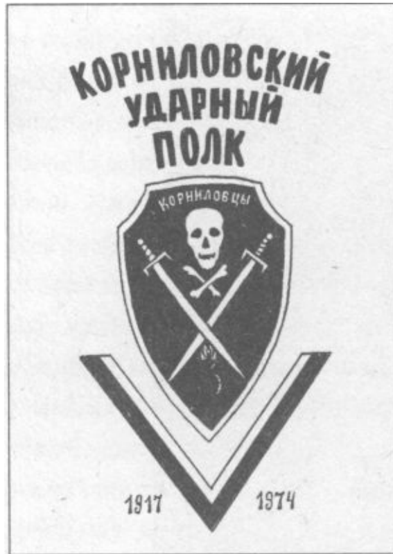
Обложка книги «Корниловский Ударный полк»