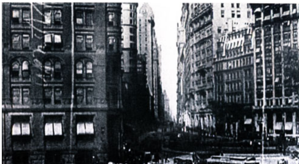
Нью-Йорк. Нижний Бродвей