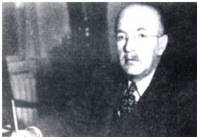
Гарри Декстер Уайт