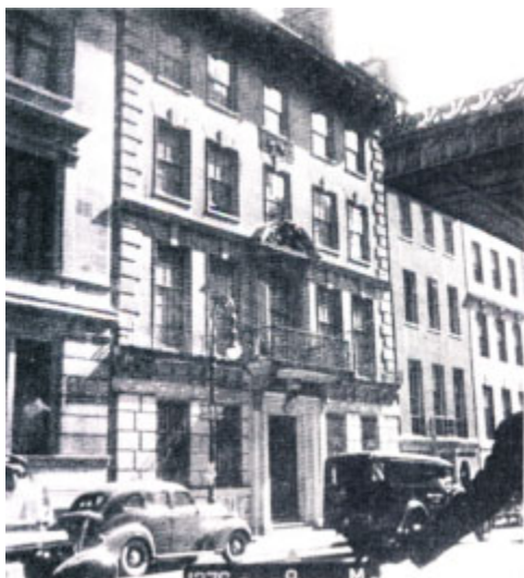
Нью-Йорк. Генеральное консульство СССР, д. 7 на 61-й Восточной улице