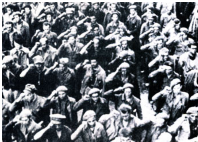
Бойцы интернациональной бригады в Испании