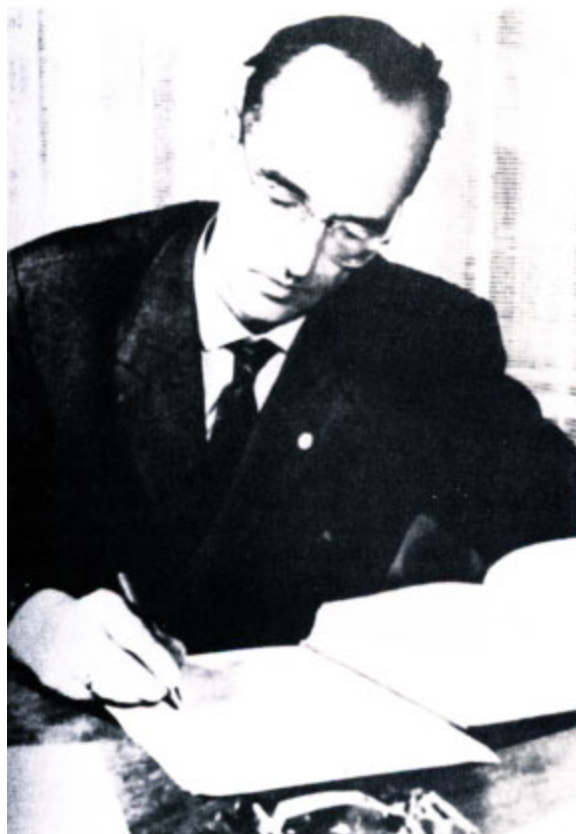
Клаус Фукс в тюрьме