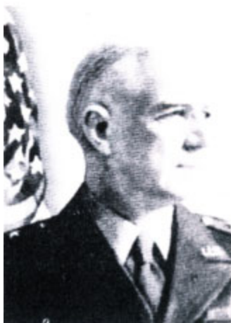
Уильям Донован — генерал