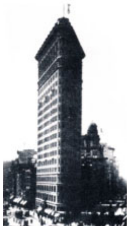
Небоскреб «Утюг» в Нью-Йорке