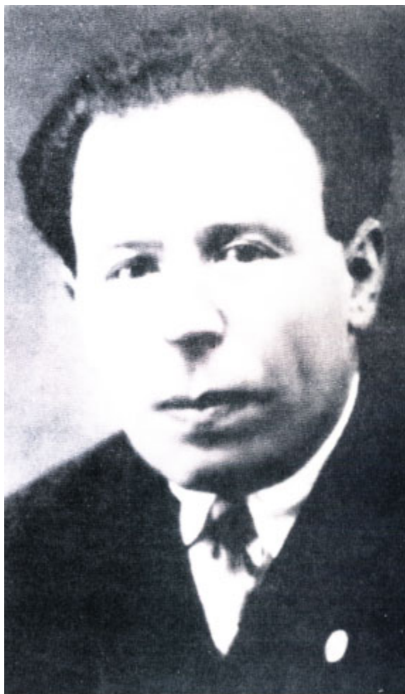
Яков Голос. 1938 г.