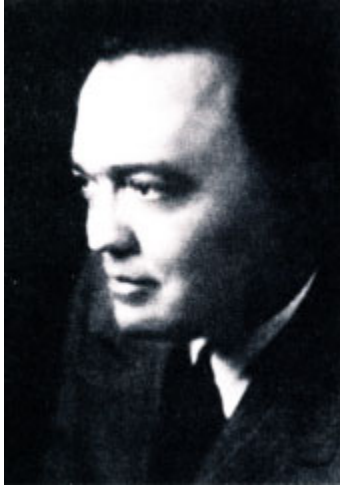
Шеф ФБР Джон Эдгар Гувер