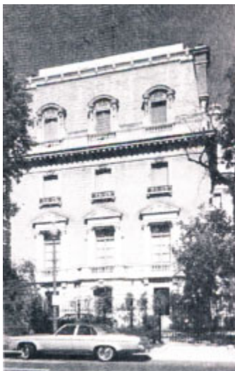
Вашингтон. Здание посольства России-СССР