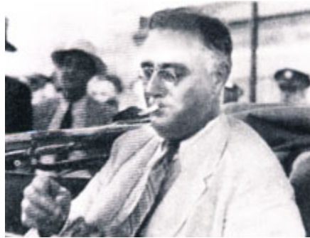
Президент США Франклин Делано Рузвельт