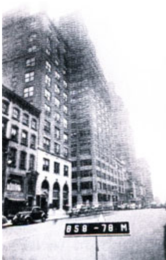
Нью-Йорк. Здание «Амторга» на Пятой авеню